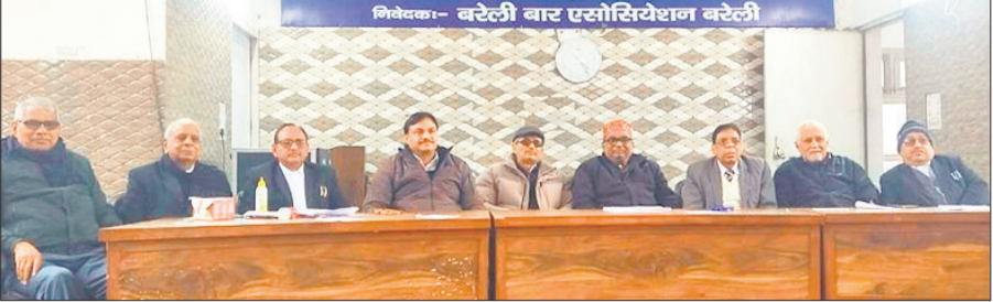
बार एसोसिएशन के चुनाव के संबंध में जानकारी देते चुनाव अधिकारी।

कचहरी स्थित बार सभागार में शनिवार को आयोजित प्रेसवार्ता में चुनाव मण्डल ने बताया कि द्विवार्षिक चुनाव में कुल 2736 अधिवक्ता मतदाता मत का प्रयोग करेंगे। जिसमें लगभग 500 महिला अधिवक्ता हैं। कुल 80 प्रत्याशी चुनाव में भाग ले रहे हैं, जिसमें से 21 प्रत्याशी पदानुसार चुने जायेंगे। 5 जनवरी को सुबह 10 से दोपहर 1.30 बजे