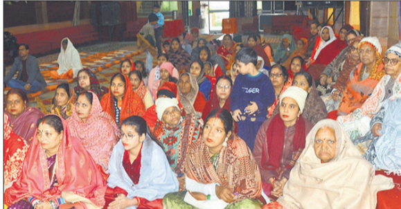
कथा में बड़ी संख्या में श्रद्धालुओं ने भाग लिया।

उन्होंने समझाया कि मच्छर बाहर से काटता है, जबकि मत्स्य यानी ईर्ष्या मनुष्य को भीतर से खोखला कर देती है। भौतिक साधनों से मच्छर से तो बचा जा सकता है, लेकिन मत्स्य से बचने के लिए धर्माचरण, सत्य और भगवान की भक्ति आवश्यक है। माघ मास के महत्व पर प्रकाश डालते हुए उन्होंने कहा कि इस पावन काल में दान, परोपकार और