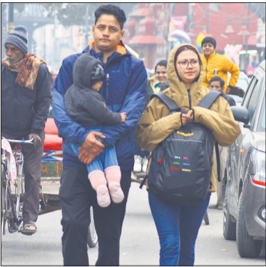
गर्म कपड़ों में पैक होकर घर से बाहर निकले लोग।

प्रदेश में मुजफ्फरनगर के बाद बरेली का दिन सबसे ठंडा रहा। मुजफ्फरनगर में अधिकतम तापमान 14 डिग्री सेल्सियस रिकॉर्ड किया गया। शीतलहर का असर पूरे दिन साफ दिखाई दिया। सुबह के समय कोहरा छाने से दृश्यता कम रही। लोग अलाव