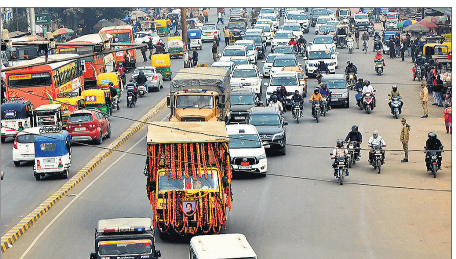
बरेली से फरीदपुर के लिए जाती फरीदपुर विधायक डॉ. श्याम बिहारी की अंतिम यात्रा। ● अमृत विचार

बरेली, अमृत विचार : दिवंगत विधायक डॉ. श्याम बिहारी लाल की अंतिम यात्रा राजकीय सम्मान के साथ बरेली से फरीदपुर तक निकाली गयी। श्याम बिहारी के पार्थिव देह को लेकर जा रहे स्वर्गधाम के पीछे पुलिस प्रशासनिक अफसरों के साथ जनप्रतिनिधियों और कार्यकर्ताओं की गाड़ियों का लंबा काफिला चला। फरीदपुर तक कई जगह समर्थकों ने स्वर्गधाम वाहन रुकवाकर पुष्पांजलि अर्पित कर डॉ. श्याम बिहारी को नमन किया। शक्ति नगर कॉलोनी स्थित आवास पर पहुंचे मुख्यमंत्री योगी आदित्यनाथ ने जनप्रतिनिधियों से फरीदपुर में अंतिम संस्कार की व्यवस्थाओं के संबंध में जानकारी ली। श्रद्धांजलि देने के बाद मुख्यमंत्री ने परिजनों से बातचीत कर डीएम को पूछा, लेकिन