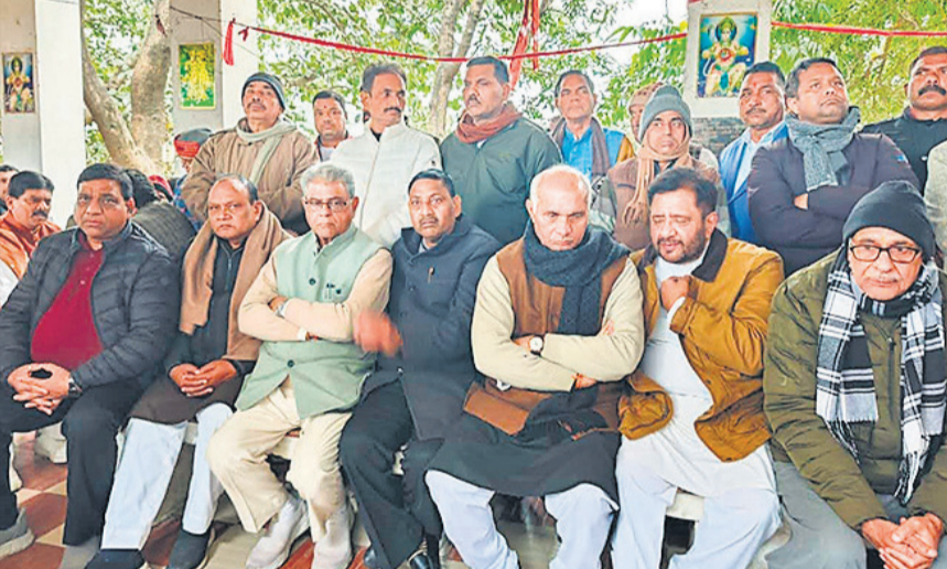
फरीदपुर में श्मशान भूमि पर मौजूद मंत्री, सांसद व जनप्रतिनिधि। ● अमृत विचार