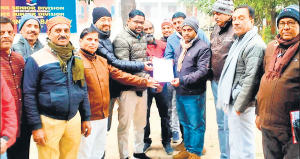
जिला सह संयोजक को मनोनय पत्र सौंपते पदाधिकारी।