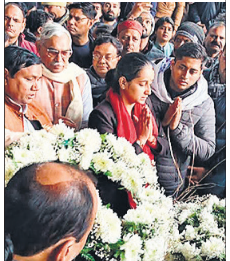
पिता को प्रणाम करती बेटे। ● अमृत विचार