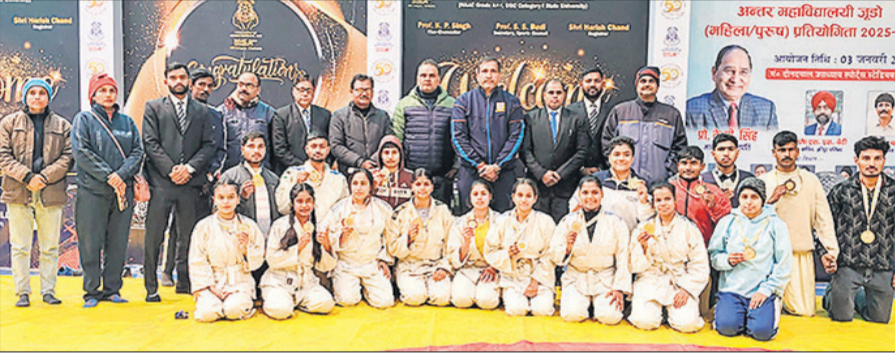
मेडल के साथ विजेता खिलाड़ी, साथ में शिक्षक, कोच व अन्य।

गिरावट दर्ज की जा सकती है। इस दौरान न्यूनतम तापमान 6 से 8 डिग्री और अधिकतम तापमान 13 से 15 डिग्री सेल्सियस के बीच रहने का अनुमान है। फिलहाल, ठंड में लगातार इजाफा हो रहा है। राहत मिलती नहीं दिख रही है।