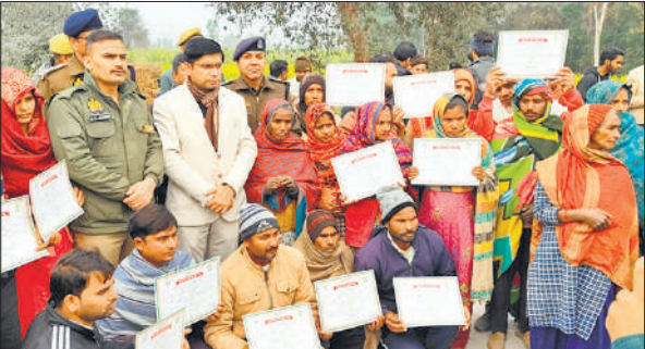
डीएम और एसपी के साथ सरकारी जमीन पर पट्टे के कागज दिखाते लोग।

बनाई गई अवैध मस्जिद को ध्वस्त करने के आदेश जारी किए थे। मस्जिद को तोड़ने के लिए 4 जनवरी रविवार का दिन तय किया गया था। सुबह 10 बजे पुलिस प्रशासनिक अमला बुलडोजर के साथ मौके पर पहुंचा तब देखा कि जमीन खाली थी और मस्जिद का निर्माण तोड़ लिया गया था। ज्यादातर मलवा भी रात में ही हटा दिया गया था। मुस्लिम समुदाय के लोगों ने अधिकारियों को बताया कि उन्होंने खुद ही रात को मस्जिद का निर्माण तोड़ लिया और मलवा भी हटा दिया।