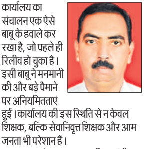
कार्यालय का संचालन एक ऐसे बाबू के हवाले कर रखा है, जो पहले ही रिलीव हो चुका है। इसी बाबू ने मनमानी की और बड़े पैमाने पर अनियमितताएं हुईं।