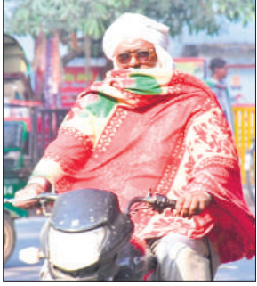
दोपहर में हल्की धूप में यू निकले लोग।

अमृत विचार : शहर में रविवार को मौसम ने कुछ राहत तो दी, लेकिन ठंडी हवा के कारण ठिठुरन का अहसास दिन भर बना रहा। बीते दिनों से छापे कोहरे और बादलों के बीच रविवार को जब सूर्यदेव के दर्शन हुए तो लोगों ने राहत की सांस ली। हालांकि धूप निकलने के बावजूद पछुआ हवा के चलने से सर्दी का असर कम नहीं हुआ। मौसम विभाग के अनुसार दिन का अधिकतम तापमान 16 डिग्री सेल्सियस और न्यूनतम तापमान 10 डिग्री सेल्सियस दर्ज किया गया। सुबह के समय कोहरा और सर्द हवा ने लोगों की मुश्किलें बढ़ाईं।