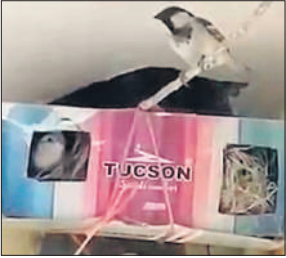
बरामदे में चिड़ियों के लिए बना घोंसला।