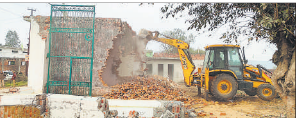
संभल के सलेमपुर सलार गांव में मदरसा परिसर में बनी दुकानों को तोड़ता बुलडोजर।

सलेमपुर सलार उर्फ हाजीपुर गांव में जहां सरकारी जमीन पर बनी मदीना मस्जिद के ध्वस्तीकरण का आदेश जारी किया था, वहीं गांव में बने मदरसे को लेकर भी ऐसा ही आदेश जारी किया था। मुख्य मार्ग के किनारे बने मदरसे में आठ से ज्यादा दुकानें भी बनी थीं। मुस्लिमों ने मदीना मस्जिद का निर्माण खुद तोड़ लिया तो अधिकारियों ने मदरसे