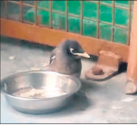
घर में बर्तन में रखा पानी पीती चिड़िया।