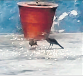
छत पर डाला दाना घुगते पक्षी।

दाना डालने में देरी हो जाए तो मैना कमरे के अंदर तक स्वयं दाना ढूंढ़ने आ जाती हैं। उन्होंने घर के आंगन में पक्षियों के आश्रय के लिए डिब्बे