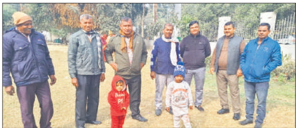
रविवार को पूर्वाह्न में धूप निकलने के बाद पार्क में धूप सेकते लोग और बच्चे।

लोगों की आवाजाही कम रही। सर्दी से बचने को लोगों ने जगह-जगह अलाव जलाकर सर्दी से बचने को हाथ सेंके। तीन दिन से कोहरे का सितम जारी था लेकिन, रविवार को कुछ देर के लिए मुंह चमकाया। सूरज को देखकर