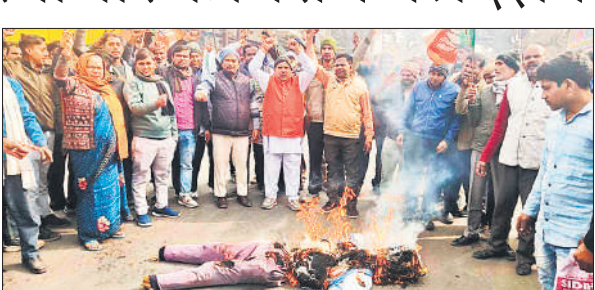
असमोली में बांग्लादेश का पुतला जलाकर प्रदर्शन करने लोग।

प्रदर्शनकारियों का कहना था कि बांग्लादेश में जनसंख्या अनुपात के अनुसार हिंदू समुदाय अल्पसंख्यक है, बावजूद इसके वहां से लगातार हिंदुओं के साथ मारपीट, आगजनी, मंदिरों को नुकसान पहुंचाने तथा उनकी संपत्तियों पर अवैध कब्जे जैसी घटनाओं की खबरें सामने आ रही हैं। इन घटनाओं से न केवल वहां रहने वाले हिंदुओं में भय का माहौल है, बल्कि अंतर्राष्ट्रीय स्तर पर भी मानवाधिकारों को लेकर गंभीर प्रश्न खड़े हो रहे हैं। प्रदर्शन