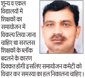
शून्य व एकल विद्यालयों में शिक्षकों का समायोजन में विकल्प लिया जाना चाहिए था सरप्लस शिक्षकों के ब्लॉक बदलने के कारण

की जाए। शिक्षकों ने समायोजित सूची निरस्त करवाने की मांग करते