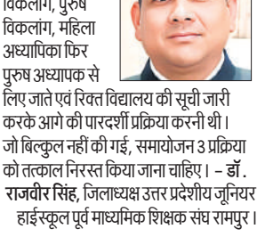
नियमानुसार खुले विकल्प जैसे कि सबसे पहले महिला विकलांग, पुरुष विकलांग, महिला अध्यापिका फिर पुरुष अध्यापक से लिए जाते हुए रिक्त विद्यालय की सूची जारी करके आगे की पारदर्शी प्रक्रिया करनी थी।