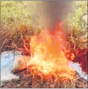
पनवड़िया में नाले में लगी आग।

अमृत विचार : पनवड़िया क्षेत्र में नाले के पानी में आग लगने की घटना से इलाके में हड़कंप मच गया। दमकल विभाग की जांच के दौरान जब पानी में माचिस की जलती तीली डाली गई, तो नाले का पानी अचानक आग पकड़कर धधक उठा। घटना के बाद प्रशासन और स्थानीय लोगों में चिंता का माहौल है। दमकल विभाग के अधिकारियों ने बताया कि प्रथम दृष्ट्या पानी में किसी ज्वलनशील रासायनिक पदार्थ की मौजूदगी प्रतीत हो रही है। मामले की गंभीरता को देखते हुए नाले के पानी के नमूने लेकर रासायनिक परीक्षण के लिए भेजे जा रहे हैं, ताकि यह पता लगाया जा सके कि पानी में कौन-सा रसायन मिला हुआ है और उसका स्रोत क्या है। स्थानीय लोगों का आरोप है कि आसपास स्थित फैक्ट्रियों से निकलने