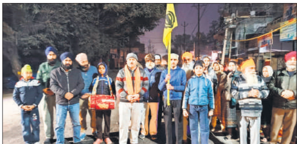
प्रकाशोत्सव पर प्रभात फेरी निकालते सिख समुदाय के लोग।

रविवार प्रातः सिख संगत मुख्य बाजार स्थित गुरुद्वारा सिंह सभा में एकत्रित हुई। जहां से दशमेश पिता गुरु गोविंद के प्रकाशोत्सव पर हर्षोल्लास के साथ प्रभात फेरी निकाली गई। प्रभात फेरी पंजाबी कालोनी से होकर मुख्य बाजार एवं गंगा दास की पुलिया से होते हुए पुनः