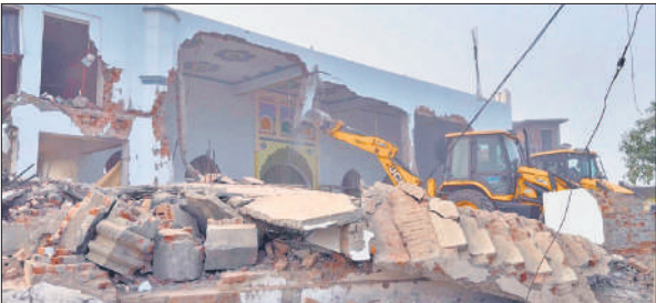
संभल के राया बुजुर्ग गांव में मस्जिद को ध्वस्त करते बुलडोजर।

सबसे पहले ढोल बजवाकर मदरसे की बिल्डिंग को तोड़ने की कार्रवाई की मुनादी कराई गई। मुनादी होते ही मुस्लिम समुदाय के लोग मदरसे को खाली नहीं करने में जुट गये। इतनी बुलडोजरों की मदद से मदरसा भवन को तोड़ने की कार्रवाई शुरू की गई। तीन घंटे चली कार्रवाई में पांच कमरों और आठ दुकानों वाले मदरसे को पूरी तरह जमींदोज कर दिया।