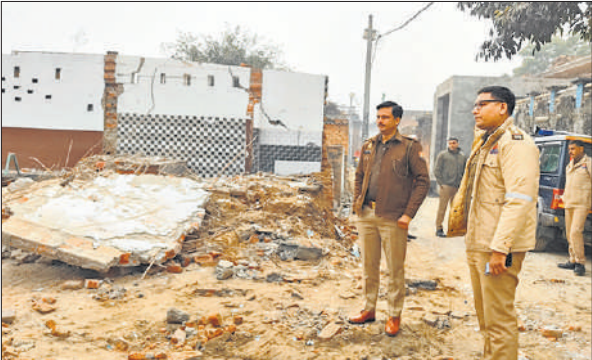
सलेमपुर सलार में मस्जिद तोड़ने के बाद खाली पड़ी भूमि।

सलेमपुर सलार उर्फ हाजीपुर गांव में वर्ष 2000 में चकबंदी के दौरान आर्थिक रूप से कमजोर लोगों को मकान बनाने के लिए भूमि