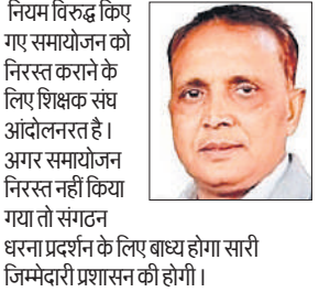
नियम विरुद्ध किए गए समायोजन को निरस्त कराने के लिए शिक्षक संघ आंदोलनरत है। अगर समायोजन निरस्त नहीं किया गया तो संगठन धरना प्रदर्शन के लिए बाध्य होगा सारी जिम्मेदारी प्रशासन की होगी।

नियम व कानून को दरकिनार करते हुए शिक्षकों को प्रताड़ित करते हुए समायोजन कर दिया है। जिससे शिक्षकों में भारी आक्रोश है, महिला व पुरुष शिक्षकों को 60 से 80 किमी. की दूरी पर एक ब्लॉक से दूसरे ब्लॉक में संयोजित किया गया। जबकि स्थानांतरित एवं समायोजित शिक्षकों को तैनाती वाले ब्लॉक में ही समायोजित किया जा सकता था। संघ के पदाधिकारियों ने तीन बिंदुओं पर मांग की है। जिसमें दूसरे ब्लॉक में समायोजित शिक्षकों को तैनाती वाले ब्लॉक में ही समायोजित स्थानांतरित किया जाए एवं महिला शिक्षकों से जापन सौंपा और मामले में कार्रवाई की मांग की थी। शिक्षक सोमवार को मामले में एकत्रित होकर डीएम से मिलेंगे। शिक्षकों का कहना है कि प्रदेश भर में नियमानुसार स्थानांतरण संयोजन प्रक्रिया शुरू हुई है। लेकिन बेसिक शिक्षा विभाग रामपुर ने सभी