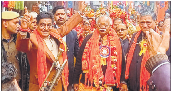
दिव्य ज्योति जाग्रति संस्थान की ओर से निकाली गई कलश यात्रा।