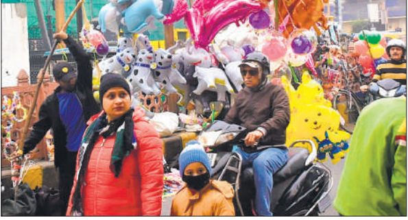
दोपहर में काम से बाजार में पहुंचे लोग।

खासकर दफ्तर जाने वाले कर्मचारी और सुबह की सैर पर निकलने वाले लोगों को ठंड का अधिक सामना करना पड़ा। जैसे-जैसे दिन बढ़ा, सूर्यदेव के दर्शन हुए, जिससे वातावरण में कुछ गरमाहट आई,