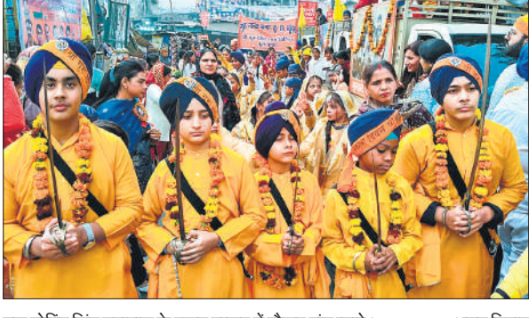
गुरु गोविंद सिंह महाराज के प्रकट उत्सव में मौजूद पांच प्यारे।