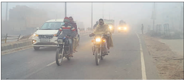
रविवार की सुबह कोहरे के बीच हेड लाइट जलाकर जाते लोग।

सर्दी का सितम बढ़ता जा रहा है हालांकि, रविवार को कुछ देर को धूप निकली। लोगों ने धूप सेंकी लेकिन, धूप में तेजी नहीं थी। कुछ देर बाद सूरज से कोहरे ने अपनी आगोश में ले लिया और शीतलहर को कुछ देर के कड़ाके की सर्दी के कारण बाजारों में