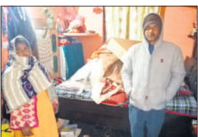
चोरी की जानकारी देता पीड़ित।