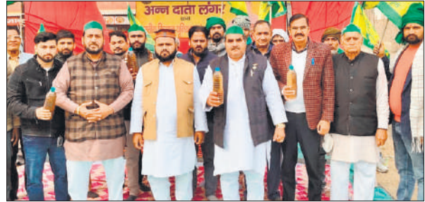
धरने पर मौजूद किसान।