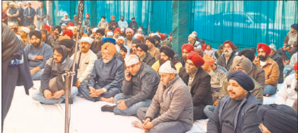
गुरुद्वारे में मौजूद संगत।