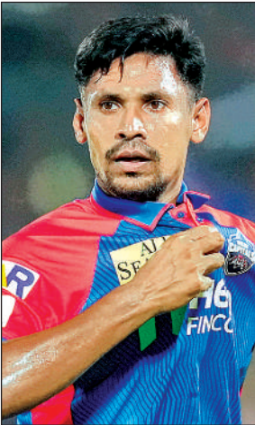
मुस्तफिजुर रहमान। एजेंसी

रहमान को आईपीएल से अचानक बाहर किए जाने के बाद बीसीबी ने शनिवार रात को एक आपातकालीन बैठक बुलाई और एक दिन बाद घोषणा की कि निदेशक मंडल की पुनः बैठक में यह निर्णय लिया गया है कि राष्ट्रीय टीम सात फरवरी से शुरू होने वाले टी20 विश्व कप के लिए भारत नहीं जाएगी। बीसीबी ने एक बयान में कहा बोर्ड ने पिछले 24 घंटों के घटनाक्रमों को ध्यान में रखते हुए स्थिति की विस्तृत समीक्षा की और भारत में खेले जाने वाले मैचों में बांग्लादेश राष्ट्रीय टीम की भागीदारी से संबंधित मौजूदा परिस्थितियों पर गहरी चिंता व्यक्त की है। उन्होंने कहा भारत में बांग्लादेश की टीम की सुरक्षा को लेकर बढ़ती चिंताओं और मौजूदा स्थिति के आकलन के साथ बांग्लादेश सरकार की सलाह पर विचार करते हुए निदेशक मंडल ने फैसला किया है कि बांग्लादेश राष्ट्रीय टीम वर्तमान परिस्थितियों में टूर्नामेंट के लिए भारत की यात्रा नहीं