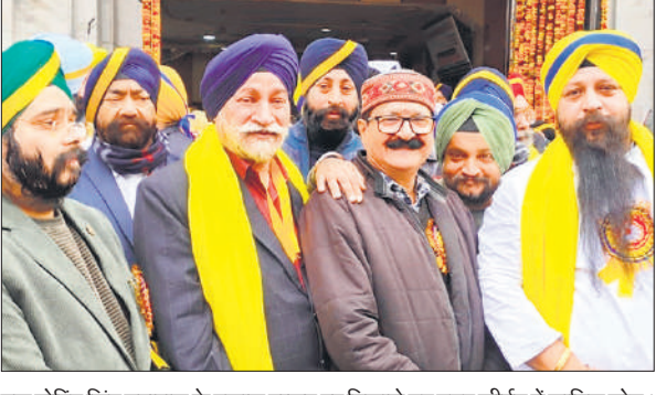
गुरु गोविंद सिंह महाराज के प्रकाश उत्सव पर निकाले गए नगर कीर्तन में शामिल लोग।

नगर कीर्तन की शुरुआत चंद्र नगर स्थित गुरुद्वारा से हुई। वहां से नगर कीर्तन शहर के प्रमुख मार्गों से गुजरते हुए महाराणा प्रताप चौक, कपूर कंपनी होते हुए गुरु गोविंद सिंह चौक स्थित गुरुद्वारा श्री गुरु सिंह सभा पहुंचा। नगर कीर्तन के गुरुद्वारा परिसर में पहुंचने पर गुरुद्वारा प्रबंधक कमेटी की ओर से पुष्पवर्षा कर स्वागत किया गया। इस दौरान कीर्तन गायन, गुरु महिमा का गुणगान तथा जो बोले सो निहाल सत