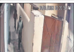
सीसीटीवी में कैद हुए चोर।