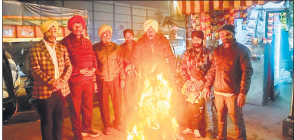
अलाव पर हाथ सेकते जत्थे के पदाधिकारी।