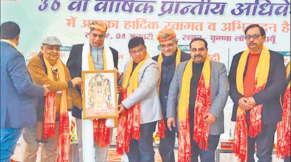
अधिवेशन के दौरान अतिथियों का किया गया स्वागत।