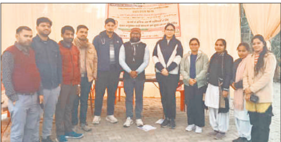
ग्राम जमुका में आयोजित मुफ्त स्वास्थ्य मेले में मरीजों की जांच करते चिकित्सक।

स्वास्थ्य मेले में कुल 410 मरीजों ने पंजीकरण कराया। जांच के दौरान 10 मरीजों में मोतियाबिंद पाया गया, जिनका ऑपरेशन वरुण अर्जुन मेडिकल कॉलेज एवं रोहिलखंड अस्पताल,