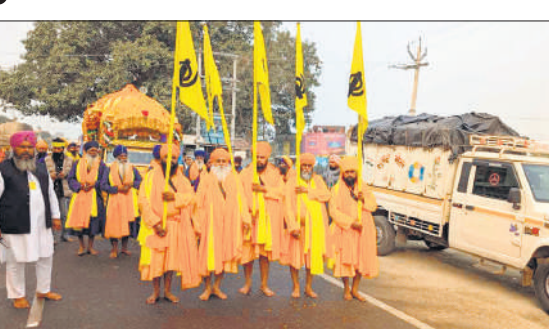
नगर कीर्तन में सजे पंच प्यारे।