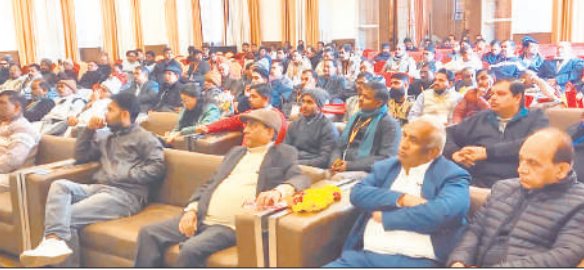
अधिवेशन में मौजूद प्रदेश भर से आए बीज व्यापारी।