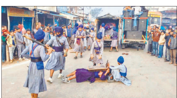
नगर कीर्तन में कतब दिखाते सिख संगत के लोग।