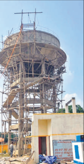
गांव में तैयार ओवरहेड टैंक।

विकासखंड जगत के गांव कुतरई में जल जीवन मिशन के तहत पानी को पाइप लाइन डाल दी गयी है। पाइप लाइन को दो बार चेक किया जा चुका है। ग्राम पंचायत में दो गांव हैं। उदमई और कुतरई। इन दोनों गांवों में करीब एक महीना पहले काम पूरा कर लिया गया है लेकिन पानी की सप्लाई नहीं दी जा रही है। ग्राम कुतरई में ओवरहेड टैंक बनाया गया है जिससे उदमई तक पानी की