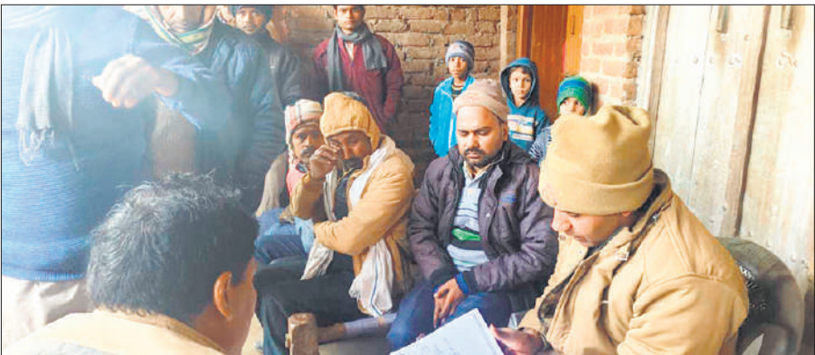
छिदकुरी गांव में हादसे के बाद मौके पर जांच करती पुलिस टीम।