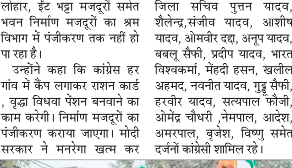
कांग्रेस संदेश यात्रा निकालते कांग्रेसी।

लोगों के राशन कार्ड नहीं बने हैं। जिनके राशन कार्ड बने हैं उनकी पूरी यूनित नहीं चढ़ी है। वृद्धों और विधवाओं को पेंशन नहीं मिल रही है। राजमिस्त्री ,बेलदार, बढई, लोहार, ईट भट्टा मजदूरों समेत भवन निर्माण मजदूरों का श्रम विभाग में पंजीकरण तक नहीं हो पा रहा है। उन्होंने कहा कि कांग्रेस हर गांव में कैप लगाकर राशन कार्ड, वृद्धा विधवा पेंशन बनवाने का काम करेगी। निर्माण मजदूरों का पंजीकरण कराया जाएगा। मोदी सरकार ने मनरेगा खत्म कर