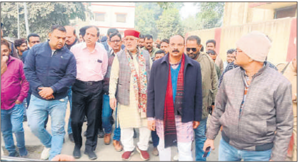
रोजा स्टेशन के पाथ वे का निरीक्षण करते वित्त मंत्री, सांसद व डीआरएम।