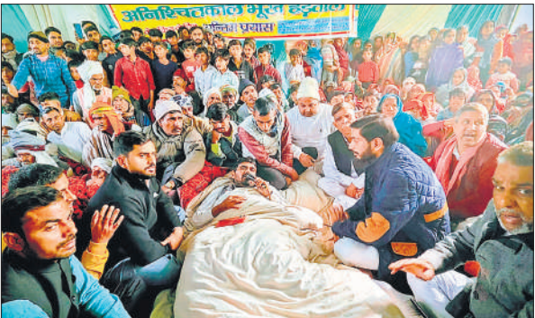
भूख हड़ताल कर रहे ग्रामीणों से बात करते सांसद आदित्य यादव।

विधानसभा बिसौली क्षेत्र के गांव ढोरनपुर के ग्रामीण कई साल से अपने गांव के मुख्य मार्ग को पक्का कराने के लिए प्रयास कर रहे हैं। अधिकारियों से लेकर जनप्रतिनिधियों के दर पर गए लेकिन सुनवाई नहीं हुई। जिसके चलते ग्रामीणों ने दिसंबर में ज्ञापन देकर बताया था कि अगर सड़क की मांग पूरी नहीं की गई तो वह 25 दिसंबर से भूख हड़ताल करेंगे। वह अपने कहे अनुसार भूख हड़ताल