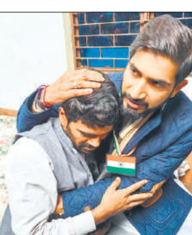
शोकाकुल परिजन को सांत्वना देते सांसद आदित्य यादव।

कहा कि समाजवादी पार्टी परिवार के साथ इस दुख की घड़ी में खड़ी है। परिवार को हर संभव सहायता दिलाने