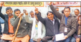
धरना प्रदर्शन करते दिव्यांगजन।