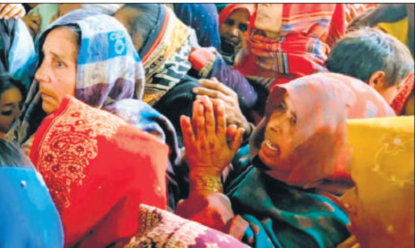
सांसद से हाथ जोड़कर सड़क बनवाने की मांग करती महिलाएं।

सांसद आदित्य यादव ने ग्रामीणों से मुलाकात की। उनकी समस्या जानी। ग्रामीणों ने बताया कि उनके गांव की मुख्य सड़क खस्ताहाल है। बारिश के दिनों में तो निकल ही नहीं सकते। बच्चे स्कूल नहीं जा पाते। बरात को पास के गांव में रुकवाना पड़ता है। गर्भवती या बीमार को अस्पताल ले जाना मुश्किल हो जाता है। गांव विकास की मुख्यधारा से कटा हुआ है। इस छोटे से मार्ग के लिए कई बार आश्वासन मिला लेकिन किसी ने सुनवाई नहीं की।