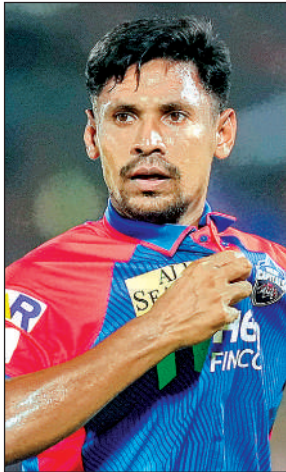
मुस्तफिजुर रहमान।

बांग्लादेश क्रिकेट बोर्ड (बीसीबी) ने रविवार को सुरक्षा चिंताओं और सरकार की सलाह का हवाला देते हुए अगले महीने होने वाले टी20 विश्व कप के लिए अपनी राष्ट्रीय टीम को भारत नहीं भेजने का फैसला किया। यह फैसला आईपीएल फ्रेंचाइजी कोलकाता नाइट राइडर्स (केकेआर) द्वारा भारतीय क्रिकेट बोर्ड (बीसीसीआई) के निर्देश पर तेज गेंदबाज मुस्तफिजुर रहमान को 'रिलीज' करने के बाद लिया गया। बीसीसीआई ने शनिवार को रहमान को 'रिलीज' करने के अपने फैसले के लिए दोनों देशों के बीच मौजूदा संबंधों का स्पष्ट रूप से जिक्र नहीं किया, लेकिन उसने कहा कि यह कदम मौजूदा घटनाओं से प्रेरित है। रहमान को आईपीएल से अचानक बाहर किए जाने के बाद बीसीबी ने शनिवार रात को एक आपातकालीन बैठक बुलाई और एक दिन बाद घोषणा की कि निदेशक मंडल की पुनः बैठक में यह निर्णय लिया गया है कि राष्ट्रीय टीम सात फरवरी से शुरू होने वाले टी20 विश्व कप के लिए भारत नहीं जाएगी। बीसीबी ने एक बयान में कहा बोर्ड ने पिछले 24 घंटों के घटनाक्रमों को ध्यान में रखते हुए स्थिति की विस्तृत समीक्षा की और भारत में खेले जाने वाले मैचों में बांग्लादेश राष्ट्रीय टीम की भागीदारी से संबंधित मौजूदा परिस्थितियों पर गहरी चिंता व्यक्त की है। उन्होंने कहा भारत में बांग्लादेश की टीम की सुरक्षा को लेकर बढ़ती चिंताओं और मौजूदा स्थिति के आकलन के साथ बांग्लादेश सरकार की सलाह पर विचार करते हुए निदेशक मंडल ने फैसला किया है कि बांग्लादेश राष्ट्रीय टीम वर्तमान परिस्थितियों में टूर्नामेंट के लिए भारत की यात्रा नहीं