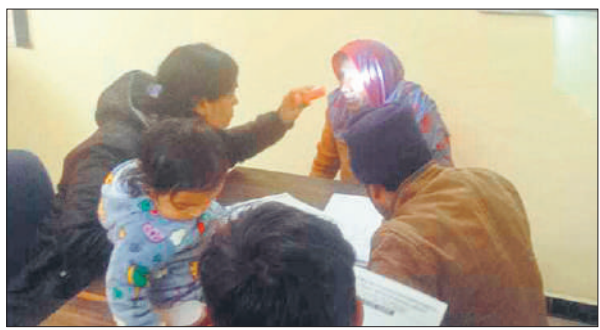
निशुल्क स्वास्थ्य शिविर में मरीजों की जांच करते चिकित्सक।