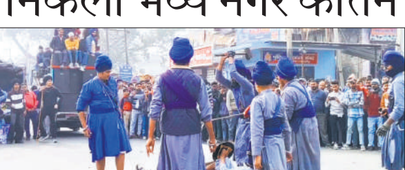
करतब दिखाते सिख संगत के लोग।

बंडा, अमृत विचार: बंडा नगर पंचायत में रविवार को सिखों के दसवें गुरु श्री गुरु गोविंद सिंह जी महाराज की जयंती बड़े धूमधाम और श्रद्धा के साथ मनाई गई। इस अवसर पर नगर में भव्य नगर कीर्तन का आयोजन किया गया, जिसमें सैकड़ों श्रद्धालुओं ने शिरकत की। नगर कीर्तन की शुरुआत रामपुर कलां स्थित गुरुद्वारा साहिब से अरदास के साथ हुआ और यह खुदर होते हुए बंडा के मुख्य चौराहे पर आया जहां सिख समाज के लोगों