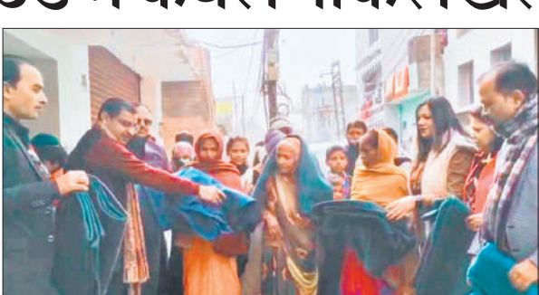
कंबल वितरित करते पदाधिकारी।