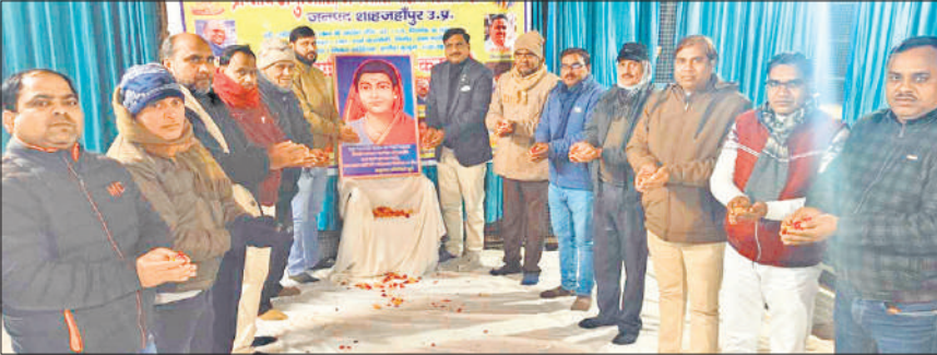
बुद्ध विहार में आयोजित गोष्ठी में सावित्रीबाई फूले के चित्र पर पुष्प अर्पित करते शिक्षक।