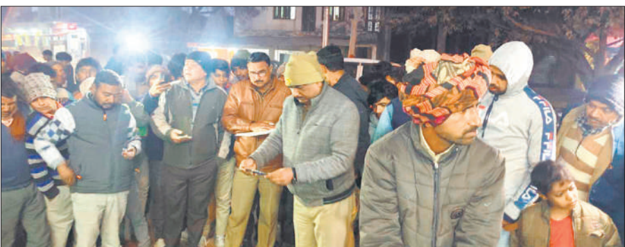
मौके पर जांच करते पुलिस अधिकारी।