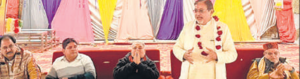
ब्राह्मण सम्मेलन में मंत्र पर बैठे लोग।