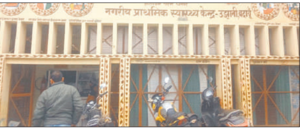
उझानी का आयुष्मान आरोग्य मंदिर।

● शासन के निर्देश के बाद भी नहीं हो रहा नियमों का पालन