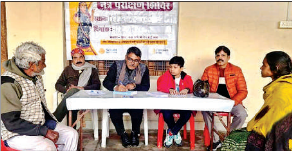
मरीजों की आंखों की जांच करते चिकित्सक।