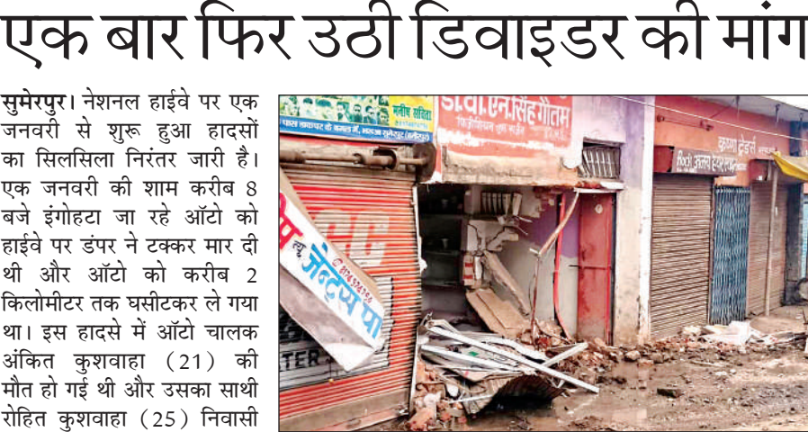
क्षतिग्रस्त क्लीनिक व मकान।