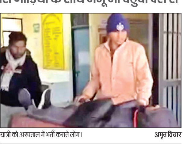
यात्री को अस्पताल में भर्ती कराते लोग।