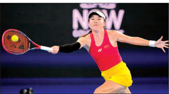
यूनाइटेड कप टेनिस टूर्नामेंट के मैच के दौरान कनाडाई विक्टोरिया म्बोको के खिलाफ

मिले, तो मैंने अच्छा किया और मैं जीत से बहुत खुश हूं। 28 साल का खिलाड़ी अब अपनी लेक्सस एटीपी हेड2हेड सीरीज में ग्रीक्सपूर से 9-2 से आगे है, यह दूसरी बार है जब ज्वेरेव ने एक ही विरोधी के खिलाफ नौ दूर-लेवल जीत हासिल की हैं (ज्वेरेव एड्रियन मैनारिनो से 9-0 से आगे हैं)।