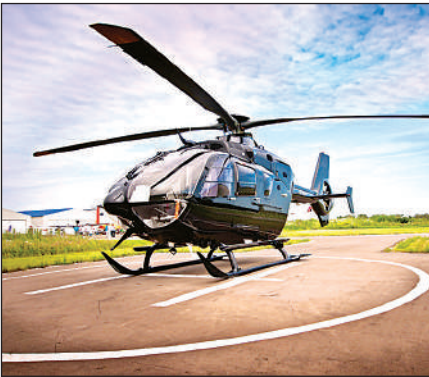
हेलीपैड (प्रतीकात्मक चित्र)।

पीडब्ल्यूडी विभाग को जिला मुख्यालयों, सर्किट हाउसों और