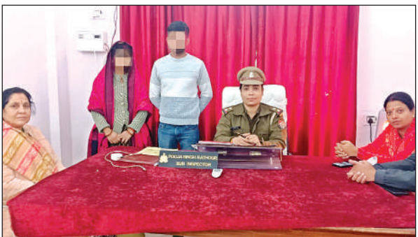
महिला थाने में मौजूद दंपति।

फर्रूद से आगरा जाने वाली मेमू ट्रेन संख्या 64627 अपने निर्धारित समय सुबह 4:19 बजे के बजाय लगभग 4:35 बजे अछल्दा स्टेशन पहुंची। यह ट्रेन करीब 15 मिनट की देरी से चली, जिसे घने कोहरे के कारण नियंत्रित गति से चलाया गया। वहीं, शिकोहाबाद से फर्रूद जाने वाली मेमू ट्रेन संख्या 64632 की स्थिति और भी खराब रही। यह ट्रेन अपने निर्धारित समय सुबह 7:20 बजे के बजाय 10:08 बजे अछल्दा स्टेशन पहुंची, यानी करीब तीन घंटे की देरी से आई। इटावा से कानपुर जाने वाली मेमू ट्रेन संख्या 64170 भी अपने निर्धारित समय 5:20 बजे के बजाय 6:30 बजे अछल्दा स्टेशन पहुंची, जिससे