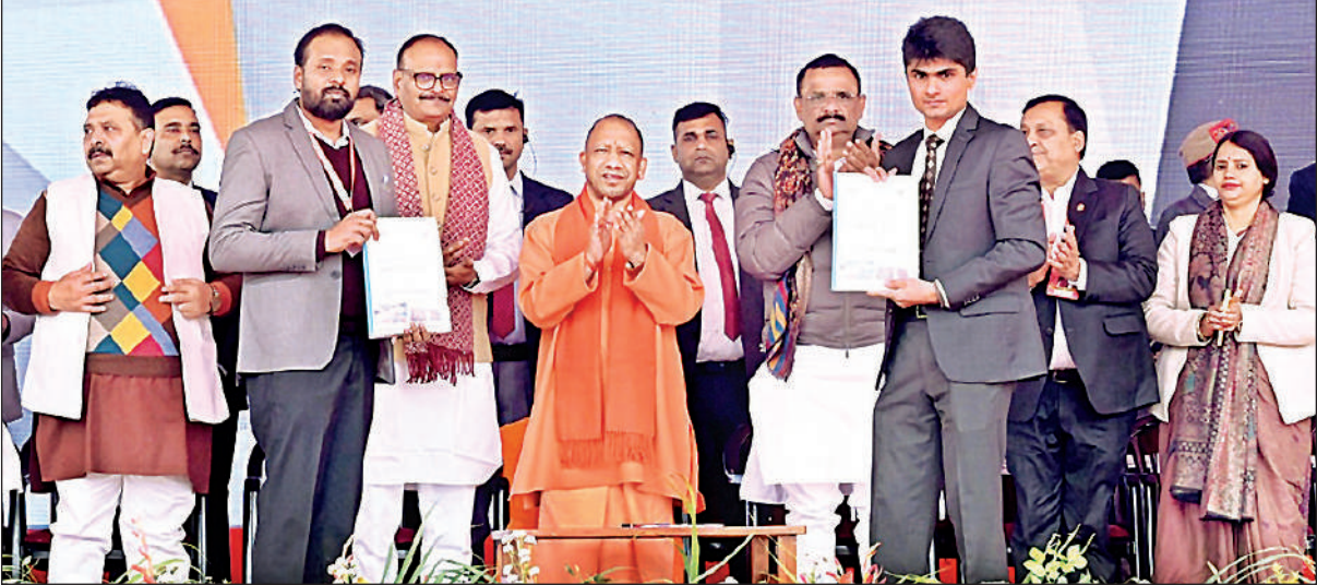
वाराणसी : मुख्यमंत्री योगी की उपस्थिति में उप्र . सरकार और स्पोर्ट्स अथॉरिटी ऑफ इंडिया के बीच हुए एमओयू के दस्तावेज दिखाते अधिकारी, साथ में उप मुख्यमंत्री ब्रजेश पाठक व अन्य ।

मुख्यमंत्री ने कहा कि इस एमओयू से काशी सहित पूर्वांचल के युवा खिलाड़ियों को अत्याधुनिक प्रशिक्षण सुविधाएं मिलेंगी और उन्हें साई के अनुभवी कोचों का मार्गदर्शन