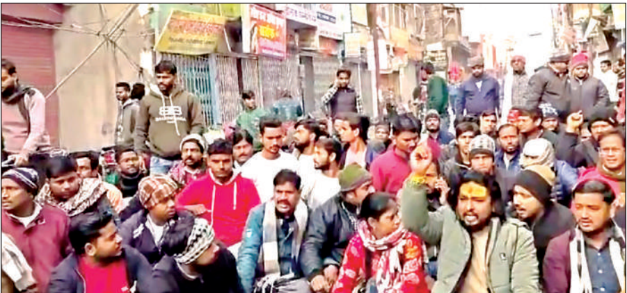
नेहरू रोड पर धरने पर बैठे व्यापारी।