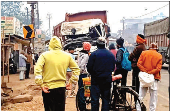
हाईवे के किनारे खड़ा क्षतिग्रस्त ट्रक।

ट्रक से टकराने के बाद खलासी ने कूदकर बचाई जान, क्लीनिक का शटर और दीवार क्षतिग्रस्त