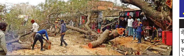
अतिक्रमणरोधी अभियान के दौरान काटा गया पेड़।