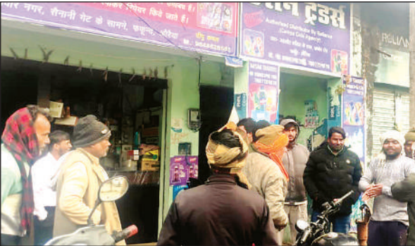
घटनास्थल पर मौजूद लोगों की भीड़।

● पुलिस आस-पास के सीसीटीवी फुटेज खंगाल रही