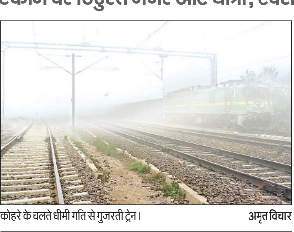
कोहरे के चलते धीमी गति से गुजरती ट्रेन।