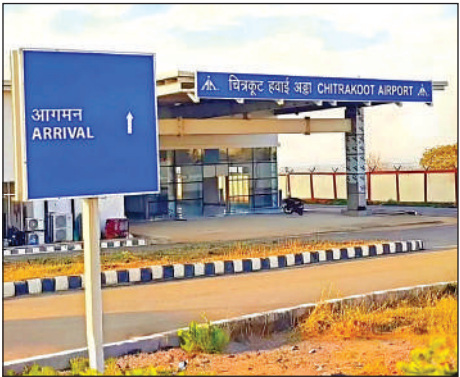
चित्रकूट का टेबल टॉप एयरपोर्ट।