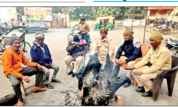
टिडुरन में अलाव का सहारा लेते लोग।