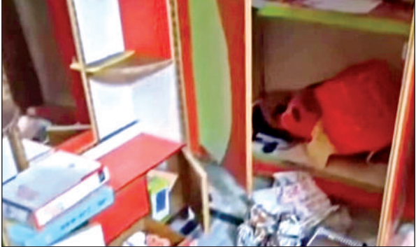
चोरी के बाद बिखरा पड़ा सामान।

पीड़ित के अनुसार रात किसी समय चोरों ने मकान में घुस कर कमरों के ताले तोड़ कर कमरों में रखी अलमारी के लॉक तोड़ कर