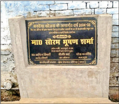
सड़क निर्माण का लगाया गया शिलापट।

13 जोड़े फिर एक-दूसरे के साथ रहने को हुए राजी औरैया। एसपी निर्देशानुसार महिला थाना प्रभारी की अध्यक्षता में प्रोजेक्ट नई किरण का आयोजन किया गया। जिसमें महिला थाना ककोर में 50 फाइलें दायर की गईं। जिनमें 13 परिवार जो आपसी वैचारिक मतभेद की वजह से कुछ दिनों से अलग रह रहे थे एक दूसरे के साथ रहने को राजी नहीं थे। जिसके कारण परिवार टूटने की कगार पर था। जिसे समझा बुझाकर पति-पत्नी के मध्य मन मुटाव कलह को दूर कर एक साथ रहने को राजी कर परिवार से मिलाया गया। परिवार को हसी खुशी बिदा किया गया। नई किरण प्रोजेक्ट के अंतर्गत बिखरे परिवारों को एक सूत्र में बांधने का प्रयास किया जा रहा है। इस दौरान प्रोजेक्ट नई किरण के अन्य सदस्य भी उपस्थित रहे।