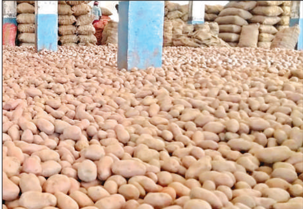
कन्नौज जनपद के एक कोल्ड स्टोरेज में रखा आलू।