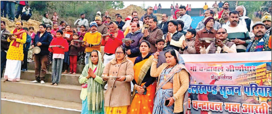
चंद्रावल नदी की महाआरती करते बुंदेलखंड सृजन के कार्यकर्ता।