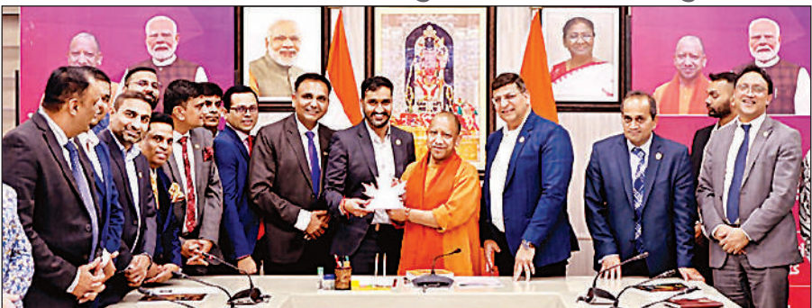
लखनऊ : अपने सरकारी आवास पर कैनेडियन हिंदू चैम्बर ऑफ कॉमर्स के प्रतिनिधिमंडल के साथ मुख्यमंत्री योगी आदित्यनाथ ।

मुख्यमंत्री योगी आदित्यनाथ ने कहा कि उत्तर प्रदेश आज संभावनाओं का प्रदेश बन चुका है, जहां सुरक्षा, सुव्यवस्था और निवेश का वातावरण पहले से कहीं अधिक बेहतर है। मुख्यमंत्री ने प्रतिनिधिमंडल के सदस्यों को