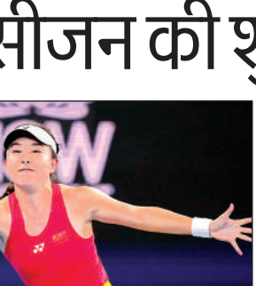
हैरी ब्रूक। एजेंसी

इससे पहले एक दृढ़ निश्चयी लिस ने लैमैस को 6-2, 6-2