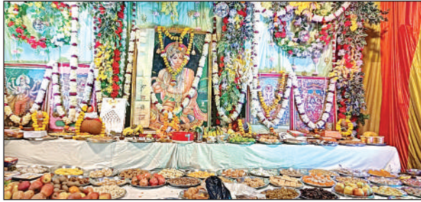
कार्यक्रम के लिए सजा रामदरबार।