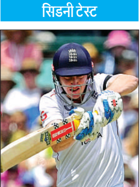
हैरी ब्रूक। एजेंसी

में अपने अर्धशतक पूरे किए जिसमें उनकी शतकीय साझेदारी पूरी हुई। ऑस्ट्रेलिया के गेंदबाजों को पिच से अधिक मदद नहीं मिल रही थी जिससे इस जोड़ी की बदौलत इंग्लैंड ने नियंत्रण बनाया। रूट ने 65 गेंद में अपना 67वां जबकि ब्रूक ने 63 गेंद में 15वां अर्धशतक पूरा किया। ब्रूक ने अपनी पारी के दौरान कुछ मौकों पर जोखिम भी उठाया। इंग्लैंड ने