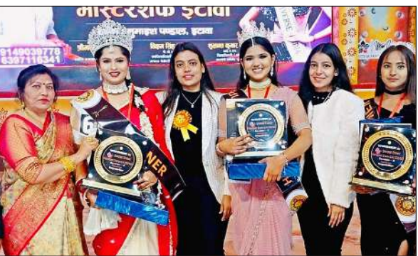
विजेताओं के साथ आयोजक मंडल की सदस्य।

● यूनियर्स के साथ हुआ महोत्सव की प्रतिस्पर्धाओं का समापन