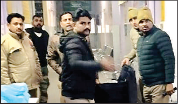
तीनों को लेकर सरकारी अस्पताल पहुंची पुलिस टीम।

● बेटों के साथ अपनी ससुराल जा रहा था कौरारीखेड़ा का युवक