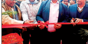
मेला रामनगरिया में फीता काटकर चित्र प्रदर्शनी का उद्घाटन करते जिलाधिकारी आशुतोष कुमार द्विवेदी।

चित्र प्रदर्शनी में बेटियों के सम्मान के लिए संचालित मुख्यमंत्री कन्या सृमंगला योजना, कोशल प्रशिक्षण एवं रोजगार के लिए प्रधानमंत्री कौशल विकास योजना, युवाओं के सपने साकार मुख्यमंत्री अभ्युदय योजना, आमजन के लिए चिकित्सा सुविधाओं का विस्तार, प्रधानमंत्री जन आरोग्य योजना (आयुष्मान भारत), गरीबों के कल्याण हेतु