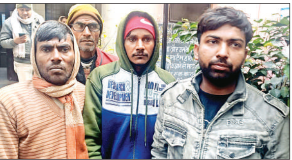
जानकारी देते मजदूर के परिजन।