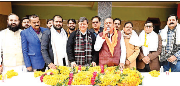
समारोह को संबोधित करते वक्ता।

कानपुर। नए साल पर एलएलजेएम मेथाडिस्ट चर्च सभिल लाइंस में विशेष प्रार्थना का आयोजन किया गया। जिसमें बड़ी संख्या में मसीही समाज के लोग एकत्र हुए। एक दूसरे को नए साल की मुबारकबाद दी और चर्च परिसर में लगे मेले में लजीज व्यंजन का लुफ्त उठाया। रविवार को डब्लूएससीएस के द्वारा चर्च में समारोह आयोजित किया गया जिसमें संपूर्ण मसीही समाज की ओर से नव वर्ष की शुभकामनाएं और अच्छे स्वास्थ्य की कामनाएं सभी के लिए की गईं। मसीही गीत भी गाए गए।