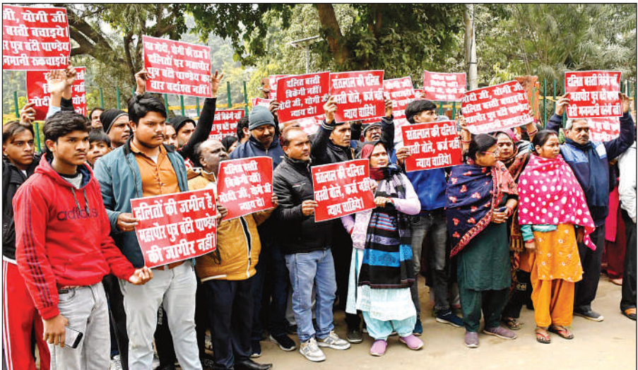
हंगामा करते संतलाला हाते के लोग।