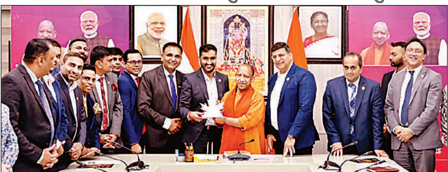
लखनऊ : अपने सरकारी आवास पर कैनेडियन हिंदू चैम्बर ऑफ कॉमर्स के प्रतिनिधिमंडल के साथ मुख्यमंत्री योगी आदित्यनाथ ।

मुख्यमंत्री योगी आदित्यनाथ ने कहा कि उत्तर प्रदेश आज संभावनाओं का प्रदेश बन चुका है, जहां सुरक्षा, सुव्यवस्था और निवेश का वातावरण पहले से कहीं अधिक बेहतर है। मुख्यमंत्री ने प्रतिनिधिमंडल के सदस्यों को