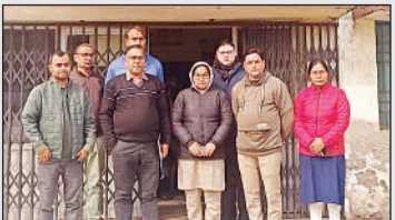
पीएचसी के बाहर मौजूद टीम।