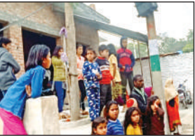
हेरान-परेशान मोहल्ले के बच्चे।