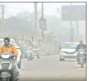
दिन में रहा कोहरा।

मौसम विशेषज्ञों ने बताया कि मंगलवार से शहर में घना कोहरा बंधू बढ़ने की भी संभावना है। शहर में सुबह से ही सर्द हवाओं ने अपना असर दिखाया शुरू कर