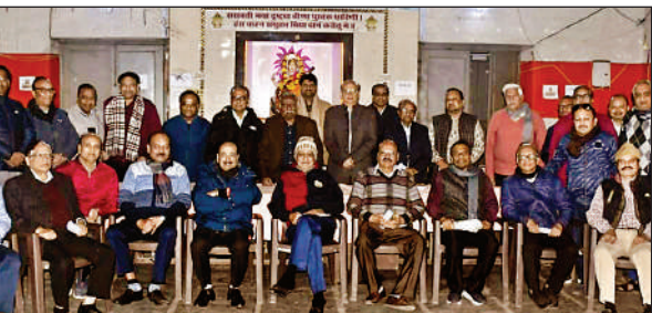
आमसभा में मौजूद मारवाड़ी समाज के गण्यमान्य लोग।