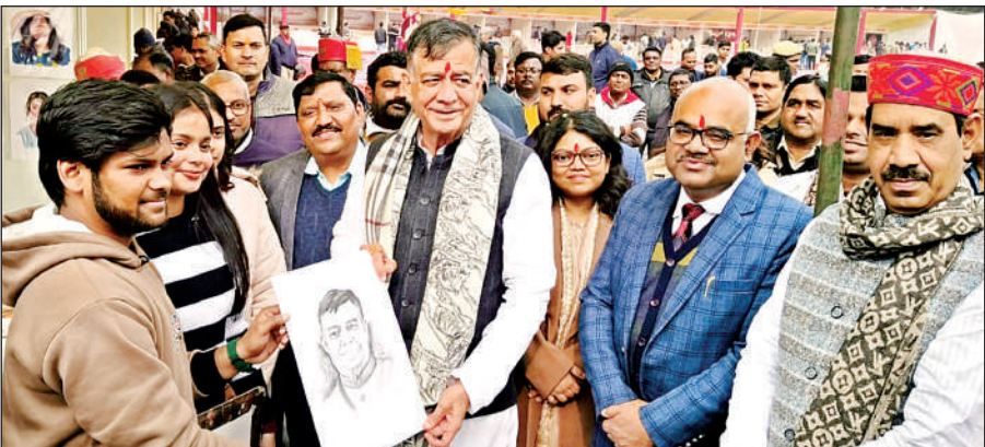
विधानसभा अध्यक्ष सतीश महाना को उनका चित्र भेंट करता कलाकार।