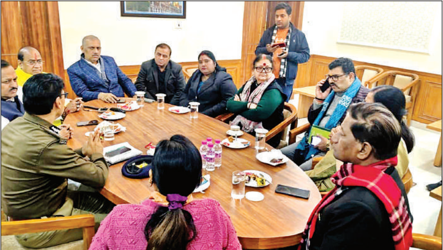
जनप्रतिनिधियों के साथ बैठक करते पुलिस कमिश्नर।