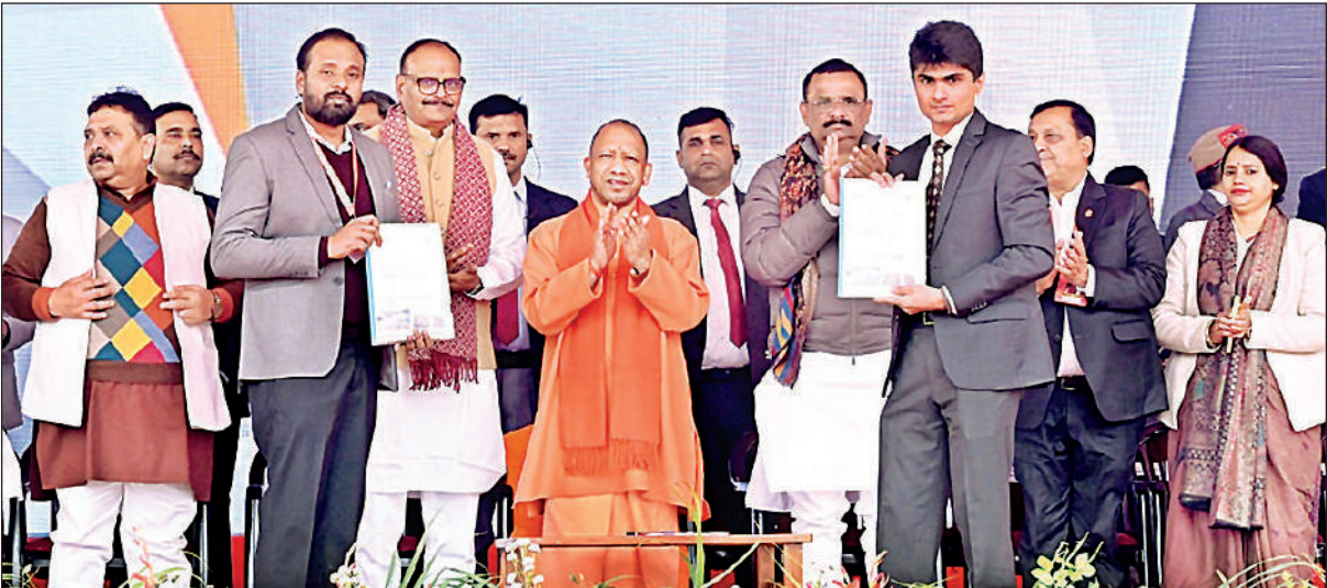
वाराणसी : मुख्यमंत्री योगी की उपस्थिति में उप्र . सरकार और स्पोर्ट्स अथॉरिटी ऑफ इंडिया के बीच हुए एमओयू के दस्तावेज दिखाते अधिकारी, साथ में उप मुख्यमंत्री ब्रजेश पाठक व अन्य ।

मुख्यमंत्री ने कहा कि इस एमओयू से काशी सहित पूर्वांचल के युवा खिलाड़ियों को अत्याधुनिक प्रशिक्षण सुविधाएं मिलेंगी और उन्हें साई के अनुभवी कोचों का मार्गदर्शन