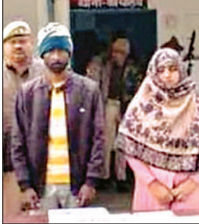
पुलिस की गिरफ्त में बीबी और भतीजा।