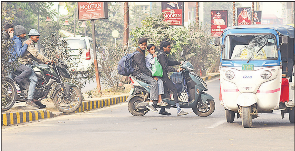
विकास भवन मार्ग पर डिवाइडर पार करते बाइक-स्कूटी सवार। ● अमृत विचार

बाइक पर हेलमेट न पहनना, एक ही वाहन पर चार-चार लोग सवार होना, मोबाइल पर बात करते हुए स्कूटी चलाना और शॉर्टकट अपनाकर ट्रैफिक नियमों को ताक पर रखना अब आम दृश्य बन गया है। गांधी उद्यान, विकास भवन रोड, पटेल चौराहा जैसी व्यस्त जगहों पर हर समय पुलिस तैनात रहती है, फिर भी नियम तोड़ने वालों को रोकने या कार्रवाई करने की जरा भी पहल नहीं दिखाई देती। परिवहन विभाग का अभियान भी फोटो खिंचवाने तक सीमित रह गया है। बड़े वाहन भी बेखोफ नियम तोड़ते दिखे हैं। सिस्टम केवल आंकड़े और बयानबाजी में उलझा हुआ दिखता है। रविवार को अमृत विचार के रिपोर्टर महिपाल और फोटो जर्नलिस्ट मोहित सिंह की पड़ताल में यह स्थिति पूरी तरह उजागर हुई। इससे साफ है कि यह अभियान सिर्फ दिखावे का है, सड़क पर सुरक्षा और नियमों की गंभीरता कहीं नजर नहीं आ रही।