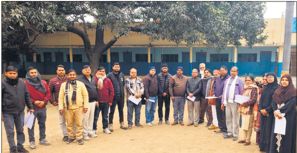
पोलिंग स्टेशन पर बीएलओ से भेंट करते महानगर कांग्रेस कमेटी के पदाधिकारी।

बढ़ रही है। खास बात यह है कि कार्यदायी संस्था को नगर आयुक्त कई बार चेतावनी दे चुके हैं, बावजूद काम में कोई खास तेजी नहीं आई। जनता का धैर्य जवाब देने लगा है। रोजाना जाम, धूल, गड्डे और हादसों का डर लोगों की दिनचर्या का हिस्सा बन चुका है।