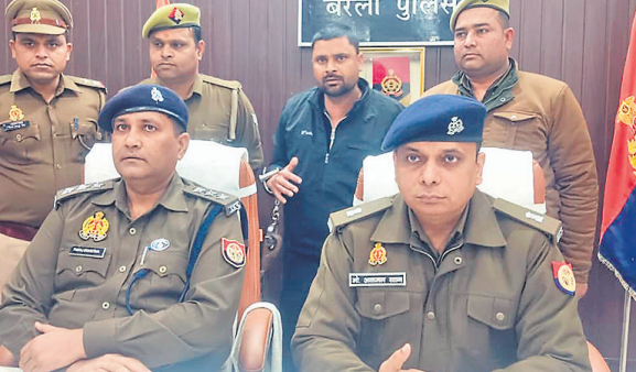
हिरासत में आरोपी और जानकारी देते एसपी ट्रैफिक और सीओ तृतीय।