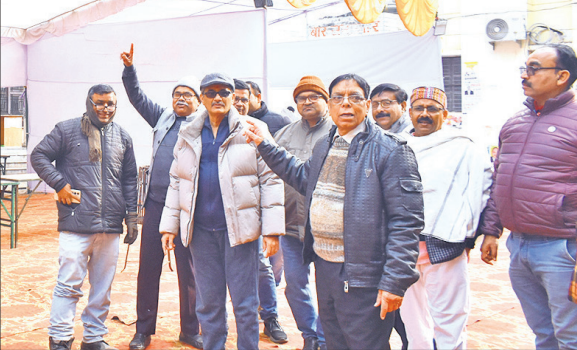
बार भवन सभागार परिसर में तैयारियों का जायजा लेते चुनाव अधिकारी।

मुख्य चुनाव अधिकारी राजीव जयपति ने बताया कि रविवार को चुनाव मंडल की बैठक हुई। इसमें चुनाव की तैयारियों की समीक्षा की गयी। पंडाल इत्यादि की व्यवस्था का भी निरीक्षण किया। सभी तैयारियां पूरी की जा चुकी हैं। चुनाव कराने में सहयोग के लिए प्रशासन, नगर निगम को भी अवगत कराया जा चुका है। चुनाव के दौरान पुलिस बल भी सुरक्षा के दृष्टिकोण से तैनात रहेगा। अध्यक्ष पद पर 6 व सचिव पद पर 4 प्रत्याशियों के अलावा विभिन्न पदों पर कुल 80 प्रत्याशी चुनाव मैदान में हैं। इसमें से 21 प्रत्याशी