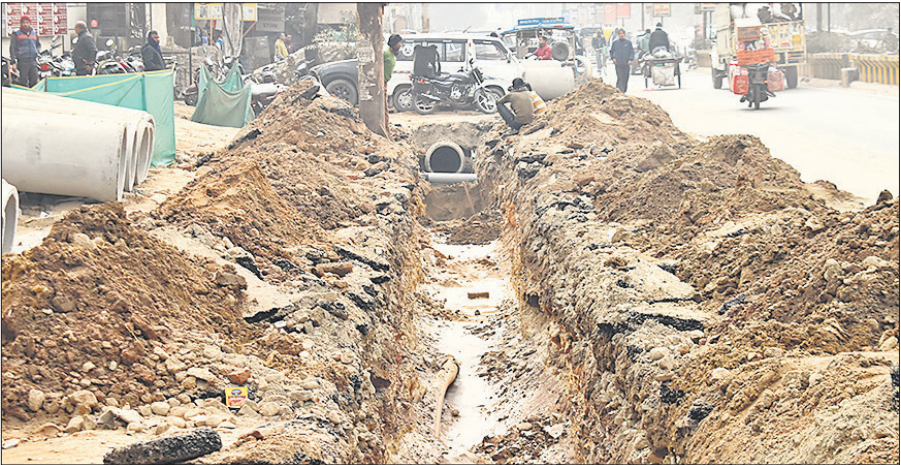
डेलापीर से स्टेडियम रोड पर सड़क की खुदाई कर डाली जा रही पाइप लाइन।