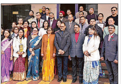
कार्यक्रम में शामिल पूर्व छात्र-छात्राएं।