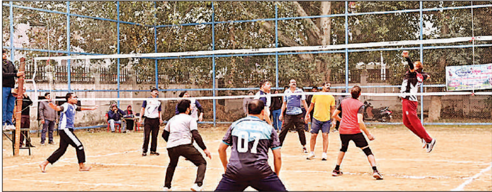
वॉलीबॉल मैच में बॉली लगाने का प्रयास करता खिलाड़ी।