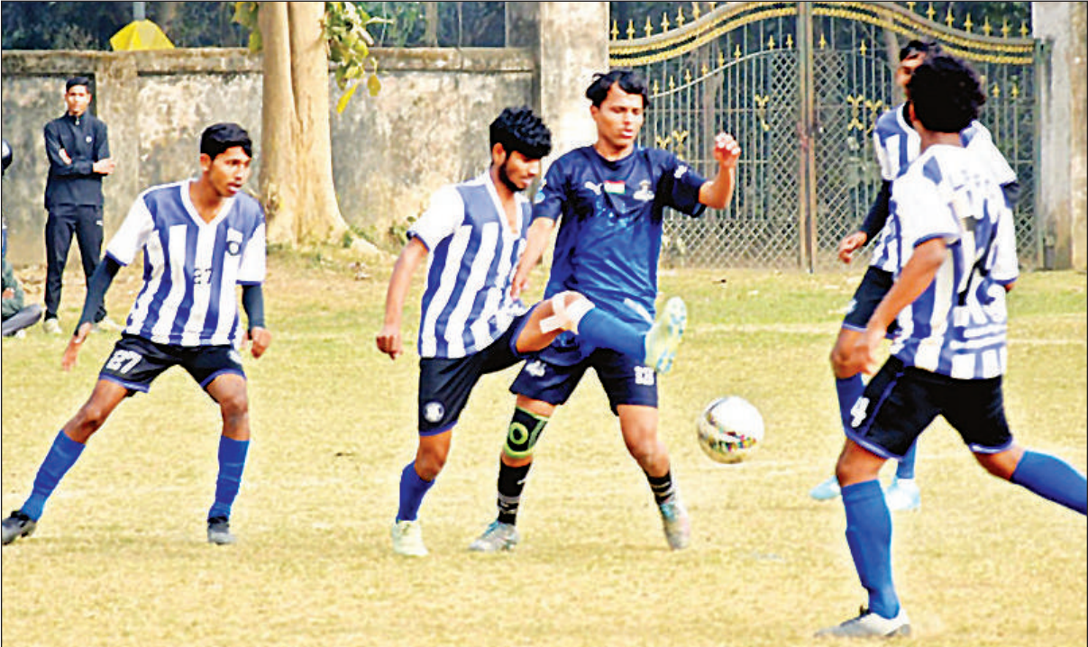
फुटबॉल पर कब्जे के लिए संघर्ष करते फॉल्कंस ए और मिडविंटर टीम के खिलाड़ी।