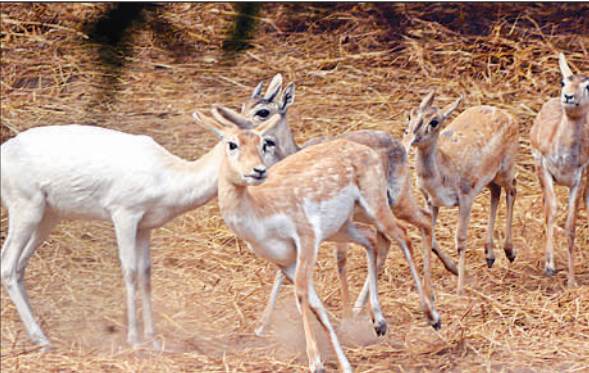
धूप न निकलने से चिड़ियाघर के जीव-जंतु भी ठंड से बेहाल दिख रहे हैं।