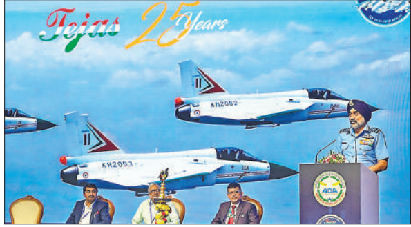
एडीए की ओर से आयोजित सेमिनार को संबोधित करते एयरचीफ मार्शल एपी सिंह।

उम्मीद है कि एम्केए एरिपोर्ट वायुसेना की अभियान क्षमता को मजबूत करेगा, जबकि एम्के-2 और 'नेवी' अभी तैयार हो रहे हैं। अब तक 38 विमान (32 लड़ाकू और छह ट्रेनर) को दो वायुसेना स्वाइन में शामिल किया गया है। सेमिनार के हिस्से के तौर पर कई सार्वजनिक उपक्रम, रक्षा सार्वजनिक क्षेत्र उपक्रम और अन्य उद्योग स्वदेशी रूप से तैयार की गई तकनीक दिखा रहे हैं जो रक्षा विमानन में भारत की बढ़ती आत्मनिर्भरता को उभार कर रहा है। एडीसी ने 100 से ज्यादा डिजाइन केंद्रों के योगदान से तेजस को तैयार किया है।