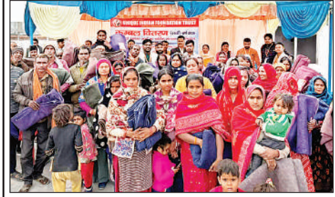
कंबल वितरण के दौरान मौजूद लोग।