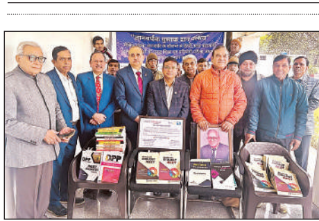
पुस्तकें देते क्लब के सदस्य।