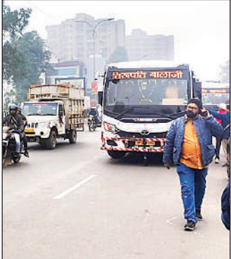
बर्लिंगटन चौराहे के पास खड़ी डग्गामार बस।