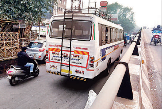
पुरनिया पुल के पास जाती डग्गामार बस।