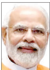
नरेंद्र मोदी प्रधानमंत्री

सोमनाथ... ये शब्द सुनते ही हमारे मन और हृदय में गर्व और आस्था की भावना भर जाती है। भारत के पश्चिमी तट पर गुजरात में, प्रभास पाटन नाम की जगह पर स्थित सोमनाथ, भारत की आत्मा का शाश्वत प्रस्तुतिकरण है। द्वादश ज्योतिर्लिंग स्तोत्रम् में भारत के 12 ज्योतिर्लिंगों का उल्लेख है। ज्योतिर्लिंगों का वर्णन इस पंक्ति से शुरू होता है... ‘सौराष्ट्रेसोमनाथं च...’ यानी ज्योतिर्लिंगों में सबसे पहले सोमनाथ का उल्लेख आता है। ये इस पवित्र धाम की सभ्यतागत और आध्यात्मिक महत्ता का प्रतीक है। शास्त्रों में ये भी कहा गया है: ‘सोमलिङ्गनरोदृष्ट्वासर्वपापैः प्रमुच्यते। लभते फलं मनोवाञ्छितं मृतः स्वर्गं समाश्रयेत्॥’ अर्थात् सोमनाथ शिवलिंग के दर्शन से व्यक्ति अपने सभी पापों से मुक्त हो जाता है। मन में जो भी पुण्य कामनाएं होती हैं, वो पूरी होती हैं और मृत्यु के बाद आत्मा स्वर्ग को प्राप्त होती है। दुर्भाग्यवश, यही सोमनाथ, जो करोड़ों लोगों की श्रद्धा और प्रार्थनाओं का केंद्र था, विदेशी आक्रमणकारियों का निशाना बना, जिनका उद्देश्य विध्वंस था।