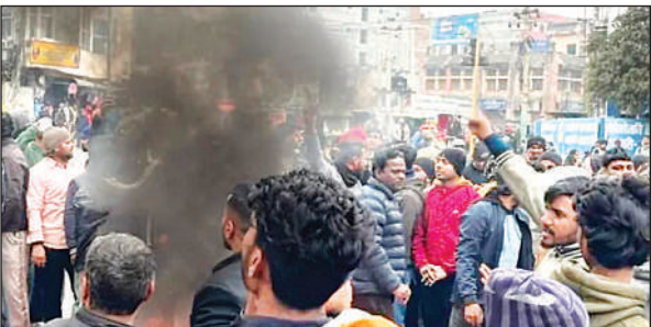
धनुषा में हंगामा करते लोग।

अमृत विचार। धनुषा में मस्जिद में तोड़फोड़ की घटना के विरोध में बीरगंज में रविवार सुबह से मुस्लिम समुदाय के लोग सड़कों पर उतर आये, मस्जिद की तोड़फोड़ के विरोध में शहर का माहौल बेहद तनावपूर्ण हो गया है। यह घटना धनुषा की धनौकला नगर पालिका-6, सुखवा मरान के मुस्लिम टोला स्थित एक मस्जिद में हुई, जहां असाમાजिक तत्वों ने मस्जिद में घुसकर तोड़फोड़ की। घटना की तस्वीरें और वीडियो सोशल मीडिया पर वायरल होते ही लोगों की भावनाएं भड़क उठीं, जिसके बाद बीरगंज के विभिन्न इलाकों में विरोध