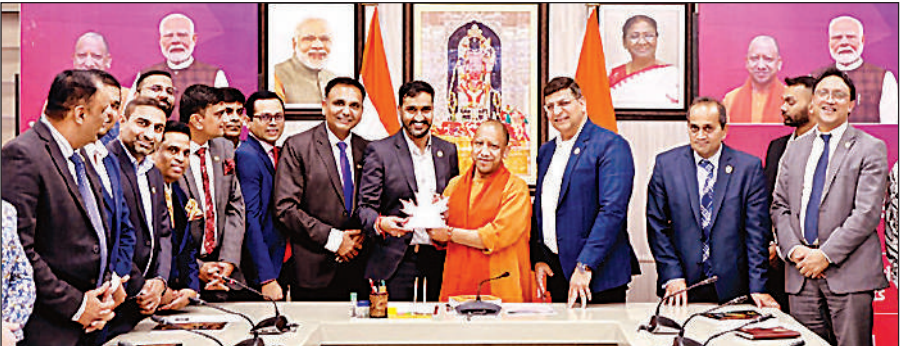
अपने सरकारी आवास पर कैनेडियन हिंदू चैंम्बर ऑफ कॉमर्स के प्रतिनिधिमंडल के साथ मुख्यमंत्री योगी आदित्यनाथ।

मुख्यमंत्री योगी आदित्यनाथ ने कहा कि उत्तर प्रदेश आज संभावनाओं का प्रदेश बन चुका है, जहां सुरक्षा, सुव्यवस्था और निवेश का वातावरण पहले से कहीं अधिक बेहतर है। मुख्यमंत्री ने प्रतिनिधिमंडल के सदस्यों को