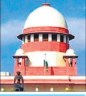
● 18 लाख लंबित मामलों पर चिंता जताते हुए दी थी अनुमति

सुप्रीम कोर्ट ने 18 लाख मामलों के लंबित होने पर चिंता व्यक्त करते हुए 30 जनवरी, 2025 को उच्च न्यायालयों को तदर्थ न्यायाधीशों की नियुक्ति की अनुमति दी थी, जिनकी संख्या न्यायालय की कुल स्वीकृत संख्या के 10% से अधिक नहीं होनी चाहिए। केंद्रीय विधि मंत्रालय को अब तक किसी भी उच्च न्यायालय के कॉलेजियम से तदर्थ आधार पर नियुक्त के लिए कोई सिफारिश प्राप्त