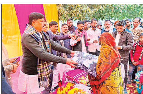
असहायों को कंबल वितरित करते पूर्व मंत्री।