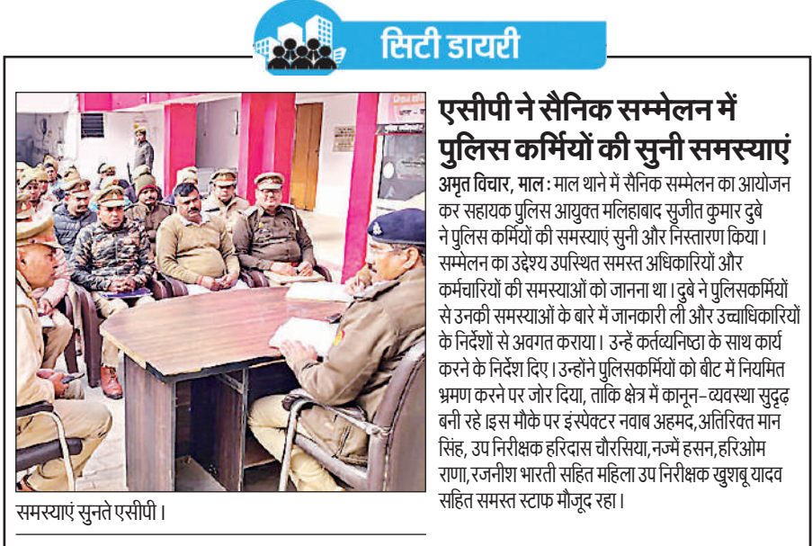
समस्याएं सुनते एसपी।