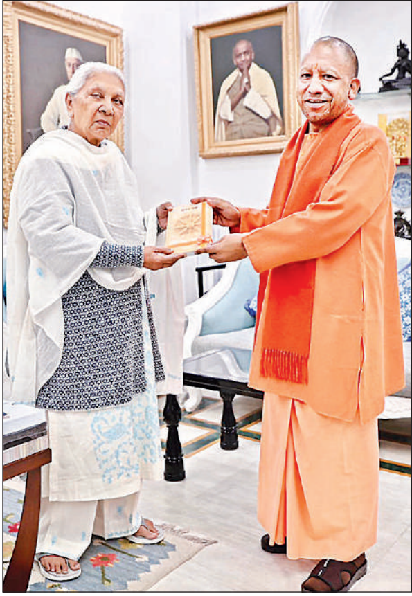
राजभवन में राज्यपाल आनंदीबेन पटेल से शिष्टाचार भेंट करते मुख्यमंत्री योगी।

सारिणी तय करने जैसे बिंदुओं पर विचार करने को कहा गया है। प्रस्तावित योजना के अनुसार, विधान भवन का भ्रमण सीमित समय और निर्धारित नियमों के तहत कराया जाएगा, जिससे सुरक्षा व्यवस्था और सदन की कार्यवाही प्रभावित न हो। पर्यटकों की बढ़ती रुचि को देखते हुए