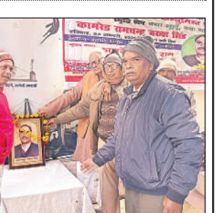
पूर्व विधायक को श्रद्धांजलि देते लोग।