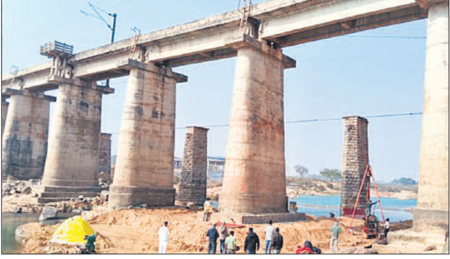
लोहरदगा में क्षतिग्रस्त पुल का निरीक्षण करने पहुंचे रेलवे इंजीनियर।

इस बड़ी चूक के बाद भी यह गनीमत रही कि इस दौरान कोई दुर्घटना नहीं हुई। रेलवे सूत्रों के अनुसार, लोहरदगा-रांची-टोरी रेलखंड पर कोयल नदी स्थित रेलवे पुल संख्या 115 के पिलर संख्या 5 में पहले से दरार होने का रेलवे को पता था, इसकी मरम्मत भी चल रही थी लेकिन इसके बावजूद ट्रेनों का संचालन जारी रखा गया। इसी बीच पिलर संख्या 4 में भी दरार आ गई। जब इंजीनियरिंग टीम ने पुल का निरीक्षण किया तो दरारें गंभीर पाई गईं जिसके बाद सुबह 10:10 बजे पुल से होकर गुजरने वाली