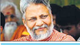
● कहा- देश के सबसे स्वच्छ शहर का हाल दूसरे शहरों की हालत बताने को काफी