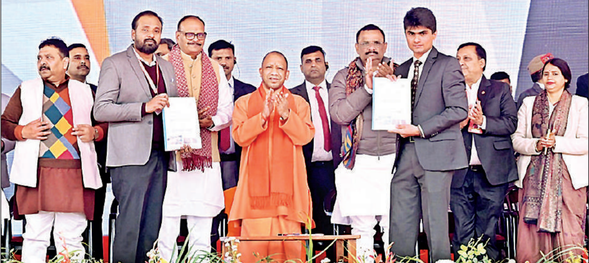
वाराणसी : मुख्यमंत्री योगी की उपस्थिति में उप्र. सरकार और स्पोर्ट्स अथॉरिटी ऑफ इंडिया के बीच हुए एमओयू के दस्तावेज दिखाते अधिकारी, साथ में उप मुख्यमंत्री ब्रजेश पाठक व अन्य।

मुख्यमंत्री रविवार को 72वीं सीनियर नेशनल वॉलीबॉल चैंपियनशिप के शुभारंभ अवसर पर खिलाड़ियों और दर्शकों को संबोधित कर रहे थे। इस अवसर पर स्पोर्ट्स अथॉरिटी ऑफ इंडिया (साई) और उत्तर प्रदेश खेल निदेशालय के बीच नेशनल सेंटर ऑफ एक्सीलेंस (एनसीओई) के संचालन को लेकर समझौता ज्ञापन (एमओयू) का आदान-प्रदान हुआ। मुख्यमंत्री ने कहा कि इस एमओयू से काशी सहित पूर्वांचल के युवा खिलाड़ियों को अत्याधुनिक प्रशिक्षण सुविधाएं मिलेंगी और उन्हें साई के अनुभवी कोचों का मार्गदर्शन प्राप्त होगा।