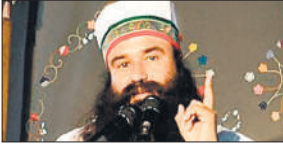
साल पहले पत्रकार की हत्या में 2019 में दोषी ठहराया गया था। उसे पिछले साल अगस्त में पैरोल पर 21 दिन की

समझा जा सकता है कि दूसरे शहरों में पेयजल आपूर्ति प्रणाली के हालात कितने गंभीर होंगे। इंदौर अपनी पानी की जरूरतों के लिए नर्मदा नदी पर निर्भर है। नगर निगम की बिछाई पाइपलाइन के जरिये नर्मदा नदी के पानी को पड़ोसी खरगोन जिले के जलूद से 80 किलोमीटर दूर इंदौर