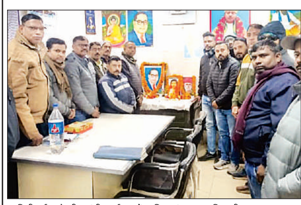
सावित्रीबाई फुले की जयंती कार्यक्रम में शामिल संगठन पदाधिकारी।