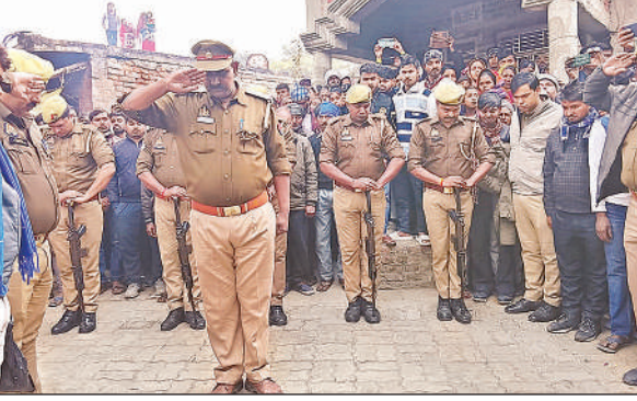
मृतक पुलिस के जवान को गार्ड ऑफ ऑनर देकर अंतिम विदाई देते पुलिस अधिकारी।

रहते हैं, लेकिन कार्रवाई न होने से इनके होसले बुलंद हैं। हाल ही में डालीगंज पुल पर एक डग्गामार बस छत पर अधिक सामान लाने के कारण फंस गई थी, जिससे काफी देर तक ट्रैफिक जाम की स्थिति बनी रही। इस घटना के चलते आम लोगों को भारी परेशानी का सामना करना पड़ा। इस तरह की लापरवाही न केवल यात्रियों की सुरक्षा के लिए खतरा है, बल्कि सरकारी राजस्व को भी नुकसान पहुंचा रही है। डग्गामार बसें न तो निर्धारित परमिट का पालन करती हैं और न ही सुरक्षा मानकों का। बिना फिटनेस जांच और ओवरलोडिंग के कारण ये बसें आए दिन दुर्घटनाओं का कारण बन रही हैं।