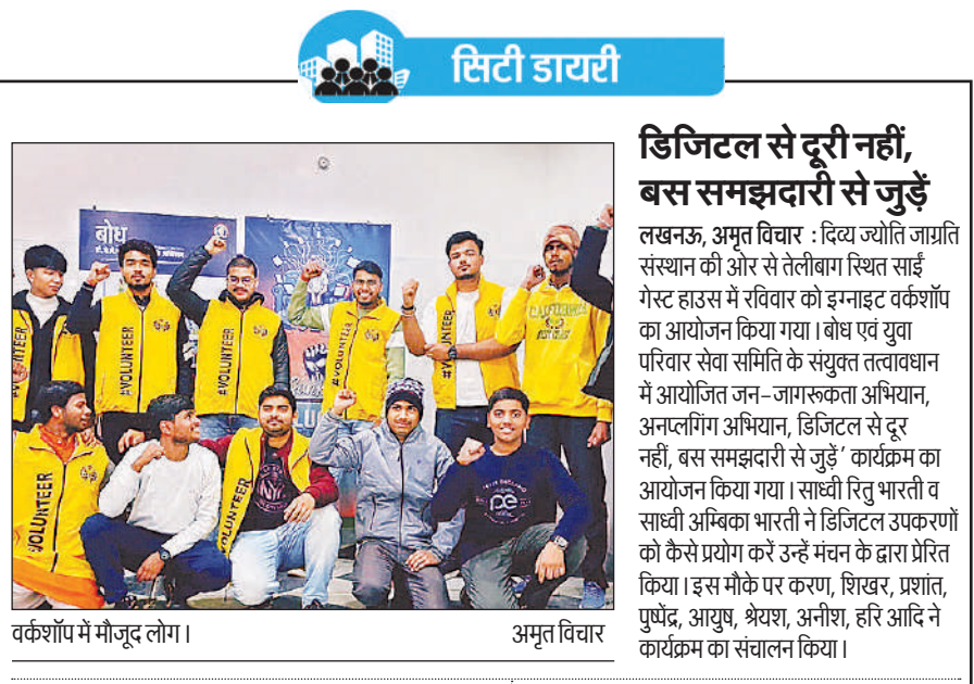
वर्कशॉप में मौजूद लोग।