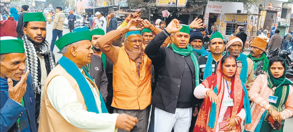
कलेक्ट्रेट गेट पर विरोध प्रदर्शन करते भाकियू लोकशक्ति के पदाधिकारी।

मानकों के विपरीत संचालित क्रशर प्लांट बंद कराने की मांग