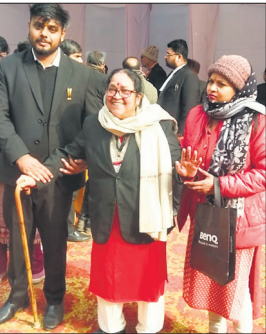
चेहरे पर दिखी वोट डालने की खुशी।