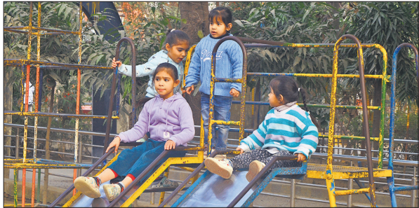
दोपहर में हल्की धूप के बीच गांधी उद्यान में मौज-मस्ती करते बच्चे।