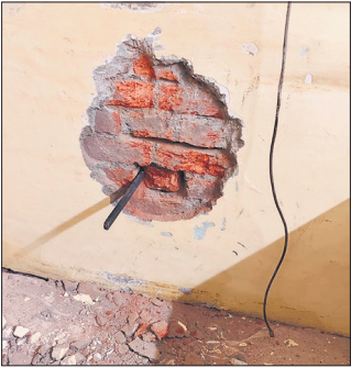
स्ट्रांग रूम की दीवार काटने की कोशिश की गई।

सोमवार सुबह 10 बजे बैंक स्टाफ पहुंचा तो वारदात का पता चला और प्रबंधक को सूचना दी।