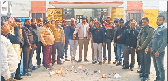
प्रदर्शन के दौरान संविदा कर्मचारियों ने समझौते पत्र का दहन किया ● अमृत विचार

कर्मचारियों ने कहा कि उत्तर प्रदेश पावर कॉर्पोरेशन प्रबंधन ने अपने स्वयं के आदेश का उल्लंघन कर 33/11 केवी विद्युत उपकेंद्रों को परिचालन व अनुरक्षण कार्य में तैनात लगभग 15000 बिजली आउटसोर्स