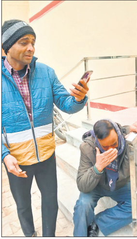
विलाप करते परिजन।