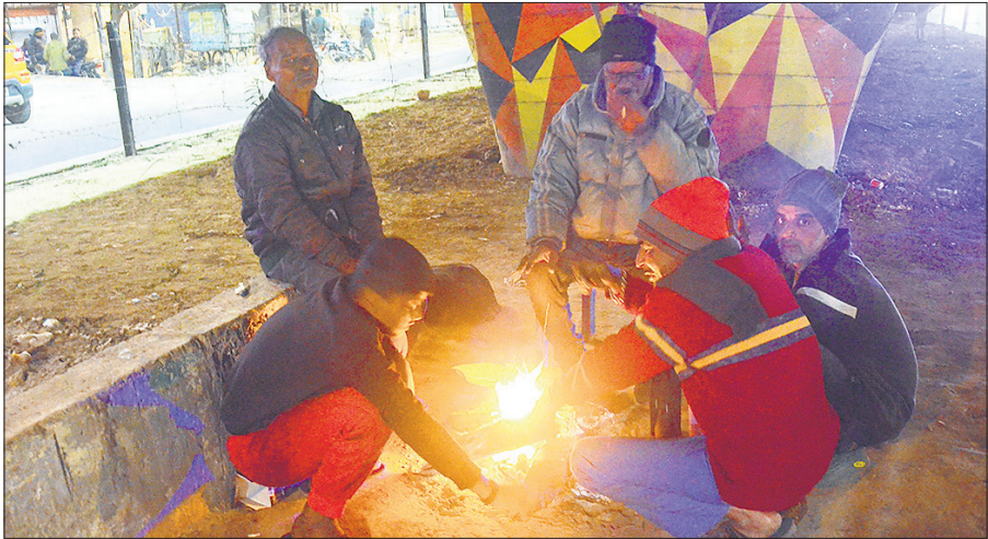
ठंड से बचने के लिए अटल सेतु के नीचे अलाव तापते लोग।

अमृत विचार : बदलते मौसम में सांस के मरीजों के साथ बुखार, खांसी, जुकाम के मरीजों की संख्या बढ़ रही है। जिला अस्पताल में सोमवार को ओपीडी में 34 सौ मरीज पहुंचे। इनमें बुखार, खांसी और सांस संबंधी मरीज अधिक रहे। अस्पताल में पचा बनवाने से लेकर डॉक्टर को दिखाने और दवा लेने के लिए मरीजों की लंबी लाइन देखने को मिली। वहीं समय से डॉक्टरों के नहीं पहुंचने पर मरीज परेशान हुए। रविवार के अवकाश के बाद सोमवार को जिला अस्पताल की ओपीडी खुली तो मरीजों की लंबी लाइन लग गई। पचा बनवाने के लिए मरीजों को धक्का-मुक्की करनी पड़ी। इस दौरान वहां मौजूद गाडों ने हस्तक्षेप कर लोगों को