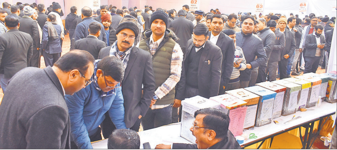
बार भवन सभागार परिसर में बार एसोसिएशन के चुनाव में मतदान करने लिए लाइन में लगे अधिवक्ता।