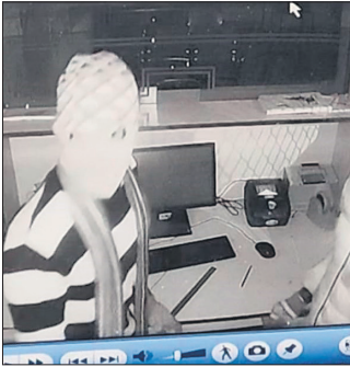
सीसीटीवी फुटेज में चेहरे पर कपड़ा बांधे दिखे चोर।

प्रबंधक ने पुलिस को सूचना दी। सूचना पर इंस्पेक्टर ने फोर्स के साथ घटनास्थल पर पहुंचकर छानबीन की। बैंक अधिकारियों का कहना है