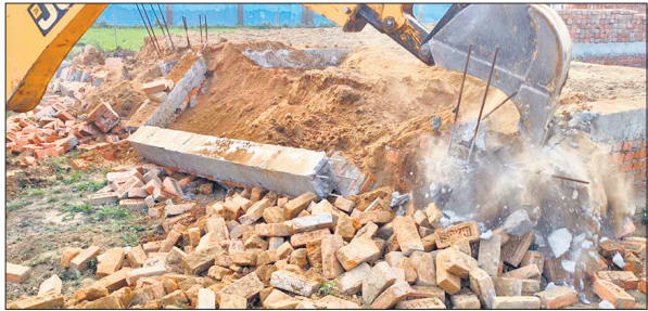
अवैध निर्माण ध्वस्त करता बुलडोजर।