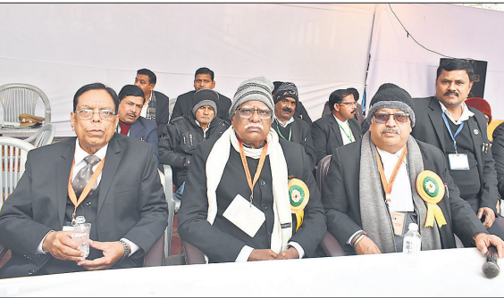
बार भवन सभागार परिसर में मौजूद चुनाव समिति के सदस्य।