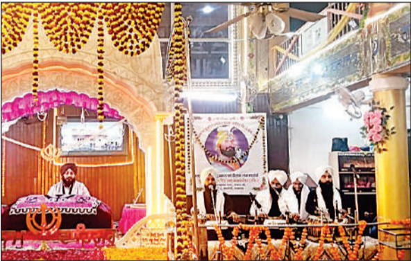
गुरुद्वारा मानसरोवर में कीर्तन करता रागी जत्था।