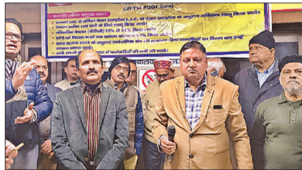
प्रदर्शन में शामिल इंश्योरेंस अधिकारी और कर्मचारी।