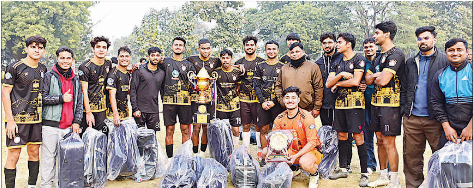
हेमवती नंदन बहुगुणा मेमोरियल फुटबॉल टूर्नामेंट में विजेता टीम टेबट्रो क्लब के खिलाड़ी।