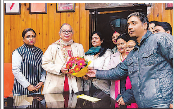
महापौर से पुष्पगुच्छ देते संयुक्त उद्योग व्यापार मंडल महिला मोर्चा के पदाधिकारी।