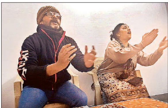
नाटक की रीहर्सल करते कलाकार।