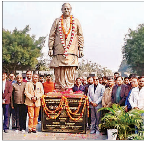
कल्याण सिंह की प्रतिमा के पास खड़े निदेशक व अन्य कर्मचारी।