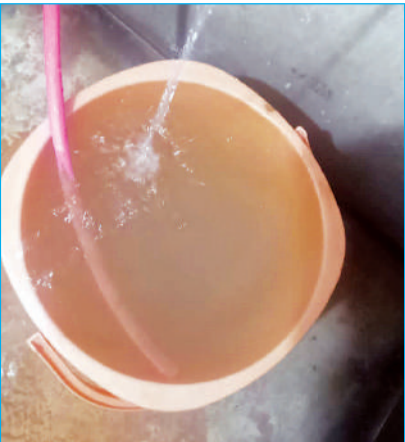
बाल्टी में भरा गंदा पानी।