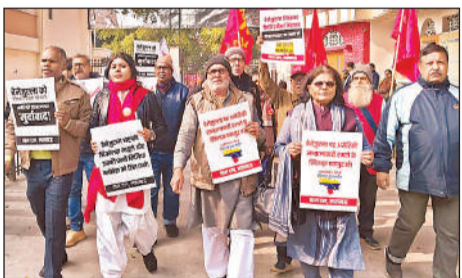
प्रदर्शन करते वामपंथी कार्यकर्ता।