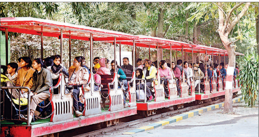
लखनऊ में तीन दिन बाद धूप निकलने पर प्राणि उद्यान में बाल ट्रेन की सवारी करते लोग।