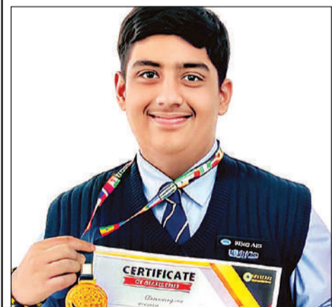
गोल्ड मेडल विजेता छात्र।