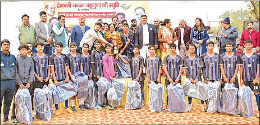
उपविजेता टीम लखनऊ फॉल्कंस के साथ आयोजक मंडल के सदस्य।

फाइनल मुकाबले की शुरुआत से ही टेबट्रो क्लब के खिलाड़ियों ने