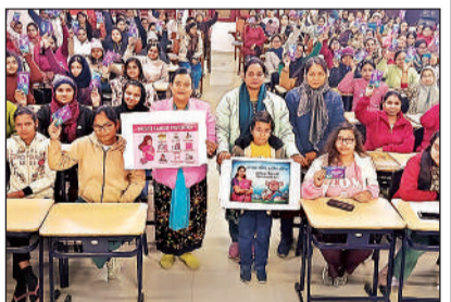
कार्यक्रम में शामिल महिलाएं और छात्राएं।