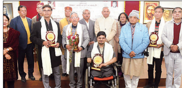
सम्मानित की गई विभूतियों के साथ आयोजक और अतिथि।