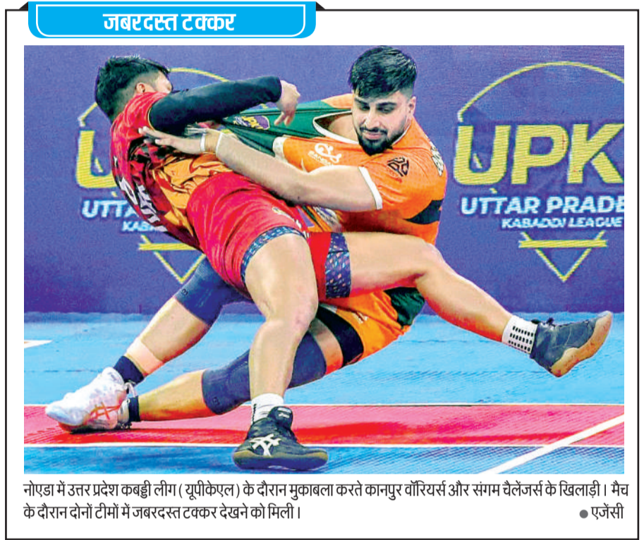
नोएडा में उत्तर प्रदेश कबड्डी लीग (यूपीकेएल) के दौरान मुकाबला करते कानपुर वॉरियर्स और संगम चैलेंजर्स के खिलाड़ी। मैच के दौरान दोनों टीमों में जबरदस्त टक्कर देखने को मिली।

भारतीय खिलाड़ियों के लिए 2025 अच्छा नहीं रहा जिसमें शीर्ष खिलाड़ी चोटों और खराब फॉर्म से जूझते रहे। अब फोकस शुरू ही से अच्छा प्रदर्शन करने पर होगी।