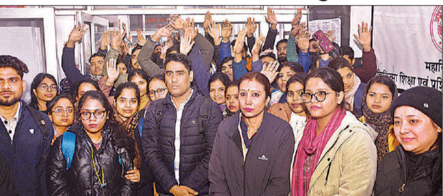
नियुक्ति पत्र की मांग को लेकर प्रदर्शन करते अभ्यर्थी।