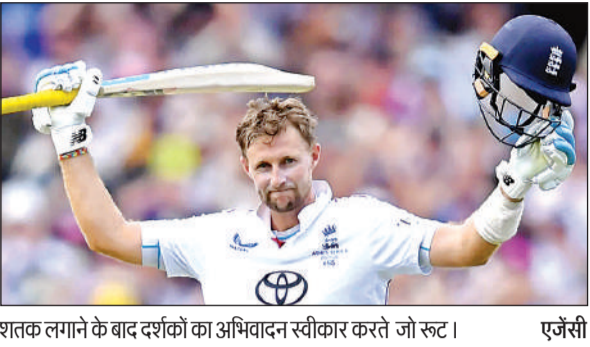
शतक लगाने के बाद दर्शकों का अभिवादन स्वीकार करते जो रूट।

सिडनी, एजेंसी जो रूट के मौजूदा एशेज श्रृंखला के दूसरे शतक से इंग्लैंड ने पांचवें टेस्ट मैच के दूसरे दिन बड़ा स्कोर बनाया लेकिन ट्रेविस हेड की आक्रामक बल्लेबाजी से ऑस्ट्रेलिया ने अपनी पहली पारी में शानदार शुरुआत की। रूट की 160 रन की पारी के बदौलत इंग्लैंड की पहली पारी चाय के विश्राम से पहले 384 रन पर सिमटी गयी। यह ऑस्ट्रेलिया में रूट का सर्वश्रेष्ठ टेस्ट स्कोर है। दिन का खेल खत्म होने तक ऑस्ट्रेलिया ने अपनी पहली पारी में दो विकेट पर 166 रन बना लिए थे। हेड 87 गेंद में 91 रन बनाकर क्रीज पर मौजूद है। वह पांच मैचों की श्रृंखला में अपने तीसरे शतक से