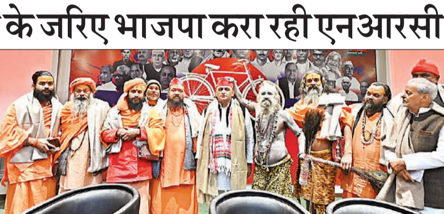
सपाप्रदेश मुख्यालय में नव वर्ष के मौके पर साधु-संतों का आशीर्वाद लेते पार्टी अध्यक्ष अखिलेश यादव।

पंचायतीराज निदेशक ने बताया कि डिजिटल लाइब्रेरी का संचालन ग्राम प्रधान और पंचायत सचिव के