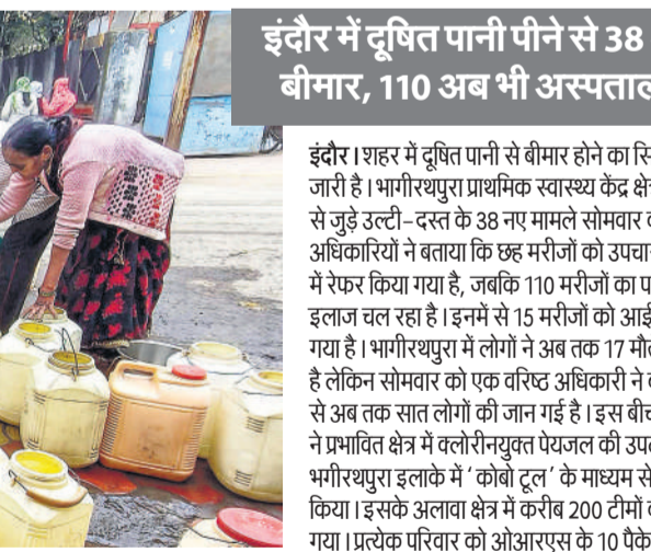
देश के सबसे स्वच्छ शहर का हाल : बीमारी से बचने को टैकर का पानी पीने के लिए इस्तेमाल कर रहे हैं लोग।

इकोसिस्टम से नहीं, बल्कि विदेश से भी बहुत सारे पत्र और संवेदनाएं प्रकट हो रही थी। कोर्ट ने दोनों के खिलाफ आरोपों को प्रथमदृष्ट्या सही माना है। उन्होंने कहा कि यह कोई संयोग नहीं बल्कि सोची समझी और हिंदू विरोध और वोटबैंक फैक्टर की सबसे बड़ी साजिश थी।