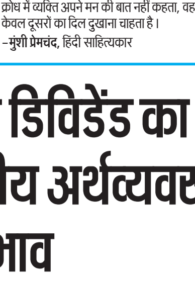
वित्तीय एवं आर्थिक विशेषज्ञ

विश्व व्यापार में बढ़ती प्रतिस्पर्धा और राजनीतिक तनावों के बीच अमेरिका ने एक नई आर्थिक सोच को जन्म दिया है, जिसे टैरिफ डिविडेंड (Tariff Dividend) कहा जा रहा है। इसका मूल विचार यह है कि जब कोई देश विदेशी वस्तुओं पर आयात शुल्क (टैरिफ) लगाकर भारी राजस्व प्राप्त करता है, तो उस राजस्व का एक हिस्सा अपने नागरिकों को सीधे ‘डिविडेंड’ या बोनस के रूप में लौटाया जाए। इससे एक ओर घरेलू उद्योग को सुरक्षा मिलती है, वहीं दूसरी ओर नागरिकों की क्रयशक्ति भी बनी रहती है। अमेरिका में इस नीति के जरिए राष्ट्रपति डोनाल्ड ट्रंप ने घोषणा की है कि यदि आयात शुल्कों से सरकार को अतिरिक्त राजस्व मिलता है, तो उसका एक हिस्सा हर नागरिक को लगभग $2,000 (करीब 1.7 लाख) तक नकद सहायता के रूप में दिया जा सकता है।