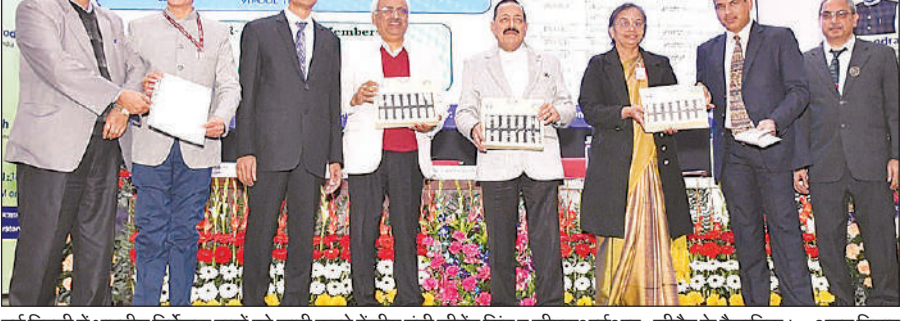
नई दिल्ली में भारतीय निदेशक द्रव्यों को जारी करते केंद्रीय मंत्री जीतेंद्र सिंह व सीएसआईआर-सीमैप के वैज्ञानिक।

कल्याण सिंह ‘बाबूजी’ की जयंती के अवसर पर उनके चित्र पर पुष्प अर्पित कर नमन करने के बाद कही। उन्होंने कहा कि मुख्यमंत्री योगी के नेतृत्व में प्रदेश सरकार बाबूजी के विचारों और आदर्शों को आगे बढ़ाते हुए जनसेवा, राष्ट्रवाद और सुशासन के मूल मंत्र पर कार्य कर रही है। युवाओं को कौशल प्रशिक्षण के माध्यम से आत्मनिर्भर बनाना, रोजगार के अवसर उपलब्ध कराना और समाज के अंतिम पायदान पर खड़े व्यक्ति तक विकास योजनाओं का लाभ पहुंचाना ही कल्याण सिंह के प्रति सच्ची श्रद्धांजलि है।