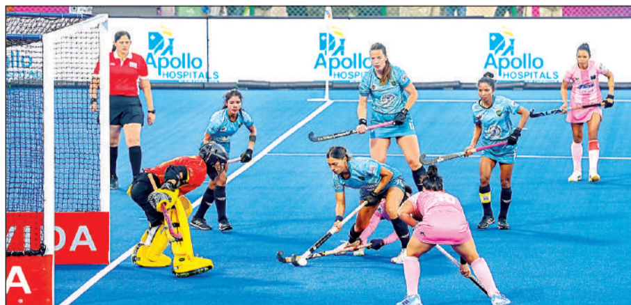
जेएसडब्ल्यू सूरमा हॉकी क्लब (गुलाबी ड्रेस) और रांची रॉयल्स के खिलाड़ी।

खिलाड़ी अविनाश साबले, बाधा दौड़ की खिलाड़ी ज्योति याराजी, डेकाथलन के तेजस्विन शंकर और फर्राट धावक अनिमेष कुजूर जैसे बड़े नाम शामिल हैं। विश्व डोपिंग रोधी एजेंसी (वाडा) की आरटीपी सूची से बाहर होने के बाद साबले को नाडा की सूची में शामिल किया गया है। वाडा की सूची में अब सिर्फ भाला फेंक के दिग्गज खिलाड़ी नीरज चोपड़ा और सचिन यादव ही शामिल हैं। चौदह क्रिकेटर इस सूची का हिस्सा हैं जिसमें स्मृति और जेमिमा के अलावा सूर्यकुमार यादव और संजू सैमसन शामिल हैं।