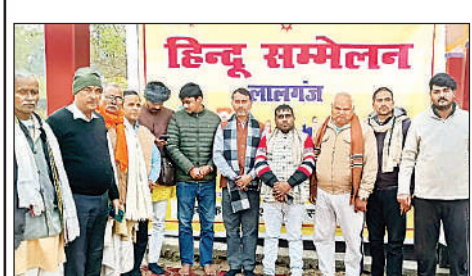
हिंदू सम्मेलन में मौजूद लोग।