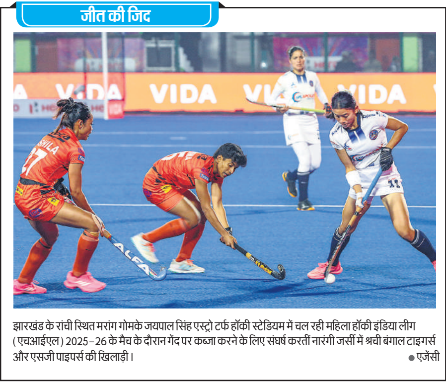
झारखंड के रांची स्थित मरांग गोमक जयपाल सिंह एस्ट्री टर्फ हॉकी स्टेडियम में चल रही महिला हॉकी इंडिया लीग (एचआईएल) 2025-26 के मैच के दौरान गेंद पर कब्जा करने के लिए संघर्ष करतीं नारंगी जर्सी में श्रीवी बंगाल टाइगर्स और एसजी पाइपर्स की खिलाड़ी।

और बड़ौदा के 16-16 अंक हैं और एक-एक मैच शेष हैं। तीनों टीमों क्वार्टर फाइनल में पहुंचने की दौड़ में हैं।