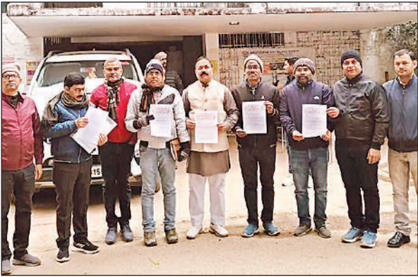
स्थानान्तरण व समायोजन में मनमानी का आरोप लगाते हुए प्रदर्शन करते शिक्षक ।

गया है। समायोजन में संविदा पर कार्यरत शिक्षामित्रों व अनुदेशकों की शिक्षक के रूप में गणना की गई है, जो पूर्व में निर्गता विभागीय आदेशों/निर्देशों के विधि विरुद्ध है। प्रदेश के अधिकांश जनपदों में सरप्लस शिक्षकों से विकल्प लेकर विद्यालय आवंटित किये गए हैं, जबकि जिले में बिना विकल्प लिए ही गुपचुप तरीके से शिक्षकों को अन्य विद्यालयों में समायोजित कर दिया गया है। उन्होंने बताया कि सरंेनी ब्लॉक में प्राथमिक विद्यालय भोपपुर में छात्र संख्या