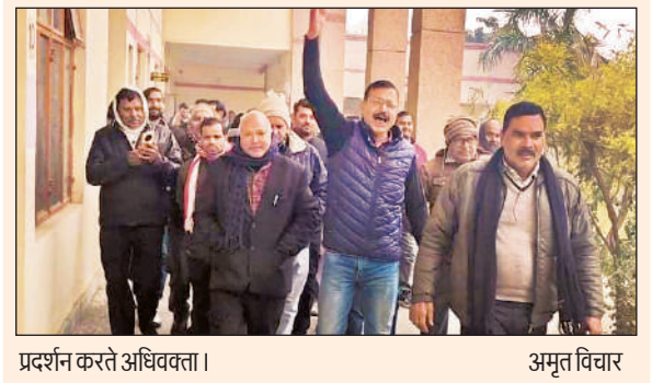
प्रदर्शन करते अधिवक्ता।