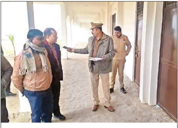
स्कूल के कमरे की जांच करते अधिकारी।