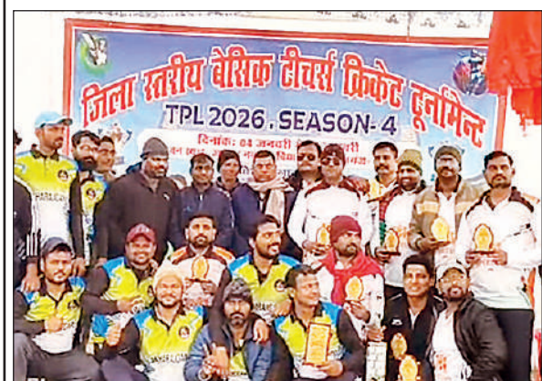
पुरस्कृत किए गए विजेता खिलाड़ी व मौजूद अतिथि।