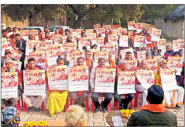
स्मृति ईरानी की तस्वीर वाले कैलेंडर के साथ मौजूद कार्यकर्ता व ग्रामीण।