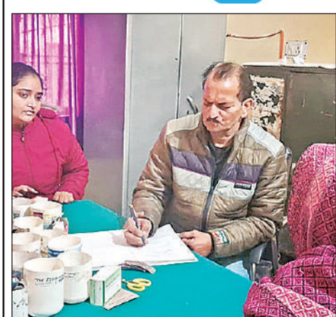
पीएचसी में ओपीडी करते फार्मासिस्ट।