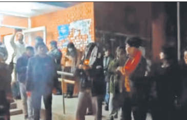
नारेबाजी करते जेएनयू के छात्र।