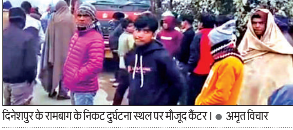
दिनेशपुर के रामबाग के निकट दुर्घटना स्थल पर मौजूद कैटर।