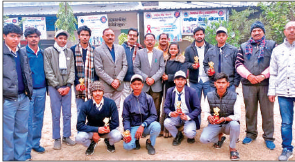
शिविर में उत्कृष्ट सेवा देने वाले स्वयं सेवकों के साथ अतिथि।