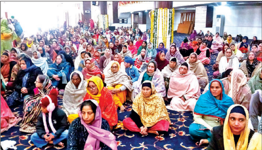
बाजपुर के गुरुद्वारा साहिब में समागम के दौरान मौजूद संगत।