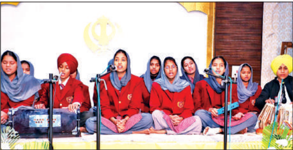
गुरुवाणी का यशगान करते श्रीदशमेश स्कूल के बच्चे।