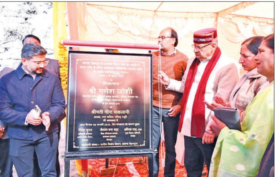
भट्टा फॉल में वे साइड एमेनिटीज का शिलान्यास करते केबिनेट मंत्री गणेश जोशी। ● अमृत विचार

कैबिनेट मंत्री जोशी ने कहा कि क्लस्टर लेवल फेडरेशन से महिलाओं को आत्मनिर्भर बनाने की दिशा में राज्य सरकार लगातार काम कर रही है। जल्द ही सुवाखोली क्षेत्र में भी वे-साइड एमेनिटीज खोला जाएगा, जिससे अधिक से अधिक महिलाओं को आजीविका के अवसर उपलब्ध कराए जा सकें। उन्होंने निर्माण को निर्धारित समयसीमा के भीतर पूर्ण करने के निर्देश देते हुए कहा कि वे-साइड एमेनिटीज के साथ-साथ महिलाओं के संचालित