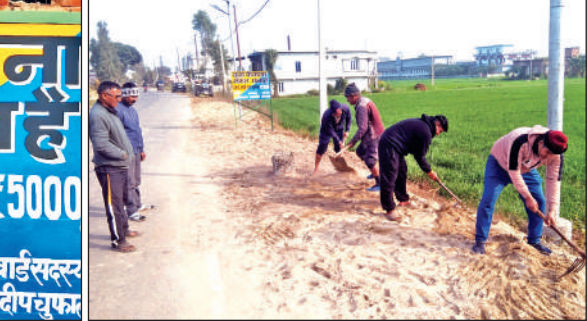
गांव को स्वच्छ बनाने के संकल्प के साथ सफाई करते युवा।

बोर्ड लगाकर मुख्य मार्ग पर कूड़ा डालने को प्रतिबंधित कर दिया गया है। भविष्य में इस स्थान को सुरक्षित रखने के लिए यहां ओपन जिम और बैठने के लिए सीमेंटेड कुर्सियां लगाने की योजना है, ताकि युवा नशे से दूर रहकर स्वास्थ्य पर