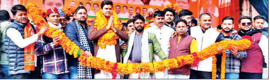
खटीमा में भाजपा के नवनियुक्त पदाधिकारियों का स्वागत करते भाजयुमो कार्यकर्ता। ● अमृत विचार

भाजयुमो के नवनियुक्त पदाधिकारी का कार्यक्रमताओं ने सितारगंज रोड स्थित टोल प्लाजा पर स्वागत करते हुए रैली के रूप में रामलीला ग्राउंड पहुंचे। रामलीला मैदान में कार्यकर्ताओं ने नवनियुक्त पदाधिकारी का फूल मालाओं से स्वागत किया। इस अवसर पर नगर पालिका