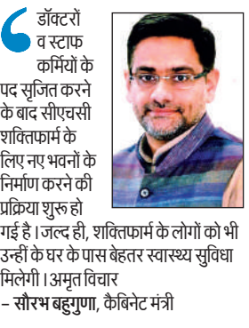
डॉक्टरों व स्टाफ कर्मियों के पद सुजित करने के बाद सीएचसी शक्तिफार्म के लिए नए भवनों के निर्माण करने की प्रक्रिया शुरू हो गई है। जल्द ही, शक्तिफार्म के लोगों को भी उन्हीं के घर के पास बेहतर स्वास्थ्य सुविधा मिलेगी। – सौरभ बहुगुणा, कैबिनेट मंत्री