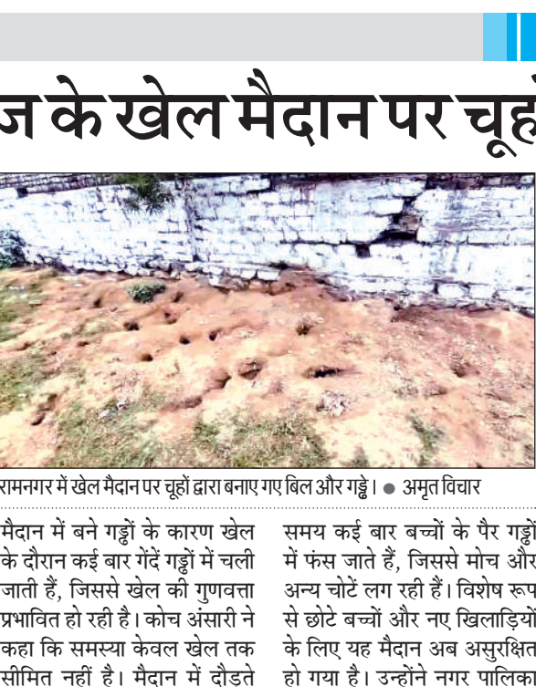
रामनगर में खेल मैदान पर चूहों द्वारा बनाए गए बिल और गड्ढे।