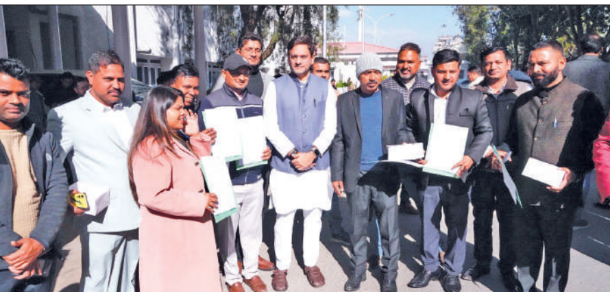
विधानसभा स्थित सभागार कक्ष में कार्मिकों को नियुक्ति पत्र सौंपते केबिनेट मंत्री सौरभ बहुगुणा। ● अमृत विचार

नए एक्ट में महिला सशक्तिकरण पर विशेष फोकस