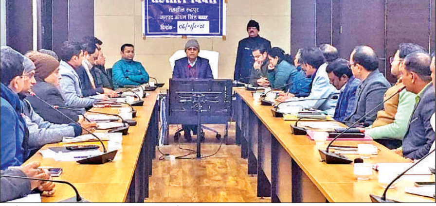
तहसील दिवस के दौरान अधिकारियों को निर्देश देते डीएम। ● अमृत विचार

अमृत विचार: नये साल के पहले मंगलवार को जिलाधिकारी नितिन सिंह भदौरिया की अध्यक्षता में तहसील रुद्रपुर का तहसील दिवस जिला सभागार में आयोजित हुआ। इस दौरान आधार कार्ड, राशन कार्ड, बिजली, भूमि से संबंधित 10 शिकायतें पंजीकृत हुईं। इसमें 7 शिकायतों का मौके पर ही निस्तारण किया गया। मंगलवार को तहसील दिवस के दौरान जिलाधिकारी ने कहा कि जनता की समस्याओं का त्वरित निस्तारण सरकार की प्राथमिकता है। इसलिए अधिकारी समस्याओं का निस्तारण निर्धारित समय सीमा के भीतर करें। उन्होंने कहा कि समस्या जिस स्तर की है उसी स्तर पर समाधान करें। ताकि लोगों को अनावश्यक परेशानी का सामना न करना पड़े। उन्होंने कहा कि सभी विभागीय अधिकारी नई ऊर्जा, उमंग के साथ समन्वय बनाकर कार्य करते हुए जनता को योजनाओं से लाभान्वित करें। उन्होंने कहा कि सभी अधिकारी शिविरों में अनिवार्य रूप से प्रतिभाग करें व अपने-अपने