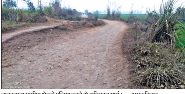
नानकमता ग्रामीण क्षेत्र में पुलिया टूटने से क्षतिग्रस्त मार्ग। ● अमृत विचार

नानकमता: क्षेत्र में शासन-प्रशासन की लापरवाही ग्रामीणों पर भारी पड़ रही है। एक वर्ष पूर्व भारी बारिश और देवहा नदी के उफान के कारण टुकड़ी बिचुआ और बिचई गांव को जोड़ने वाली पक्की पुलिया धराशायी हो गई थी। आज एक साल बीत जाने के बाद भी पुलिया का निर्माण नहीं हो सका है।