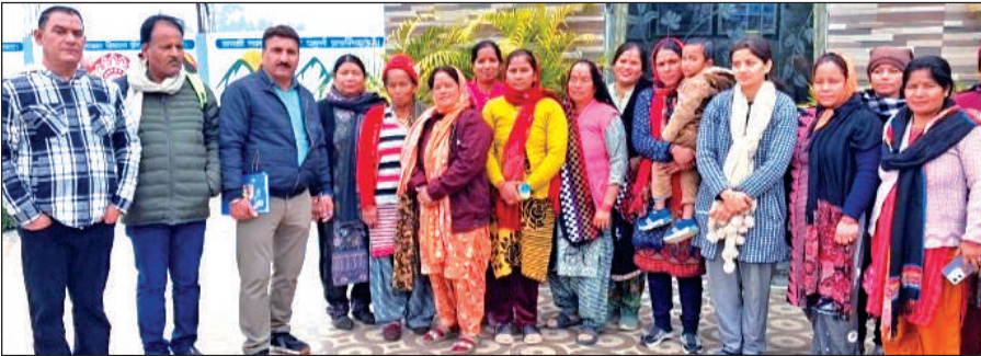
खटीमा के झनकट में बैठक के बाद समूह की महिलाएं और अधिकारी।