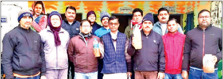
खटीमा के जल संस्थान कार्यालय में दूषित पानी लेकर पहुंचे वार्डवासी। ● अमृत विचार