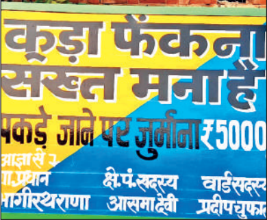
गौझरिया पटिया गांव में कूड़ा न डालने का लगा बोर्ड।