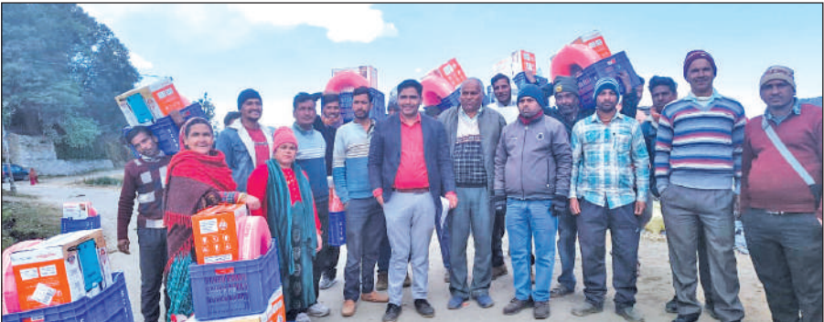
ग्राम सभा भुमका में आयोजित कृषि प्रशिक्षण कार्यक्रम के तहत लाभान्वित ग्रामीण ।● अमृत विचार