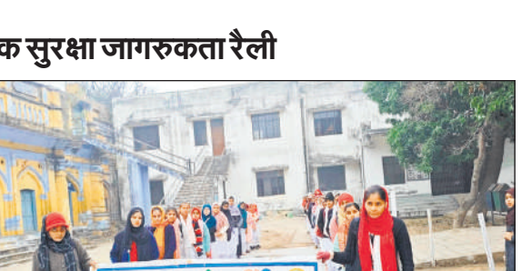
रजिस्टर, त्योहार रजिस्टर, मालखाना रजिस्टर, विवेचना रजिस्टर, पलाई शीट आदि एवं उनके रख-रखाव, साफ-सफाई, उनमें अंकित की जाने वाली प्रविष्टियों को चेक किया। साथ ही थाना परिसर में बने कार्यालय, मालखाना, भोजनालय, हवालात, कम्प्यूटर कक्ष, मिशन शक्ति केंद्र, साइबर सेल आदि की साफ-सफाई का जायजा लिया। उन्होंने संबंधित अधिकारियों को निर्देश दिए।

सड़क सुरक्षा के सम्बंध में जागरूक किया गया और सभी ने शपथ ली कि हम सड़क पर सदैव यातायात नियमों का पालन करेंगे तथा सुरक्षित यात्रा हेतु सदैव दो पहिया वाहन चलाते समय स्वयं व पीछे बैठे व्यक्ति को बीस मानक वाले हेलमेट अवश्य पहनने व पहनायेंगे। चार पहिया वाहन चलाते समय हमेशा सीट बेल्ट लगायेंगे, लेन ड्राइविंग के नियमों का पालन करेंगे। तेज रफता से वाहन नहीं चलायेंगे। गलत दिशा में वाहन नहीं चलायेंगे। वाहन चलाते समय मोबाइल फोन का प्रयोग नहीं करेंगे। सड़क दुर्घटना में घायल व्यक्तियों की मदद के लिए तत्पर रहेंगे।