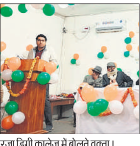
रजा डिग्री कालेज में बोलते वक्ता।

उप जिला निर्वाचन अधिकारी ने उपस्थित अधिकारियों, बीएलओ तथा निर्वाचन कार्य से सम्बंधित अन्य सभी कर्मचारियों को सभी पात्र निर्वाचकों के नाम निर्वाचक नामावली में सम्मिलित करने के निर्देश दिए। उप जिला अधिकारी सदर ने मतदाता पंजीकरण के लिए फार्म 6, फार्म 6