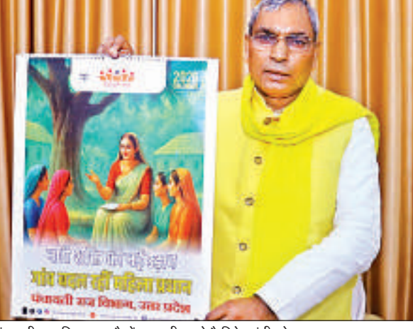
पंचायती राज विभाग का कैलेंडर जारी करते कैबिनेट मंत्री ओमप्रकाश राजभर।

जब पंचायतों में महिलाएं सशक्त होंगी और निर्णय प्रक्रिया में सक्रिय भूमिका निभाएंगी, तभी गांवों का समग्र विकास संभव होगा। यह कैलेंडर महिला हितैषी सोच को जन-जन तक पहुंचाने का सशक्त माध्यम बनेगा।