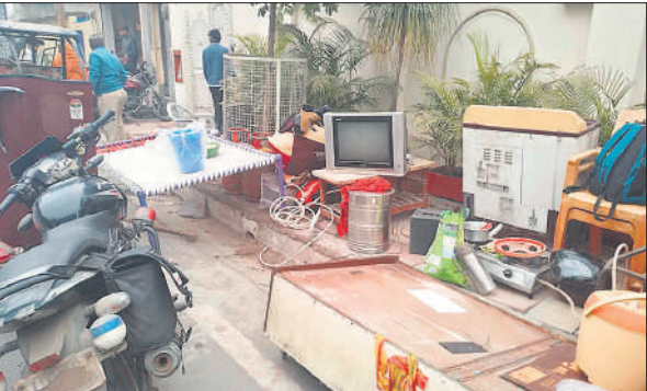
मकान टूटने के बाद फुटपाथ पर रखा एक परिवार को घरेलू सामान।