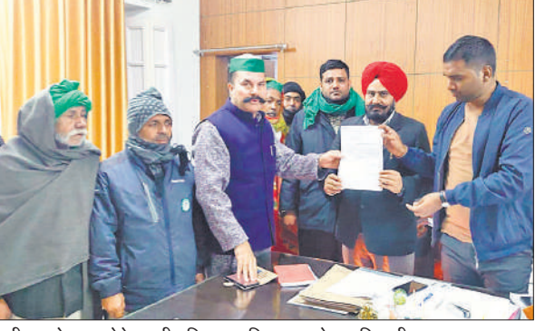
एडीएम को ज्ञापन देते भारतीय किसान यूनियन भानू के पदाधिकारी।

सरकार से छुट्टा पशुओं के लिए काफी धन आ रहा है, इसके बावजूद ये हालात हैं। अब तक बावपुर जिले में दर्जनों मौतें छुट्टा पशुओं से टकराने में किसान मजदूर एवं व्यापारियों की हो चुकी हैं। इन पशुओं को गोशालाओं में भिजवाए अधिकारी कुछ लोग गो माता के नाम पर किसान मजदूर को ब्लैकमेल कर रहे हैं। अगर कोई किसान अपने खेत में से छुट्टा पशुओं को निकलता है