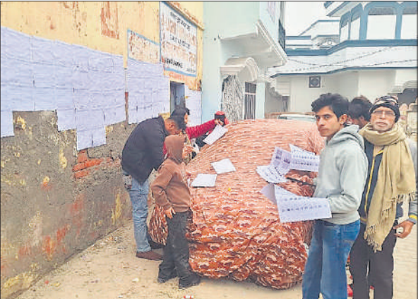
एक मतदान केंद्र के बाहर मतदाता सूचियों का अवलोकन करते लोग।