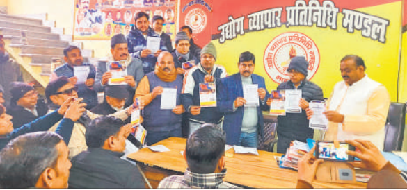
गोष्ठी में व्यापारियों के साथ परिवहन विभाग के अधिकारी।