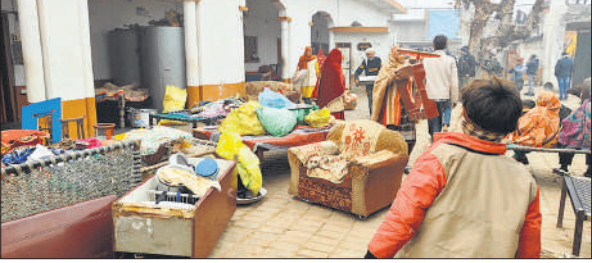
बुलडोजर पहुंचने पर घर का सामान निकालते परिवार के लोग।

यह था मामला: थाना असमोली क्षेत्र के गांव राया बुजुर्ग में गाटा संख्या 682 रकबा 0.88 हेक्टेयर की 880 वर्ग मीटर तालाब के नाम पर दर्ज है लेकिन इस जमीन पर कब्जा कर तीन मकान बना लिये गये। लेखपाल ने 5 नवंबर 2022 को अवैध कब्जा चिन्हित करते हुए नोटिस जारी किये। 14 नवंबर 2024 तक तहसीलदार न्यायालय में मुकदमा चलता रहा। तहसीलदार न्यायालय से 4 फरवरी 2025 को बंदखली का आदेश हुआ और इसके बाद अपील जिलाधिकारी न्यायालय