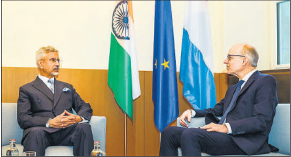
लक्जमबर्ग के प्रधानमंत्री ल्यूक फ्रीडेन के साथ विदेश मंत्री जयशंकर ।

लक्जमबर्ग की यात्रा पर गये विदेश मंत्री डा. एस जयशंकर ने मंगलवार को प्रधानमंत्री ल्यूक फ्रीडन से मुलाकात की और निवेश , प्रौद्योगिकी और नवाचार के क्षेत्रों में सहयोग पर बातचीत की। मुलाकात के बाद डा. जयशंकर ने सोशल मीडिया पर एक पोस्ट में यह जानकारी दी। उन्होंने कहा कि आज सुबह लक्ज़मबर्ग के प्रधानमंत्री ल्यूक फ्रीडन से मिलकर प्रसन्नता हुई। प्रधानमंत्री नरेंद्र मोदी की ओर से