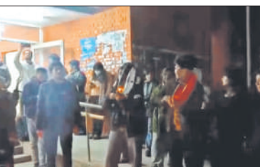
नारेबाजी करते जेएनयू के छात्र।

● जेएनयू ने पुलिस से मामले में प्राथमिकी दर्ज करने का आग्रह किया