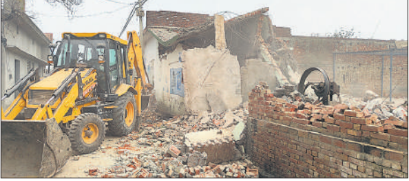
राया बुजुर्ग गांव में तालाब की जमीन पर बने मकान को तोड़ता बुलडोजर।

राया बुजुर्ग गांव में सरकारी जमीनों को कब्जा मुक्त करने की कवायद बीते साल 2 अक्टूबर को की गई थी। तब सरकारी जमीन पर बनी गांव की गोसुलवरा मस्जिद और जनता मैरिज हॉल को तोड़ने के लिए अफसर पहुंचे थे। मस्जिद के निर्माण तोड़ने के लिए मुस्लिम समुदाय के लोगों ने चार दिन का समय ले लिया था लेकिन मैरिज हाल को बुलडोजर से तोड़ दिया गया था। इसके बाद कुछ हिस्सा तोड़कर मुसलमानों ने खुद बाकी मस्जिद नहीं तोड़ी तो तीन दिन पहले मस्जिद के बाकी हिस्से को प्रशासनिक