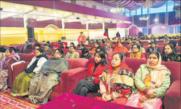
उत्सव पैलेस में श्रीमद्भागवत कथा में पूजन करते लोग।