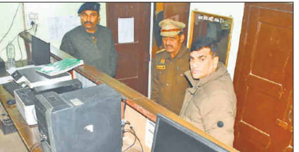
रजिस्टर, त्योहार रजिस्टर, मालखाना रजिस्टर, विवेचना रजिस्टर, पलाई शीट आदि एवं उनके रख-रखाव, साफ-सफाई, उनमें अंकित की जाने वाली प्रविष्टियों को चेक किया। साथ ही थाना परिसर में बने कार्यालय, मालखाना, भोजनालय, हवालात, कम्प्यूटर कक्ष, मिशन शक्ति केंद्र, साइबर सेल आदि की साफ-सफाई का जायजा लिया। उन्होंने संबंधित अधिकारियों को निर्देश दिए।