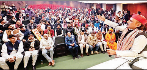
सपा मुख्यालय लखनऊ में प्रदेश के विभिन्न जिलों से आये कार्यकर्ताओं और नेताओं को संबोधित करते अखिलेश यादव।

जनता 2027 में भाजपा को हटाने का निश्चय कर चुकी है। मंगलवार को समाजवादी पार्टी के राज्य मुख्यालय लखनऊ में प्रदेश के विभिन्न जिलों से आये कार्यकर्ताओं और नेताओं से मुलाकात के बाद अखिलेश यादव ने कहा कि एसआईआर में निर्वाचन आयोग की विश्वसनीयता पर प्रश्नचिह्न लगा है। भाजपा लोकतंत्र को कमजोर कर रही है। हर मतदाता का नाम मतदाता सूची में जुड़वाये। पार्टी के सभी लोग बूथ पर मजबूती से जुटे। सपा प्रमुख ने कहा कि 2027 में प्रदेश में समाजवादी पार्टी की सरकार