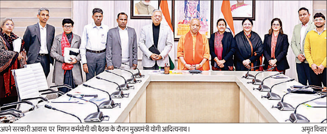
अपने सरकारी आवास पर मिशन कर्मयोगी की बैठक के दौरान मुख्यमंत्री योगी आदित्यनाथ।

मुख्यमंत्री योगी ने निर्देश दिए कि सभी विभाग अपनी आवश्यकताओं के अनुरूप पाठ्यक्रम तैयार कर आईगॉट पोर्टल पर अपलोड करें। उपाम सहित सभी प्रशिक्षण केंद्रों में समयानुकूल कैपेसिटी बिल्डिंग कोर्स विकसित किए जाएं। उन्होंने पाठ्यक्रमों में एआई