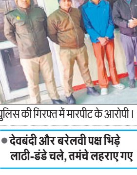
पुलिस की गिरफ्त में मारपीट के आरोपी।