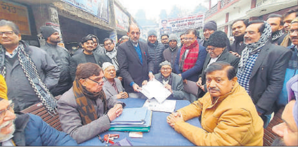
कचहरी में मंगलवार को नामांकन कराते अधिवक्ता।