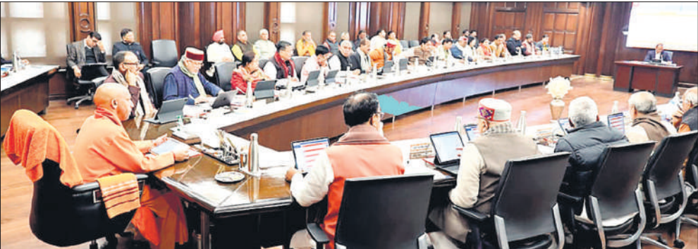
लोकभवन में मंत्रिमंडल के बैठक की अध्यक्षता करते मुख्यमंत्री योगी।

स्टाम्प एवं रजिस्ट्रेशन अनुभाग-2 की 3 अगस्त 2023 की अधिसूचना के माध्यम