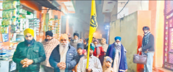
स्वार में प्रभात फेरी निकालती सिख संगत।