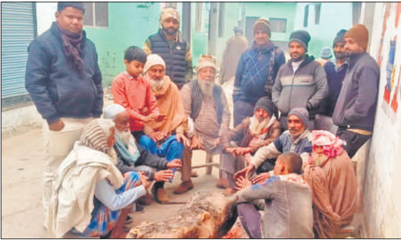
व्योलडिया में शीत लहर से बचाव के लिए अलाव तापते ग्रामीण।

ठंड का असर सिर्फ ईंसानों तक सीमित नहीं रहा। छुट्टा पशु भी सर्दी से बेहाल रहे। उन्हें न तो कहीं ठहरने की जगह मिली और न ही ठंड से बचाव का कोई इंतजाम। सड़कों और खेतों के किनारे पशु ठिठुरते नजर आए। घने कोहरे से दृश्यता बेहद कम रही, जिससे आवागमन प्रभावित हुआ वाहन चालकों को भी परेशानी हुई। प्रशासन से अलाव व्यवस्था बढ़ाने की मांग की जा रही है।