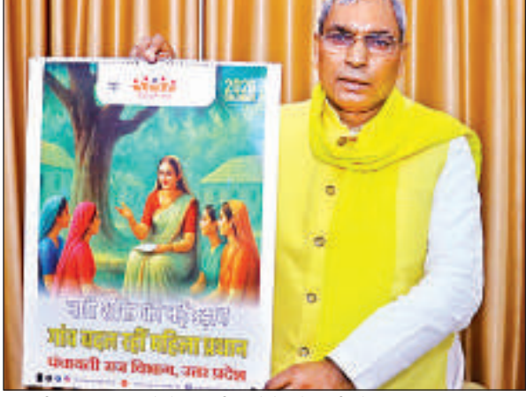
पंचायती राज विभाग का कैलेंडर जारी करते कैबिनेट मंत्री ओम्प्रकाश राजभर।

जब पंचायतों में महिलाएं सशक्त होंगी और निर्णय प्रक्रिया में सक्रिय भूमिका निभाएंगी, तभी गांवों का समग्र विकास संभव होगा। यह कैलेंडर महिला हितैषी सोच को जन-जन तक पहुंचाने का सशक्त माध्यम बनेगा।