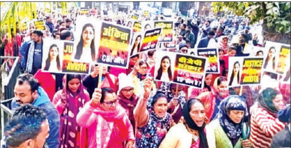
खटीमा में जुलूस निकालकर प्रदर्शन करते कांग्रेसी।

किच्छा में सैकड़ों कांग्रेसियों ने कैडल मार्च निकालकर प्रदेश सरकार के खिलाफ जमकर नारेबाजी की। इस दौरान कांग्रेसियों ने अंकिता हत्याकांड मामले की सीबीआई जांच तथा घटना में शामिल वीआईपी का नाम उजागर कर उसके खिलाफ कानूनी कार्रवाई करने की मांग की। कांग्रेसियों ने प्रदेश सरकार पर जनता