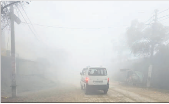
नवाबगंज में सुबह अत्यधिक कोहरे से मार्ग पर दृश्यता कम रही।