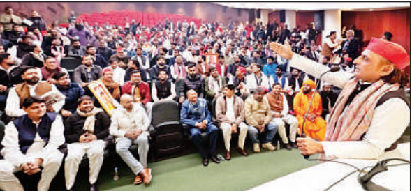
सपा मुख्यालय लखनऊ में प्रदेश के विभिन्न जिलों से आये कार्यकर्ताओं और नेताओं को संबोधित करते अखिलेश यादव।

जनता 2027 में भाजपा को हटाने का निश्चय कर चुकी है। मंगलवार को समाजवादी पार्टी के राज्य मुख्यालय लखनऊ में प्रदेश के विभिन्न जिलों से आये कार्यकर्ताओं और नेताओं से मुलाकात के बाद अखिलेश यादव ने कहा कि एसआईआर में निर्वाचन आयोग की विश्वसनीयता पर प्रश्नचिह्न लगा है। भाजपा लोकतंत्र को कमजोर कर रही है। हर मतदाता का नाम मतदाता सूची में जुड़वाये। पार्टी के सभी लोग बूथ पर मजबूती से जुटे। समा प्रमुख ने कहा कि 2027 में प्रदेश में समाजवादी पार्टी की सरकार