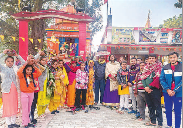
कलश यात्रा में शामिल श्रद्धालु।