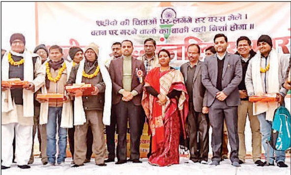
समारोह में सम्मानित शहीदों के परिजन और सीडीओ अंजुलता।

किसानों ने एक बड़ा आन्दोलन किया, जिसमें कई किसान शहीद हुए। उन्होंने कहा कि यह आजादी हमारे पूर्वजों के अथक संघर्षों के बाद मिली है। हम सभी को इसका महत्व समझना चाहिए। उन्होंने शहीदों को नमन करते हुए कहा कि हमें राष्ट्र के प्रति अपने कर्तव्यों को पूर्ण निष्ठा के साथ पूरा करना चाहिए। उन्होंने कहा कि आजादी की कीमत हम सबको समझनी चाहिए। हमें अपने पूर्वजों द्वारा दिये गये बलिदान का सम्मान