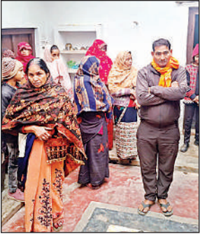
हमले के बाद भीयभीत परिजन।

जानकारी के मुताबिक मंगलवार देर रात करीब एक बजे हिलहा ग्राम में पवन बाजपेई के घर, की छत पर चढ़े तीन अज्ञात बदमाश रस्सी