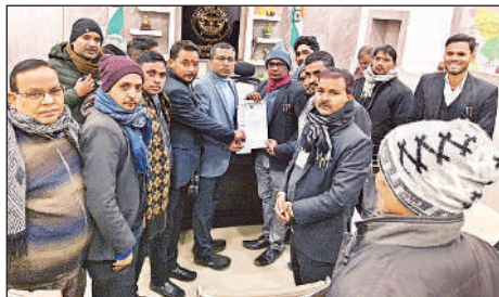
एडीएम को ज्ञापन सौंपते अधिवक्ता।