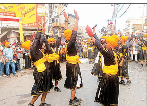
प्रकाश पर्व के दौरान शोभा यात्रा निकालता सिख समुदाय।