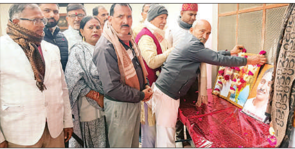
कार्यक्रम का शुभारंभ करते अतिथि।