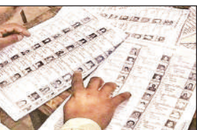
● प्रशासन द्वारा दावे और आपत्तियों को लेकर दिया जा रहा मौका

आंकड़ों पर नजर डाली जाए तो सदर विधानसभा क्षेत्र की मतदाता सूची में सबसे अधिक कटौती हुई। 1 लाख 28 हजार 597 नाम हटाए गए। ऐसे में 2 लाख 74 हजार 392