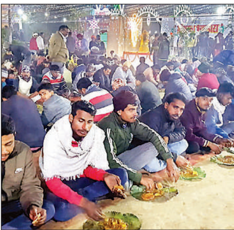
आयोजित भंडारे में प्रसाद ग्रहण करते श्रद्धालु।