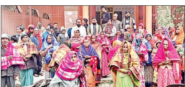
कंबल वितरण के दौरान मौजूद प्रबुद्ध जन।