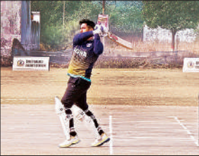
शॉट लगाता खिलाड़ी।