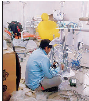
डेंटल चेयर इंस्टाल करते कर्मी।