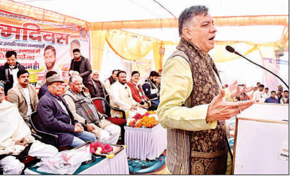
कार्यक्रम को संबोधित करते विधानसभा अध्यक्ष सतीश महाना।

विधानसभा अध्यक्ष सतीश महाना ने कहा कि जिस स्थान पर देवता बसते हैं, वहीं आजाद जैसे महान नायक जन्म लेते हैं। उन्होंने कहा आजादी के लिए असंख्य लोगों ने बलिदान दिया, जिसमें आजाद और भगत सिंह की टोली का नाम प्रमुख है। उस दौर में अंग्रेजी हुकूमत के सरकारी धन को लूटकर देश की आजादी पर खर्च करना ही सबसे बड़ी राष्ट्रभक्ति थी। आज के डिजिटल युग में हमें