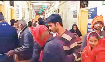
जिला अस्पताल में लगी मरीजों की भीड़।

संवाददाता, उन्नाव : जिला अस्पताल में अंधता निवारण योजना के तहत होने वाले निशुल्क मोतियाबिंद ऑपरेशन पिछले एक सप्ताह से पूरी तरह से बंद हैं। इसका कारण है, अस्पताल में ऑपरेशन से जुड़ी सामग्री का न होना है। इस कमी के चलते गरीब मरीजों को या तो निजी अस्पतालों और जाना पड़ रहा या फिर इलाज के लिए कानपुर की दौड़ लगानी पड़ रही है। जिला अस्पताल की बर्न यूनिट में संचालित नेत्र विभाग में इन दिनों मरीजों की भीड़ अधिक रहती है। आंकड़ों के अनुसार, रोजाना औसतन 160 मरीज आंखों की समस्या लेकर पहुंच रहे हैं। परीक्षण के बाद इनमें से लगभग 10 मरीजों को मोतियाबिंद के ऑपरेशन की सलाह दी जा रही है। लेकिन ऑपरेशन थिएटर में जरूरी सामान न होने के कारण डॉक्टर हाथ खड़े कर रहे हैं और मरीजों को एक-एक महीने बाद की तारीख दी जा रही है। मरीजों का कहना है कि मोतियाबिंद के ऑपरेशन के लिए सर्दियों का समय सबसे ठीक होता है, क्योंकि इसमें संक्रमण का खतरा कम रहता है। सरकारी अस्पताल में सुविधा न मिलने के कारण मजबूरन मरीजों को निजी अस्पतालों का रुख करना पड़ रहा है। 10 हजार रुपये तक वसूले जा रहे हैं। सक्षम लोग तो निजी अस्पतालों में जा रहे हैं, लेकिन आर्थिक रूप से कमजोर मरीज बिना इलाज के घर लौटने को मजबूर हैं। इस पर प्रभारी सीएमओ डॉ. एचएन प्रसाद ने बताया कि सीएमएस को इस संबंध में निर्देशित किया जा चुका है। सामग्री की कमी को दूर करने के लिए मांगपत्र बनाकर भेजा गया है। उम्मीद है कि जल्द ही आवश्यक सामान उपलब्ध करा दिया जाएगा और ऑपरेशन दोबारा शुरू होगा।