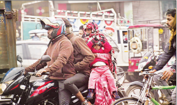
सर्दी से बचने के लिए ऊनी वस्त्र पहनकर जाते बाइक सवार लोग।