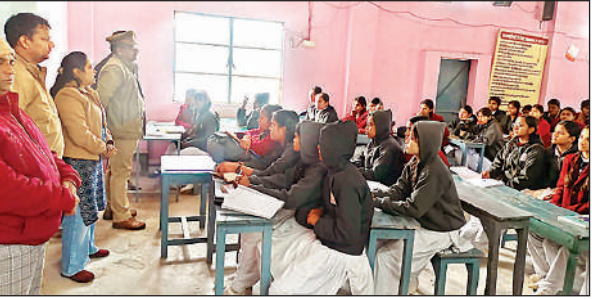
साइबर सुरक्षा पाठशाला में छात्र-छात्राओं को जागरूक करती पुलिस टीम।