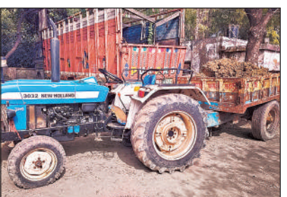
थाने में खड़े सीज की गई ट्रैक्टर-ट्रॉली।