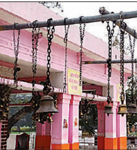
शंकरपुर स्थित मां दुर्गा मंदिर में चोरी हुए घंटे।