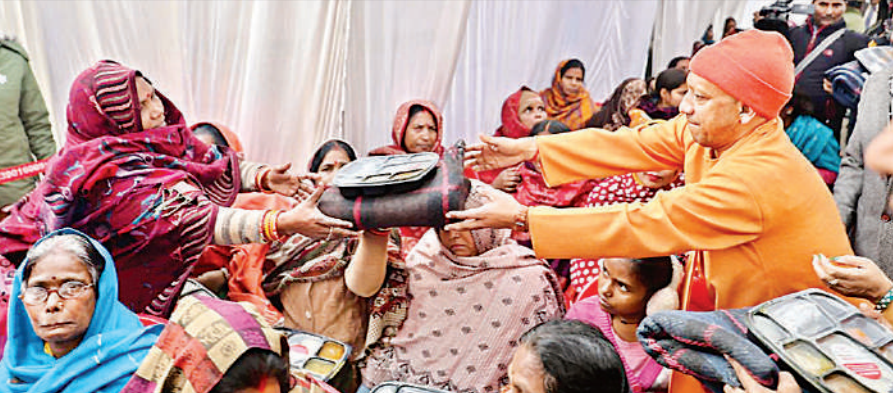
गोरखपुर के एक रैन बसेरे में लोगों को खाना और कंबल वितरित करते मुख्यमंत्री योगी आदित्यनाथ।

व्यापक इंतजाम : मीडिया से बातचीत में मुख्यमंत्री योगी आदित्यनाथ ने कहा कि मौजूदा समय में शीतलहर का प्रकोप गंभीर है। इससे निपटने के लिए प्रदेश