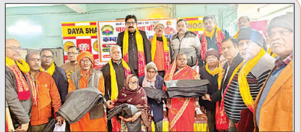
जरूरतमंदों को कंबल देते भारत विकास परिषद के पदाधिकारी।