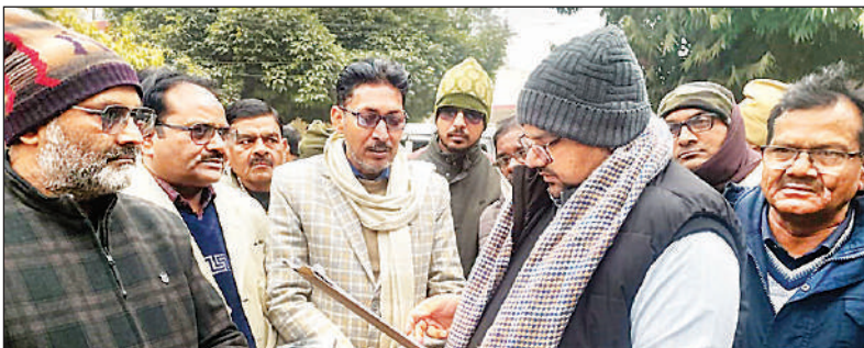
ज्ञापन सौंपते शिक्षक।