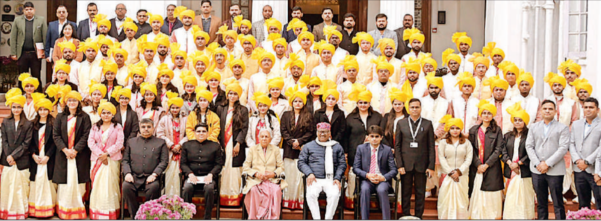
राजभवन में ‘विकसित भारत यंग लीडर्स डायलॉग- 2026’ के लिए चयनित प्रदेश के 79 युवाओं के साथ राज्यपाल आनंदीबेन पटेल, साथ में अन्य।

राज्यपाल ने कहा कि भारत की समृद्ध सांस्कृतिक परंपराओं का वैश्विक स्तर पर प्रसार समय की आवश्यकता है। भाषा के महत्व पर जोर देते हुए उन्होंने कहा कि नया भारत और नई दुनिया केवल एक या दो भाषाओं से नहीं चल