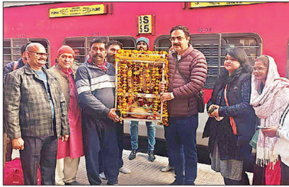
शिरडी के लिए रवाना होती पालकी यात्रा, मौजूद भक्त।