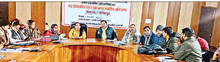
कार्यक्रम के दौरान उपस्थित नायब तहसीलदार व अन्य।