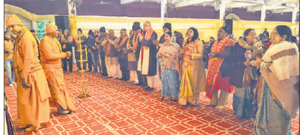
कथा में पूजन के दौरान मौजूद भक्त।