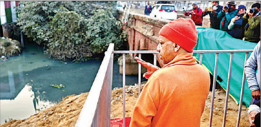
गोरखपुर में फोरलेन सड़क के निर्माण कार्य का निरीक्षण करते मुख्यमंत्री योगी आदित्यनाथ।

फोरलेन निरीक्षण के दौरान मुख्यमंत्री ने जंगल कौड़िया-जगदीशपुर रिंग रोड के निर्माण कार्यों