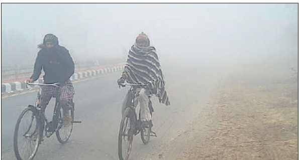
घने कोहरे के बीच साइकिल पर जाते लोग।

सुबह से दोपहर तक कोहरा छाए रहने और शीतलहर चलने से लोग सर्दी से ठिठुर गए। सड़कों पर कोहरा होने के कारण सड़कों पर वाहन लाइटें जलाकर रेंगते