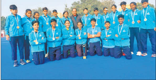
यूपी टीम के साथ रामपुर की मशीयत।