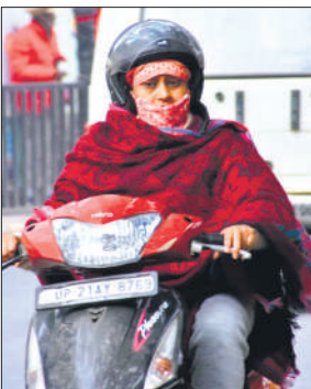
गर्म कपड़ों से खुद को ढंककर निकली महिलाएं।

दोपहर करीब दो बजे के बाद सूर्यदेव बादलों की ओट से झांकते दिखे लेकिन धूप में गर्मी नहीं थी। जिससे वह बेअसर रही। ठंडी