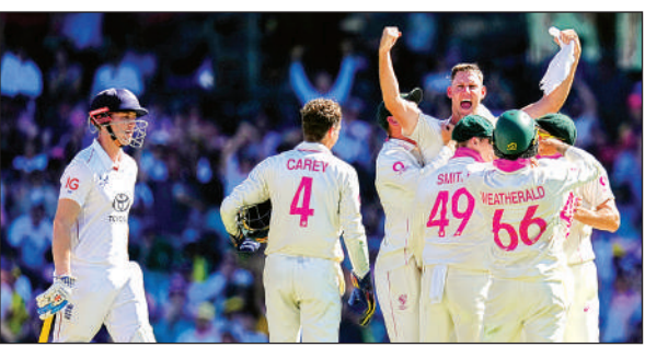
इंग्लैंड के हेरी ब्रूक को आउट करने के बाद जश्न मनाते ऑस्ट्रेलियाई खिलाड़ी।

जैकब बेथेल ने बुधवार को अपना पहला टेस्ट शतक बनाया जिससे इंग्लैंड ने ऑस्ट्रेलिया के खिलाफ पांचवां और अंतिम एशेज टेस्ट क्रिकेट मैच पांचवें दिन तक खींचकर अपनी उम्मीद भी कायम रखी। बारबाडोस में जन्मे 22 वर्षीय ऑलराउंडर बेथेल इंग्लैंड की दूसरी पारी के पहले ओवर में क्रीज पर आए क्योंकि मिशेल स्टार्क ने पांचवीं गेंद पर जैक क्रॉली (01) को एलबीडब्ल्यू आउट कर दिया था। बेथेल ने चौथे दिन का खेल समाप्त होने तक 232 गेंद का सामना करके 142 रन बनाए हैं। उनकी इस शानदार पारी को बंदौलत