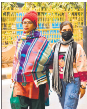
● अमृत विचार

हवा लगातार चलती रही, जिससे लोगों को कोई राहत नहीं मिली। मौसम विभाग के अनुसार दिन का अधिकतम तापमान 14 डिग्री सेल्सियस और न्यूनतम तापमान 8 डिग्री सेल्सियस दर्ज किया गया। ठंडी उत्तर-पश्चिमी हवाओं के कारण तापमान में और गिरावट की संभावना जताई गई है। विशेषज्ञों