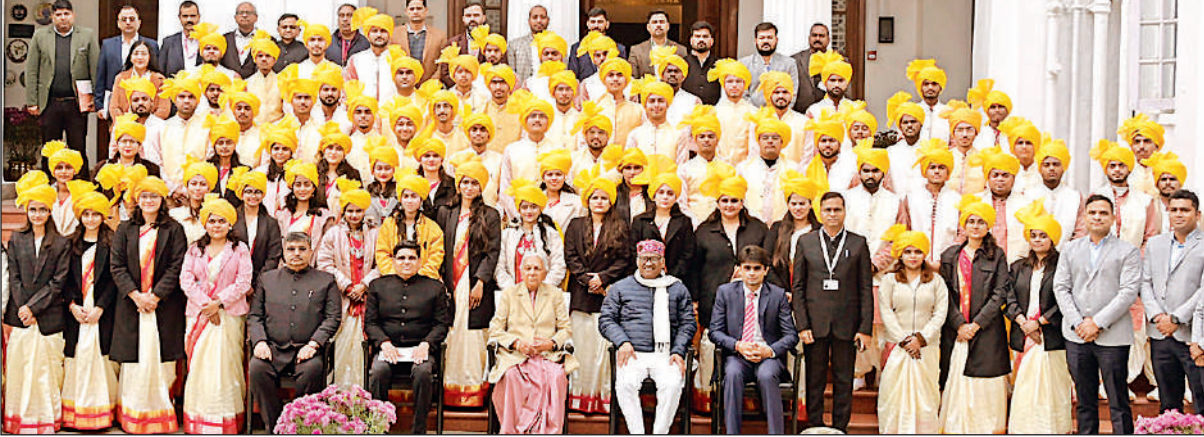
राजभवन में ‘विकसित भारत यंग लीडर्स डायलॉग- 2026’ के लिए चयनित प्रदेश के 79 युवाओं के साथ राज्यपाल आनंदीबेन पटेल, साथ में अन्य।

सकती। बहुभाषी दृष्टिकोण अपनाना आवश्यक है।