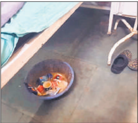
जिला अस्पताल में बेड के नीचे रखी ठोकरी में भरा कूड़ा।