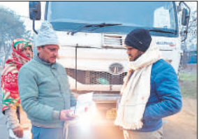
कागज दिखाता चालक।

इस दौरान प्रशासन, पुलिस एवं परिवहन विभाग की संयुक्त टीमों द्वारा कुल 1096 वाहनों की जांच की गई। जांच के दौरान यातायात एवं परिवहन नियमों का उल्लंघन पाए जाने पर खनिज विभाग द्वारा वाहनों के खिलाफ चालान की कार्रवाई की गई। जिला प्रशासन ने स्पष्ट किया है कि अवैध खनन, अनधिकृत परिवहन एवं ओवरलोडिंग से संबंधित गतिविधि बर्दाश्त नहीं की जाएगी।