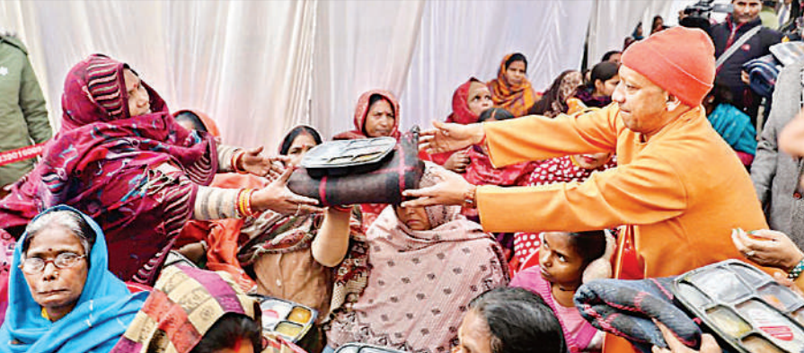
गोरखपुर के एक रैन बसेरे में लोगों को खाना और कंबल वितरित करते मुख्यमंत्री योगी आदित्यनाथ।

व्यापक इंतजाम : मीडिया से बातचीत में मुख्यमंत्री योगी आदित्यनाथ ने कहा कि मौजूदा समय में शीतलहर का प्रकोप गंभीर है। इससे निपटने के लिए प्रदेश