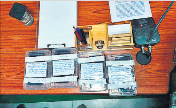
गिरफ्तार आरोपियों से बरामद मोबाइल व अन्य सामान।