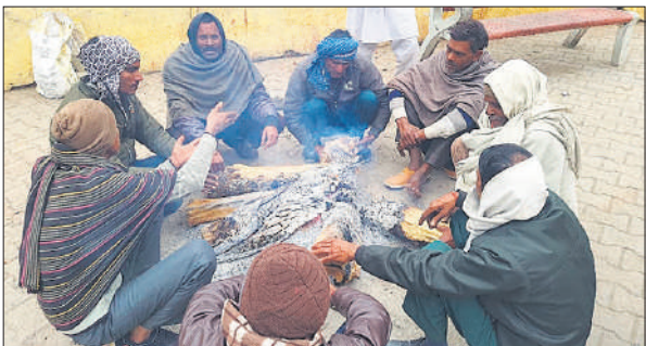
सर्दी बढ़ने पर अलाव जलाकर हाथ सेंकते लोग।

विशेष छापामार अभियान में सिविल लाइंस, ग्रामीण क्षेत्रों खौद और बिलासपुर स्थित साप्ताहिक बाजारों में पकौड़ी, चाट, फास्ट फूड, मसाले, खाद्य तेल विक्रेताओं को खाद्य सुरक्षा के प्रति जागरूक करते हुए रंगयुक्त चटनी, पकौड़ी, मसाले, नमकीन के विक्रय को निरुद्ध किया गया। मौके पर