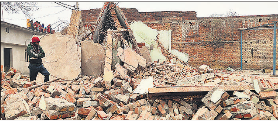
रायां बुजुर्ग में पिछले दिनों ध्वस्त किया गया मकान।

गुणवत्ता, अनुशासन, स्वच्छता, सुरक्षा मानकों तथा प्रशिक्षण में प्रयुक्त संसाधनों की समीक्षा की। संबंधित अधिकारियों से कहा कि रिक्रूट आरक्षियों के प्रशिक्षण में अनुशासन, शारीरिक दक्षता, शस्त्र संचालन और पेशेवर दक्षता पर विशेष ध्यान दिया जाए, ताकि भविष्य में वे कर्तव्यों का निर्वहन पूरी निष्ठा और दक्षता के साथ कर सकें। निरीक्षण के दौरान अधिकारियों ने प्रशिक्षण व्यवस्थाओं को और बेहतर बनाने के लिए आवश्यक सुधारात्मक कदम उठाने का भरोसा दिलाया।