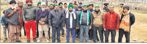
धावनी हसनपुर गांव में एकत्रित किसान।