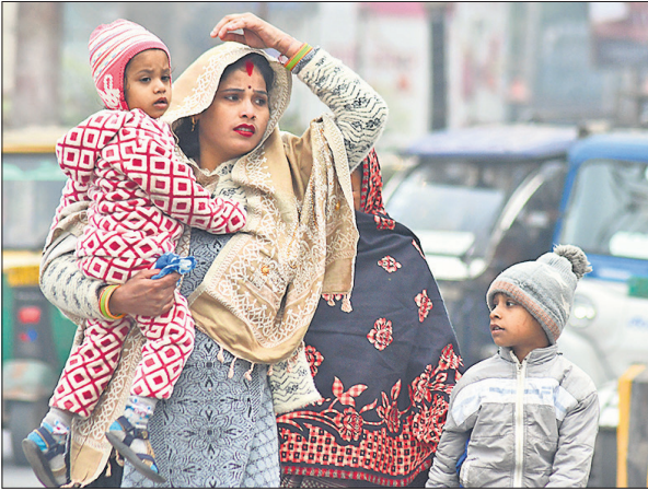
ठंड से बचने को गर्म कपड़ों में घर से पैक होकर निकले लोग ।