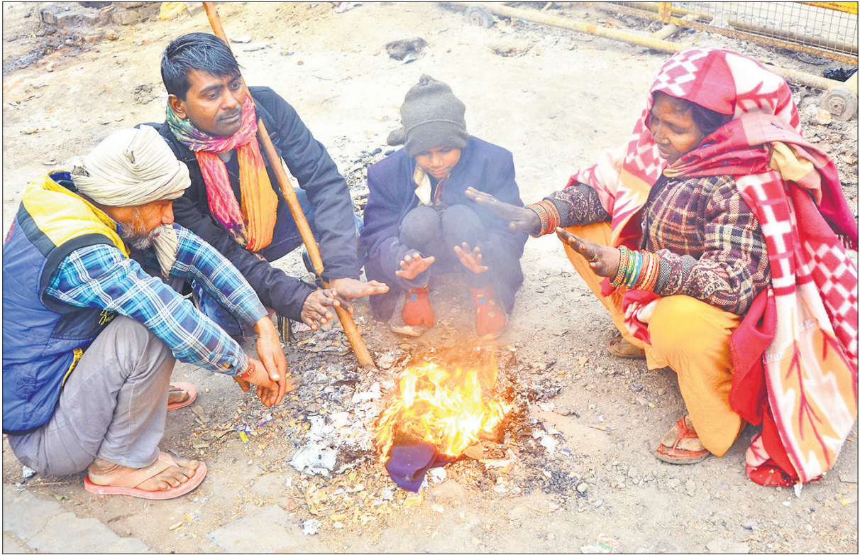
ठंड से बचने के लिए जंक्शन परिसर में कूड़ा जलाकर तापते लोग ।

रखने वालों और देर से आने वालों के लिए ऑफलाइन ऑन-द-स्पॉट रजिस्ट्रेशन का विकल्प भी रहेगा।