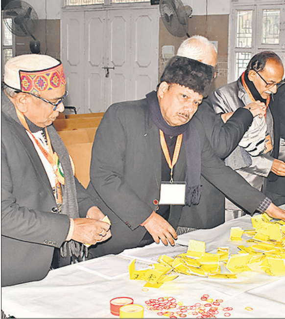
सचिव पद की मतगणना करते चुनाव अधिकारी।