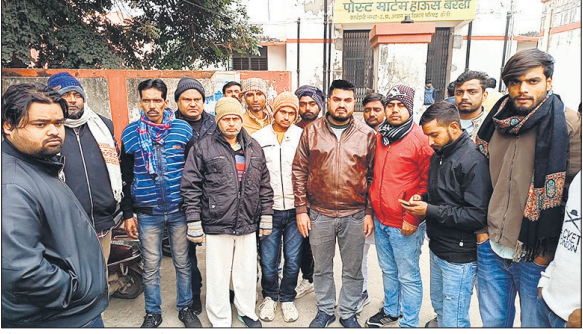
पोस्टमार्टम हाउस पर मौजूद परिजन।

जहरीला पदार्थ खा लिया, जिससे उसकी उपचार के दौरान मौत हो गई। पुलिस ने शव का पोस्टमार्टम कराने के बाद मामले की जांच शुरू कर दी है।