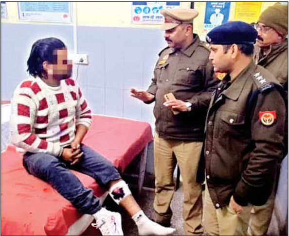
सीएचसी में भर्ती घायल आरोपियों से पूछताछ करती पुलिस।