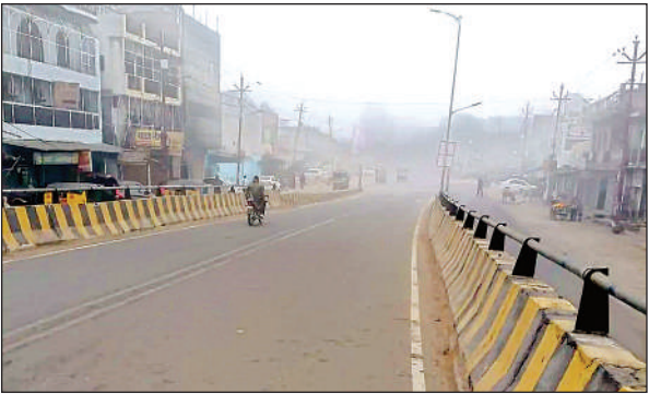
फर्रुखाबाद-बैवर मार्ग पर पसरा सन्नाटा।

कड़ाके की सर्दी के चलते जनपद में जनजीवन प्रभावित रहा। न्यूनतम तापमान लगभग 7 डिग्री सेल्सियस दर्ज किया गया। सड़कों पर केवल आवश्यक कार्यों से निकलने वाले लोग ही दिखाई दिए। भीषण सर्दी के चलते जनजीवन अस्त-व्यस्त हो गया है। बुधवार को कुछ समय के लिए सूर्यदेव के दर्शन हुए थे, जिससे लोगों को थोड़ी राहत मिली थी। हालांकि, एक घंटे बाद ही आसमान में बादल छा गए और शाम होते-होते कड़ाके की सर्दी फिर