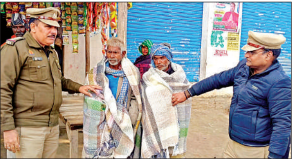
जरूरतमंदों को कंबल वितरित करते कोतवाली निरीक्षक।