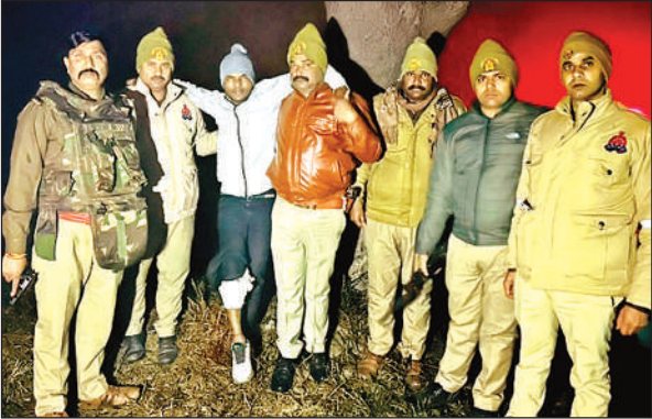
मुठभेड़ में घायल आरोपी को के जाती पुलिस।