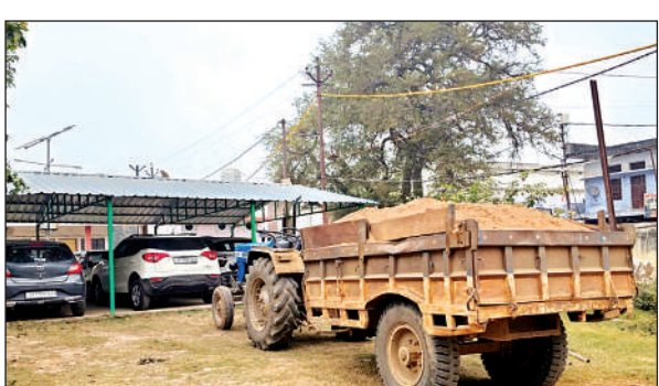
कोतवाली परिसर में खड़ा मौरंग लदी ट्रैक्टर-ट्रॉली।

गुरुवार को एसडीएम के साथ तहसीलदार और नायब तहसीलदार सहित पुलिस की संयुक्त कार्रवाई हुई। टिकरी मार्ग पर इन ट्रैक्टरों का धर-पकड़ अभियान चला। इसमें एक ओवर लोड ट्रैक्टर को कस्बा से बाहर टिकरी मार्ग पर पकड़ा गया। इसकी खबर लगते ही पीछे आ रहे चार अन्य के चालकों ने अपने ट्रैक्टरों को सिजनौड़ा गांव