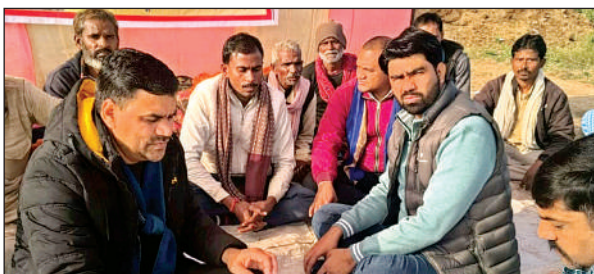
धरने में ग्रामीणों से मिलते आजाद समाज पार्टी के पदाधिकारी।

ने प्रशासन से सार्वजनिक स्थानों पर अलाव प्वाइंट बढ़वाने की मांग की है।