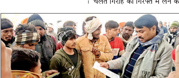
वन विभाग के खिलाफ प्रदर्शन करते ग्रामीण।