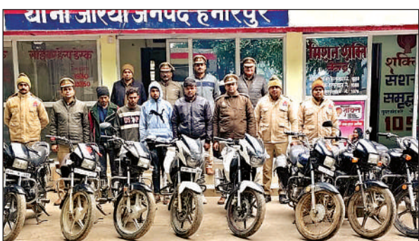
थाना जरिया में बरामद बाइकों के साथ आरोपी।