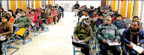
प्रशिक्षण शिविर में भाग लेते प्रधान व सचिव।