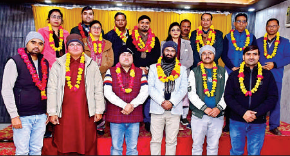
एआरपी संघ के नवनिर्वाचित पदाधिकारी।