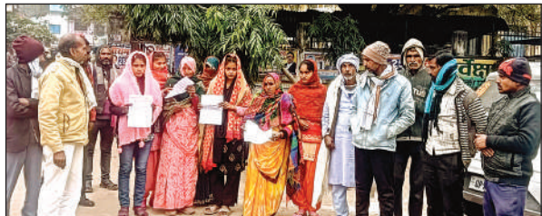
मजदूरी नहीं मिलने पर ज्ञापन देने जाते श्रमिक।