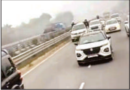
वायरल वीडियो के फ्रेट्रज।