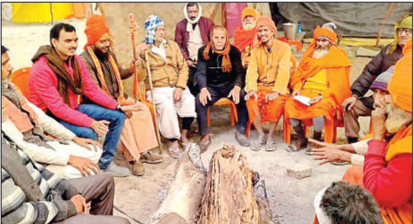
सर्दी में अलाव तापते साधु-संत व कलवासी।

कड़ाके की ठंड पर श्रद्धालुओं की आस्था भारी पड़ रही है। ब्रह्ममहूर्त से ही कल्पवासी गंगा स्नान कर भजन पूजन में रम जाते हैं। दिन भर