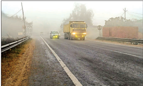
कोहरे के दौरान हाईवे पर लाइट जलाकर चलते ट्रक।