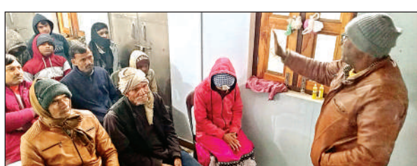
केशवचन्द्र सेन की पुण्यतिथि पर विचार व्यक्त करते डॉ. भवानीदीन।

निकालना अधिकारियों के लिए चुनौती बनी थी। फिर भी किसी तरह से इन्हें गल्ला मंडी में खड़ा कराया गया है। जबकि एक ट्रैक्टर को कोतवाली परिसर में खड़ा कराया गया है। इस पूरे समय तमाम सत्ताधारियों की धमाचौकड़ी और कई सफेदपोश नेताओं के फोन अधिकारियों के मोबाइल में घन-घनाते रहे।