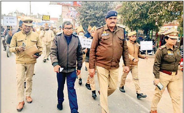
सड़क सुरक्षा को लेकर जागरूकता रैली निकालते पुलिस के अधिकारी। अमृत विचार

रैली का नेतृत्व क्षेत्राधिकारी यातायात, एशारटीओ, महिला थाना प्रभारी एवं प्रभारी यातायात ने संयुक्त रूप से किया। वाहन चालकों को यातायात नियमों के पालन के प्रति जागरूक किया गया। अधिकारियों ने दोपहिया वाहन चालकों को अनिवार्य रूप से हेलमेट पहनने, चारपहिया वाहन चलाते समय सीट