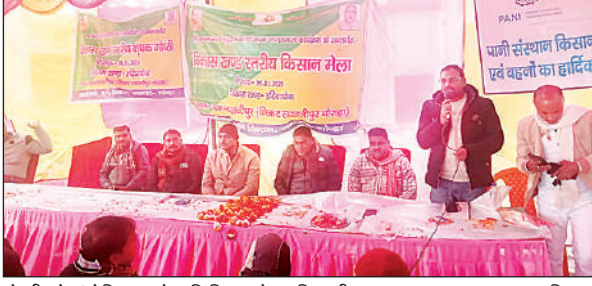
गोष्ठी को संबोधित करते कृषि विभाग के अधिकारी।