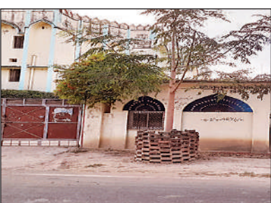
अब्दुई हसनपुर का मदरसा।