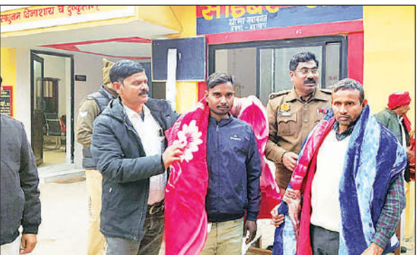
चौकीदारों को कंबल प्रदान करते थानाध्यक्ष व प्रधान।