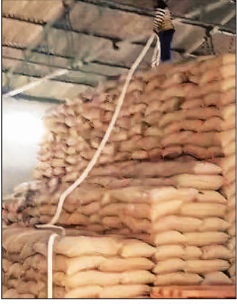
टुल्लू पंप का पाइप लगाकर गोदाम में भिगोई जा रही गेहूं की बोरियां।

जानकारी के अनुसार, जनपद में हर माह 15 लाख 96 हजार 130 लार्पाथियों को प्रति व्यक्ति दो किलो गेहूं वितरित किया जाता है। इस प्रकार हर महीने लगभग 31 हजार क्विंटल गेहूं सरकारी राशन दुकानों तक पहुंचता है। इतनी बड़ी मात्रा में होने वाले वितरण में किसी भी स्तर पर गड़बड़ी का सीधा असर लाभार्थियों के साथ-साथ कोटेदारों पर पड़ता है। कृषि विशेषज्ञों का कहना है कि सामान्य स्थिति में गोदाम में रखे गेहूं में नमी की मात्रा 8 से 12 प्रतिशत तक होती है, लेकिन जब बोरे में पानी डाला