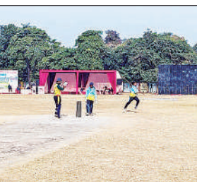
मैच के दौरान शॉट लगाता खिलाड़ी।