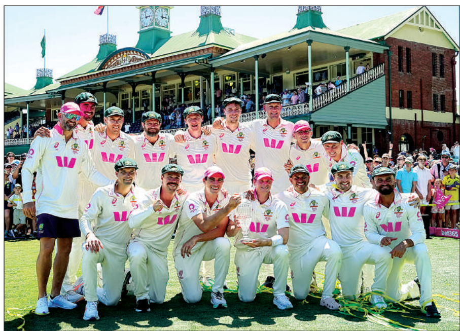
एशेज ट्रॉफी के साथ पोज देती ऑस्ट्रेलियाई टीम।