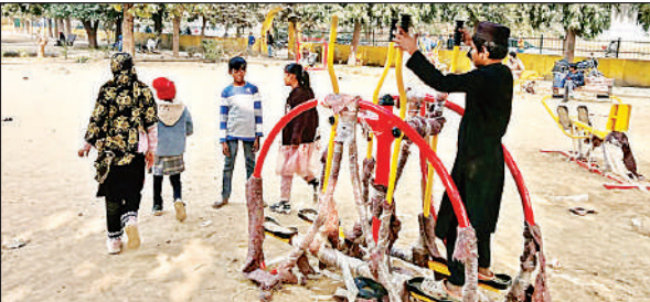
धूप निकलने के बाद पार्क में खेलते बच्चे।

अमृत विचार : जिले में बोते कई दिनों से पड़ रही कड़ाके की ठंड से जनजीवन बेहाल बना हुआ था। घना कोहरा, सर्द हवाएं और सूर्यदेव के दर्शन न होने से लोग घरों में दुबकने को मजबूर थे। गुरुवार को मौसम ने अचानक करवट ली और कई दिन बाद आसमान साफ हुआ। सूर्यदेव के दर्शन होते ही लोगों ने राहत की सांस ली और खिली धूप का आनंद उठाने के लिए घरों से बाहर निकल पड़े। सुबह से ही धूप निकलने के बाद तापमान में हल्की बढ़ोतरी दर्ज की गई। शहर के विभिन्न पार्कों, सार्वजनिक स्थलों और खुले मैदानों में लोग धूप संकेत नजर आए।