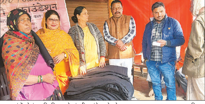
जरूरतमंदों को कंबल वितरित करते शांभवी फाउंडेशन के लोग।