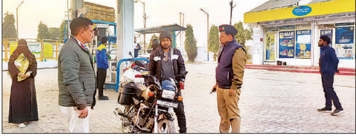
पेट्रोल पंप पर बिना हेलमेट वाले वाहन चालकों का चालान करते अधिकारी।