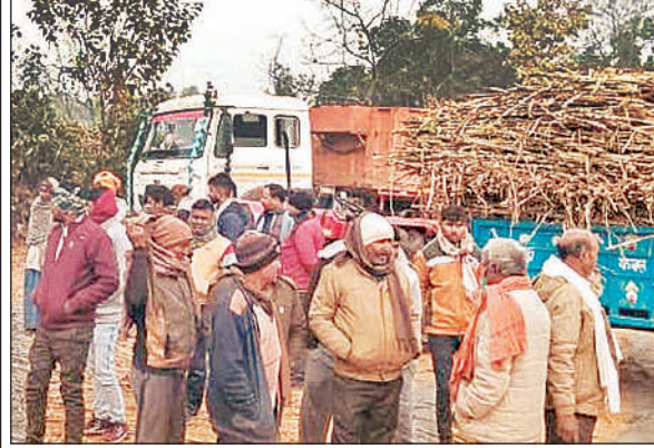
बागवानी क्रय केंद्र पर हंगामा करते किसान।