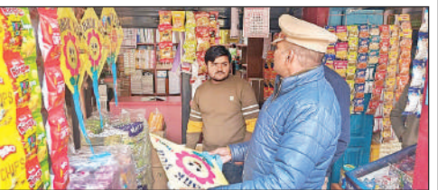
अभियान के तहत दुकानों पर जांच करते पुलिसकर्मी।