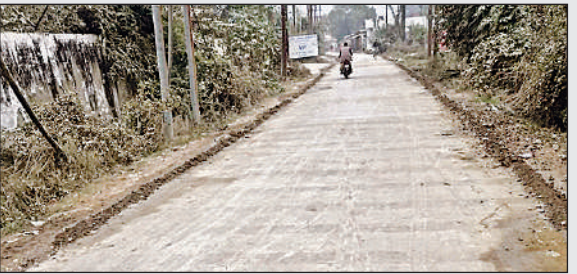
मंडी में बनी आरसीसी सड़क।