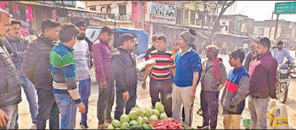
अतिक्रमण हटवाते नगर पालिका के अधिकारी व कर्मचारी।