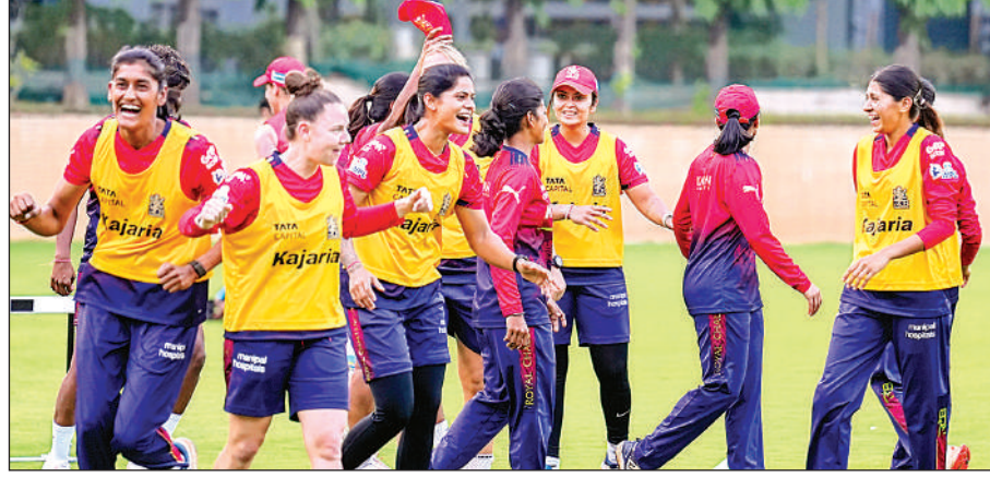
अभ्यास सत्र के दौरान रॉयल चैलेंजर्स बेंगलुरु की टीम।

अधिकतर खिलाड़ियों को टीम में बनाए रखा है और किसी भी टीम के लिए उसे हराना एक चुनौती होगी।