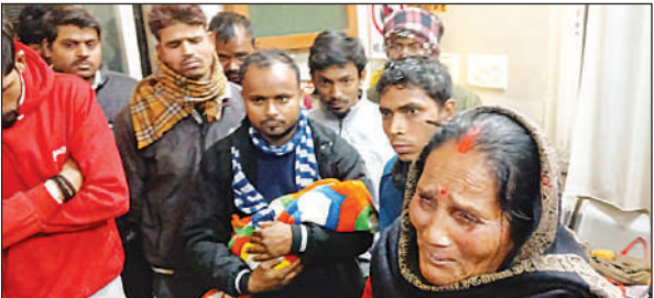
नवजात की मौत पर रोते-बिलखते परिजन।