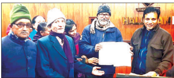
एसडीएम को ज्ञापन सौंपते अखिल भारतीय किसान महासभा बागजाला के सदस्य ।

और किच्छा भी शामिल है हालांकि अभी इन शहरों से कूड़ा नहीं मंगाया जाता है लेकिन जब प्लांट को शुरू किया जाएगा तो इन शहरों से भी कूड़ा आ जाएगा। अनुमान है कि रुद्रपुर और किच्छा से 150 मीट्रिक टन तक कूड़ा आएगा। इससे लक्ष्य पूरा हो जाएगा। साथ ही क्लस्टर में लालकुआं और रामनगर को भी जोड़ा जाएगा। वरिष्ठ नगर स्वास्थ्य