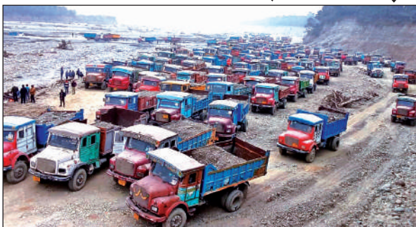
गौला नदी में फंसे वाहन । ● अमृत विचार

गौला नदी में 11 गेटों से उपखनिज निकासी होती है, नियमानुसार वाहन नदी से आरबीएम डोकर पहुंचते हैं फिर इलेक्ट्रॉनिक कांटे पर तुलाई होती है। आरबीएम के वजन के अनुसार रॉयल्टी वसूली जाती है, जिसका रवन्ना काटा जाता है। यह रवन्ना खनन विभाग के सर्वर से काटा जाता है। गुरुवार को वाहन खनन के लिए नहीं गए लेकिन जैसे ही गेट पर पहुंचे। कुछ देर सर्वर ने काम भी किया लेकिन फिर ठप हो गया। इससे सैकड़ों वाहन नदी में