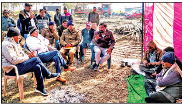
राजनगर में आंदोलित परिवारों के साथ वार्ता करते अधिकारी।