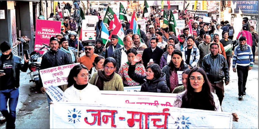
अल्मोड़ा में गुरुवार को आक्रोश रैली निकालते विभिन्न संगठनों से जुड़े लोग।