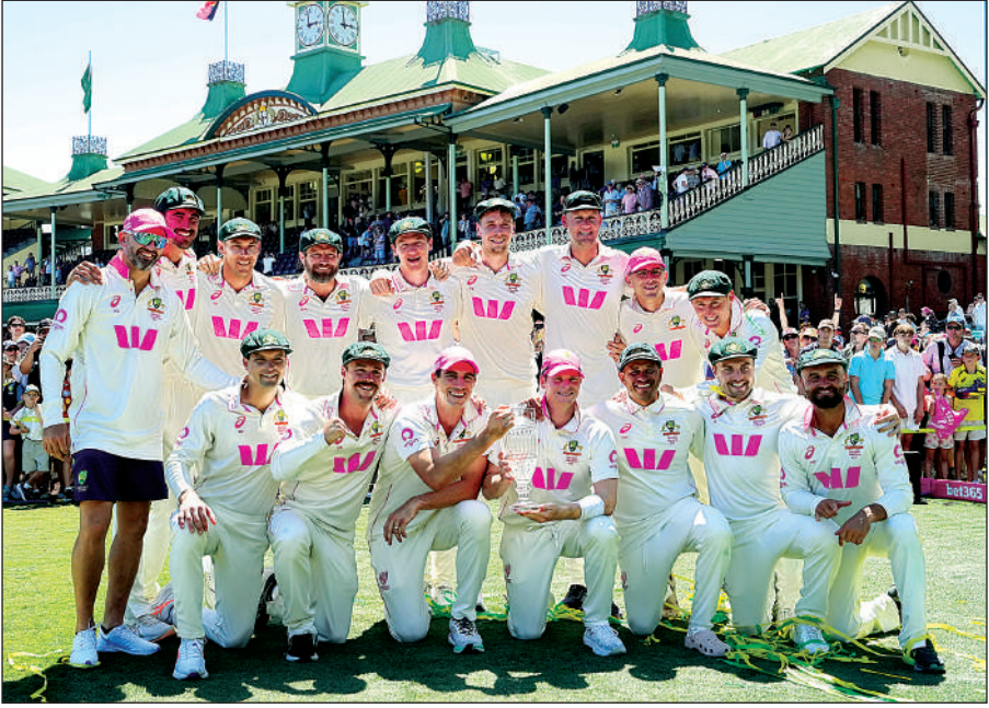
एशेज ट्रॉफी के साथ पोज देती ऑस्ट्रेलियाई टीम।