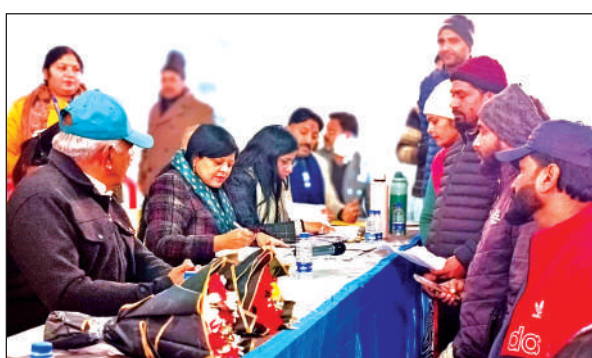
गदरपुर में मुख्य विकास अधिकारी को शिकायत करते करते ग्रामीण। ● अमृत विचार

ग्रामीणों का आरोप है कि कॉलोनाइजर ने बुनियादी सुविधाओं जैसे पक्की सड़क और नालियों का निर्माण किए बिना ही प्लॉट काट दिए हैं। गंदा पानी जमा होने से मच्छरों का प्रकोप बढ़ गया है, जिससे बच्चों और बुजुर्गों के स्वास्थ्य पर संकट मंडरा रहा है।