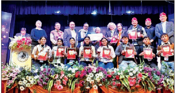
डायनेस्टी मॉडर्न गुरुकुल एकेडमी छिनकी फार्म की विजेता टीम।