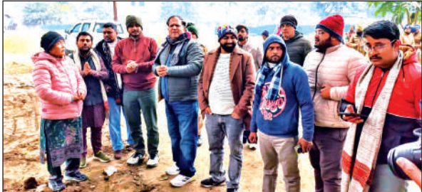
कार्रवाई के दौरान महापौर और नगर निगम की टीम।

न केवल पुलिस और प्रशासन को चुनौती दी, बल्कि न्यायालय को भी गुमराह करने का प्रयास किया। उन्होंने स्पष्ट किया कि मुख्यमंत्री पुष्कर सिंह धामी के नेतृत्व में पूरे प्रदेश में अतिक्रमण और लैड जिहाद जो कालनेमि बाबाओं के विरुद्ध जो अभियान चलाया जा रहा है। आज की कार्रवाई उसी का