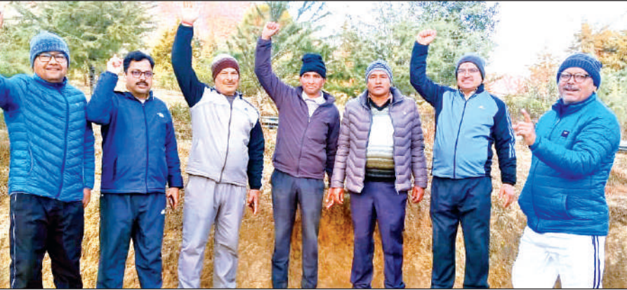
लोहाघाट में पेयजल लाइन के निर्माण में देरी के विरोध में प्रदर्शन करते ग्रामीण। ● अमृत विचार

ग्रामीणों ने बताया कि लगभग तीन साल पहले साढ़े चार करोड़ रुपये की लागत से शुरू हुई इस योजना के तहत क्षेत्र के करीब 400 परिवारों को नल से जल पहुंचाया जाना था। इसके लिए रोडवेज क्षेत्र के नीचे गंधरे में ट्यूबवेल और पाटन गांव के ऊपर पानी की टंकी बनाने का प्रस्ताव था। इस योजना