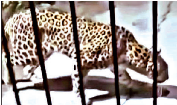
सिडकुल कंपनी गेट पर दिखा तेंदुआ। | ● अमृत विचार

यहां बता दें कि बुधवार की देर रात्रि सिडकुल की अशोका लीलैंड सुरक्षा गार्ड में हड़कंप मच गया। जब बिल्कुल कंपनी मुख्य गेट के नजदीक तेंदुआ देखे जाने लगा। करीब 40 मिनट तक इधर-उधर घूमने के बाद चला गया। गार्ड का कहना था कि छतरपुर थाना पंतनगर इलाके में पहली बार तेंदुआ देखा गया है और वर्करो में भी काफी खोफ है। गुरुवार की दोपहर विधायक शिव अरोरा डीएफओ यूसी तिवारी और वन विभाग की टीम के साथ मौका मुआयना कर ही रहे थे कि दोपहर बाई बजे के करीब अचानक तेंदुआ