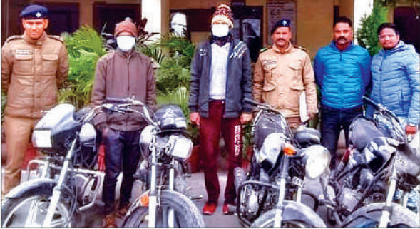
काशीपुर में चोरी की बाइक के साथ गिरफ्तार आरोपी। ● अमृत विचार