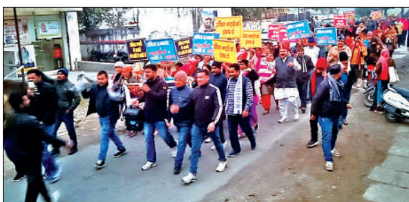
शांतिपुरी में सीबीआई जांच की मांग को लेकर कैंडल मार्च निकालते ग्रामीण।