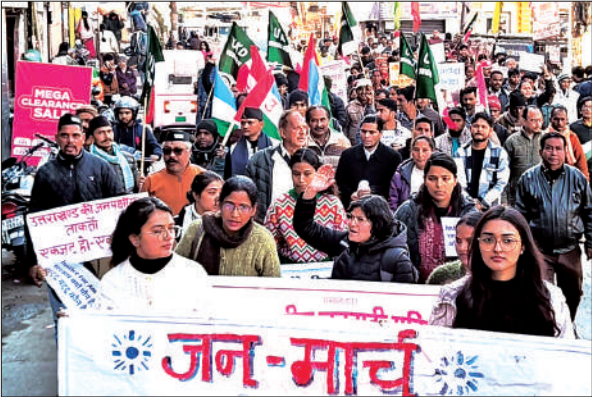
अल्मोड़ा में गुरुवार को आक्रोश रैली निकालते विभिन्न संगठनों से जुड़े लोग।

आक्रोश रैली में महिलाओं, युवाओं और विभिन्न सामाजिक संगठनों की बड़ी भागीदारी देखने को मिली। हाथों में तख्तियों