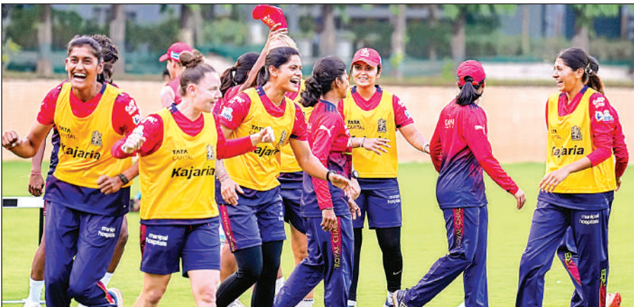
अभ्यास सत्र के दौरान रॉयल चैलेंजर्स बेंगलुरु की टीम।

अधिकतर खिलाड़ियों को टीम में बनाए रखा है और किसी भी टीम के लिए उसे हराना एक चुनौती होगी।