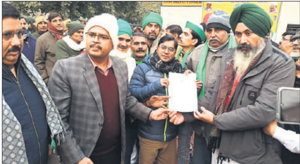
जिला गन्ना अधिकारी को ज्ञापन सौंपते भाकियू नेता।

अमृत विचार : गन्ना किसानों को बकाया भुगतान नहींहो रहा है और जनप्रतिनिधियों को किसानों से संबध केवल वोट लेने तक है। यही वजह है कि किसानों के धरने पर कोई जनप्रतिनिधि शामिल नहीं होता है। गन्ना समिति परिसर में भाकियू के धरने पर यह बात वक्ताओं ने कही। भारी संख्या में एकत्र किसानों को समझाने के लिए अफसर आए लेकिन शुरुआत में किसान नहीं माने शाम को सभी आश्वान पर मान गये और धरना समाप्त कर दिया। इसके पहले उन्होंने मुख्यमंत्री को संबोधित ज्ञापन अफसरों को सौंपा है। भारतीय किसान यूनियन के आवाहन पर गन्ना समिति परिसर में किसान महापंचायत का आयोजन किया गया। जो बाद में धरने में तब्दील हो गया। मिल प्रबंधन ने धरना स्थल पर पहुंचकर भुगतान को लेकर कोई ठोस जवाब नहीं दिया। उत्तेजित किसानों के बीच पहुंचे