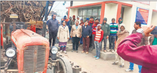
गन्ना अधिकारियों ने गन्ना क्रय केंद्रों का निरीक्षण किया।

अफसरों ने गन्ना क्रय केंद्र का निरीक्षण किया