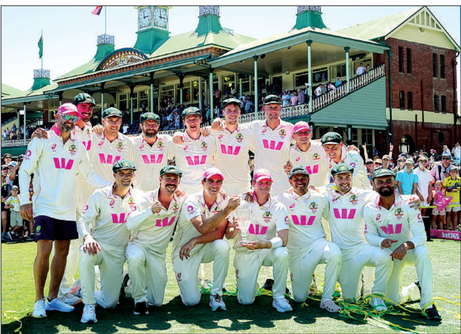
एशेज ट्रॉफी के साथ पोज देती ऑस्ट्रेलियाई टीम।