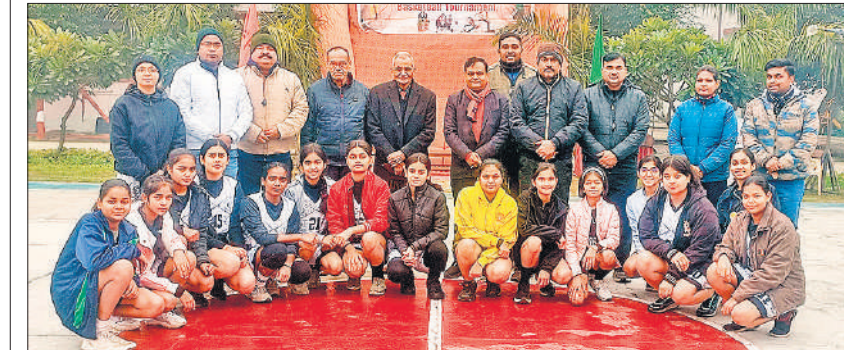
बालिका वर्ग की खिलाड़ियों के साथ मुख्य अतिथि।