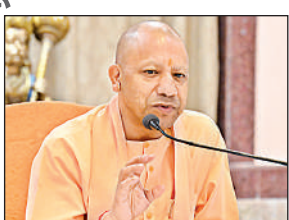
प्रधानमंत्री नरेंद्र मोदी

मुख्यमंत्री ने गुरुवार को अपने आवास पर यूपी दिवस-2026 की तैयारियों की समीक्षा करते हुए निर्देश दिए कि 24 से 26 जनवरी तक तीन दिवसीय समारोह के दौरान लखनऊ में मुख्य आयोजन के साथ-साथ प्रदेश के सभी जिला मुख्यालयों, देश के सभी राजभवनों और विदेशों में स्थित भारतीय दूतावासों में भी यूपी दिवस के कार्यक्रम आयोजित किए जाएं।