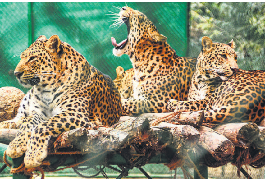
कानपुर स्थित नवाबगंज विडियाघर में गुरुवार 8 जनवरी को कड़ाके की ठंड के बीच तेंदुए नीलम, टोनी, पीतांबरी और जेरी अपने बाड़े में आराम करते हुए।