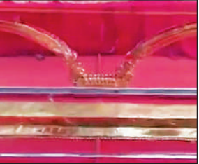
ओडिशा से आ रहा 286 किलो का धनुष।

ओडिशा के भक्त रामलला को समर्पित करेंगे 286 किलो का धनुष