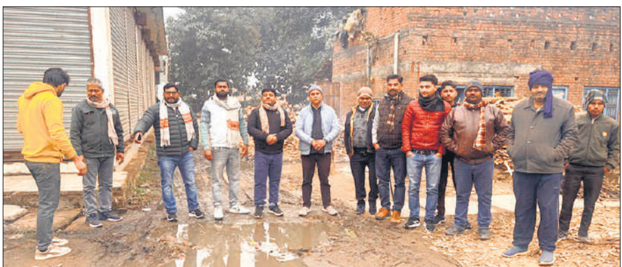
वार्ड 6 के सभासद रास्ते में भरा पानी और कीचड़ दिखाते हुए।