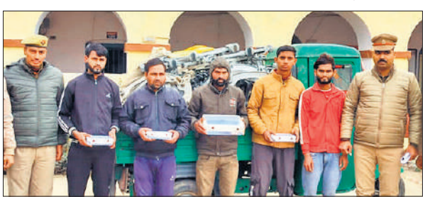
पुलिस की गिरफ्त में पकड़े गये चोर।

में स्टेशन रोड से घुंघरू बाबा मंदिर को जाने वाला रोड खस्ताहाल है।कई जगह पानी की निकासी नहीं होने के कारण जल भराव हो जाता है। मोहल्ले की एक शिक्षिका स्कूल जाते समय स्कूटी फिसलने से चोटिल हो गई।इस रोड को डालने के लिए वह कई बार प्रस्ताव दे चुके हैं।