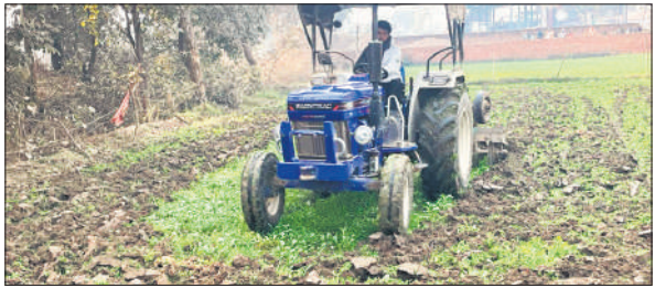
सरकारी जमीन पर कब्जा कर बोई बरसीम पर ट्रैक्टर चलाकर मुक्त कराया।

ट्रैक्टर चलाकर जमीन को कराया कब्जा मुक्त