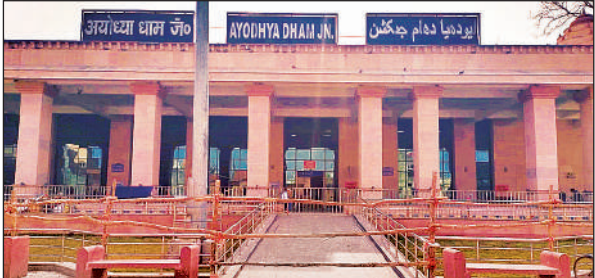
अयोध्या धाम रेलवे स्टेशन के मुख्य भवन पर लगी बैरिकेडिंग।

प्रयागराज के कुंभ मेले के दौरान रामनगरी में भारी भीड़ उमड़ने की संभावना है। भीड़ प्रबंधन की दृष्टि से अयोध्या धाम रेलवे स्टेशन के मुख्य भवन के चारों ओर बैरिकेडिंग कर बंद कर दिया गया है। प्लेटफार्म पर भीड़ का दबाव न पड़े इसके लिए भी योजना