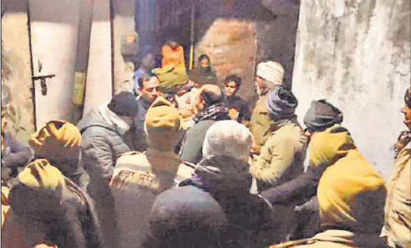
घटना के बाद मोहल्ला मदीनाशाह के एक घर के बाहर जानकारी करती पुलिस।

सूचना मिलने पर दो थानों की पुलिस मौके पर पहुंची और सख्ती की। गलियों में भारी पुलिस बल ने गश्त की। पूरी रात पुलिस बल तैनात रहा। फिलहाल दोनों तरफ से दो-दो लोगों की गिरफ्तारी कर शांतिभंग की आशंका में चालान कर दिया है। पुलिस घटना को लेकर पड़ताल कर रही है। बताते हैं कि शहर के मोहल्ला मदीनाशाह निवासी एक युवक का मोहल्ला नखासा के युवक से बुधवार को दिन में विवाद हो गया था। शराब के नशे में हुए मामूली विवाद में पहले दोनों भिड़ गए। उस