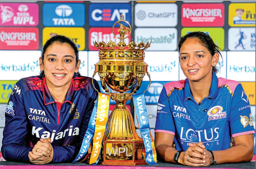
प्रेस कॉन्फ्रेंस के दौरान ट्रॉफी के साथ रॉयल चैलेंजर्स बेंगलुरु की कप्तान स्मृति मंधाना व मुंबई इंडियंस की कप्तान हरमनप्रीत कौर।

अपने पहले वनडे विश्व कप की जीत की खुशी में डूबी भारतीय महिला क्रिकेटर शुक्रवार से यहां शुरू हो रही चौथे महिला प्रीमियर लीग (डब्ल्यूपीएल) क्रिकेट टूर्नामेंट से प्रतिस्पर्धी क्रिकेट में वापसी करेंगी, जो इस साल इंग्लैंड में होने वाले टी-20 विश्व कप की तैयारी की शुरुआत भी होगी। टूर्नामेंट के पहले मैच में दो बार की विजेता और मौजूदा चैंपियन हरमनप्रीत कौर की अगुवाई वाली मुंबई इंडियंस का सामना डब्ल्यूपीएल में एकमात्र अन्य खिताब जीतने वाली टीम रॉयल चैलेंजर्स बेंगलुरु (आरसीबी) से होगा, जिसकी कप्तान स्टा र बल्लेबाज स्मृति मंधाना संभाल रही हैं। चौथी डब्ल्यूपीएल का आयोजन दो चरणों में नवी मुंबई और वडोदरा में किया जाएगा। इसमें युवा खिलाड़ियों को दुनिया भर के सर्वश्रेष्ठ खिलाड़ियों के साथ खेलने का मौका मिलेगा। इससे खिलाड़ियों को जून-जुलाई में इंग्लैंड में होने वाले टी-20 विश्व कप के लिए अपनी तैयारियों को परखने का भी