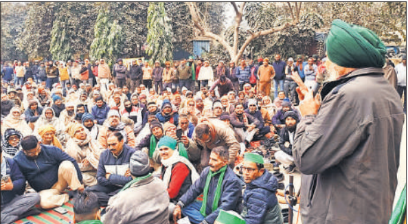
धरना स्थल पर किसानों को संबोधित करते भाकियू नेता।

उन्होंने कहा चीनी मिल प्रबंधन के वायदे से अब वह सहमत नहीं है। दोपहर बाद जिला गन्ना