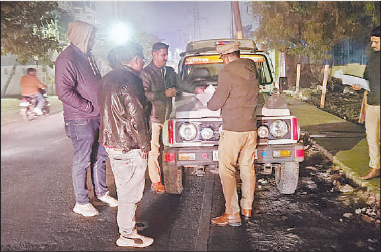
अमृत विचार खुले में शराब पीते मिले युवक का चालान काटते पुलिस अधिकारी।