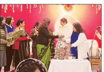
कंबल बांटती इनरव्हील क्लब की सदस्य।