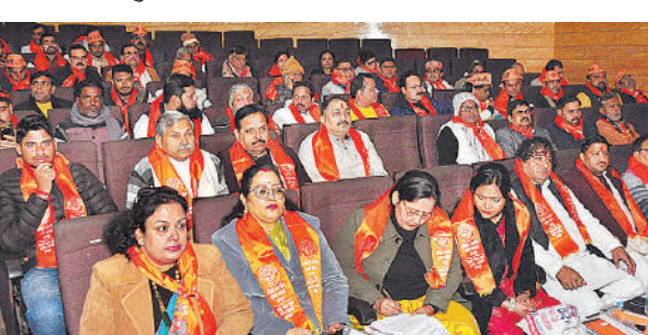
अखिल भारतीय उद्योग व्यापार मंडल की बैठक में मौजूद व्यापारी।