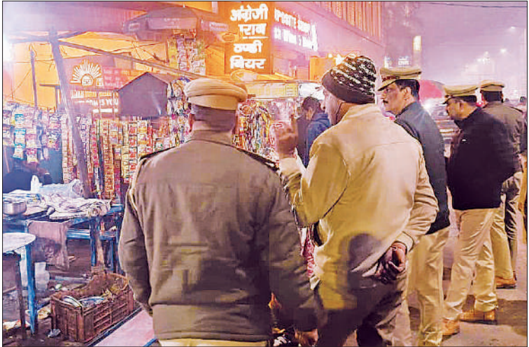
शराब की दुकान के बाहर चेकिंग करते हुए पुलिस अधिकारी।