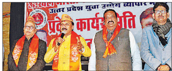
व्यापारियों को संबोधित करते राष्ट्रीय अध्यक्ष संदीप बंसल साथ में अन्य।

अमृत विचार : अखिल भारतीय उद्योग व्यापार मंडल की प्रदेश कार्यसमिति की बैठक गोमती नगर स्थित अंतरराष्ट्रीय बौद्ध शोध संस्थान में हुई। बैठक में उत्तर प्रदेश के 60 जनपदों के प्रतिनिधि उपस्थित रहे। बैठक को संबोधित करते हुए अखिल भारतीय उद्योग व्यापार मंडल के राष्ट्रीय अध्यक्ष संदीप बंसल ने कहा कि वास्तविक लड़ाई भ्रष्टाचार से है। किसी भ्रष्ट अधिकारी से डरें या घबराएं नहीं। ऐसी किसी भी समस्या में संगठन आपके साथ खड़ा है। बैठक में 12 जनवरी विवेकानंद जयंती को राष्ट्रीय युवा