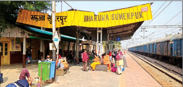
ठंड के बीच सुमेरपुर स्टेशन में ट्रेन के इंतजार में बैठे यात्री।

दोपहर में आने वाली इंटरसिटी एक्सप्रेस 17 मिनट की देरी से आई। ट्रेनों की लेट लतीफी के