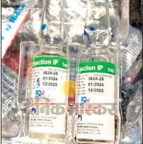
जिला अस्पताल की इमरजेंसी में रखे एक्सपायर इंजेक्शन।