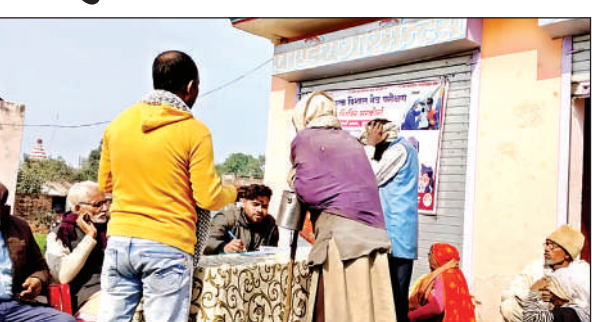
चिकित्सा शिविर में जांच कराने पहुंचे ग्रामीण।