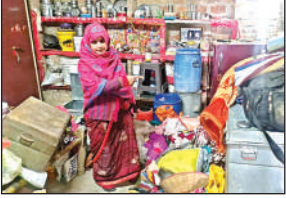
चोरी के बाद बिखरा पड़ा सामान।