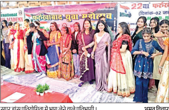
सुपर डांस प्रतियोगिता में भाग लेने वाले प्रतिभागी।