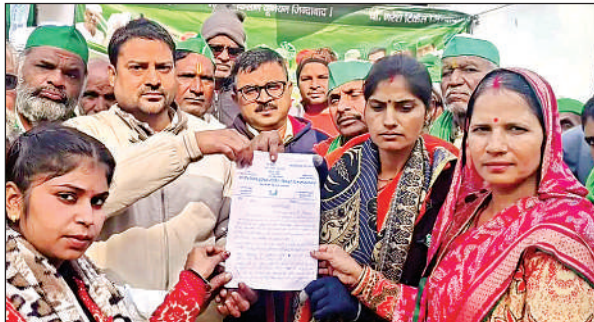
परियोजना निदेशक को ज्ञापन सौंपते ग्रामीण।