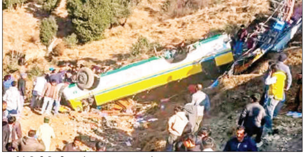
खाई में गिरी निजी बस के आसपास जमा लोग।

पुलिस के मुताबिक, निजी बस में बैठने की क्षमता 39 लोगों की थी