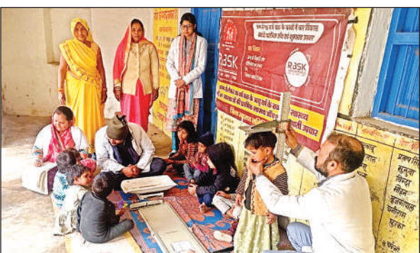
स्वास्थ्य शिविर में बच्चों की सेहत जांचते डाक्टर।