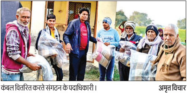
कंबल वितरित करते संगठन के पदाधिकारी ।