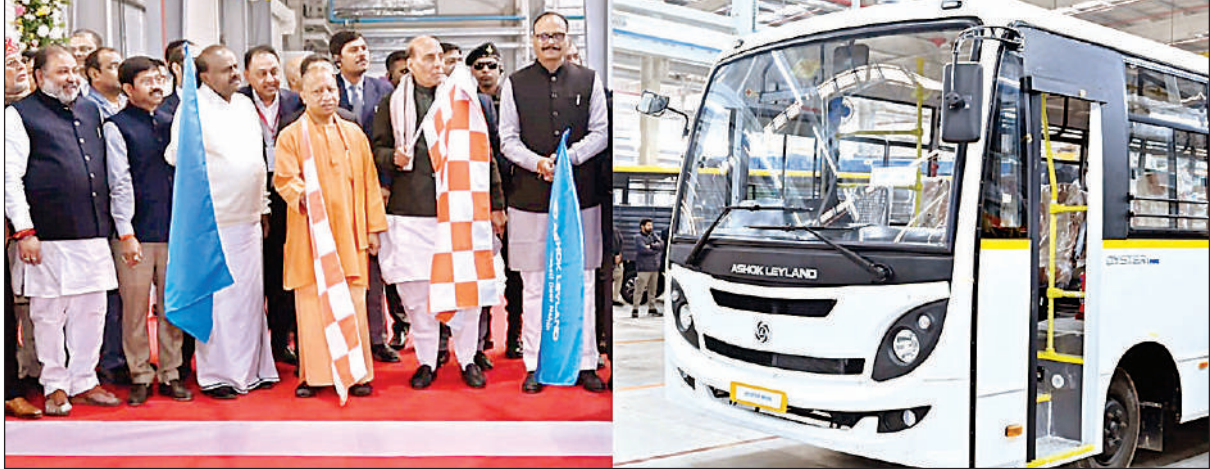
लखनऊ स्थित अशोक लेलैंड के प्लांट में इलेक्ट्रिक वाहनों को झंडी दिखाकर रवाना करते रक्षा मंत्री राजनाथ सिंह, मुख्यमंत्री योगी व अन्य मंत्रीगण।

मुख्यमंत्री योगी ने शुक्रवार को रक्षा मंत्री राजनाथ सिंह और भारी उद्योग व इस्पात मंत्री एचडी कुमार स्वामी और अपने मंत्रियों के साथ अशोक लेलैंड के इलेक्ट्रिक वाहन निर्माण प्लांट का भ्रमण भी किया। कार्यक्रम में योगी ने पीएम मोदी के विजन-2047 का जिक्र करते हुए कहा कि हर देशवासी ने भारत को विकसित-आत्मनिर्भर बनाने का संकल्प लिया है। पिछले 8-9 वर्ष में यूपी में 45 लाख करोड़ रुपये के निवेश प्रस्ताव आए। इसमें से 15 लाख करोड़ के प्रस्ताव को ग्राउंड