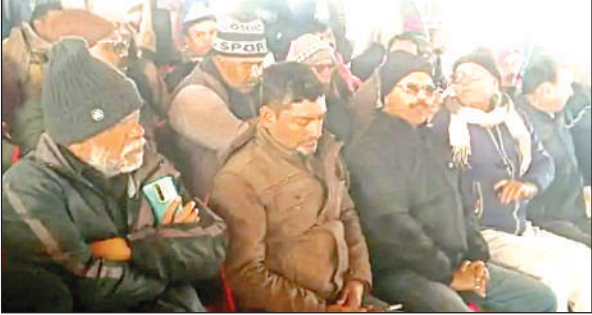
सातनपुर मंडी में आयोजित बैठक में मौजूद आदती।

बैठक में तय किया गया कि मंडी में आलू के भाव प्रतिदिन सुबह 8 बजे समस्त आदतियों और व्यापारियों की उपस्थिति में खोले जाएंगे। इसके अतिरिक्त, खरीदारों को आलू का भुगतान 8 से 15 दिनों के भीतर करना होगा। आलू विक्रय के भाव के अनुसार