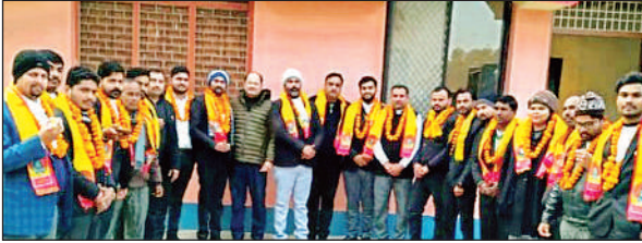
सम्मानित किए गए जूनियर अधिवक्ता।