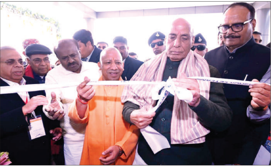
लखनऊ : नवनिर्मित अशोक लेलैंड ईवी प्लांट के उद्घाटन अवसर पर मुख्यमंत्री योगी, रक्षा मंत्री राजनाथ व केंद्रीय मंत्री एचडी कुमारस्वामी।