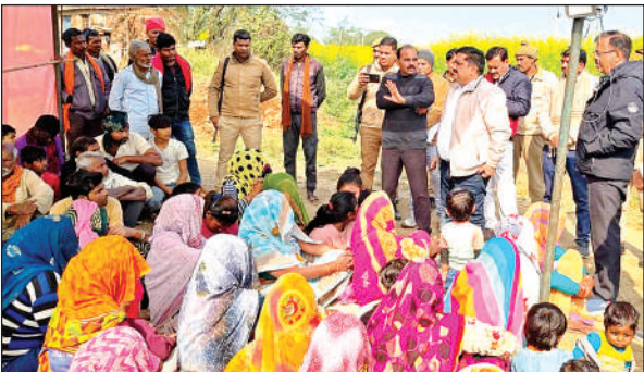
अनशनकारियों को मनाने की कोशिश करते प्रशासनिक अधिकारी।

इसके अलावा यह मामला सुर्खियों में आते ही अन्य राजनीतिक