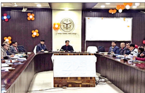
बैठक में समीक्षा करते जिलाधिकारी पुलकित गर्ग।

उन्होंने कहा कि गौशालाओं के संबंध में कोई नकारात्मक सूचना नहीं आनी चाहिए। बीमार पशुओं का तत्काल उपचार कराने, मृत्यु पर दफन के लिए परिसर में ही स्थान सुनिश्चित किए जाने व चरवाहों का मानदेय समय से भुगतान करने के निर्देश दिए। निर्देशित किया कि मुख्यमंत्री सहभागिता योजना के अंतर्गत जिन लाभार्थियों ने गोवंश लिए हैं, उनकी प्रगति रिपोर्ट समय से भेजें। डीएम ने निर्देश दिए कि आवास योजना का लाभ केवल पात्रों को ही मिले। टीएचआर खोह क्लस्टर में समूहों के माध्यम से आने वाली सामग्री खरीद स्वयं