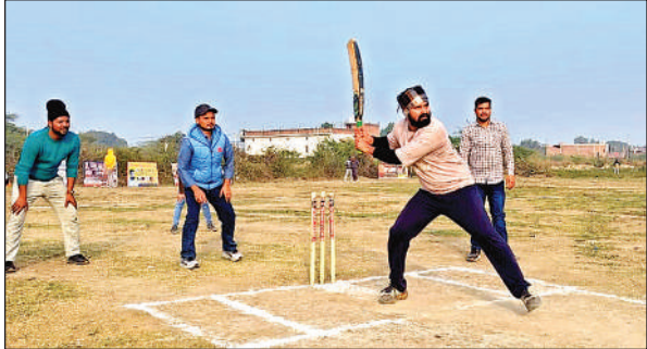
मैच के दौरान शॉट मारते खिलाड़ी ।