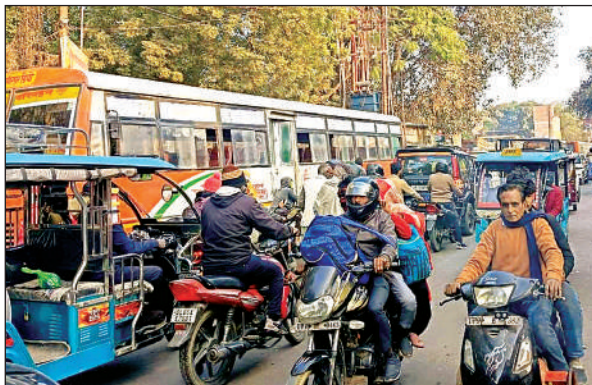
शुक्रवार को रोडवेज बस स्टैंड के पास लगा जाम।

मुख्यालय का बस स्टैंड लंबे समय से अव्यवस्था और अतिक्रमण का शिकार है। यहां से प्रतिदिन कानपुर, लखनऊ, महोबा, राठ, उरई, दिल्ली, बांदा के लिए बसें आती जाती हैं। अधिकतर बसें बस