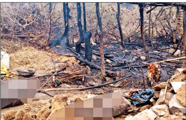
आग लगने के बाद पशुबाड़ा पूरी तरह जल गया।