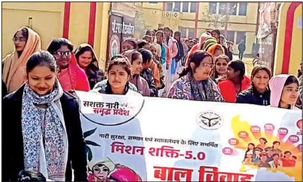
छात्राओं ने बाल विवाह रोकने का संदेश दिया।