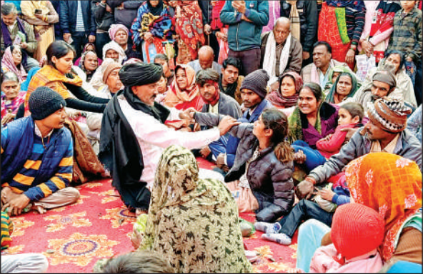
लकवा मरीजों का उपचार करते काले कंबल वाले बाबा।