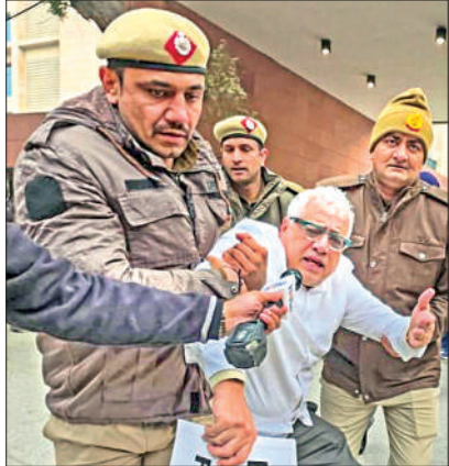
प्रदर्शन कर रहे टीएमसी सांसदों को हटाती पुलिस।

ईडी ने आरोप लगाया कि इसमें सर्वोच्च राजनीतिक कार्यपालिका की प्रत्यक्ष सल्लतता और पुलिस बल का दुरुपयोग हुआ है और मामले की सीबीआई जांच का अनुरोध किया है। इसमें हाईकोर्ट से आग्रह किया गया कि वह सीबीआई को प्राथमिकी दर्ज करने और पूरी घटना की जांच करने का निर्देश दे, जिसमें मुख्यमंत्री, पुलिस अधिकारी और इस मामले में मिलीभगत करने वाले सभी व्यक्तियों की भूमिका की भी जांच शामिल हो। एजेंसी ने कहा