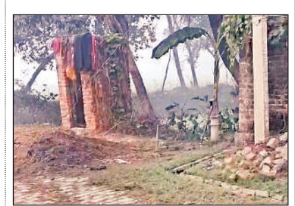
मुरेला गांव में बिना चबूतरे के लगा हैडपंप।