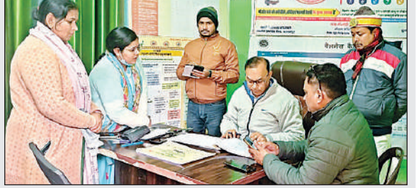
नगरीय स्वास्थ्य केंद्र का निरीक्षण करते सीएमओ और अन्य।