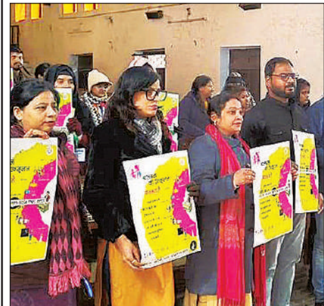
बालश्रम जागरूकता वर्क में पोस्टर के साथ जागरूक करते लोग।