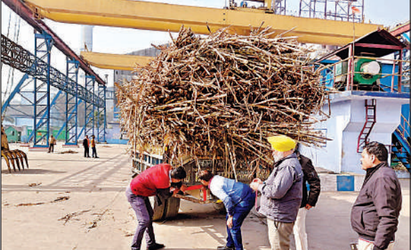
गन्ना लदी ट्रॉली पर रेट्रो-रिफ्लेक्टर लगाते परिवहन कर्मी।