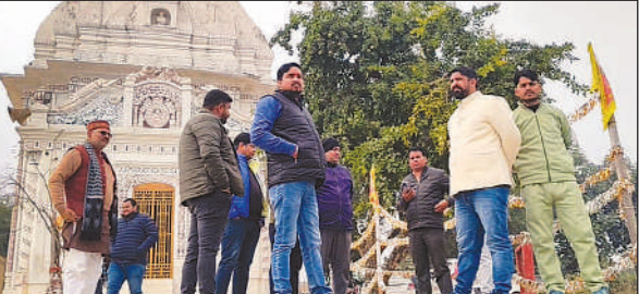
सस्पेंशन ब्रिज के लिए रानी तालाब का निरीक्षण करती टैंकनकल टीम।