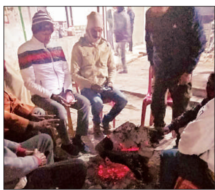
भीषण ठंड में अलाव का सहारा लेते लोग ।