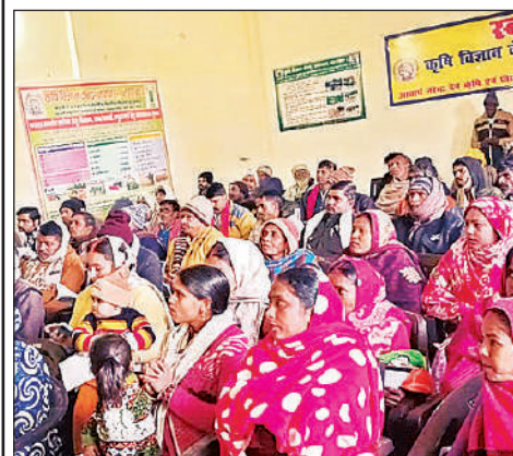
नानपारा में आयोजित किसान गोष्ठी में मौजूद कृषक।