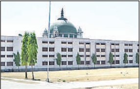
आजमगढ़ का मदरसा अशरफिया

परिषद के अभिलेखों के अनुसार, आजमगढ़ मुबारकपुर स्थित मदरसा दारुल उलूम अहले सुन्नत मदरसा