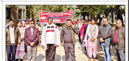
रमाबाई राजकीय महिला स्नातकोत्तर महाविद्यालय अकबरपुर में निकाली गई जागरूकता रैली ।