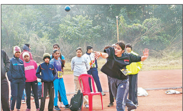
प्रदेशीय सबजूनियर एथलेटिक्स प्रतियोगिता के गोला क्षेपण स्पर्धा में भाग लेती खिलाड़ी ।