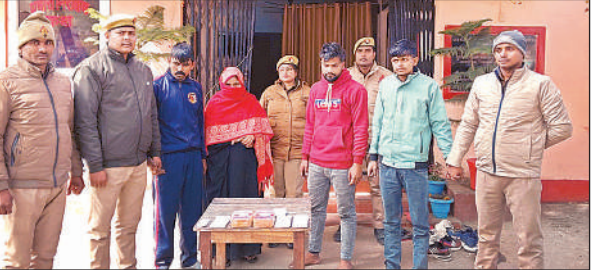
बरामद स्मैक के साथ गिरफ्तार नशे के सौदागर।