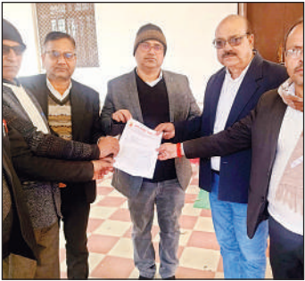
एडीएम को मांगपत्र देते लोग।