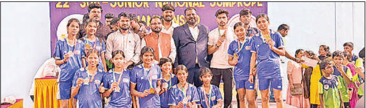
राष्ट्रीय जंप रोप चैम्पियनशिप में पदक विजेता अयोध्या की खिलाड़ी ।