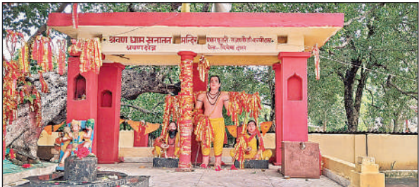
अकबरपुर तहसील स्थित श्रवण धाम स्थल।