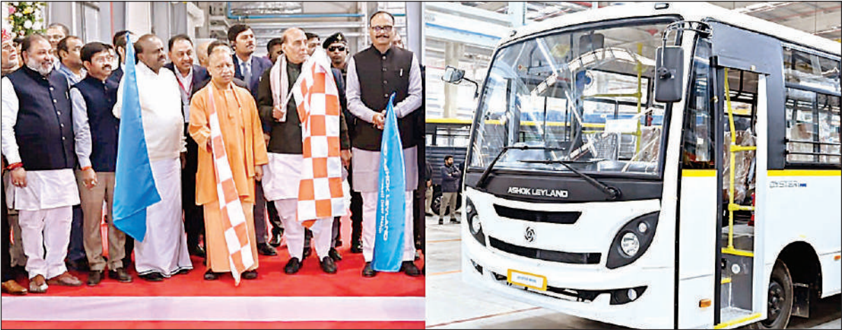
लखनऊ स्थित अशोक लेलैंड के प्लांट में इलेक्ट्रिक वाहनों को झंडी दिखाकर रवाना करते रक्षा मंत्री राजनाथ सिंह, मुख्यमंत्री योगी व अन्य मंत्रीगण।

अमृत विचार: मुख्यमंत्री योगी आदित्यनाथ ने कहा कि “इंडस्ट्री फर्स्ट, इन्वेस्टर्स फर्स्ट” के दृष्टिकोण से निवेशकों का पसंदीदा स्थल यूपी बन चुका है। उन्होंने घोषणा की कि अगले महीने 6 लाख करोड़ रुपये के अन्य निवेश प्रस्तावों की ग्राउंड ब्रेकिंग