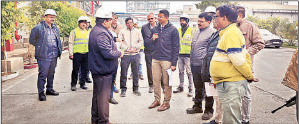
चीनी मिल केमिकल डिवीजन का निरीक्षण करते डीएम और अन्य।