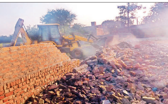
मांझा बरहटा में अवेध प्लाटिंग को ध्वस्त करती जेसीबी।