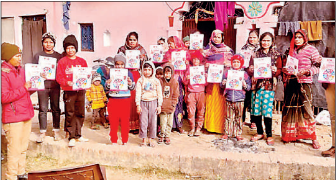
बेटियों और महिलाओं को जागरूक करती सिपाही।