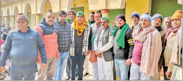
भाकियू युवा जिला अध्यक्ष का स्वागत करते किसान।