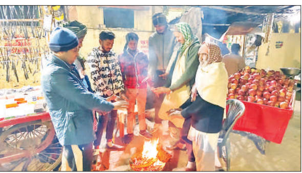
संभल में अलाव जलाकर सर्दी से बचने का प्रयास करते लोग।

मौसम ने मध्यरात्रि के बाद अचानक करवट ली तो भोर करीब चार बजे तापमान 5 डिग्री सेल्सियस रिकॉर्ड किया, जो सुबह आठ बजे तक बना रहा। दिन में तापमान 15 डिग्री सेल्सियस तक पहुंचा लेकिन शाम होते ही फिर से सर्दी बढ़ गई। इस बीच बर्फनील हवाओं ने ठिठुरन और बढ़ा दी। घने कोहरे का सीधा असर जनजीवन पर दिखाई दिया। सड़कों पर वाहनों की दृश्यता थमी रही और रोडवेज बसों में यात्रियों