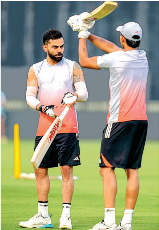
11 जनवरी को भारत और न्यूजीलैंड के बीच सीरीज का पहला एकदिवसीय क्रिकेट मैच है। उसकी तैयारी में गुजरात स्थित वडोदरा के कोटांबी स्टेडियम में अभ्यास करते विराट कोहली (बाएं) और यशस्वी जायसवाल।