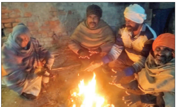
अलाव का सहारा लेते लोग।