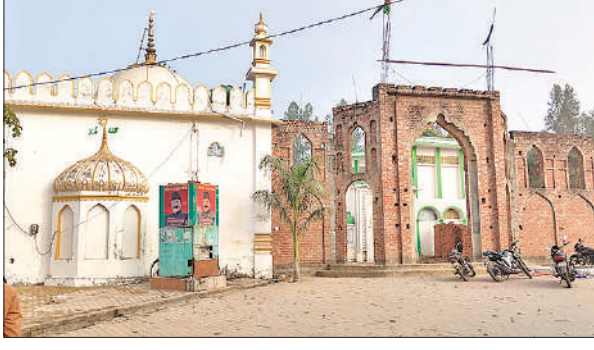
संभल के चौधरी सराय में दादा मियां की मजार व मस्जिद।

तहसीलदार के अल्टीमेटम के बाद क्षेत्र में साप्ताहिक बाजार को नहीं लग पाया। इसी क्रम में शुक्रवार शाम करीब चार बजे एआईएमआईएम के नेता एवं नगर