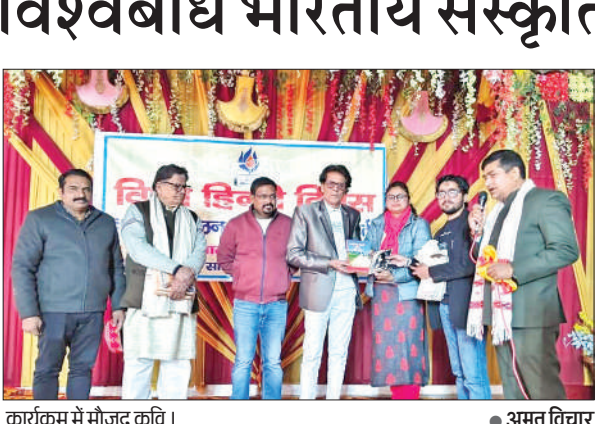
कार्यक्रम में मौजूद कवि।

नगर के बाईपास मार्ग स्थित बैंकवेट हॉल पर अखिल भारतीय साहित्य परिषद द्वारा विश्व हिंदी दिवस की पूर्व संंध्या पर कवि सम्मेलन व साहित्यिक संगोष्ठी का आयोजन किया गया। जिसका आरंभ