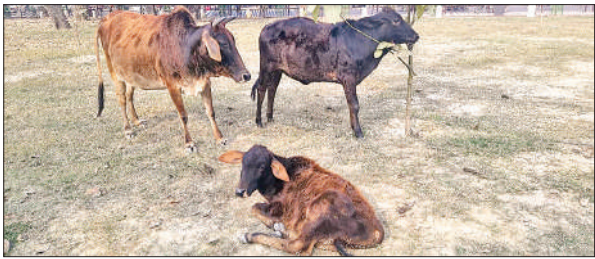
शहर के एक पार्क में बैठे छुट्टा पशु।