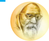
हमारी प्रत्येक कृति छेनी बन कर हमारा

लगभग न के बराबर होती जा रही है। यदि श्रीलंका और नेपाल को छोड़ दें तो विश्व बैंक, संयुक्त राष्ट्र श्रम संगठन, स्वास्थ्य, यूनीस्को आदि के स्टाल विदेशी मंडप में अपनी प्रचार सामग्री प्रदर्शित करते दिखते हैं। फेंकफ़र्ट और अबुधावी पुस्तक मेला के स्टाल भागीदारों को आकर्षित करने के लिए होते हैं। दो-तीन देश के भारत दूतावास किताबें प्रदर्शित कर देते हैं। इक्का-दुक्का स्टालों पर विदेशी पुस्तकों के नाम पर केवल ‘रिमेंडर्स’ यानी अन्य देशों की फालतू या पुरानी पुस्तकें होती हैं। ऐसी पुस्तकों को प्रत्येक रविवार को दूरियांगंज में लगने वाले पटरी-बाजार से आसानी से खरीदा जा सकता है। पहले पाकिस्तान से दस प्रकाशक आते थे, लेकिन बीते 15 सालों से पाकिस्तान के साथ बाकी तिजारत तो जारी है, लेकिन एक दूसरे के पुस्तक मेलों में भागीदारी बंद हो गई।