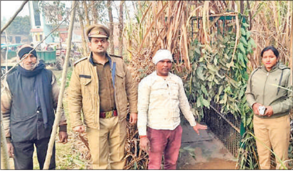
तेंदुए को पकड़ने के लिए पिंजरा लगती वन विभाग की टीम।

ग्रामीणों के अनुसार बीते कई दिनों से तेंदुआ आबादी के आसपास खुलेआम विचरण करता देखा जा रहा है। खेतों में कार्य करने गए किसानों ने कई बार तेंदुए को झाड़ियों और गन्ने के खेतों के बीच घूमते हुए देखा, जिससे ग्रामीणों में भारी दहशत फैल गई है। सुरक्षा की दृष्टि से बच्चों, महिलाओं और बुजुर्गों को घरों से बाहर निकलने से रोक दिया गया है। ग्रामीणों की सूचना पर वन विभाग की टीम मौके पर पहुंची और ग्रामीणों के सहयोग