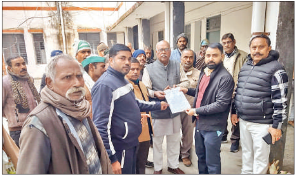
उपजिलाधिकारी को ज्ञापन देते भाकियू अराजनैतिक से जुड़े किसान। ● अमृत विचार

बिजली विभाग द्वारा जानबूझकर गलत बिल थमाए जा रहे हैं। 400 से 500 रुपये आने वाला बिजली बिल हजारों में भेजा जा रहा है। मिलक विद्युत केंद्र, सिहारी, उपकेंद्र, पिपला शिवनगर उपकेंद्र