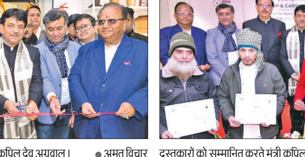
कैश एंड कैरी सेंटर का उद्घाटन करते मंत्री कपिल देव अग्रवाल।

कहा कि एक छत के नीचे निर्यातकों को पूरे बाजार की झलक मिल रही है। कैश एंड कैरी सेंटर इसमें अहम साबित होगा। उन्होंने कहा कि प्रधानमंत्री नरेंद्र मोदी के नेतृत्व में सरकार देश की अर्थव्यवस्था को मजबूती देने में जुटी है। प्रदेश सरकार नई तकनीकों को लेकर