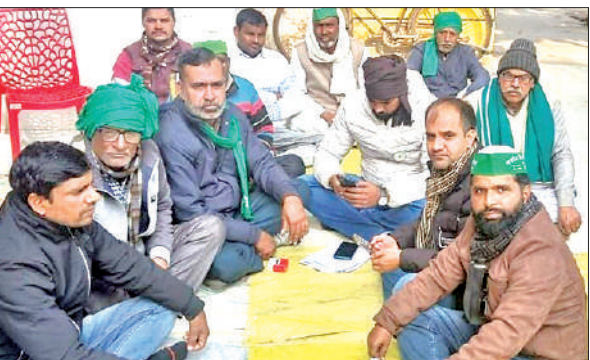
संभल ब्लाक कार्यालय में धरना देते भाकियू पदाधिकारी।

बीडीओ के कथित गलत व्यवहार से नाराज भाकियू टिकैत के पदाधिकारी अनिश्चितकालीन धरने पर बैठ गए। किसान नेताओं का आरोप है कि बीडीओ संभल