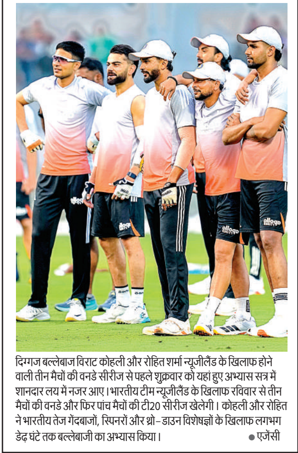
दिग्गज बल्लेबाज विराट कोहली और रोहित शर्मा न्यूजीलैंड के खिलाफ होने वाली तीन मैचों की वनडे सीरीज से पहले शुक्रवार को यहां हुए अभ्यास सत्र में शानदार लय में नजर आए। भारतीय टीम न्यूजीलैंड के खिलाफ रविवार से तीन मैचों की वनडे और फिर पांच मैचों की टी20 सीरीज खेलेगी। कोहली और रोहित ने भारतीय तेज गेंदबाजों, स्पिनरों और ग्लो-डाउन विशेषज्ञों के खिलाफ लगभग डेढ़ घंटे तक बल्लेबाजी का अभ्यास किया।