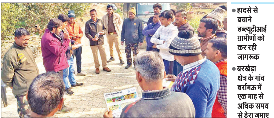
बरामऊ में ग्रामीणों को जागरूक करती डब्ल्यूटीआई की टीम।

करीब माह भर पहले जंगल से निकलकर एक तेंदुआ बरखेड़ा क्षेत्र के गांव बरामऊ की सीमा में जा पहुंचा था। जिसके बाद तेंदुआ आबादी के ईर्द गिंद ही मंडरा रहा था। हालांकि सप्ताह भर पहले तेंदुआ की चहल कदमी धीरे-धीरे कम हो गई थी। तेंदुआ के जंगल की ओर चले जाने की संभावना के चलते निगरानी भी बंद कर दी गई। मगर, बीते शुक्रवार को तेंदुआ ने एक बार फिर गांव में दस्तक देकर दहशत फैला दी थी। उस रात तेंदुआ की कुत्ते के बच्चों को उठा ले गया था।