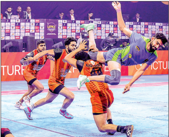
अवध रामदूत (लाल ड्रेस) और पूर्वांचल पैथर्स के खिलाड़ी।