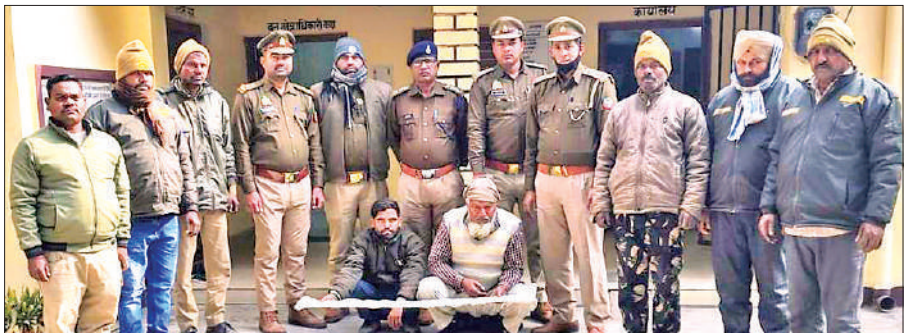
पकड़े गए लकड़ी तस्करों के साथ खड़ी पूरनपुर रेंज की टीम।

मामला वन एवं वन्यजीव प्रभाग की पूरनपुर रेंज के अंतर्गत आरक्षित