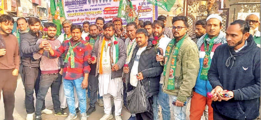
गोला में लोगों को कलम आा फूल देते पदाधिकारी।

देश में फैल रही नफरत की राजनीति लोकतंत्र और सामाजिक