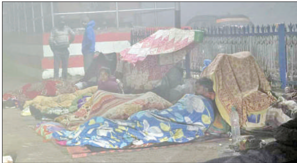
रेलवे स्टेशन के बाहर सड़क पर सोते लोग।