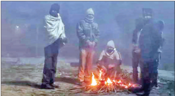
गन्ने की पताई जलाकर आग तापते सिपाही, होमगार्ड व अन्य।

शहर के कई चौराहों पर कूड़ा करकट जलाकर राहत पाने का प्रयास ,ढेकेदार की ओर से डलवाई गई लकड़ियां निकली गीली , बढ़ गई मुसीबत