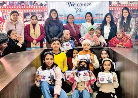
वृद्धाश्रम में बुजुर्गों के साथ जेसीआई पीलीभीत पलर्स के सदस्य।

सर्दी से बचाव के लिए हॉट वॉटर बैग वितरित किए। अध्यक्ष ने कहा कि इस पहल का उद्देश्य बुजुर्गों को ठंड से बचाना और उन्हें स्नेह प्रदान करना रहा है। यह सेवा कार्य संस्था की सामाजिक उत्तरदायित्व की प्रतिबद्धता को दर्शाता है। बुजुर्गों की सेवा करना सभी का कर्तव्य है। वृद्धाश्रम के प्रभारी ने जेसीआई पीलीभीत पलर्स का आभार व्यक्त किया।