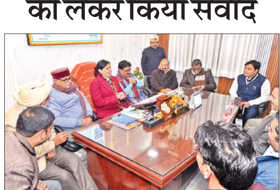
नगर पालिका कार्यालय में मौजूद समिति अध्यक्ष, चेयरमैन व अन्य।