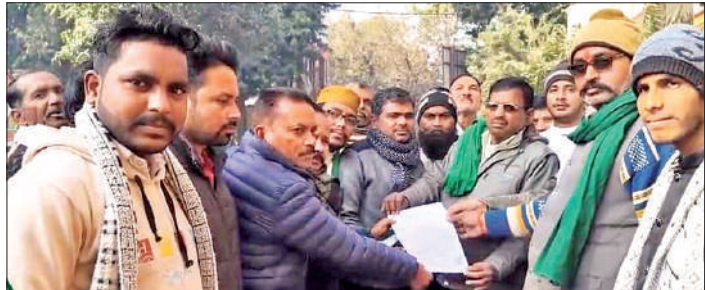
पूरनपुर में धरना देकर जापन देते भाकियू भानु कार्यकर्ता।