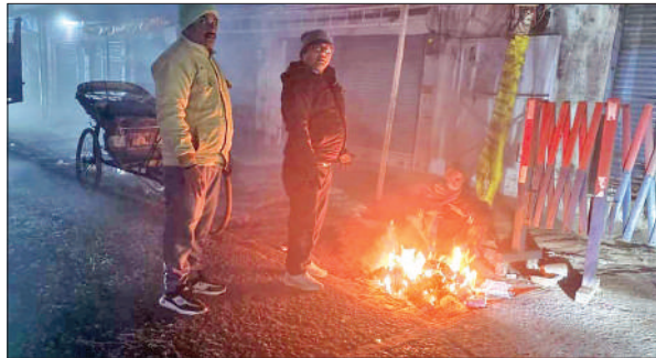
ड्रमंडगंज चौराहा पर कूड़ा करकट जलाकर तापते लोग।

जापन में बताया कि पूरनपुर ब्लॉक क्षेत्र में संचालित विभिन्न सरकारी योजनाओं और कायाकल्प कार्यों में व्यापक स्तर पर भ्रष्टाचार है। आरोप है कि मनरेगा, प्रधानमंत्री आवास योजना, वृद्धा पेंशन, राशन कार्ड, शौचालय निर्माण, जन्म-मृत्यु प्रमाण पत्र सहित अन्य योजनाओं और सेवाओं में आम जनता से