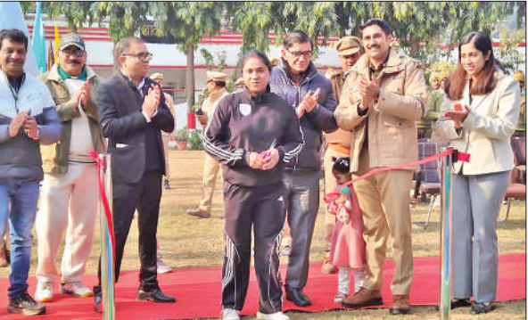
पिकलबॉल कोर्ट की शुरुआत के दौरान मौजूद अधिकारी।