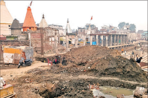
निर्माणधीन छेटी काशी शिव मंदिर कॉरिडोर।

स्थलीय निरीक्षण में एसडीएम गोला सहित अन्य अधिकारियों ने पाया कि निर्माण स्थल पर न श्रमिक पर्याप्त हैं, न ही काम में अपेक्षित तेजी। यूपी