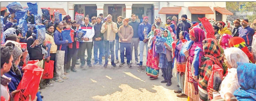
गोला में ट्रैकसूट लिये खड़े सूर्इकर्मियों के साथ पालिकाध्यक्ष।