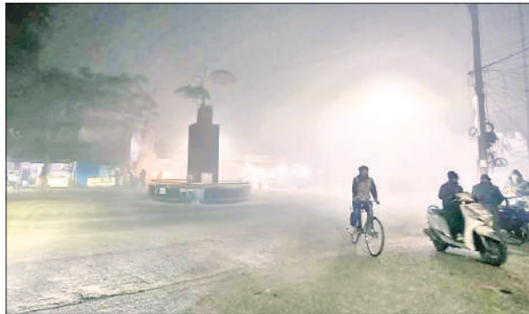
छतरी चौराहा पर लाइटें बंद और अलाव नदारद।

दृश्य तीन : ड्रमंडगंज चौराहा पर कूड़ा जलाकर पाई राहत शहर के मुख्य बाजार से सटे ड्रमंडगंज चौराहा पर भी अलाव की कोई व्यवस्था रात के वक्त नहीं दिखी। पुलिस के लगाए गए बैरियर के पास आग जलाकर कुछ लोग तापते दिखाई दिए। कोहरे के बीच आग की लपटें दिखी तो लगा मानों यहां अलाव लगवाया गया है। मगर यहां पर भी कोई अलाव की व्यवस्था नहीं थी। कूड़ करकट जलाकर ही सर्दी से राहत पाने की जद्दोजहद जरूरतमंद करते दिखाई दिए। नगर पालिका के कर्मचारी रात्रि ड्यूटी पर सफाई कर रहे थे। मगर अलाव का अता-पता नहीं था।