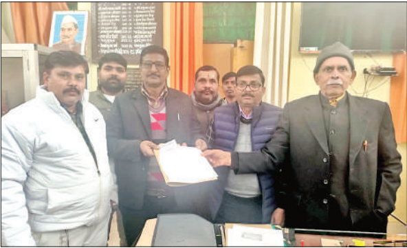
नामांकन दाखिल करते अधिवक्ता।

अमृत विचार: जिला अधिवक्ता संघ का चुनाव इस बार बेहद रोचक और प्रतिस्पर्धात्मक होने जा रहा है। शुक्रवार को नामांकन वापसी की अंतिम तिथि थी, लेकिन निर्धारित समय सीमा के भीतर किसी भी प्रत्याशी ने अपना नामांकन पत्र वापस नहीं लिया। गवर्निंग कौंसिल वरिष्ठ के तीन पदों पर तीन ही नामांकन दाखिल होने से निर्विरोध निर्वाचन तय माना जा रहा है। अब 13 पदों पर 29 उम्मीदवार चुनावी मैदान में ताल ठोक रहे हैं। जिला अधिवक्ता संघ के अध्यक्ष सहित विभिन्न पदों पर आगामी 17 जनवरी को मतदान कराया जाएगा, जबकि 18 जनवरी को मतगणना के साथ ही चुनाव परिणाम घोषित किए जाएंगे। इससे पहले जांच के दौरान सभी नामांकन पत्र वैध पाए गए थे। शुक्रवार को नामांकन वापसी की प्रक्रिया पूरी होने के बाद मुख्य निर्वाचन अधिकारी प्रहलाद ने शाम चार बजे अंतिम प्रत्याशी सूची