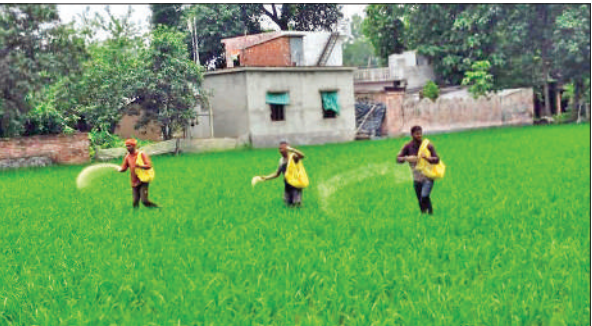
जनपद के न्यूरिया क्षेत्र में फसल में खाद डालते किसान।

जनपद में करीब 2.86 लाख से अधिक किसान है। यहां मुख्यतः गेहूं, धान और गन्ने की सर्वाधिक पैदावार की जाती है। ऐसे में यह जनपद प्रदेश में कृषि क्षेत्र में अग्रणी जनपदों में शामिल है। कृषि विभाग समेत अन्य विभागों की ओर से किसानों को विभिन्न योजनाओं का लाभ भी दिया जा रहा है, मगर पिछले कुछ सालों