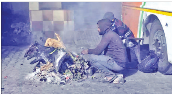
रोडवेज परिसर में अलाव के कुछ इस तरह थे इंतजाम।

दृश्य दो : रेलवे स्टेशन के बाहर सड़क पर सोते मिले लोग कहने को तो रैन बसेरा का इंतजाम प्रशासन और नगर पालिका की ओर से दो स्थानों पर किया गया है। मगर, वहां पर बीती रात कोई पहुंचा ही नहीं। ऐसा भी नहीं कि जरूरतमंद नहीं थे। बीते कई दिनों की तरह रेलवे स्टेशन के बाहर सड़क पर ही महिला पुरुष करीब 30 से अधिक लोग बच्चों के साथ सड़क किनारे ही जहां जगह मिली वहां पर चादर बिछाकर लेटे हुए नजर आए। कुछ क कहना था कि वह लखीमपुर खीरी के गोला से आए हैं। सुबह वापस चले जाएंगे। मगर, रात बिताने के लिए उनको रैन बसेरा की सुविधा नहीं मिल सकी। फिलहाल कुछ अन्य तो ऐसे भी थे जो लगातार ऐसे ही गुजर बसर कर रहे हैं।