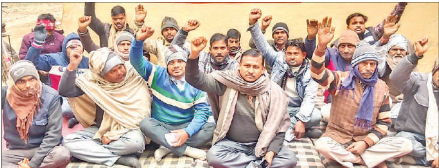
बीसलपुर मंडी समिति में धान खरीद में आरोप लगाकर धरना देते कार्यकर्ता।