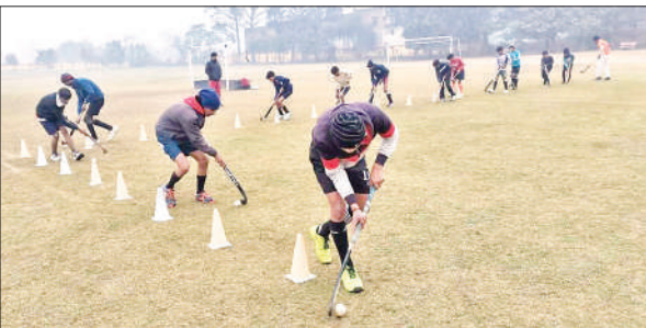
हॉकी की पाठशाला में गुर सीखते खिलाड़ी।