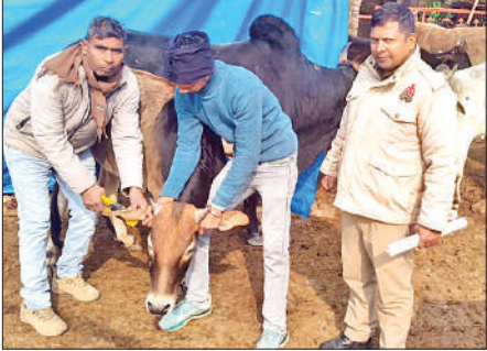
नगर पालिका की गोशाला में पशुओं की टैगिंग करते कर्मचारी।