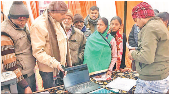
गोला में काउंटर पर महिला की समस्या का निवारण कराते पालिकाध्यक्ष।

मांग रहे हैं। चुनाव को लेकर अधिवक्ता समुदाय में भारी उत्साह देखा जा रहा है। चुनाव अधिकारी भी मतदान को शांतिपूर्ण और निष्पक्ष ढंग से संपन्न कराने की तैयारियों में जुटे हुए हैं। अब सबकी निगाहें 17 जनवरी को होने वाले मतदान पर टिकी हैं, जहां मतदाता अधिवक्ता अपने मताधिकार का प्रयोग कर संघ की नई कार्यकारिणी का चयन करेंगे।