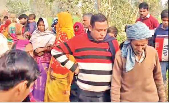
हादसे के बाद घटनास्थल पर एकत्र लोग।

क्षेत्र के बहगुलपुर, फतेहपुर, सहजनपुर, बिहारीपुर, मेहतरपुर, खजुरिया संपत समेत कई गांवों में पिछले कई महीनों से अवैध किया जा रहा है। इसके साथ खनन में लगी ट्रैक्टर ट्रॉली और डंपर से ग्रामीण परेशान हैं। ग्रामीणों की ओर से इसकी शिकायतें आईजीआरएस और लिखित रूप में भी लगातार की जाती रही हैं,