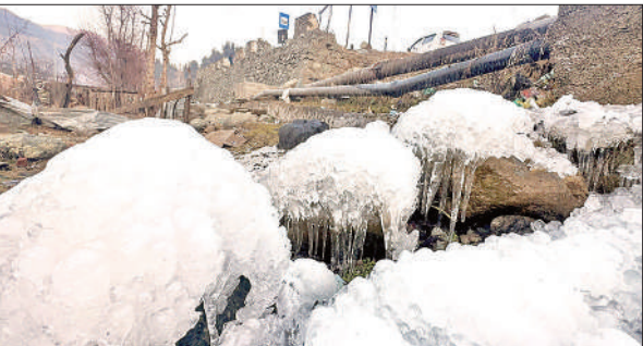
जम्मू- कश्मीर में शीतलहर चरम पर है, कई जगहों पर पारा शून्य से नीचे चला गया है, बर्फबारी भी हो रही है। अनंतनाग जिले में बर्फ की चादर से ढकी चट्टानें।

दिल्ली में शुक्रवार का दिन सबसे ठंडा रहा (जहां न्यूनतम तापमान सबसे निचले स्तर पर पहुंच गया जबकि शहर के कई स्थानों पर हल्की बारिश भी हुई। न्यूनतम तापमान 4.6 डिग्री रहा, जो सामान्य तापमान से 2.3 डिग्री कम था। शहरभर के मौसम स्टेशनों के अनुसार, सफ़दरजंग में न्यूनतम तापमान 4.6 डिग्री रहा, पालम में 5.0 डिग्री तापमान दर्ज किया गया। भारत मौसम विज्ञान विभाग (आईएमडी) के अनुसार, आगामी दिनों में दिल्ली-एनसीआर समेत उत्तर और उत्तर-पश्चिम भारत के कुछ हिस्सों में शीत लहर की स्थिति बनी रहेगी। इस बीच, दिल्ली