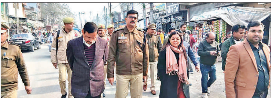
ईओ पर लगे आरोपों की जांच करने कस्बे में पहुंचे पुलिस-प्रशासनिक अफसर।