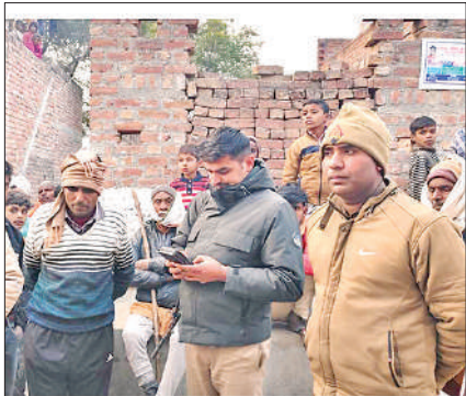
मौके पर जांच करती पुलिस।