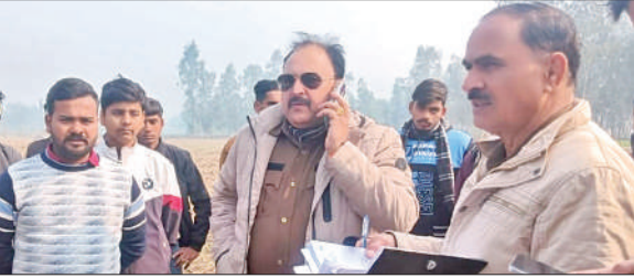
मौके पर जांच करती पुलिस टीम।

अमृत विचार : सुकटिया क्षेत्र के जंगल में तस्कर दो तीन गोवंशीय पशुओं का वध कर मांस ले गए। अवशेष वहीं छोड़ गए। सूचना देने के एक घंटे के बाद पुलिस के पहुंचने पर गोरक्षा हिंदू दल के पदाधिकारी और कार्यकर्ताओं ने हंगामा किया। तस्करों के खिलाफ कार्रवाई की मांग की। चौकी नरायन नगला क्षेत्र के शुक्रवार