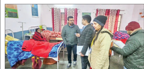
सीएचसी का निरीक्षण करती टीम।