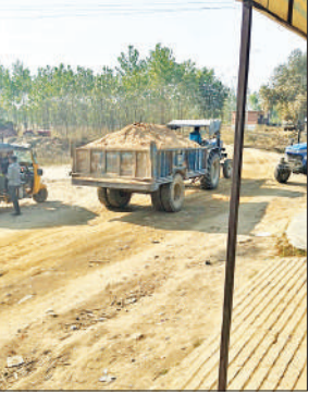
मिट्टी लेकर दौड़ रही ट्रैक्टर-ट्रालियां।

अवैध खनन में चल रहे डंपर और ट्रैक्टर ट्राली ओवरलोड मिट्टी भरकर ले जाते हैं। गांव की सड़कें जर्जर हो गयी हैं। इन पर चलना मुश्किल है। मगर जिम्मेदार खामोश है।