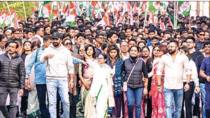
ईडी के खिलाफ रैली निकालती पश्चिम बंगाल की मुख्यमंत्री ममता बनर्जी।

मंडी स्थित केंद्रीय प्राणग के साइबर अपराध पुलिस स्टेशन में इस संबंध में प्राथमिकी दर्ज की गई है। एक आधिकारिक प्रवक्ता ने बताया कि साइबर पुलिस इस मामले में तथ्यों की छानबीन कर रही है। कुछ अज्ञात लोगों ने फोन और वीडियो कॉल के