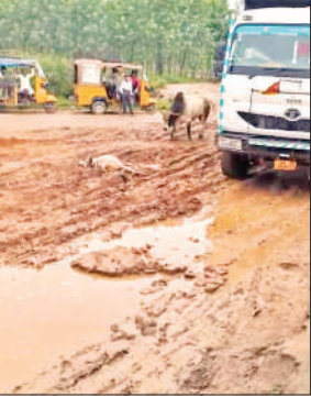
डंपर भी अवैध खनन में लगे हैं।

के कई अधिकारी गांव में आए थे। इस बीच अवैध खनन बंद रहा