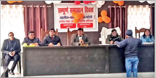
नागरिक सुरक्षा को लेकर जानकारी देते अधिकारी।