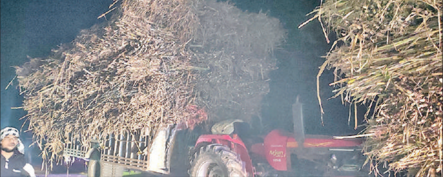
गन्ने से लदी ओवरलोड ट्रैक्टर-ट्राली बन रही हादसे का सबब।