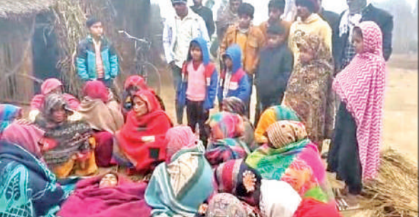
छात्र की मौत के बाद रोते-बिलखते परिजन।