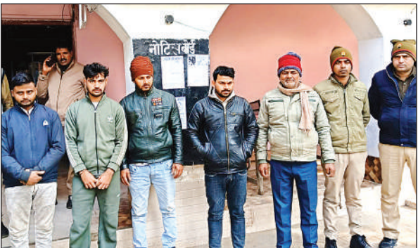
पुलिस गिरफ्त में पथराव व फायरिंग के आरोपी।

शुक्रवार की शाम सदर कोतवाली के मोहल्ला शेखपुरा में दो पक्ष आपस में वोट करने को लेकर चर्चा कर रहे थे। आरोप है कि एक पक्ष के वोट कट गये। इसी पर वाद विवाद होने लगा। मामला गालीगलौज के बाद नौबत मारपीट की आ गई। दोनों पक्षों के लोग आमने सामने आ गये। इसी बीच पथराव शुरू हो गया। मकान की छतों व गलियों से एक दूसरे पर पथराव होने लगा। इससे मोहल्ले में भगदड़ मच गई। जिसे जहां जगह मिली वहीं छिप कर जान बचाई।