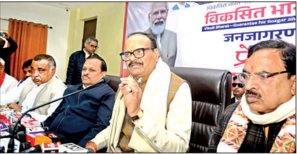
प्रेसवार्ता में बोलते उप मुख्यमंत्री ब्रजेश पाठक, साथ में भाजपा के अन्य नेता।