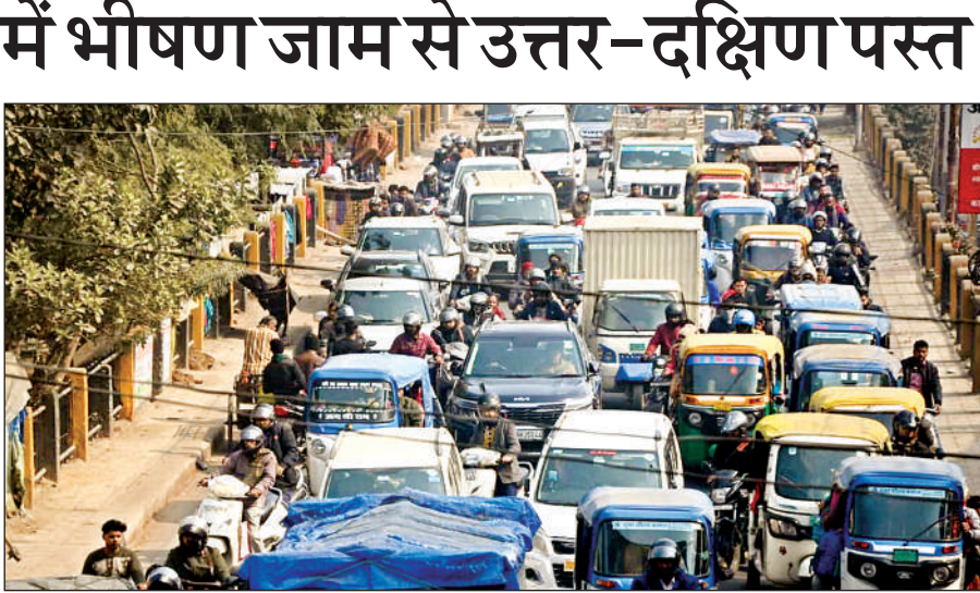
गोविंद नगर में लगा भीषण जाम।