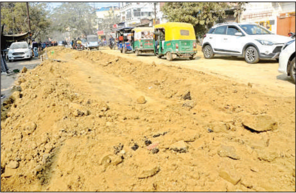
काकादेव में खोदा गया मुख्य मार्ग।