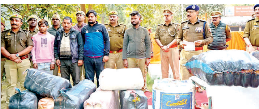
पुलिस गिरफ्त में आरोपी व जप्त किया गया गांजा।

अमृत विचार। घाटमपुर के सजेती थाना क्षेत्र के अंतर्गत बरीपाल मोड़ के पास शनिवार को चेकिंग के दौरान सजेती पुलिस को एक बड़ी सफलता हाथ लगी है। पुलिस ने चेकिंग के दौरान दो लजरी कारों में ले जाया जा रहा गांजा सहित तीन तस्करों को गिरफ्तार कर कोर्ट में पेश किया, जहां से उसे जेल भेजा। सजेती थाना पुलिस द्वारा आनपुर-बरीपाल मार्ग पर संदिग्ध व्यक्तियों के वाहनों की चेकिंग की जा रही थी। इस दौरान सजेती पुलिस को सूचना मिली कि दो चार पहिया वाहन हमीरपुर की ओर से बरीपाल होते हुए अवैध मादक पदार्थ गांजा लिए कानपुर की ओर जा रहे हैं। तभी बरीपाल रोड पर बांध मोड़ के