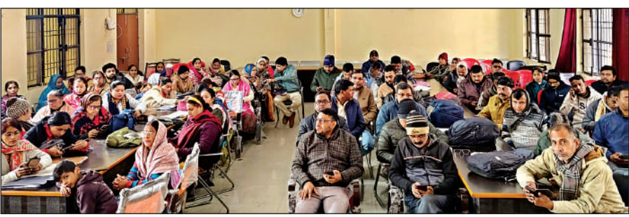
प्रशिक्षण में भाग लेते बीएलओ व सुपरवाइजर।

प्रशिक्षण के दौरान उप जिलाधिकारी ने बृथ लेवल अधिकारियों (बीएलओ) और सुपरवाइजरों को संबोधित करते हुए कहा कि मतदाता सूची की शुद्धता लोकतंत्र की बुनियादी जरूरत है। उन्होंने स्पष्ट निर्देश दिए कि