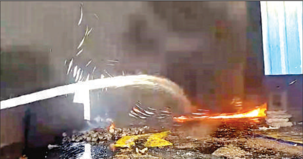
ओंकारेश्वर पेपर फैक्ट्री में धधकती रही आग।

खानपुर खडंजा रोड स्थित ओंकारेश्वर पेपर फैक्ट्री में कागज का गिलास बनाने का काम किया जाता है। शनिवार को दोपहर करीब चार बजे नव निर्मित टीनशेड के अंदर फैले कचरे को वहां पर मौजूद मजदूर जलाकर आग ताप रहे थे और इसी दौरान आग शोड में भरे कबाड़ के ढेर में भी आग पकड़ ली