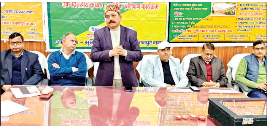
मोती की खेती का प्रशिक्षण देते एक्सपर्ट।