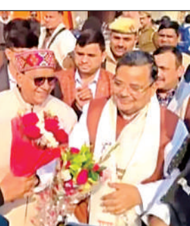
ठाकुर जयवीर सिंह का हुआ स्वागत।

● जिले के प्रभारी मंत्री व पर्यटन मंत्री जयवीर सिंह ने किया शुभारंभ