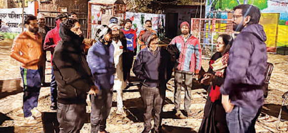
कान्हा गौशाला का निरीक्षण करती पालिकाध्यक्षा ।

नबावगंज, उन्नाव अमृत विचार । भारत की पहली एआई-ऑगमेंटेड मल्टीडिसिप्लिनरी यूनिवर्सिटी चंडीगढ़ यूनिवर्सिटी उत्तर प्रदेश ने उत्तर प्रदेश सरकार के सहयोग से एआई कन्वर्जेंस समिट 2026 का भव्य आयोजन किया । यह समिट भारत सरकार द्वारा फरवरी में नई दिल्ली में आयोजित होने वाली इंडिया एआई इम्पैक्ट ग्लोबल समिट 2026 के आधिकारिक प्री-इवेंट्स में शामिल है । समिट में भारत सहित अमेरिका, डेनमार्क, जर्मनी और यूनाइटेड किंगडम से आए 70 से अधिक एआई, हेल्थकेयर और टेक्नोलॉजी विशेषज्ञों, पॉलिसीमेकर्स, उद्योग जगत के नेताओं, स्टार्ट-अप्स और शिक्षाविदों ने सहभागिता की । इसी दौरान चंडीगढ़ यूनिवर्सिटी यूपी ने भारत का पहला एआई हेल्थकेयर हैकार्थॉन भी आयोजित किया, जिसमें देशभर से 1,500 टीमों के 5,000 से अधिक युवा प्रतिभागी भाग ले रहे हैं । हेल्थ सेक्टर से जुड़े 100 से अधिक प्रॉब्लम स्टेटमेंट्स पर एआई आधारित समाधान विकसित किए जा रहे हैं । समिट का प्रमुख आकर्षण 'सेपिंग इंडिया' एआई एंड क्वांटम फ्यूचर' विषय पर आयोजित पॉलिसी डायलॉग रहा ।