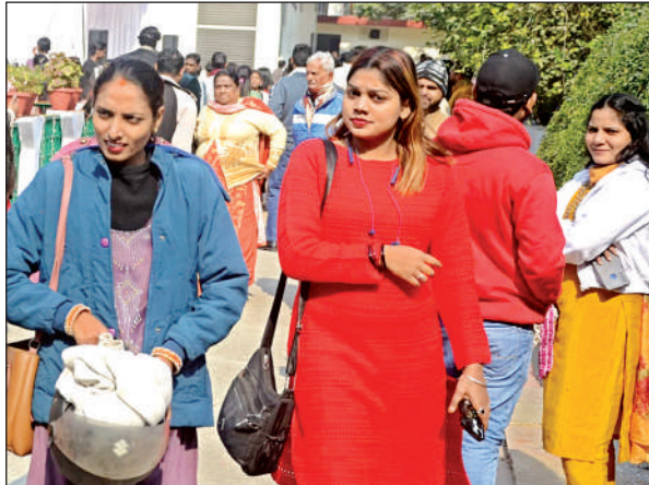
धूप खिली तो लोग बाहर घूमने निकले।