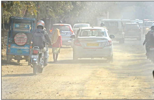
काकादेव में खोदा गया मुख्य मार्ग।