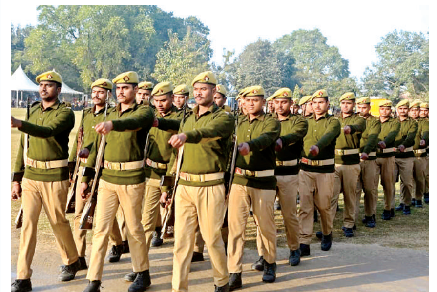
राष्ट्र पथ पर कदम ताल करते वीरों की वीरता राष्ट्रीय ध्वज को शिखर पर रख कर कर्तव्य पथ पर निडर होकर आगे बढ़ते रहना। पुलिस लाइन मैदान पर राष्ट्र भक्ति से सराबोर कदम ताल कर रहसिल करती वीरों की टुकड़ी गणतंत्र दिवस समारोह में शामिल होने को तैयार है।

गया। पहले स्थान पर आजमगढ़ रहा। यहां का तापमान 3.7 डिग्री सेल्सियस रिकॉर्ड किया गया। उधर शहर का दिन का तापमान शनिवार को 23.6 डिग्री सेल्सियस आंका गया। शुक्रवार को यह 17.5 डिग्री सेल्सियस रिकॉर्ड किया गया था। इस तरह से शहर के अधिकतम तापमान लगभग 5 डिग्री सेल्सियस की अधिकता दर्ज की गई। मौसम विशेषज्ञ डॉ. एसएन सुनील पाण्डेय ने बताया कि रविवार को शहर में तेज हवाएं चल सकती है। इन हवाओं की गति 10 किलोमीटर प्रतिघंटे की रफ्तार हो सकती है। तेज हवाओं के साथ तेज धूप भी निकल सकती है। तेज हवाओं की वजह से धुंध व कोहरा भी कम रह सकता है। शाम व सुबह गलन भरी सदी हो सकती है।