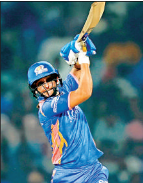
हरमनप्रीत कौर।