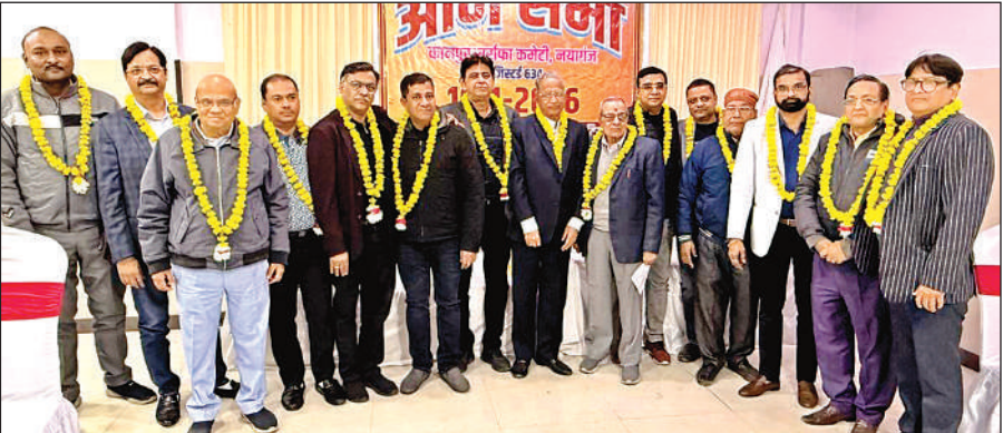
आम सभा में चुने गए पदाधिकारी।