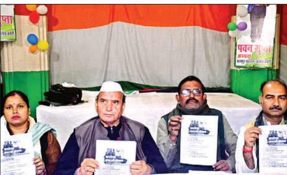
तिलक हाल में पत्रकारों से वार्ता करते कांग्रेसी नेता।