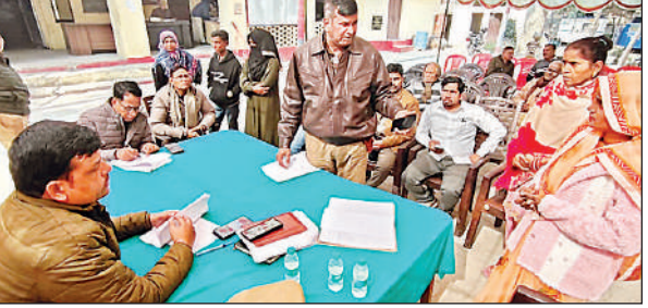
गंगाघाट कोतवाली में समाधान दिवस पर समस्याएं सुनते इस्पेक्टर । अमृत विचार

गारंटी फॉर रोजगार एंड अजीविका मिशन ग्रामीण) की जगह महानागांधी राष्ट्रीय ग्रामीण रोजगार गारंटी अधिनियम लिखे होने पर मंत्री ने ऐतराज जताया । मंत्री ने कहा कि फाइल में मनरेगा क्यों लिखा है । वीबी-जीरामजी लिखा होना चाहिए ।