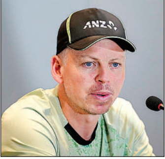
न्यूजीलैंड के कप्तान माइकल ब्रेसवेल।

श्रेयस अय्यर की वापसी से बल्लेबाजी क्रम में चल रहे प्रयोगों