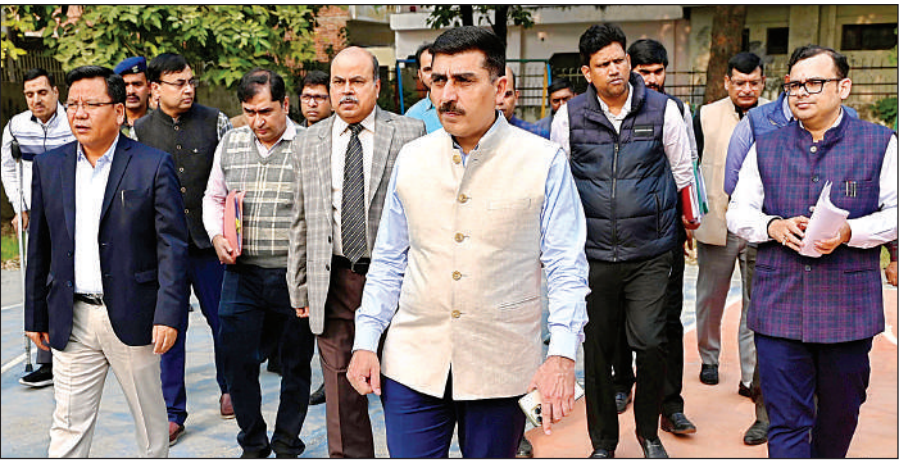
शासन की ओर से गठित टीम नवंबर में जांच करने शहर आई थी।