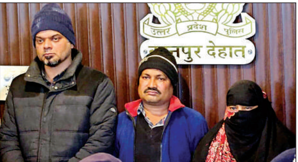
पुलिस लाइन में पत्रकारों के सामने पेश किए गए धर्मांतरण के आरोपी।