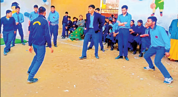
छात्रों ने खेल में भाग लिया।