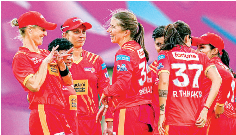
जीत का जश्न मनाती गुजरात जाइंट्स की खिलाड़ी।

पहले बल्लेबाजी के लिए भेजे जाने पर कप्तान एशले गार्डनर के 65 रन और जॉर्जिया वेयरहैम के 10 गेंद में नाबाद 27 रन की मदद से गुजरात जाइंट्स ने चार विकेट पर 207 रन बनाए। जवाब में लिचफील्ड ने यूपी को दौड़ में बनाये रखा लेकिन 16वें ओवर में उनके आउट होने के बाद गुजरात ने मैच पर शिकंजा कस लिया। लिचफील्ड ने अपनी पारी में आठ चौके और पांच छक्के लगाए। यूपी वारियर्स ने आठ विकेट पर 197 रन बनाए। आशा शोभना ने 10 गेंद में नाबाद 27 रन बनाये जिसमें तीन चौके और दो छक्के शामिल थे लेकिन तब तक बहुत देर हो चुकी थी। गुजरात जायंट्स के लिए आस्ट्रेलिया की लेग स्पिनर