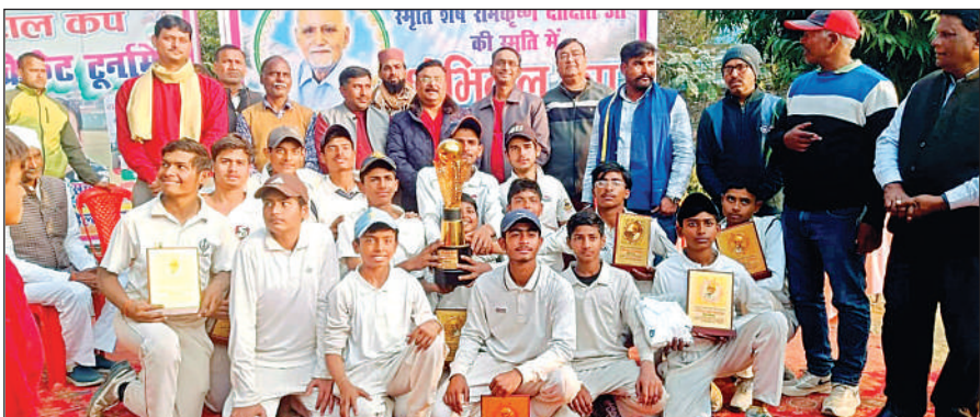
अतिथियों के साथ विजेता टीम।