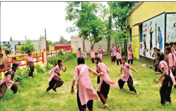
स्कूल में खेलते बच्चे।

कानपुर। जेके जुट मिल व जरीब चौकी फीडर से जुड़े कोहली टॉवर, बंगाल केमिकल के आसपास, जेके जुट मिल, तेजाब मिल कैपस, हिमगिरी कैपस, अनवरराज में बिजली सुबह 10 बजे से शाम छह बजे तक नहीं रहेगी। नौरैया खेड़ा में सुबह 11 बजे से शाम छह बजे तक, बंदा रोड, दबौली, रतनलाल नगर, तिलक नगर, खलासी लाइन व केंडीए कॉलोनी, गोपाल नगर, मंगला विहार में दोपहर तीन बजे तक नहीं रहेगी।