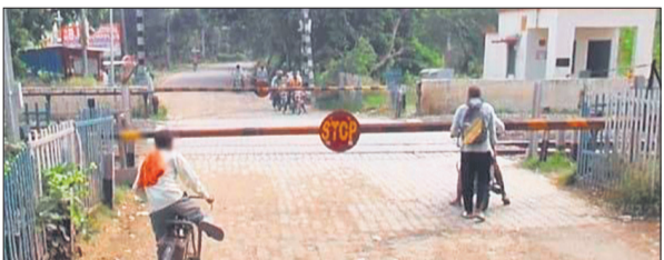
फतेहगंज पश्चिमी में भिटौरा रेलवे क्रॉसिंग।

लोक निर्माण विभाग की ओर से उत्तर रेलवे के महाप्रबंधक को लिखे पत्र में कहा गया है कि भिटौरा रेलवे क्रॉसिंग (सम्पार संख्या 371 बी) पर दो लेन का रेल ओवर ब्रिज की निर्माण कार्य को रेलवे वर्क्स प्रोग्राम में शामिल करे। राज्य सरकार लागत में सहभागिता समेत आठ बिंदुओं पर सहमत है। ओवरब्रिज निर्माण में 66.21 करोड़ रुपये की अनुमानित लागत आएगी। प्रमुख सचिव ने कहा है कि मूल प्रस्ताव रेलवे और