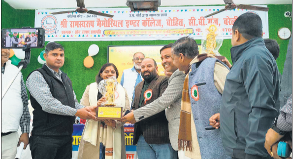
कार्यक्रम में मौजूद अतिथि और पदाधिकारी।

कि या तो काम को पूरी तरह रात में कराया जाए या फिर सड़क की खुदाई के बाद तुरंत समतलीकरण