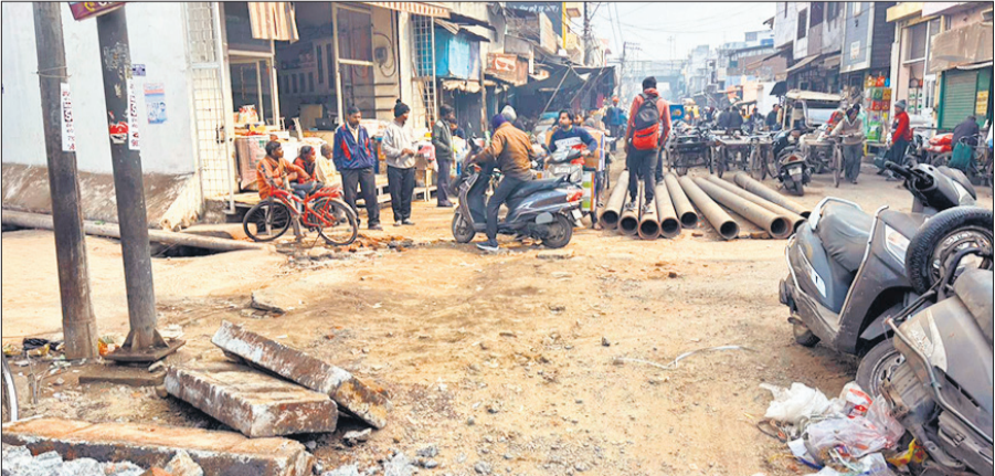
श्यामगंज की गल्ला मंडी में बीच रोड पर पाइपों की वजह से लोगों को परेशानी से जूझना पड़ रहा है।

जिसे पांच दिन बीत चुके हैं, लेकिन अव्यवस्था कम होने के बजाय और बढ़ती जा रही है। दावा किया गया था कि कार्य रात में कराया जाएगा ताकि दिन में यातायात और व्यापार प्रभावित न हो, लेकिन जमीनी हकीकत इसके बिल्कुल उलट है। दिन के समय हालात इतने खराब हैं कि वाहनों की आवाजाही तो दूर, पैदल चलना भी जोखिम भरा हो गया है। जहां-जहां सड़क खोदकर पाइप लाइन डाली गई है, वहां मिट्टी को न तो समतल किया गया है और न ही किसी तरह की बैरिकेडिंग की गई है। बीच सड़क पर बेतरतीब ढंग से पड़े पाइप और गड्ढों के कारण हर कुछ मिनट में जाम लग रहा है, जिससे गल्ला मंडी आने-जाने वाले व्यापारी, ग्राहक और राहगीर सभी परेशान हैं। दरअसल, श्यामगंज क्षेत्र