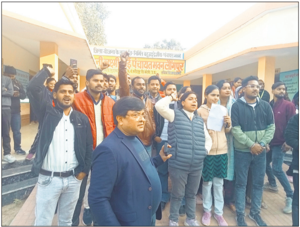
ज्ञापन देने से पहले नारेबाजी करते पंचायत सहायक।