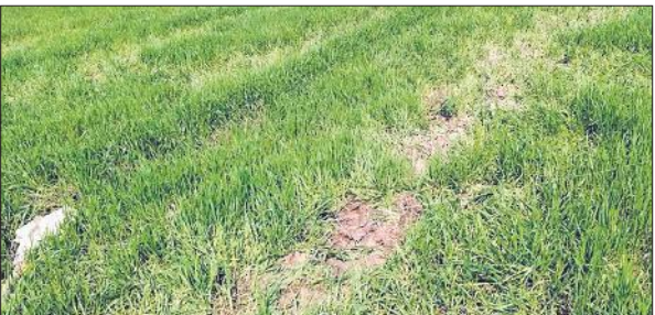
माला रेंज से सटे इलाके में जंगली हाथियों द्वारा रौंदी गई गेहूं की फसल।