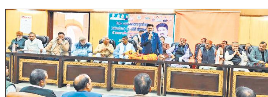
बैठक को संबोधित करते पूर्व केंद्रीय गृह राज्यमंत्री अजय मिश्र टेनी।

विरोधी दलों द्वारा इसे राजनीतिक मुद्दा बनाए जाने पर