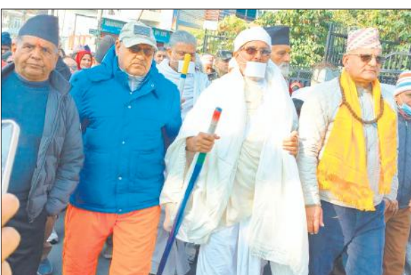
नेपाल के पोखरा से भारत के लिए रवाना होती सर्वोदय शांति पदयात्रा।

सर्वोदय शांति पदयात्रा के भारत आगमन की सूचना मिलते ही भारत में जैन समाज और मुनि के अनुयायियों में उत्साह और खुशी की लहर दौड़ गई है। तिकुनिया समेत आसपास के क्षेत्रों में जैन समाज के लोग यात्रा और जैन साधु-साधवियों के स्वागत की तैयारियों में जुट गए हैं।