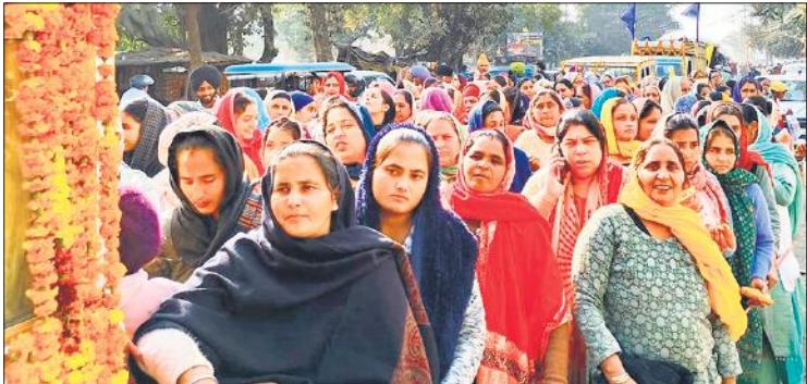
नगर कीर्तन में सेवा करती महिला संगत।

और रागी जत्थों की गुरुवाणी से वातावरण पूरी तरह खालसाभय हो गया। फूलों से सजी गुरु महाराज की पालकी श्रद्धालुओं के आकर्षण का केंद्र रही। सबसे आगे ढोल की थाप पर चलते युवाओं ने पूरे मार्ग में उत्साह का संचार किया। सबसे आगे ट्रैक्टर पर ढोल की धुन बजाते हुए युवा चल रहे थे। पंजाब से आई गतका पार्टी एंड अखंडा ग्रुप के सदस्य हैरतअंग्रेज करतब दिखाते चल रहे थे, अखाड़ा ग्रुप के सदस्यों ने हाथ पर ईंगल बैठाकर करतब, तलवारबाजी और निशानेबाजी ने नगर कीर्तन को रोमांचने से भर दिया। लुधियाना