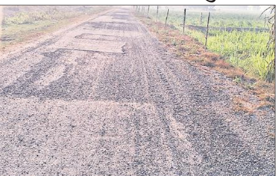
भीरा नहर चौराहा-अलीगंज पटरी मार्ग की उखड़ी बजरी।

वर्ष 2024-25 में लोक निर्माण विभाग ने भीरा हाईवे के भीरा नहर चौराहा से अलीगंज मुख्य नहर किनारे लगभग 14 किलोमीटर सड़क का निर्माण कराया था। इससे बलदेवपुरवा, बिजुआ समेत कई गांवों के लिए आवागमन सुलभ हो गया था, मुख्य चौराहे से नानक फॉर्म के बीच लगभग चार किलोमीटर सड़क की बजरी उखड़ जाने से इस पर पैदल निकलना भी मुश्किल हो गया है। दोपहिया