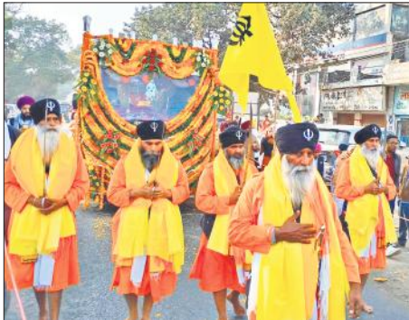
नगर कीर्तन में पालकी के आगे चलते गुरु के पंच प्यार।