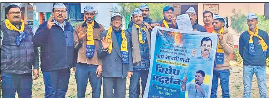
डीएम कार्यालय पर प्रदर्शन करते आम आदमी पार्टी के पदाधिकारी व कार्यकर्ता।