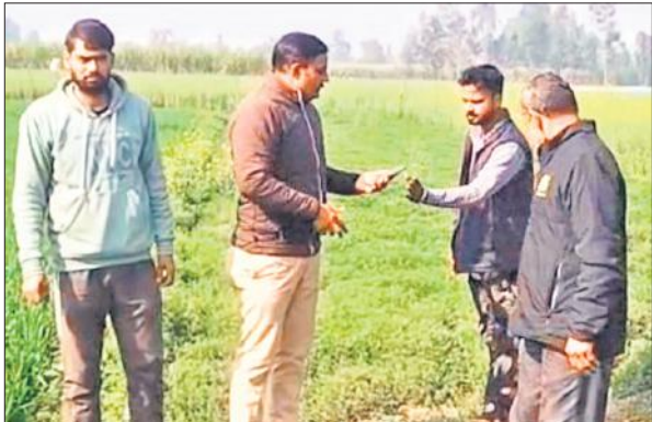
जंगली हाथियों की आमद के बाद जांच करती टीम।

जनपद में पिछले कई सालों से नेपाली हाथी पड़ोसी देश नेपाल और पीलीभीत टाइगर रिजर्व से ही सटी हुई लखीमपुर खोरी की किशनपुर सेंचुरी से आते-जाते रहते हैं। हालांकि नेपाल की ओर से जंगली हाथी दशकों पूर्व