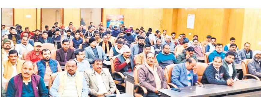
बैठक में मौजूद भाजपा कार्यकर्ता।

बैठक की शुरुआत दीप प्रज्वलन तथा पं. दीनदयाल उपाध्याय एवं श्याम प्रसाद मुखर्जी के चित्रों पर माल्यार्पण कर की गई। पूर्व केंद्रीय मंत्री अजय मिश्र टेनी ने बताया कि 6 जनवरी को उत्तर प्रदेश में एसआईआर कार्यक्रम पूरा होने के बाद नई मतदाता सूची जारी कर दी गई है।