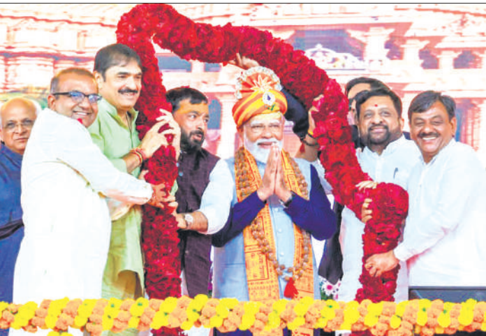
सोमनाथ स्वाभिमान पर्व के दौरान प्रधानमंत्री नरेंद्र मोदी का सम्मान करते सदस्य।

वह सोमनाथ स्वाभिमान पर्व में आयोजित एक विशाल सभा को संबोधित कर रहे थे, जो भारतीय सभ्यता के लचीलेपन को चिह्नित करने के लिए यहां आयोजित किया गया था, जिसका प्रतीक सोमनाथ मंदिर का पुनर्निर्माण है, जिसे 1026 ईस्वी में महमूद गजनी के आक्रमण से शुरू होकर विदेशी आक्रमणकारियों द्वारा बार-बार तबाह किया गया था। उन्होंने कहा, सोमनाथ का इतिहास हमारे पूर्वजों की वीरता का गीत है। यह उनके बलिदान और समर्पण का प्रमाण है। उन्होंने कहा कि आततायी अब इतिहास के पन्नों में सिमट गए हैं, लेकिन सोमनाथ मंदिर आज भी शान से खड़ा है। इससे पहले, प्रधानमंत्री