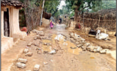
पियरियामाफ़ी में लीकैज से सड़क की दुर्दशा।