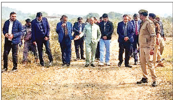
न्यायालय भवन के लिए प्रस्तावित भूमि का जायजा लेते न्यायमूर्ति।