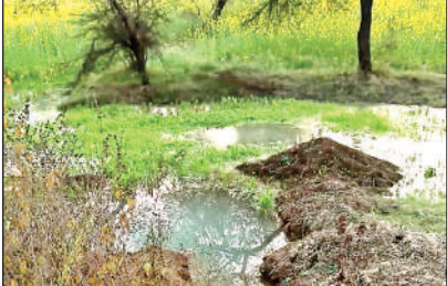
पियरियामाफ़ी में खेत में भर रहा पानी।

■ अब तो सबसे ज्यादा दिक्कत पाइप लाइन के लीकैज की है। पियरियामाफ़ी के शिक्षकपुरम में लीकैज से एक किसान के खेत में पानी भर गया। यही