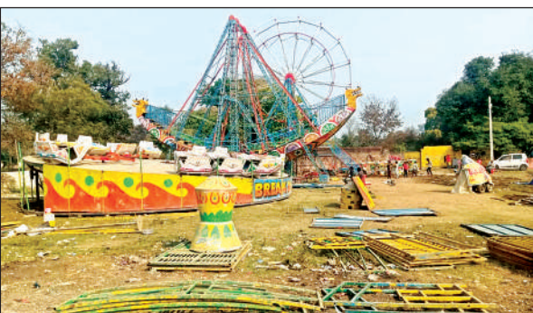
मेले में तैयार होने लगे झूले।

झूला संचालक भी मेला परिसर में झूला लगाने के लिए मजदूरों के साथ जुटे हुए हैं। मेला परिसर में चारों तरफ दुकानें, झूले लगाने और सफाई का कार्य तेजी से चल रहा है। मकर संक्रांति मेले के मात्र दो