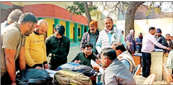
बूथ पर वोटर लिस्ट चेक करते मतदाता।