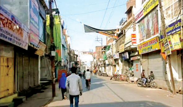
संडे बाजार न लगने से नेहरू रोड पर सन्नाटा।