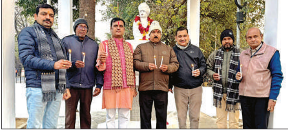
स्वामी विवेकानंद की प्रतिमा पर माल्यार्पण करते लोग।