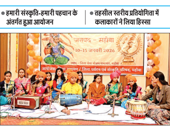
प्रतियोगिता में अपनी कला का प्रदर्शन करते कलाकार।

प्रतियोगिता में तहसील कुलपहाड़, चरखारी एवं सदर तहसील के कलाकारों ने प्रतिभाग किया गया। एकल गायन, समूह गायन, एकल लोकगायन, नृत्य आदि प्रतियोगिताओं का आयोजन किया गया, जिसका दर्शकों ने भरपूर आनंद लिया। कलाकारों ने मंच में अपनी कला का शानदार प्रदर्शन