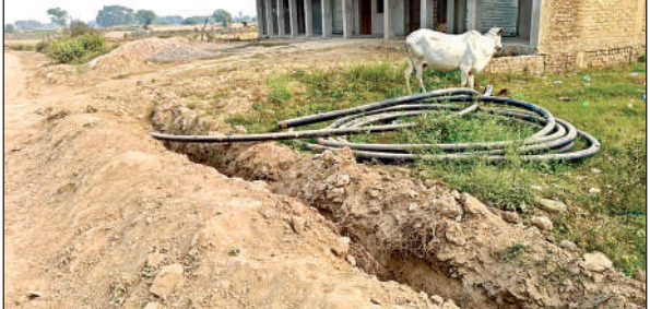
ग्राम पंचायत बरुवा के मजरा गंज में सड़क किनारे खुली पड़ी पाइप लाइन। ग्राम पंचायत अमवा के मजरा भदेवरा में सड़क का हाल। भखरवार में शोपीस बना नल।

एसडीएम ने किया बूथों का निरीक्षण मऊ (चित्रकूट)। उप जिलाधिकारी रामश्रीराम रमन ने रविवार को जिले के विभिन्न मतदान बूथों का निरीक्षण किया और मतदाता सूची से संबंधित जानकारी दी। निरीक्षण के दौरान उन्होंने मतदाता सूची में नाम जोड़ने, हटाने तथा सुधारने के लिए संबंधित नागरिकों को फॉर्म-6, फॉर्म-7 और फॉर्म-8 भरने के निर्देश दिए। एसडीएम ने अधिकारियों को निर्देशित किया कि वे बूथ स्तर पर मतदाताओं को फॉर्म भरने में मदद करें।