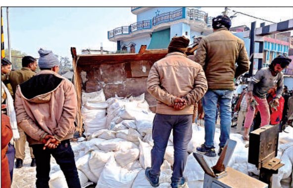
रेलवे लाइन में पलटा केमिकल पाउडर से लदा ट्रैक्टर।

उद्योग नगरी में संचालित एक बहुराष्ट्रीय कंपनी में साबुन आदि के निर्माण के लिए राजस्थान से केमिकल पाउडर रेलवे के माध्यम से मंगाया जाता है। मालगाड़ी से उतारकर इसको डीपिंग ग्राउंड में रखा जाता है। सुबह 10:00 बजे इस केमिकल को ट्रैक्टर ट्राली में लादकर फैक्ट्री ले जाया जा रहा था। बांदा मार्ग के गेट संख्या 31 में पटरी पर आते ही ट्रैक्टर का संतुलन बिगड़ गया और ट्राली रेलवे लाइन के ऊपर पलट गई। इससे बांदा मार्ग सहित