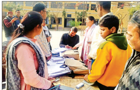
निरीक्षण करते एडीएम।

उन्होंने कई बूथों पर व्यवस्थाओं का जायजा लिया और आवश्यक दिशा निर्देश दिए। उन्होंने विद्यालय स्थित बूथ संख्या 145, 146, 147, 148 और 149 का बारीकी से निरीक्षण किया। निरीक्षण के दौरान बीएलओ द्वारा भरे जा रहे फॉर्मों की जांच की और वहां उपस्थित ग्रामीणों से फीडबैक लिया। मौके पर कई फोटो में किसी भी प्रकार की गलती और नाम कटवाने के लिए उपस्थित मिले।