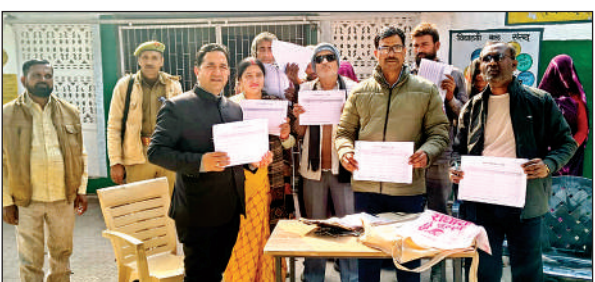
मतदाता सूची पढ़कर सुनाते बीएलओ।

बताया कि यदि ड्राफ्ट मतदाता सूची में नाम है और विवरण में त्रुटियां हैं तो फॉर्म-8 भरकर दें जिससे वो त्रुटियां ठीक हो जाएं। उक्त अभियान के दौरान बीएलओ ने आम नागरिकों को मतदाता