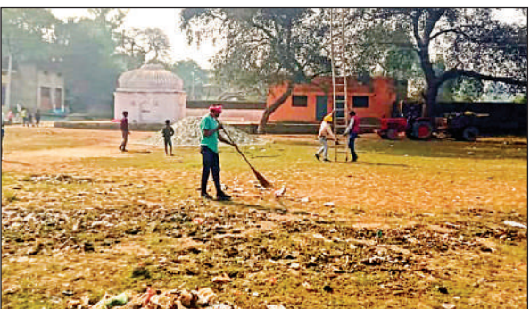
मेला मैदान में सफाई करते कर्मी।