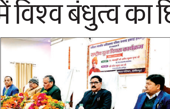
कार्यक्रम को संबोधित करते हाईकोर्ट के प्रशासनिक न्यायमूर्ति।