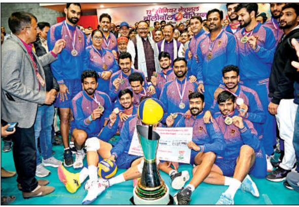
खिताब के साथ रेलवे की टीम।

अमृत विचार। भारतीय रेलवे की टीम ने रविवार को यहां सिगरा स्थित डॉ. संपूर्णानंद स्पोर्ट्स स्टेडियम में संपन्न 72वीं सीनियर नेशनल वॉलीबॉल चैम्पियनशिप का पुरुष वर्ग में सर्वजेता का गौरव अर्जित किया। वहीं महिला वर्ग में गत चैम्पियन केरल ने अपनी अर्सदिग्ध श्रेष्ठता बरकरार रखी और लगातार छठी बार उपाधि जीत ली। पुरुषों के फाइनल में रेलवे से संघर्ष नहीं कर सका केरल वाराणसी नगर निगम के सहयोग से रोमांच की पराकाष्ठा तक पहुंचे इस आठ दिवसीय आयोजन का सर्वाधिक दिलचस्प पहलू यह था कि दोनों वर्गों के फाइनल में रेलवे व केरल की टीमें आमने सामने थीं। अंतिम दिन पुरुष वर्ग के फाइनल में रेलवे के स्प्रेशर्स ने केरल की चुनौती को एकतरफा अंदाज में