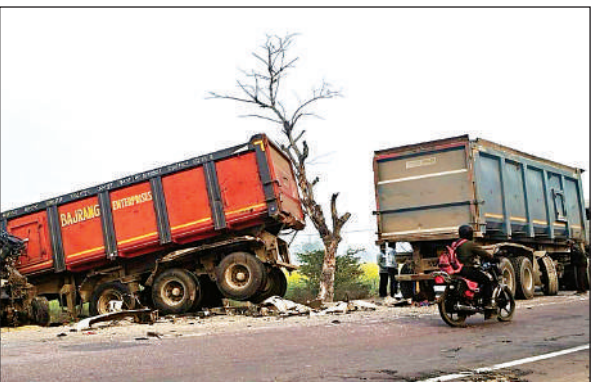
हाईवे पर हादसे के बाद खड़े क्षतिग्रस्त डंपर।