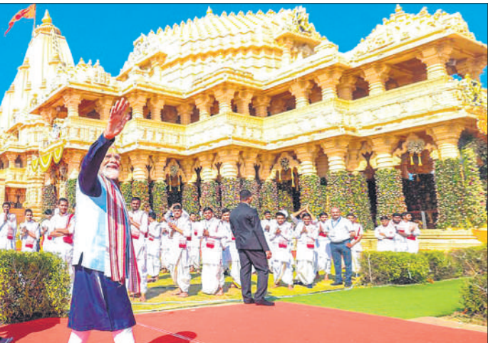
मंदिर के बाहर लोगों का अभिवादन स्वीकार करते प्रधानमंत्री।

में 108 अश्वों की झांकी निकाली गई, जो वीरता और बलिदान का प्रतीक है। सदियों पहले इस मंदिर को नष्ट करने के कई बार प्रयास किए जाने के बावजूद सोमनाथ मंदिर