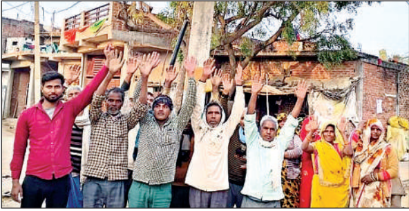
डीपी बदलने को लेकर प्रदर्शन करते ग्रामीण।