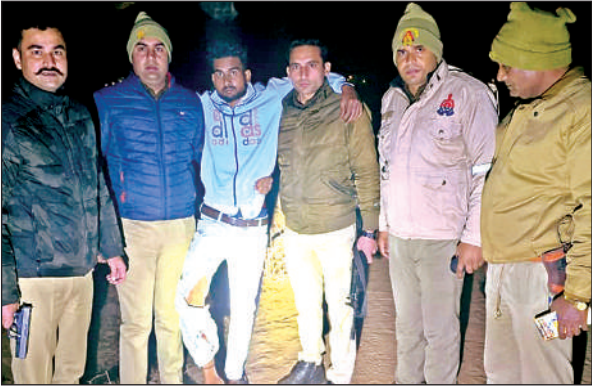
मुठभेड़ में घायल आरोपी को ले जाती पुलिस।

शनिवार शाम को क्षेत्र के एक गांव की बालिका अपने घर के बाहर खेल रही थी तभी मोहल्ले का एक युवक उसे चॉकलेट देने के बहाने अपने साथ ले गया और उसके साथ दुष्कर्म किया। वारदात को अंजाम देने के बाद आरोपी फरार हो गया। जानकारी होने के बाद पिता की तहरीर पर पुलिस ने दुष्कर्म व पॉक्सो एक्ट की धाराओं