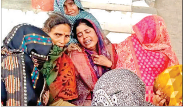
रोते बिलखते परिजन।

थाना क्षेत्र के देवरपुर गांव में शनिवार शाम हुई घटना, परिवार में मचा कोहराम