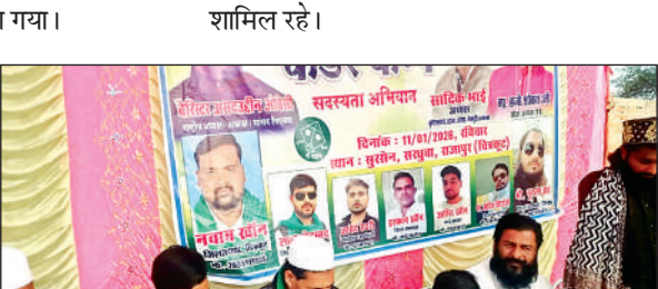
पार्टी की बैठक में मौजूद पदाधिकारी।