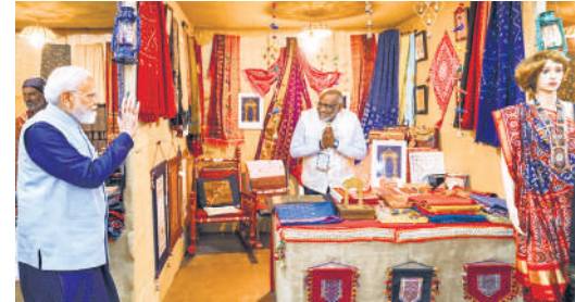
वाइब्रेट गुजरात स्वदेशी मेले का दीदार करते मोदी।

ने शौर्य यात्रा का नेतृत्व किया। इसका आयोजन सोमनाथ मंदिर की रक्षा करते हुए प्राणों की आहुति देने वालों के प्रति सम्मान प्रदर्शित करने के लिए किया गया। इस यात्रा