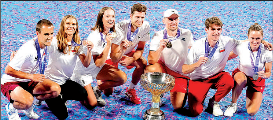
यूनाइटेड कप टेनिस टूर्नामेंट जीतने के बाद पोलैंड की टीम ट्रॉफी के साथ।

के साथ उनकी क्लीनिक और रेडियोलॉजिकल रिपोर्ट पर विस्तृत चर्चा की। जांच में पंत को साइड स्ट्रेन (ऑब्लिक मसल टियर) पाया गया है, जिसके चलते उन्हें वनडे श्रृंखला से बाहर होना पड़ा है। इसके बाद पुरुष चयन समिति ने ध्रुव जुरेल को पंत के स्थान पर टीम में शामिल किया है और वह टीम से जुड़ चुके हैं। जुरेल इस वनडे टीम में रिजर्व विकेटकीपर-बल्लेबाज की भूमिका निभाएंगे। वह शानदार लय में हैं। उन्होंने उन्होंने पिछली साल पारियों में छह बार 50 से अधिक रन बनाए हैं, जिनमें दो शतक भी शामिल हैं।