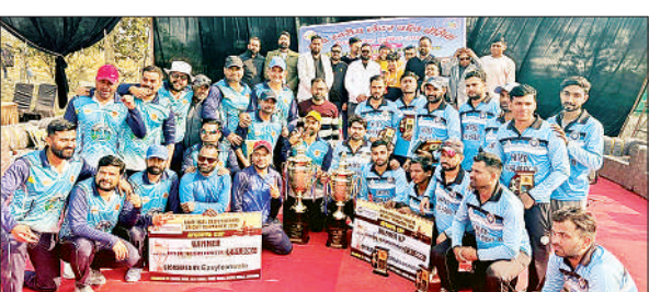
ट्रॉफी के साथ विजेता टीम।

बाराबंकी, अमृत विचार : रविवार को जनपद के सभी 2870 बूथों पर मतदाता सूची का वाचन कराया गया। निगरानी उप जिला निर्वाचन अधिकारी निरंकर सिंह सहित सभी विधानसभाओं के ईआरओ व एईआरओ द्वारा विभिन्न बूथों का निरीक्षण कर की गई। उप जिला निर्वाचन अधिकारी ने बताया कि सभी छह विधानसभाओं से कुल 3254 फार्म प्राप्त हुए हैं।