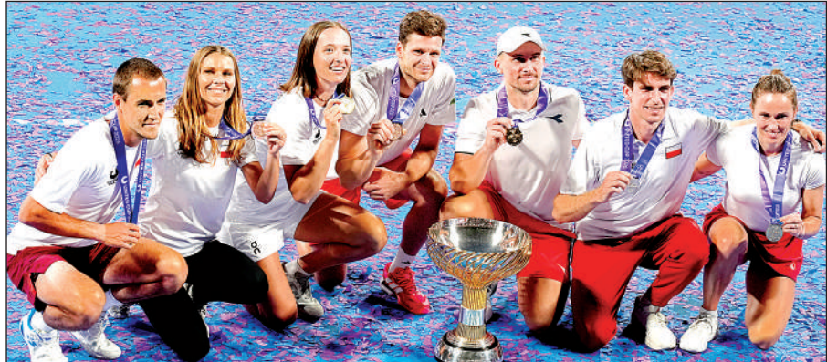
यूनाइटेड कप टूर्नामेंट जीतने के बाद पोलैंड की टीम ट्रॉफी के साथ।

के साथ उनकी क्लीनिक और रेडियोलॉजिकल रिपोर्ट पर विस्तृत चर्चा की। जांच में पंत को साइड स्ट्रेन (ऑब्लिक मसल टियर) पाया गया है, जिसके चलते उन्हें वनडे श्रृंखला से बाहर होना पड़ा है। इसके बाद पुरुष चयन समिति ने ध्रुव जुरेल को पंत के स्थान पर टीम में शामिल किया है और वह टीम से जुड़ चुके हैं। जुरेल इस वनडे टीम में रिजर्व विकेटकीपर-बल्लेबाज की भूमिका निभाएंगे। वह शानदार लय में हैं। उन्होंने उन्होंने पिछली साल पारियों में छह बार 50 से अधिक रन बनाए हैं, जिनमें दो शतक भी शामिल हैं।