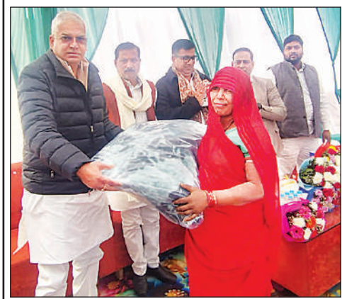
जरूरतमंदों को कंबल देते राज्यमंत्री।