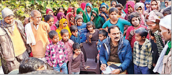
घटना के बारे में ग्रामीणों से पूछताछ करती पुलिस।