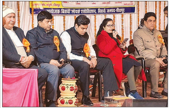
सांस्कृतिक संध्या पर उपस्थित अतिथि।