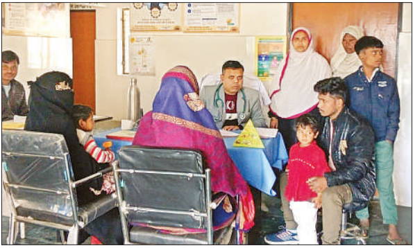
आरोग्य मेले में मरीजों की जांच करते चिकित्सक।