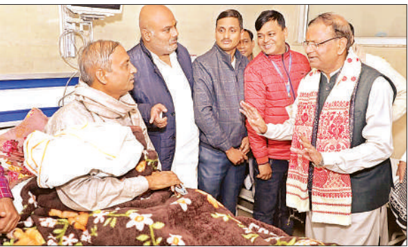
केजीएमयू में भर्ती जिलाध्यक्ष का हाल जानते भाजपा प्रदेश अध्यक्ष।