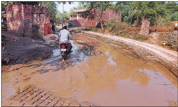
साखिन गांव में भरा गंदा पानी।

मौजदा स्थिति में परिक्रमा मार्ग पर तमाम अव्यस्थाएं हैं। पांचवे पड़ाव के साधु संतों का जल्था अहिरोरी के सारीपुर ब्रम्हनान गांव में प्रवेश करेगा। वहां साक्षी गोपाल मंदिर परिसर में जिला पंचायत निधि से स्थापित पेयजल टंकी खराब पड़ी है। ठीक उसके पहले ग्राम पंचायत निधि के सामुदायिक शौचालय