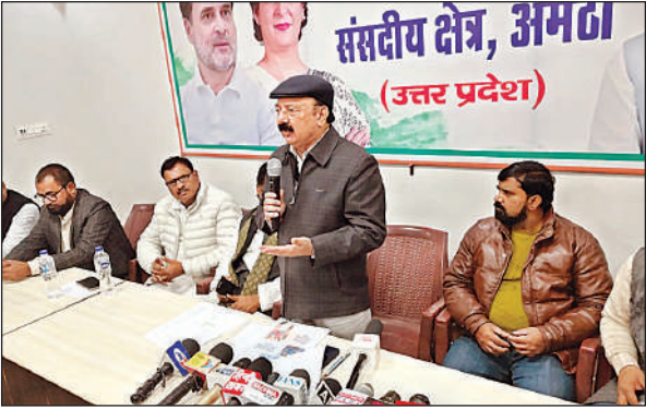
कार्यक्रम को संबोधित करते सांसद किशोरी लाल शर्मा।

सांसद केएल शर्मा ने भावनात्मक लहजे में कहा कि मनरेगा कोई साधारण सरकारी स्कीम नहीं है। यह करोड़ों ग्रामीणों के सम्मान, अधिकार और उनकी जीविका की संवैधानिक गारंटी है। उन्होंने याद दिलाया कि कैसे यूपीए सरकार ने देश के अंतिम व्यक्ति को सशक्त करने के लिए