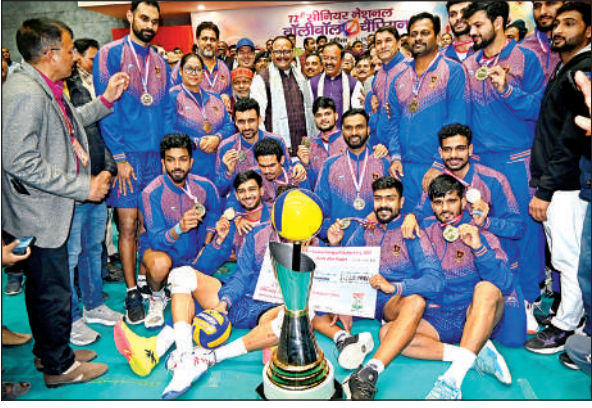
खिताब के साथ रेलवे की टीम।

अमृत विचार। भारतीय रेलवे की टीम ने रविवार को यहां सिगरा स्थित डॉ. संपूर्णानंद स्पोर्ट्स स्टेडियम में संपन्न 72वीं सीनियर नेशनल वॉलीबॉल चैम्पियनशिप का पुरुष वर्ग में सर्वजेता का गौरव अर्जित किया। वहीं महिला वर्ग में गत चैम्पियन केरल ने अपनी अर्सेदिग्ध श्रेष्ठता बरकरार रखी और लगातार छठी बार उपाधि जीत ली। पुरुषों के फाइनल में रेलवे से संघर्ष नहीं कर सका केरल वाराणसी नगर निगम के सहयोग से रोमांच की पराकाष्ठा तक पहुंचे इस आठ दिवसीय आयोजन का सर्वाधिक दिलचस्प पहलू यह था कि दोनों वर्गों के फाइनल में रेलवे व केरल की टीमें आमने सामने थीं। अंतिम दिन पुरुष वर्ग के फाइनल में रेलवे के स्मेशर्स ने केरल की चुनौती को एकतरफा अंदाज में