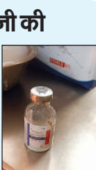
जोन एस 1.5जी की खाली शीशी।