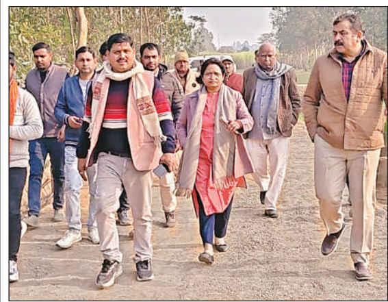
लहरपुर में निर्माण कार्यों का निरीक्षण करते एडीएम और बीडीओ।