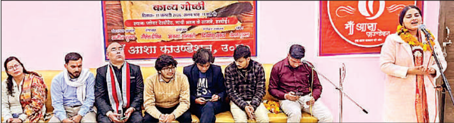
काव्य पाठ करती कवयित्री।