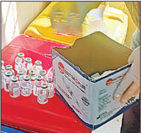
इमरजेंसी के डस्टबिन से निकाली गई इंजेक्शन की खाली शीशियां।