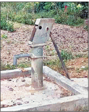
फोटो- शोपीस बना हैंडपंप।

पड़े है। टडियावां ब्लॉक के पांचवे पड़ाव साखिन गांव के रैन बसेरा में झाड़ियां उगी हुई हैं। प्रकाश व्यवस्था और पेयजल नहीं है, शंखेश्वर नाथ मंदिर में सामुदायिक शौचालय बदहाल है। तौकलपुर, अमेठिया