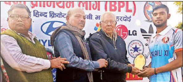
खिलाड़ी को पुरस्कृत करते अतिथि।