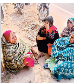
मृतक के गम्गीन परिजन।