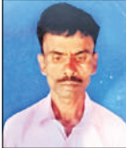
चेतराम फाइल फोटो।

अमृत विचार : रामनगर थाना क्षेत्र के अमराई गांव में जमीनी विवाद में हुई मारपीट में गंभीर रूप से घायल युवक की रविवार को उपचार के