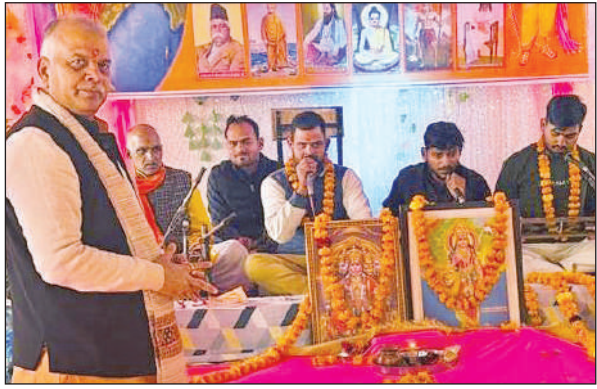
सुंदरकांड पाठ का वाचन करते श्रद्धालु।