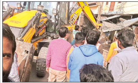
हरगांव में अतिक्रमण दहाता बुलडोजर।