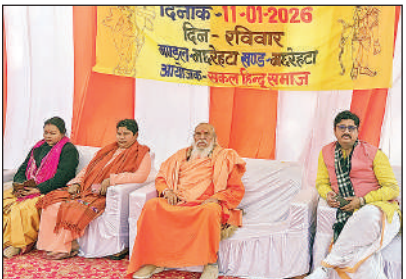
कार्यक्रम में उपस्थित साधु-संत।