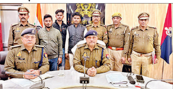
पकड़े गए अपहर्ता, मौजूद पुलिस अधिकारी।