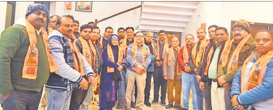
जिलाध्यक्ष के साथ मनोनीत किए गए पदाधिकारी।