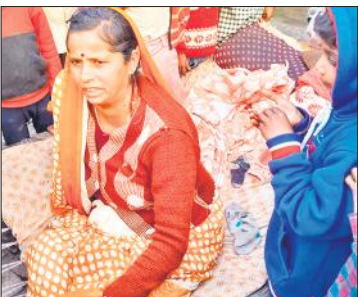
बाघ और तेंदुए का खौफ बना हुआ है। लोग घरों से बाहर निकलने और सड़क पर चलने से भी डर रहे हैं।

गांव हरबक्शाहपुरवा के पास तेंदुआ एक कुत्ते के पिल्ले को उठा ले गया। इन घटनाओं के बाद पूरे इलाके में