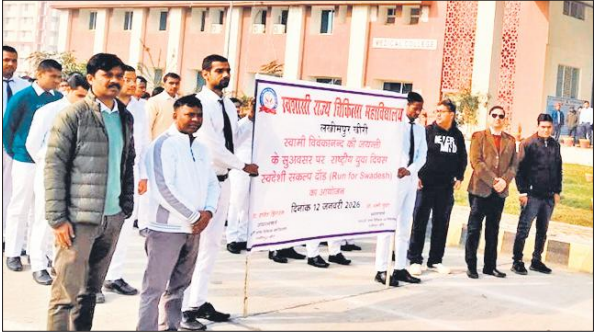
कार्यक्रम में शामिल मेडिकल छात्र और स्टाफ।

कार्यक्रम के दौरान बताया गया कि स्वामी विवेकानंद का दर्शन मेडिकल छात्रों के लिए मानव सेवा, निस्वार्थ कर्म, दृढ़ संकल्प और एकाग्रता को अपनाने की प्रेरणा देता है। उनके प्रसिद्ध संदेश उठो, जागो और लक्ष्य प्राप्ति तक रुको मत को चिकित्सकीय जीवन से जोड़ते हुए समझाया गया कि एक डॉक्टर को