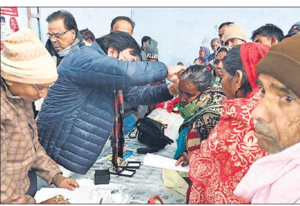
मरीज को कान की मशीन लगाती टीम।

में पौधरोपण भी किया। इससे पूर्व मंडलायुक्त मरौरी ब्लॉक के गांव कंजा हरैया के निर्माणाधीन उच्चोक्त कस्तूरबा गांधी बालिका विद्यालय के अधिशासी अभियंता से निर्माण परियोजना की लागत, क्षेत्रफल एवं निर्माण की अवधि आदि के बारे में जानकारी ली। निर्माण अवधि बीत