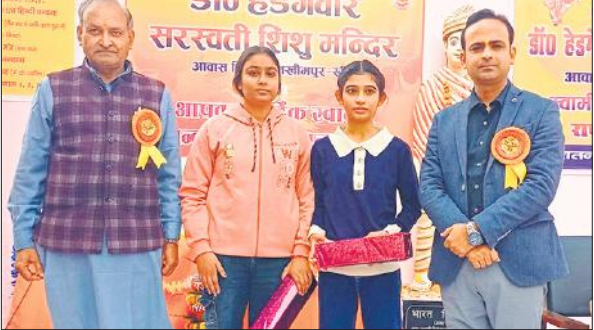
डॉ. हेडगेवार सरस्वती शिशु मंदिर में सम्मानित किए गए बच्चे।