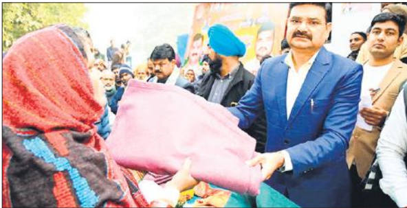
जरूरतमंदों को कंबल बांटते राज्यमंत्री संजय सिंह गंगवार।