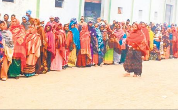
शिविर में पंजीकरण कराने के लिए पहुंचे लोग।