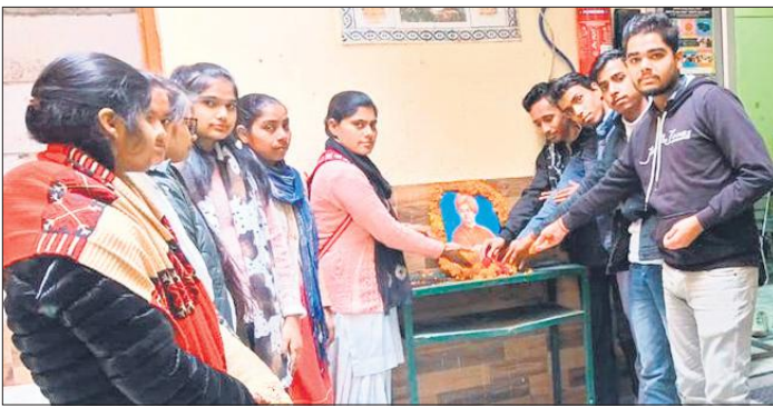
सुमन इंस्टीट्यूट में हुए कार्यक्रम में स्वामी विवेकानंद का नमन करते छात्र।