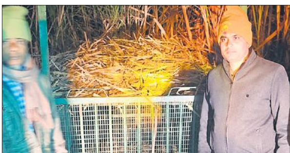
गांव महाराज नगर के पास लगाया गया पिंजड़ा।