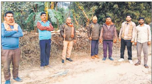
गांव बरामऊ में निगरानी करते वनकर्मों।

अगले दिन सुबह खलिहान में भी तेंदुआ के पैरा के निशान देखे गए थे। वनकर्मियों ने मौके पर पहुंचकर तेंदुआ के पगमाकं ट्रेस करते हुए पुष्टि भी की। तेंदुआ की बढ़ती सक्रियता को देख शासन ने तेंदुआ