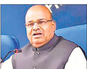
कर्नाटक के राज्यपाल थावरचंद गहलोत।

एक और प्रतिवेदन भी दिया गया है, जिसमें हुबली घटना को रेखांकित किया गया है, जहां पुलिस पर एक महिला भाजपा कार्यकर्ता के कपड़े उतारने का आरोप है। अशोक ने बताया कि हमने राज्यपाल से मुलाकात की और उन्हें बताया कि राज्य में कानून-व्यवस्था की स्थिति बिगड़ गई है और यह गुंडा राज्य बन गया है। कोई सवाल न होने के कारण कर्नाटक जंगल राज बन गया है। हमने राज्यपाल से कर्नाटक को गुंडा राज्य बनने से बचाने का अनुरोध किया है। राज्यपाल से मुलाकात के बाद पत्रकारों से बात करते हुए उन्होंने कहा कि भाजपा ने उन्हें कर्नाटक घृणास्पद भाषण और घृणा अपराध (निवारण) विधेयक