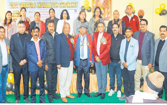
गोला में पदभार ग्रहण करते पदाधिकारी।