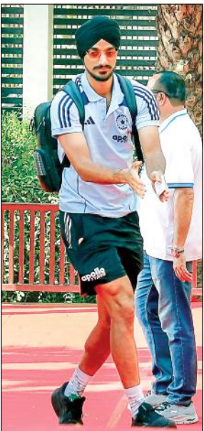
अर्शदीप सिंह राजकोट स्थित होटल में पहुंचकर अचानक गरबा डांस करने लगे।

नई दिल्ली। भारतीय ऑलराउंडर वॉशिंगटन सुंदर पसली में चोट लगने के कारण न्यूजीलैंड के खिलाफ वनडे शृंखला से बाहर हो गए हैं और उनकी जगह आयुष बडोनी को पहली बार सीनियर टीम में शामिल किया गया है। वॉशिंगटन न्यूजीलैंड के खिलाफ पहले वनडे मैच के दौरान चोटिल हो गए थे। इस 26 वर्षीय खिलाड़ी ने पांच ओवर में 27 रन दिए और न्यूजीलैंड की पारी के बीच में ही मैदान से बाहर चले गए। इसके बाद क्षेत्ररक्षण के लिए मैदान पर नहीं उतरे। वह बाद में 8वें नंबर पर बल्लेबाजी करने आए।