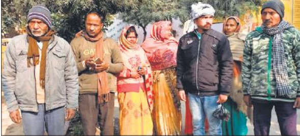
हादसे की सूचना मिलने पर पहुंचे मृतका के परिवार वाले।

पीलीभीत, अमृत विचार : शहर के मोहल्ला आसफजान में बंदरों का आतंक है। लंबे समय से बंदर घरों की छत और गलियों में डेरा जमाए हैं। जिससे राहगीरों का निकलना दूभर है। घर में घुसकर नुकसान पहुंचा रहे हैं। इसके अलावा आवारा कुत्ते भी हमलावर हो रहे हैं। जिसका समाधान कराने की मांग लोगों ने प्रशासन से की है।