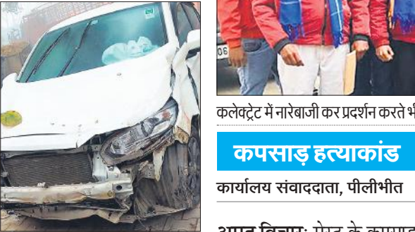
टेंपो से टकराने के बाद क्षतिग्रस्त कार।