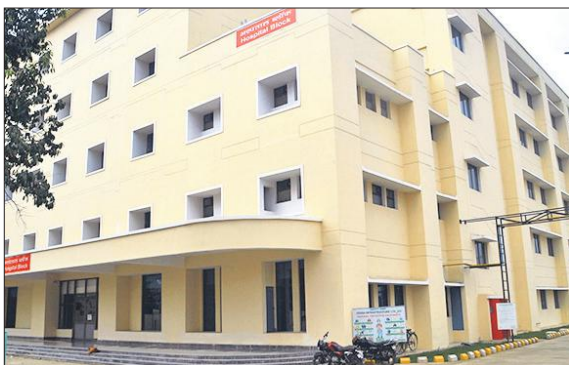
मेडिकल कॉलेज में बना 200 बेड का नवनिर्मित हॉस्पिटल।

संयुक्त जिला चिकित्सालय को वर्ष 2022 में प्रथम एलओपी के तहत मेडिकल कॉलेज के अधीन कर दिया था। एलओपी के बाद मरीजों को एक छत के नीचे समस्त स्वास्थ्य सेवाएं उपलब्ध करने के लिए माइक्रोप्लान तैयार किया गया था। 24 लाख की आबादी वाले जिले में यहाँ डॉक्टरों की बेहद कमी थी। सबसे पहले