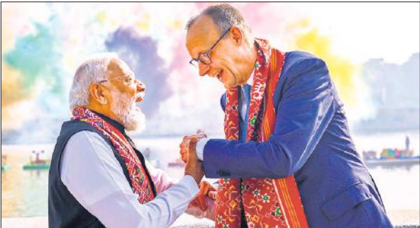
प्रधानमंत्री से मिलते जर्मनी के चांसलर फ्रेडरिक मर्ज़।

मोदी ने सोमवार को यहां दोनों देशों की चुनिंदा कंपनियों के मुख्य कार्यकारियों (सीईओ) की बैठक को संबोधित करते हुए जर्मनी की कंपनियों को विनिर्माण क्षेत्र में भारत के प्रतिभावान मानव संसाधन का पूरा लाभ उठाने का भी आग्रह किया। इस बैठक को भारत की दो दिन की यात्रा पर आये जर्मनी के चांसलर फ्रेडरिक मर्ज़ ने भी संबोधित किया। जर्मनी यूरोपीय संघ का एक प्रमुख सदस्य है और भारत तथा यूरोपीय संघ के बीच मुक्त व्यापार समझौते की बातचीत निर्णायक दौर में पहुंच गयी है। वाणिज्य एवं उद्योग मंत्री मंत्री पीयूष गोयल ने ईयू के