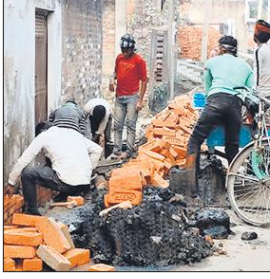
नाली का निर्माण करते मजदूर और मिस्रिनी से लेते हुए पीडब्ल्यूडी अधिकारियों से फोन पर वार्ता कर शीघ्र नाली निर्माण कराने की मांग की थी। उनकी पहल पर अधिकारियों ने नाली निर्माण कार्य शुरू करा दिया। निर्माण कार्य शुरू होते ही लोगों ने राहत की सांस ली।