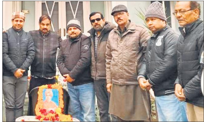
चित्रांश महासभा की ओर से आयोजित कार्यक्रम में मौजूद लोग।