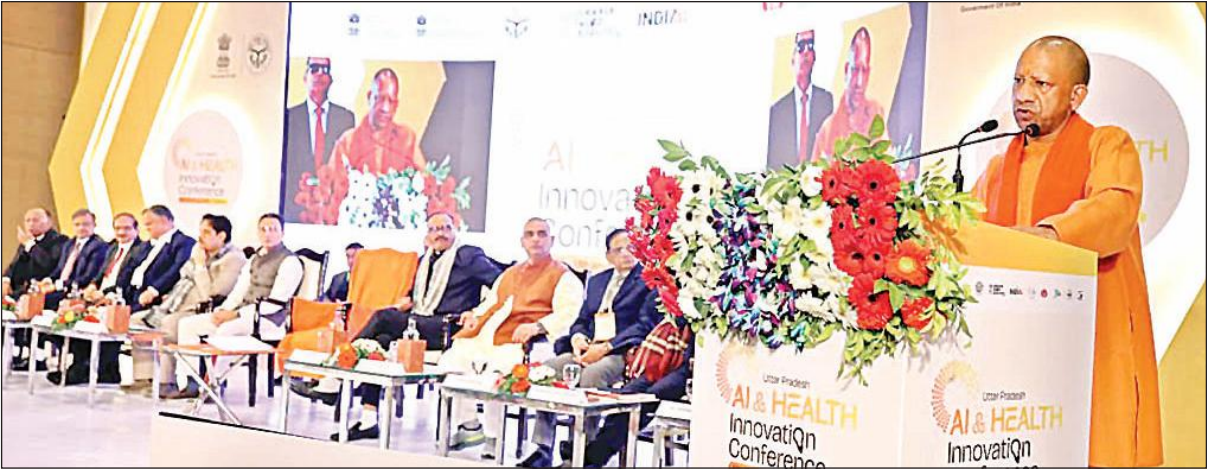
लखनऊ के एक होटल में ‘एआई इन ट्रांसफॉर्मिंग हेल्थकेयर’ विषय पर आयोजित दो दिवसीय कांफ्रेंस का उद्घाटन करने के बाद संबोधित करते मुख्यमंत्री योगी आदित्यनाथ।

वे सोमवार को लखनऊ के एक होटल में ‘एआई इन ट्रांसफॉर्मिंग हेल्थकेयर’ विषय पर आयोजित दो दिवसीय कांफ्रेंस का उद्घाटन करने के बाद बोल रहे थे। उन्होंने बताया कि यूपी एआई मिशन के तहत प्रदेश को स्वास्थ्य सेवाओं में एआई के प्रयोग से देश में अग्रणी राज्य के रूप में स्थापित किया जाएगा। मुख्यमंत्री ने कहा कि बीते 11 वर्षों में प्रधानमंत्री के नेतृत्व में देश ने तकनीक को जमीन पर उतरते देखा है। प्रदेश में पिछले आठ वर्षों से डबल इंजन सरकार ने ई-गवर्नैंस, डीबीटी और डिजिटल ट्रांजेक्शन