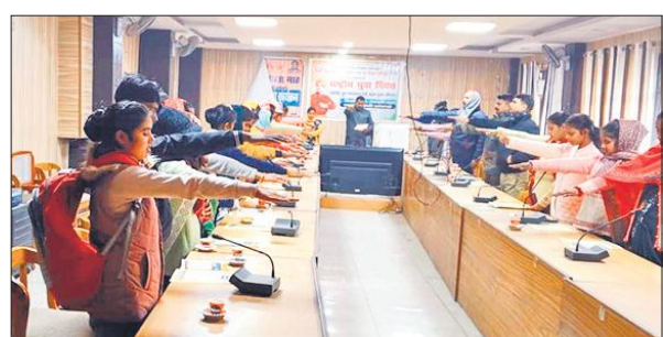
राष्ट्रीय युवा दिवस पर शपथ लेते मंगल दलों के सदस्य व स्वयंसेवक।

विकास भवन स्थित गोमती सभागार में सोमवार को स्वामी विवेकानंद की एक साधक से विश्व पथप्रदर्शक की यात्रा की गाथा कार्यक्रम का आयोजित किया गया। मुख्यमंत्री योगी आदित्यनाथ द्वारा विवेकानंद यूथ अवॉर्ड व्यक्तिगत एवं संस्थागत वितरण कार्यक्रम का सजीव प्रसारण दिखाया गया। कार्यक्रम में मंगल दलों के