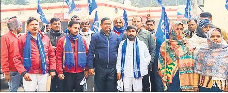
कलेक्ट्रेट में नारेबाजी कर प्रदर्शन करते भीम आर्मी कार्यकर्ता।

में पौधरोपण भी किया। इससे पूर्व मंडलायुक्त मरौरी ब्लॉक के गांव कंजा हरैया के निर्माणाधीन उच्चोक्त कस्तूरबा गांधी बालिका विद्यालय के अधिशासी अभियंता से निर्माण परियोजना की लागत, क्षेत्रफल एवं निर्माण की अवधि आदि के बारे में जानकारी ली। निर्माण अवधि बीत