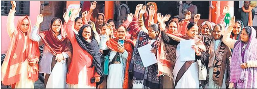
सीएचसी पर प्रदर्शन करती आशा व संगिनियां।

जापन में वर्ष 2025 के कई माह का आधार भुगतान, राज्य प्रदत्त अनुतोष राशि, प्रोत्साहन राशियां तथा विभिन्न राष्ट्रीय स्वास्थ्य अभियानों का प्रतिफल लंबे समय से बकाया होने का मुद्दा प्रमुखता से उठाया गया। इसके साथ ही आशा बहुओं और संगिनियों ने आरोप लगाया कि वे