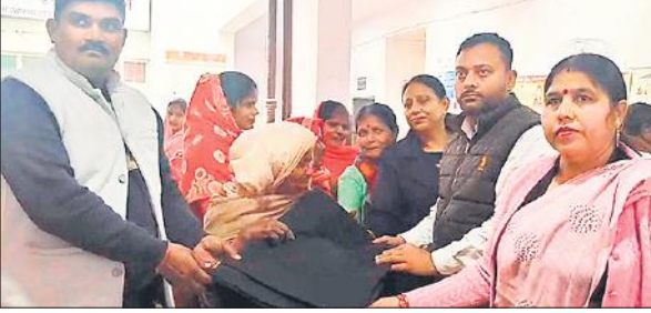
कंबल देते भाजपा पदाधिकारी व नगर अध्यक्ष भाजपा।