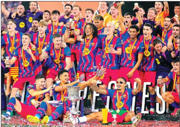
बार्सिलोना के खिलाड़ी स्पेनिश सुपर कप के साथ।

फाइनल के पहले हाफ का अंत बेहद रोमांचक रहा, जब ब्रेक से पहले स्टॉपेज टाइम में तीन गोल हुए, जिनमें से दो रियल मैड्रिड ने और एक बार्सिलोना ने किया। पिछले साल के फाइनल में भी बार्सिलोना ने रियल मैड्रिड को 5-2 से हराया था, जिसमें राफिन्हा ने दो गोल किए थे। बार्सिलोना ने 16वां