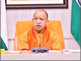
समीक्षा बैठक करते मुख्यमंत्री योगी।

से जिलावार समीक्षा कर रहे थे। उन्होंने एनएचएआई के स्थानीय अधिकारियों और जिला प्रशासन के बीच बेहतर, सतत और प्रभावी समन्वय के निर्देश दिए। योगी ने कहा कि प्रत्येक जनपद के जिलाधिकारी एनएचएआई परियोजनाओं की साप्ताहिक समीक्षा सुनिश्चित करें। जहां किसी स्तर पर प्रकरण लंबित हो, उसे मुख्य सचिव की सोमवारीय समीक्षा में अनिवार्य रूप से प्रस्तुत कर समयबद्ध निस्तारण कराया जाए। साथ ही, मुख्य सचिव द्वारा