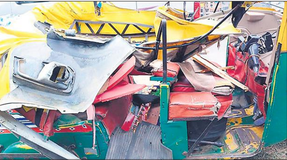
जहानाबाद क्षेत्र में हुए हादसे में क्षतिग्रस्त टेंपो।