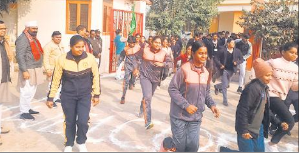
पं. दीनदयाल उपाध्याय सरस्वती विद्या मंदिर इंटर कॉलेज, सीबीएसई में रन फॉर स्वदेशी में प्रतिभाग करते विद्यार्थी।