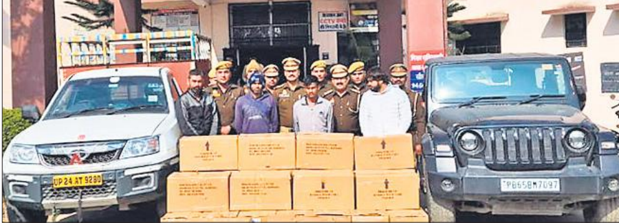
पुलिस की गिरफ्त में शराब के साथ पकड़े गए आरोपी और बरामद हुए वाहन।