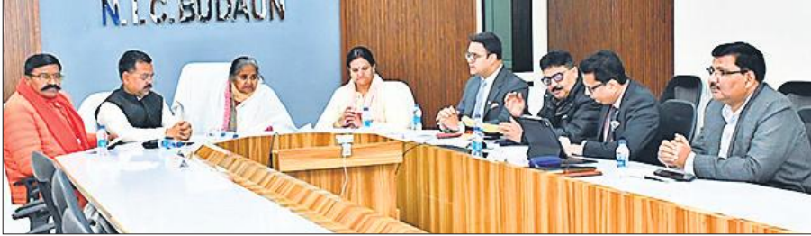
सीएम डैशबोर्ड की समीक्षा करती प्रभारी मंत्री गुलाब देवी।

समीक्षा के दौरान प्रभारी मंत्री ने अधिकारियों को परस्पर समन्वय से कार्यों को पूरा करने के निर्देश दिये, ताकि रैंकिंग में सुधार हो सके। उन्होंने कहा कि दिसंबर माह में सीएम डैशबोर्ड की रैंकिंग में चार अंकों की बढ़ोत्तरी हुई है। जिले को प्रदेश स्तर पर 36 वां स्थान मिला, जबकि नवंबर माह के दौरान 43वाँ रैंक रही। इस बार नौ कार्यों में स्थिति अच्छी न रहने पर उनके विभागों के