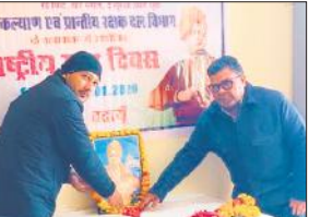
विवेकानंद को गुष्प अर्पित करते लोग

रेलवे स्टेशन पर यात्रियों ने बताया कि देर शाम को कासगंज की ओर जाने वाली अभी तक कोई ट्रेन नहीं थी जिससे लोगों को रोडवेज बस का सहारा लेना पड़ता था। बस से अधिक समय और अधिक किराया खर्च करना पड़ता था। अब ट्रेन शुरू हो चुकी है जिससे पैसा और समय दोनों की बचत होगी। रेलवे प्रशासन ने इस ट्रेन के संचालन की समय सारिणी जारी कर दी है। जारी समय सारिणी के अनुसार ही ट्रेन चलेगी।