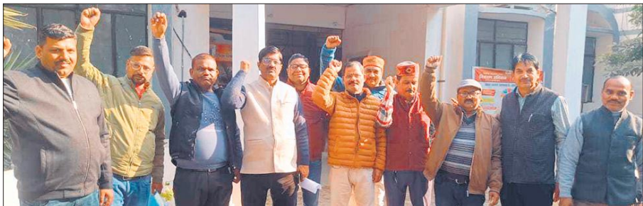
विकास भवन के बाहर प्रदर्शन करते शिक्षक संघ के पदाधिकारी।

प्राथमिक शिक्षक संघ ने पुनः प्रक्रिया की मांग उठाई, विकास भवन के बाहर नारेबाजी कर किया प्रदर्शन, जताया रोष