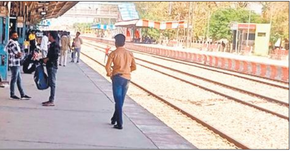
रेलवे स्टेशन पर बैठे यात्री

लालकुआं-बेंगलुरु साप्ताहिक ट्रेन पिछले साल से बंद है। करीब छह महीने तक ट्रेन बंद रही जिससे मथुरा जाने वाले यात्रियों को भारी दिक्कत हुई। मथुरा को इस समय कोई भी सीधी ट्रेन नहीं है इसलिए यात्रियों को रोडवेज बस का सहारा लेना पड़ता है। इसी तरह आगरा जाने वालों को भी इस ट्रेन से कुछ राहत मिलेगी। साप्ताहिक ट्रेन ने गत शनिवार को पहला फेरा मारा। शनिवार को ही ट्रेन लालकुआं से