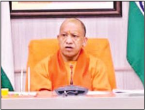
समीक्षा बैठक करते मुख्यमंत्री योगी।

से जिलावार समीक्षा कर रहे थे। उन्होंने एनएचएआई के स्थानीय अधिकारियों और जिला प्रशासन के बीच बेहतर, सतत और प्रभावी समन्वय के निर्देश दिए। योगी ने कहा कि प्रत्येक जनपद के जिलाधिकारी एनएचएआई परियोजनाओं की साप्ताहिक समीक्षा सुनिश्चित करें। जहां किसी स्तर पर प्रकरण लंबित हो, उसे मुख्य सचिव की सोमवारीय समीक्षा में अनिवार्य रूप से प्रस्तुत कर समयबद्ध निस्तारण कराया जाए। साथ ही, मुख्य सचिव द्वारा