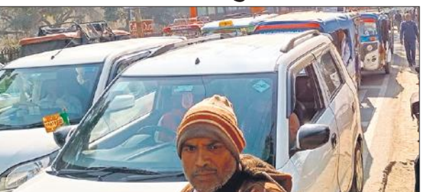
सोमवार को शहर में जाम की समस्या से जूझते रहे लोग।

मौसम साफ होते ही शहर में भीड़ देखने को मिल रही है। बाजारों में अचानक भीड़ बढ़ने लगी है। सड़कों पर वाहनों का रेला देखने को मिल रहा है। वाहनों का रेला ट्रैफिक पुलिस को चुनौती बन जाता है। आज पूर्वान्ह 11 बजे से दो बजे तक कई जगहों पर जाम लगा रहा। वन विभाग कार्यालय रोड पर सैकड़ों वाहन जाम में फंस गए। वन विभाग से लेकर पुलिस लाइन चौराहे तक जाम लगा रहा जिससे ट्रैफिक पुलिस के हाथ पैर फूल गए। कारों, बसों व अन्य वाहन जहां के तहां खड़े रहे।