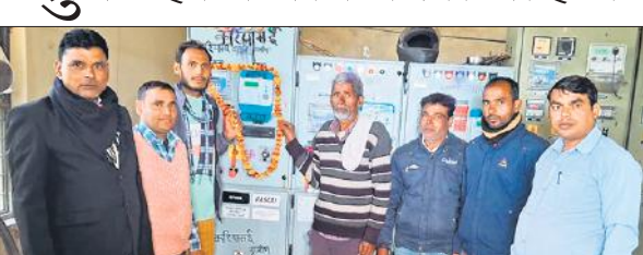
नई मशीन पर फूल माला चढ़ाते कर्मचारी