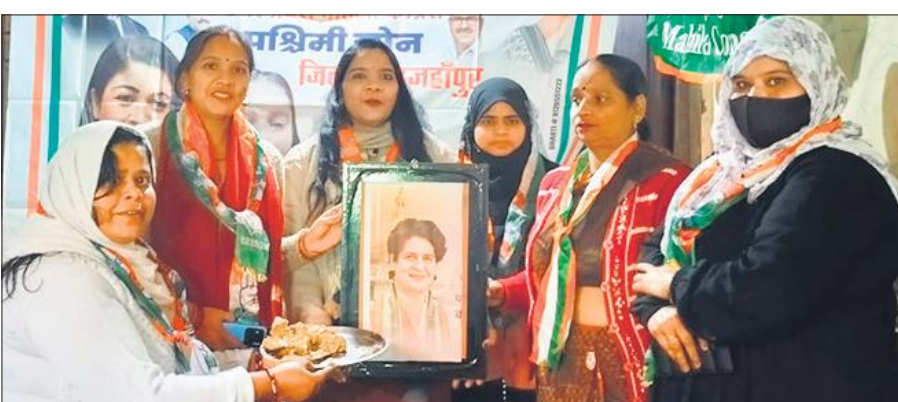
कांग्रेस की राष्ट्रीय महासचिव प्रियंका गांधी का जन्मदिन मनाती महिला कार्यकर्ता।