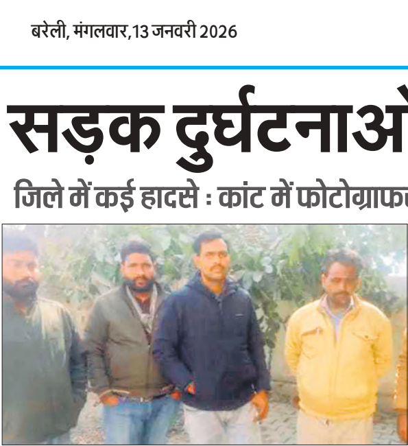
मृतक के परिजन पोस्टमार्टम हाउस पर।

सदर बाजार थाना क्षेत्र के मोहल्ला जलालनगर में यादव वाली गली में धार्मिक स्थल के पास