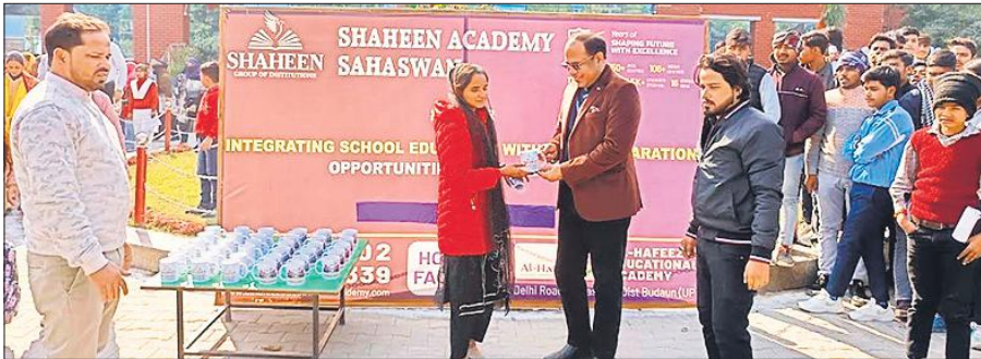
छात्रा को प्रमाण पत्र देते आयोजक।

पुलिस ने जांच की तो अवैध शराब तस्करी का मामला सामने आया। गिरफ्तार किए गए चार आरोपियों के पास से 100 पेटी