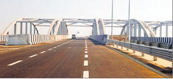
एक्सप्रेस वे पर डौडता वाहन।

अमृत विचार: मेरठ से प्रयागराज तक बने गंगा एक्सप्रेस वे पर सोमवार को रन ट्रायल होना था, लेकिन कार्यदायी संस्थाओं के उल्थाधिकारियों न पहुंचने और तकनीकी कारणों की वजह से रन ट्रायल टाल दिया गया। अब रन ट्रायल मकर संक्रांति 15 जनवरी के बाद होगा। इसकी तारीख पूर्व से घोषित होगी। ट्रायल के दौरान 120 किलोमीटर की स्पीड से वाहन दौड़ाए जाएंगे। इसके सफल रहने पर जनवरी माह के अंत तक इस आम जनता के खोल दिया जाएगा।