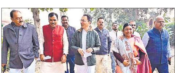
आवास से निकलते केंद्रीय राज्य मंत्री जितिन प्रसाद।