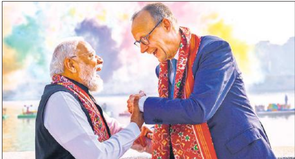
प्रधानमंत्री से मिलते जर्मनी के चांसलर फ्रेडरिक मर्ज़।

मोदी ने सोमवार को यहां दोनों देशों की चुनिंदा कंपनियों के मुख्य कार्यकारियों (सीईओ) की बैठक को संबोधित करते हुए जर्मनी की कंपनियों को विनिर्माण क्षेत्र में भारत के प्रतिभावान मानव संसाधन का पूरा लाभ उठाने का भी आग्रह किया। इस बैठक को भारत की दो दिन की यात्रा पर आये जर्मनी के चांसलर फ्रेडरिक मर्ज़ ने भी संबोधित किया। जर्मनी यूरोपीय संघ का एक प्रमुख सदस्य है और भारत तथा यूरोपीय संघ के बीच मुक्त व्यापार समझौते की बातचीत निर्णायक दौर में पहुंच गयी है। वाणिज्य एवं उद्योग मंत्री मंत्री पीयूष गोयल ने ईयू के