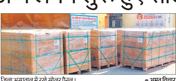
जिला अस्पताल में रखे सोलर पैनल।

अमृत विचार : जिला अस्पताल प्रशासन ने अब सभी वार्डों पर अलग अलग सोलर पैनल लगाने का निर्णय लिया है। इसके लिए करीब 12 सोलर पैनल मंगा लिए गए हैं जो सोमवार से लगने शुरू हो गए हैं। शुरू में मात्र एक सोलर पैनल लगाया गया था जिससे सभी वार्डों को बिजली नहीं मिल पा रही थी। लेकिन अब हर वार्ड को उसी का पैनल रोशन करेगा। जिला अस्पताल में बिजली संकट को लेकर हर समय दिक्कत रहती है जिससे अस्पताल के काम काज समय से नहीं हो पाते हैं। बिजली गुल होते ही पैथोलॉजी लैब बंद हो जाती है, जबकि लैब में सबसे अधिक भीड़ रहती है। दिन में बिजली गुल होने से वार्ड में भी