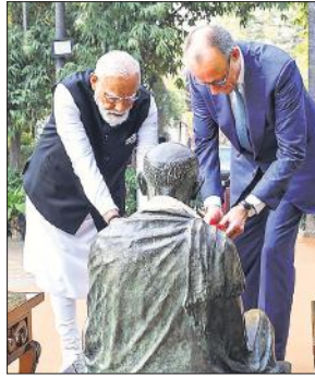
● प्रधानमंत्री मोदी और जर्मन चांसलर ने महात्मा गांधी को श्रद्धांजलि अर्पित की

वाहिकाएं सिकुड़ जाती हैं और लोग पानी भी कम पीने लगते हैं, जिससे रक्त प्रवाह पर नकारात्मक प्रभाव पड़ता है और रक्तचाप बढ़ जाता है। साथ ही, इस दौरान नमकीन और प्रसंस्कृत खाद्य पदार्थों का सेवन भी बढ़ जाता है। इन सभी कारणों से