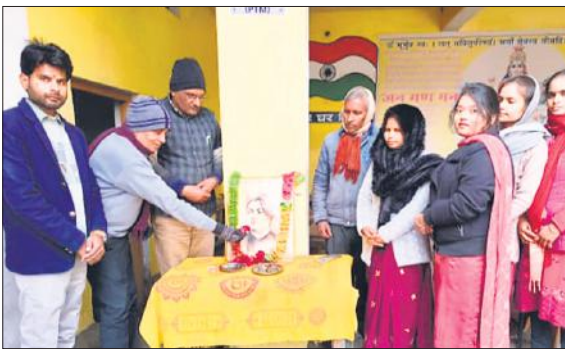
शेरगढ़ के युवा मंडल विद्यालय में स्वामी विवेकानंद के चित्र पर माल्यार्पण करते शिक्षक।

सोमवार को जगह-जगह कार्यक्रमों का आयोजन किया गया। कस्बे के युवा मंडल विद्यालय में स्वामी विवेकानंद की जयंती राष्ट्रीय युवा दिवस