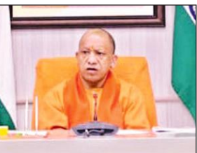
समीक्षा बैठक करते मुख्यमंत्री योगी।

से जिलावार समीक्षा कर रहे थे। उन्होंने एनएचएआई के स्थानीय अधिकारियों और जिला प्रशासन के बीच बेहतर, सतत और प्रभावी समन्वय के निर्देश दिए। योगी ने कहा कि प्रत्येक जनपद के जिलाधिकारी एनएचएआई परियोजनाओं की साप्ताहिक समीक्षा सुनिश्चित करें। जहां किसी स्तर पर प्रकरण लंबित हो, उसे मुख्य सचिव की सोमवारीय समीक्षा में अतिवाची रूप से प्रस्तुत कर समयबद्ध निस्तारण कराया जाए। साथ ही, मुख्य सचिव द्वारा