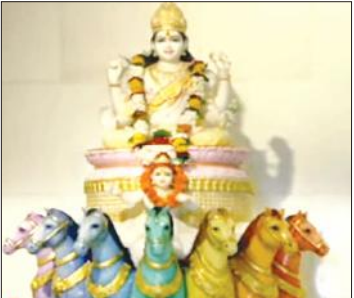
परकोटे के मंदिर में विराजमान भगवान सूर्य।

ज्योतिष शास्त्र में 12 राशियां व 12 घर का मूल सिद्धांत है। सूर्य एक महीना हर राशि में बिताते हैं। अर्थात 30 दिन में सूर्य दूसरी राशि में प्रवेश करते हैं। इसका मतलब जब सूर्य देव