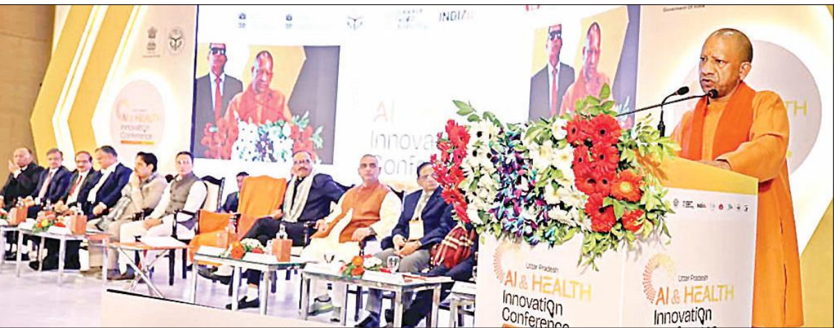
लखनऊ के एक होटल में ‘एआई इन ट्रांसफॉर्मिंग हेल्थकेयर’ विषय पर आयोजित दो दिवसीय कांफ्रेंस का उद्घाटन करने के बाद संबोधित करते मुख्यमंत्री योगी आदित्यनाथ।

वे सोमवार को लखनऊ के एक होटल में ‘एआई इन ट्रांसफॉर्मिंग हेल्थकेयर’ विषय पर आयोजित दो दिवसीय कॉन्फ्रेंस का उद्घाटन करने के बाद बोल रहे थे। उन्होंने बताया कि यूपी एआई मिशन के तहत प्रदेश को स्वास्थ्य सेवाओं में एआई के प्रयोग से देश में अग्रणी राज्य के रूप में स्थापित किया जाएगा। मुख्यमंत्री ने कहा कि बीते 11 वर्षों में प्रधानमंत्री के नेतृत्व में देश ने तकनीक को जमीन पर उतरते देखा है। प्रदेश में पिछले आठ वर्षों से डबल इंजन सरकार ने ई-गवर्नेंस, डीबीटी और डिजिटल ट्रांजेक्शन