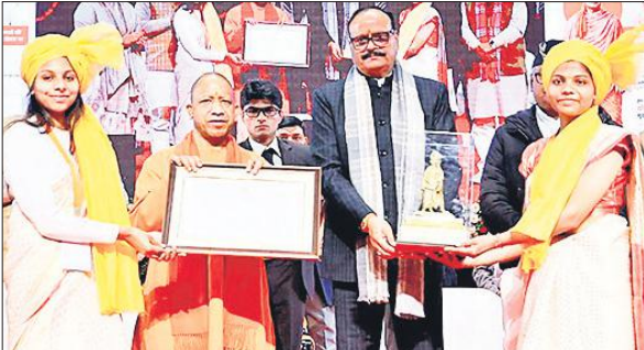
कार्यक्रम में युवती को पुरस्कृत करते सीएम योगी, साथ में उप मुख्यमंत्री ब्रजेश पाठक।

राज्य ब्यूरो, लखनऊ अमृत विचार : मुख्यमंत्री योगी आदित्यनाथ ने राष्ट्रीय युवा दिवस के अवसर पर विपक्ष पर तीखा प्रहार करते हुए कहा कि अब ‘महाभारत के रिश्ते’ दिखाकर अवैध वसूली करने वालों के लिए कोई जगह नहीं है। यदि कोई व्यक्ति सिफारिश, दबाव या रिश्तों की दुहाई देकर वसूली के लिए निकलेगा, तो उसे सीधे जेल भेजा जाएगा। मुख्यमंत्री ने युवाओं से नरो से दूर रहने, अनुशासन, ईमानदारी और आत्मविश्वास के साथ आगे बढ़ने का आह्वान किया। योगी ने यह सख्त संदेश सोमवार को लखनऊ स्थित इंदिरा गांधी प्रतिष्ठान में राष्ट्रीय युवा दिवस के अवसर पर आयोजित कार्यक्रम में दिया। उन्होंने कहा कि प्रदेश में कानून का राज स्थापित किया गया है। अब न पैसे का लेन-देन चलेगा और न ही रसुख या रिश्तों के नाम पर किसी को डराने-धमकाने की छूट दी जाएगी। सरकार की प्राथमिकता ईमानदार नागरिकों, युवाओं और उद्यमियों को सुरक्षित वातावरण देना है, ताकि वे बिना भय के अपने कार्य और नवाचार को आगे बढ़ा सकें। मुख्यमंत्री ने कहा कि सरकार ने मिशन रोजगार के तहत लाखों युवाओं को सरकारी नौकरी प्रदान की है और स्वरोजगार को बढ़ावा देने के लिए भी व्यापक योजनाएं लागू की गई हैं। अब प्रदेश में मेहनत, प्रतिभा और योग्यता के आधार पर आगे बढ़ने का समय है। ब्रजेश पाठक बोले- जेंटलमैन बनाता है चरित्र : उप मुख्यमंत्री ब्रजेश पाठक ने कहा कि भारत ऐसा देश है जहां टेलर नहीं,