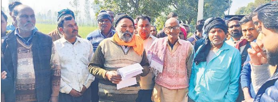
गुरसौली गांव में एसडीएम के आदेश पर अभिलेखों के आधार पर भूमि की पैमाइश के दौरान मौजूद ग्रामीण।