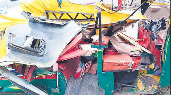
जहानाबाद क्षेत्र में हुए हादसे में क्षतिग्रस्त टेंपो।