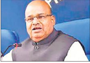
● विधेयक को दमनकारी, अभिव्यक्ति की स्वतंत्रता पर हमला बताया