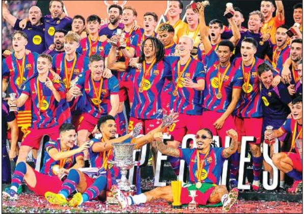
बार्सिलोना के खिलाड़ी स्पेनिश सुपर कप के साथ।

फाइनल के पहले हाफ का अंत बेहद रोमांचक रहा, जब ब्रेक से पहले स्टैंपेज टाइम में तीन गोल हुए, जिनमें से दो रियाल मैड्रिड ने और एक बार्सिलोना ने किया। पिछले साल के फाइनल में भी बार्सिलोना ने रियल मैड्रिड को 5-2 से हराया था, जिसमें राफिन्हा ने दो गोल किए थे। बार्सिलोना ने 16वां