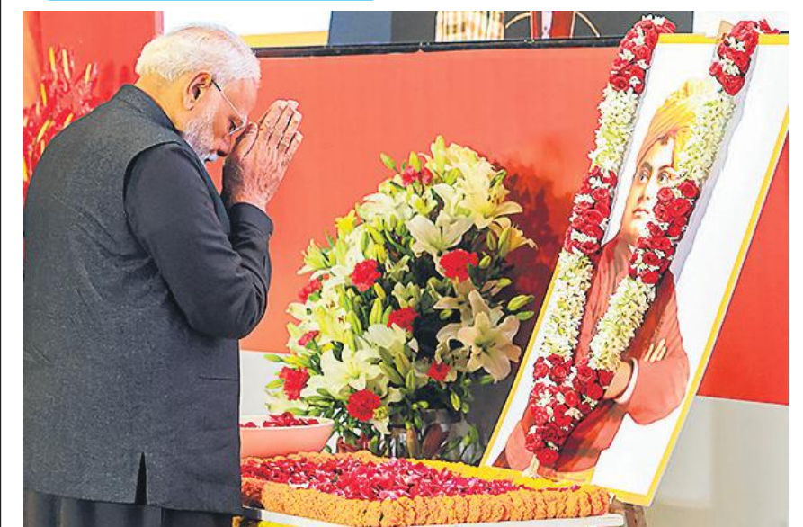
प्रधानमंत्री नरेंद्र मोदी नई दिल्ली में आयोजित विकसित भारत युवा नेता संवाद 2026 के समापन सत्र के दौरान स्वामी विवेकानंद को श्रद्धांजलि अर्पित करते हुए।