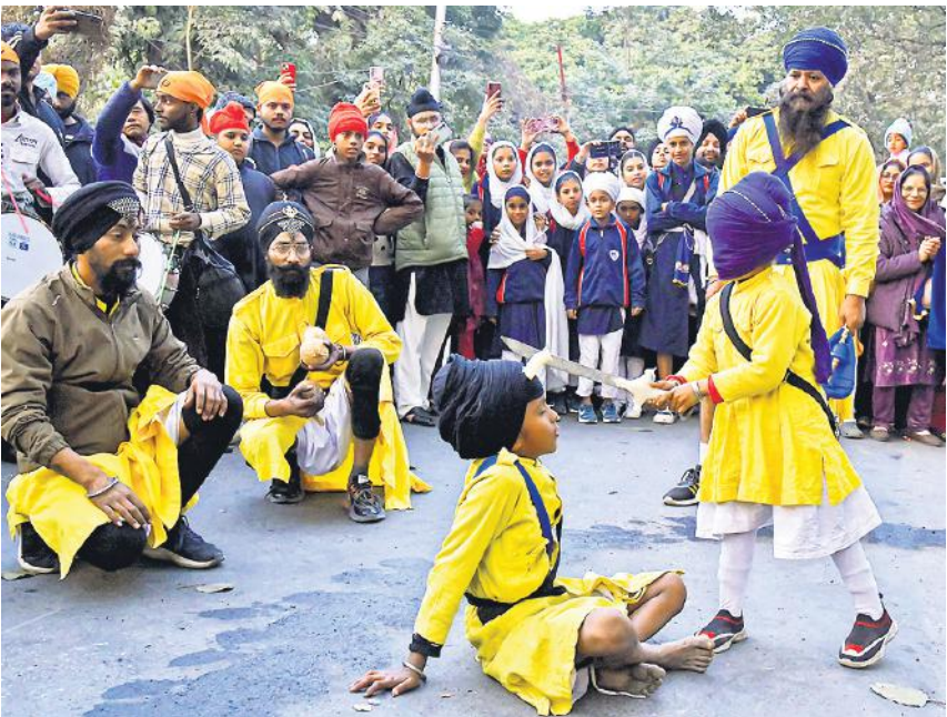
लोहड़ी पर्व की पूर्व संंध्या पर देहरादून में नगर कीर्तन जुलूस के दौरान सिख समुदाय के लोग गतका नृत्य करते हुए।

हल्द्वानी, अमृत विचार: उत्तराखंड मुक्त विश्वविद्यालय (यूओयू) के दसवें दीक्षांत समारोह को सोमवार को वि्वि के कुलाधिपति एवं राज्यपाल गुरमीत सिंह ने संबोधित किया। उन्होंने शिक्षार्थियों को प्रत्येक क्षेत्र में उत्कृष्टता हासिल करने और रोजगार देने वाला बनने के लिए प्रेरित करने के साथ ही आह्वान किया कि वे रिसर्च को अपनी संस्कृति बनाएं। वि्वि सभागार में आयोजित दीक्षांत समारोह में 18,129 विद्यार्थियों को स्नातक एवं स्नातकोत्तर की उपाधियां प्रदान की गईं, शैक्षणिक उत्कृष्टता के लिए 34 मेधावी छात्र-छात्राओं को स्वर्ण पदक देकर सम्मानित किया गया। इस अवसर पर वि्वि की त्रैमासिक पत्रिका उड़ान के विमोचन के साथ वि्वि की हिंदी वेबसाइट का भी औपचारिक लोकार्पण किया गया।