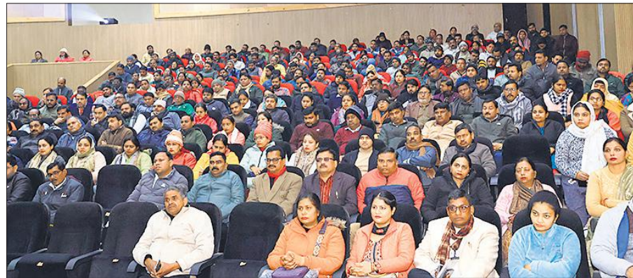
ऑडिटोरियम में मौजूद बीएलओ।

दर्ज होने पर मतदाता ई-इपिक घर बैठे ही डाउनलोड कर सकते हैं। विशेष प्रगाढ़ पुनरीक्षण में नो मैपिंग वाले मतदाताओं को नोटिस जारी करने एवं उसके तामिला एवं प्राप्ति के संबंध में सभी को प्रशिक्षित किया। एसआईआर के नोटिस सुनवाई ऑफ इलेक्टर फोटो के ऑप्शन में सभी बीएलओ प्रदान की गयी।