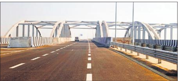
एक्सप्रेस-वे पर दौड़ता वाहन।