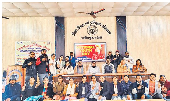
फरीदपुर डायट में प्रतियोगिताओं के प्रतिभागियों के साथ मुख्य अतिथि।