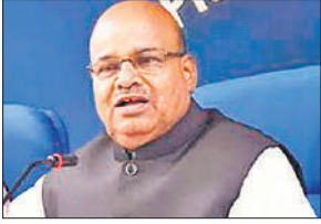
● विधेयक को दमनकारी, अभिव्यक्ति की स्वतंत्रता पर हमला बताया

विधानमंडल के दोनों सदनों में विपक्ष के नेताओं आर. अशोक और चालवाडी नारायणस्वामी के नेतृत्व में प्रतिनिधिमंडल ने राज्यपाल को एक ज्ञापन भी सौंपा,