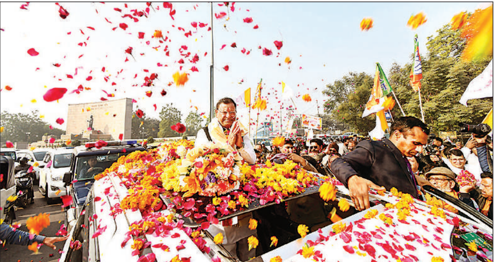
पॉलिटेक्निक चौराहे के पास वेव मॉल के सामने भाजपा प्रदेश अध्यक्ष पंकज चौधरी का फूलों से स्वागत करते पार्टी नेता व कार्यकर्ता। अमृत विचार

स्वागत किया गया। उत्तर विधानसभा से विधायक डॉ. नीरज बोरा और पूर्व विधानसभा का प्रतिनिधित्व विधायक ओपी श्रीवास्तव ने किया। डॉ. बोरा ने वेव मॉल के सामने पंकज चौधरी को भारी भ्रुकम माला पहनाकर उनका अभिनंदन किया। भव्य स्वागत के बाद