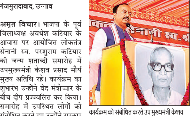
कार्यक्रम को संबोधित करते उप मुख्यमंत्री केशव प्रसाद मौर्य।