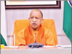
समीक्षा बैठक करते मुख्यमंत्री योगी।

से जिलावार समीक्षा कर रहे थे। उन्होंने एनएचएआई के स्थानीय अधिकारियों और जिला प्रशासन के बीच बेहतर, सतत और प्रभावी समन्वय के निर्देश दिए। योगी ने कहा कि प्रत्येक जनपद के जिलाधिकारी एनएचएआई परियोजनाओं की साप्ताहिक समीक्षा सुनिश्चित करें। जहां किसी स्तर पर प्रकरण लंबित हो, उसे मुख्य सचिव की सोमवारीय समीक्षा में अनिवार्य रूप से प्रस्तुत कर समयबद्ध निस्तारण कराया जाए। साथ ही, मुख्य सचिव द्वारा