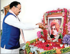
स्वामी विवेकानंद के चित्र पर पुष्पांजलि देते उप मुख्यमंत्री केशव प्रसाद मोर्य।

अमृत विचार, लखनऊ: राष्ट्रीय युवा दिवस पर उपमुख्यमंत्री केशव प्रसाद मोर्य ने स्वामी विवेकानंद के चित्र पर माल्यार्पण कर श्रद्धांजलि अर्पित की। कालीदास मार्ग स्थित कैप कार्यालय में सोमवार को उपमुख्यमंत्री ने कहा कि स्वामी विवेकानंद के विचार आज भी युवाओं को आत्बल, अनुशासन और राष्ट्रनिर्माण की प्रेरणा देते हैं। “स्वामी विवेकानंद युवा सशक्तिकरण योजना के तहत लाखों युवाओं को टैबलेट व स्मार्टफोन देकर डिजिटल सशक्तिकरण किया जा रहा है।