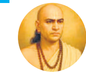
ऐसी जगह से तुरंत दूरी बना लें, जहां पर आपका कोई सम्मान न हो और जहां आप कोई ज्ञान अर्जित न कर सकें। –आचार्य चाणक्य