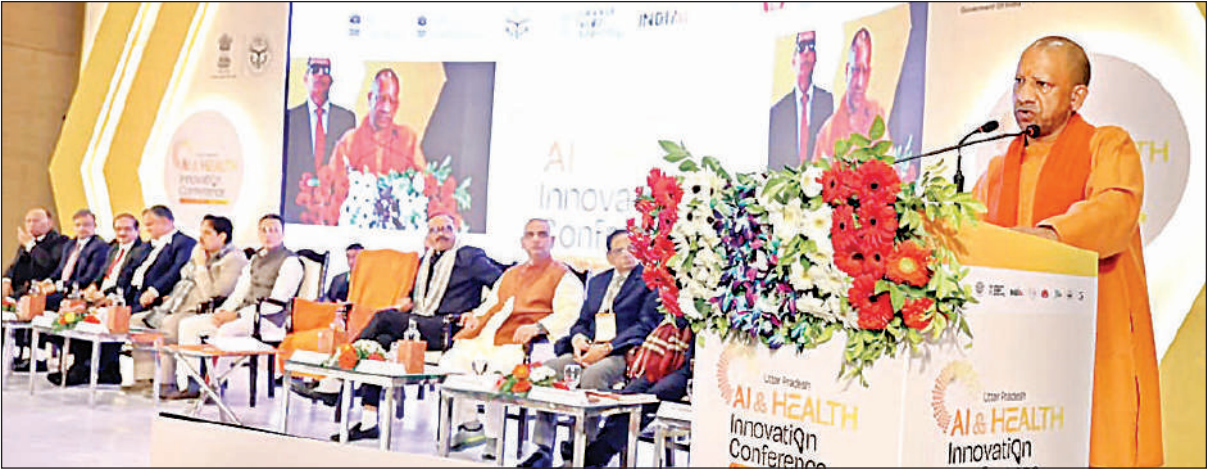
लखनऊ के एक होटल में ‘एआई इन ट्रांसफॉर्मिंग हेल्थकेयर’ विषय पर आयोजित दो दिवसीय कांफ्रेंस का उद्घाटन करने के बाद संबोधित करते मुख्यमंत्री योगी आदित्यनाथ।

वे सोमवार को लखनऊ के एक होटल में ‘एआई इन ट्रांसफॉर्मिंग हेल्थकेयर’ विषय पर आयोजित दो दिवसीय कॉन्फ्रेंस का उद्घाटन करने के बाद बोल रहे थे। उन्होंने बताया कि यूपी एआई मिशन के तहत प्रदेश को स्वास्थ्य सेवाओं में एआई के प्रयोग से देश में अग्रणी राज्य के रूप में स्थापित किया जाएगा। मुख्यमंत्री ने कहा कि बीते 11 वर्षों में प्रधानमंत्री के नेतृत्व में देश ने तकनीक को जमीन पर उतरते देखा है। प्रदेश में पिछले आठ वर्षों से डबल इंजन सरकार ने ई-गवर्नंस, डीबीटी और डिजिटल ट्रांजेक्शन