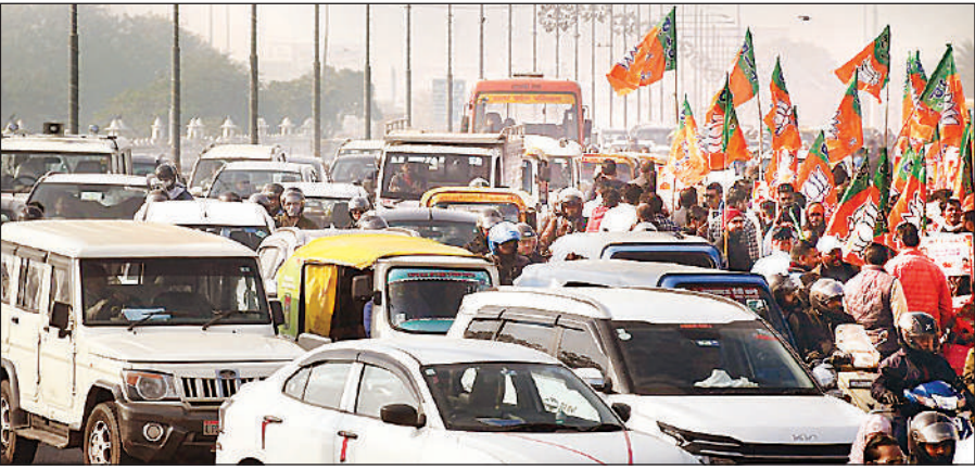
गोमती नगर के समता मूलक चौराहे पर लगे जाम में फंसे वाहन ।

लखनऊ में समता मूलक चौक, पॉलिटेक्निक चौराहा, किसान पथ समेत कई इलाकों में वाहनों की लंबी कतारें दिखाई दीं। बस स्टेशन के आसपास भी जाम की स्थिति बनी रही। बाराबंकी और