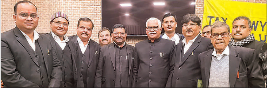
टैक्स लॉयर्स एसोसिएशन की ओर से आयोजित सम्मान समारोह में मौजूद अधिवक्ता ।

कार्यक्रम के दौरान जीएसटी से संबंधित समसामयिक कानूनी प्रावधानों, व्यावहारिक समस्याओं एवं न्यायिक दृष्टिकोण पर सारगर्भित