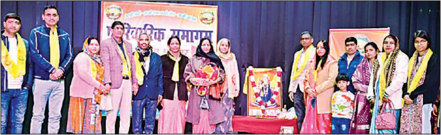
उर्दू अकादमी के प्रेक्षागृह में पारिवारिक समागम में मौजूद लोग ।