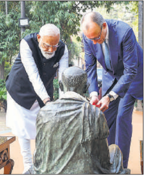
● प्रधानमंत्री मोदी और जर्मन चांसलर ने महात्मा गांधी को श्रद्धांजलि अर्पित की

प्रधानमंत्री नरेन्द्र मोदी और जर्मनी के चांसलर मर्ज ने सोमवार सुबह अहमदाबाद में साबरमती आश्रम पहुंचकर महात्मा गांधी को श्रद्धांजलि अर्पित की । कुछ मिनट पहले ही आश्रम पहुंचे प्रधानमंत्री मोदी ने जर्मन चांसलर का वहां पहुंचने पर स्वागत किया । राष्ट्रपिता की प्रतिमा पर पुष्पांजलि अर्पित करने के बाद दोनों नेताओं ने आश्रम के अंदर एक कमरे ‘हृदय कुंज’ का दौरा किया, जहां भारत के स्वतंत्रता संग्राम