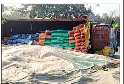
डीसीएम के पलटने से बिखरी कोल्ड ड्रिंक की क्रेटें।

खिलाड़ियों से परिचय प्राप्त करते मुख्य अतिथि।