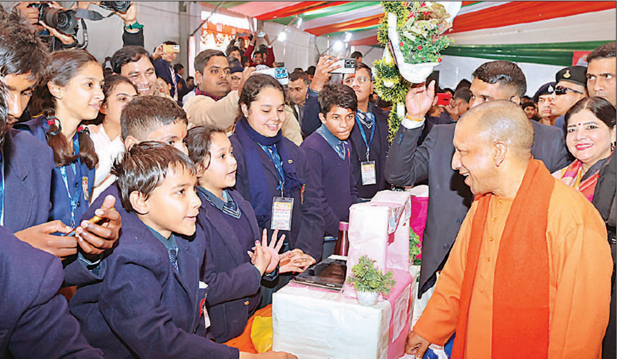
गोरखपुर महोत्सव में बच्चों से बात करते मुख्यमंत्री योगी आदित्यनाथ।

पैदा किया जा रहा है। उन्होंने सवाल किया कि क्या किसी की नागरिकता गई? वीबी—जीरामजी में हर ग्राम सभा से प्रस्ताव लेकर जनता की भागीदारी सुनिश्चित की जाएगी। पुराने कानून में भ्रष्टाचार रोकना संभव नहीं था, इसलिए नया कानून लाना जरूरी हो गया।