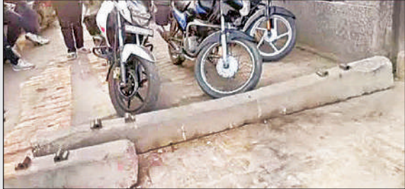
रेलवे का गार्डर रखकर बंद किया गया रास्ता।