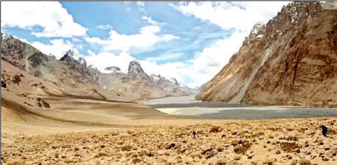
शक्सगाम घाटी पर चीन के दावे से तनाव ।

शक्सगाम घाटी पर चीन के दावे के बीच 1963 के उस अवैध समझौते का जन्म एक बार फिर बाहर आ गया है, जिसके तहत पाकिस्तान ने भारतीय क्षेत्र की 5,180 वर्ग किलोमीटर जमीन (शक्सगाम घाटी) चीन को उपहार में दे दी थी। ताजा सैटेलाइट तस्वीरों में इस विवादित क्षेत्र में चीन की बढ़ती सक्रियता और पक्की सड़कों के जाल ने भारत को कड़ा रुख अपनाने पर मजबूर कर दिया है। विदेश मंत्रालय पहले ही साफ कर चुका है कि अपनी संप्रभुता से समझौता भारत को कतई स्वीकार नहीं है। अब सेना प्रमुख उपेंद्र द्विवेदी ने भी स्पष्ट कर दिया है कि शक्सगाम घाटी में किसी भी तरह की गतिविधि को हम स्वीकार नहीं करते हैं और वहां चीन या पकिस्तान की किसी भी गतिविधि को गैरकानूनी मानेंगे।