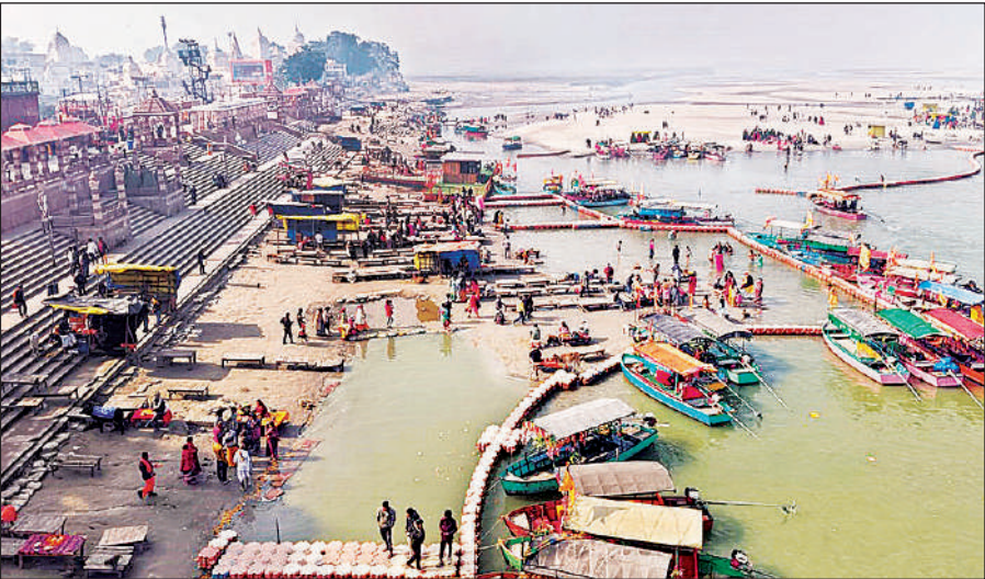
घाट से दूर दिख रही सरयू नदी का जलस्तर।