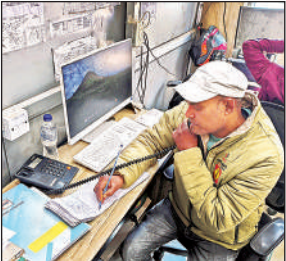
नगर निगम के कंट्रोल रूम में आम जन की शिकायतें नोट करता कर्मचारी।