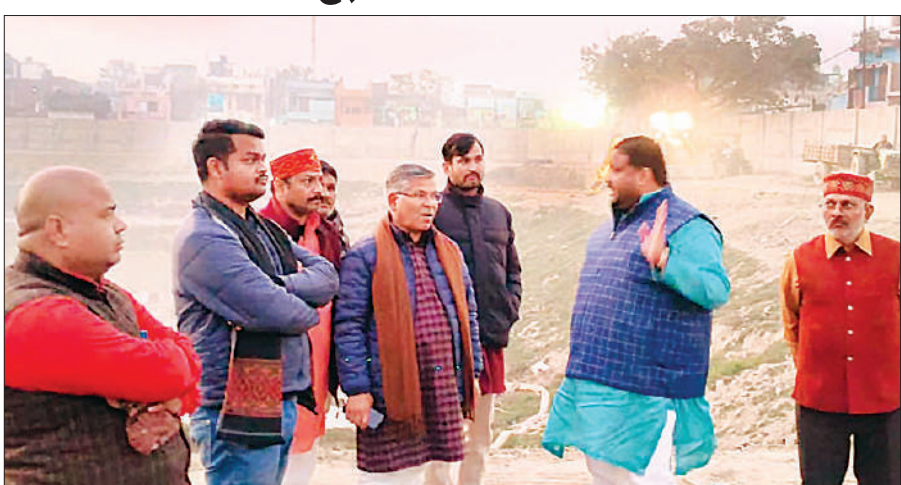
नगर की प्राचीन धरोहरों का निरीक्षण करते नगरपालिका अध्यक्ष व अन्य।

निरीक्षण के दौरान निर्माण कार्यों की गुणवत्ता, प्रगति, उपयोग में लाई जा रही सामग्री तथा भावी आवश्यकताओं को लेकर विस्तृत चर्चा की गई। पालिकाध्यक्ष ने