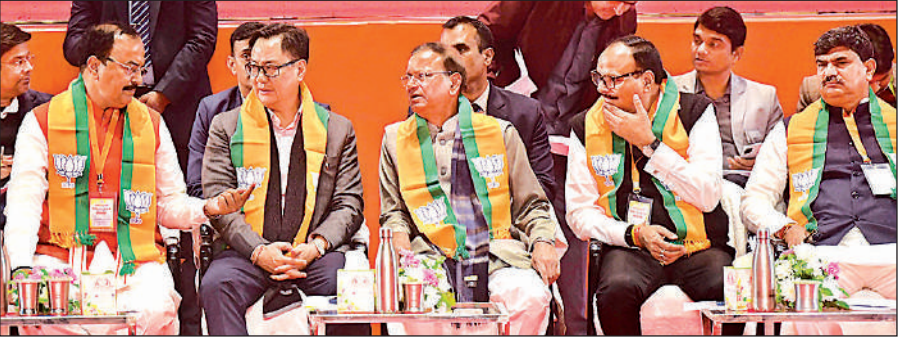
इंदिरा गांधी प्रतिष्ठान में आयोजित वर्कशॉप में बाएं से उप मुख्यमंत्री केशव प्रसाद मौर्य, केंद्रीय मंत्री किरण रिंजिजू, भाजपा प्रदेश अध्यक्ष पंकज चौधरी, उप मुख्यमंत्री ब्रजेश पाठक और भाजपा के संगठन महामंत्री धर्मपाल सिंह।

किरण रिंजिजू ने बताया कि वीबी—जीरामजी के तहत हर परियोजना की डिजिटल मॉनिटरिंग होगी, जिससे भ्रष्टाचार और दुरुपयोग की कोई गुंजाइश नहीं