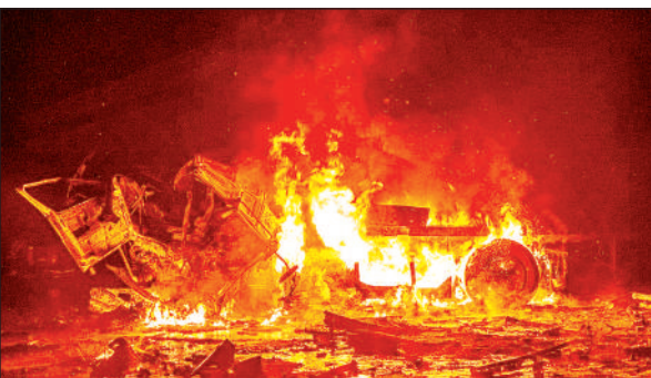
यूक्रेन की आपातकालीन सेवा द्वारा उपलब्ध कराई गई इस तस्वीर में मंगलवार को यूक्रेन के खाकिव में रूसी हमले के बाद लगी आग को बुझाते सेवा कर्मी ।

ताजा घटना : दो दिन पहले चीन ने भारत के विरोध को खारिज करते हुए निर्माण जारी रखने की बात कही है।