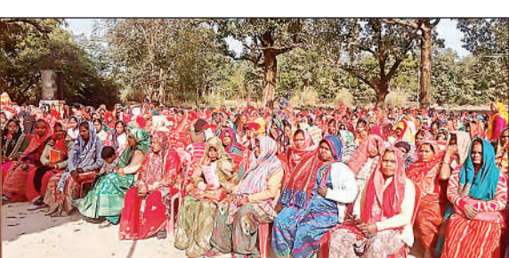
संगम प्रेरणा महिला संकुल समिति की वार्षिक आम सभा में मौजूद सदस्य।