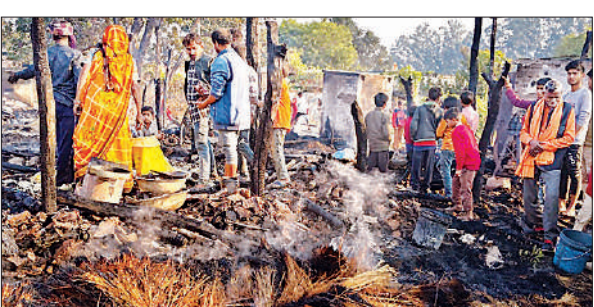
अग्निकांड में जली पीड़ितों की घर गृहस्थी।