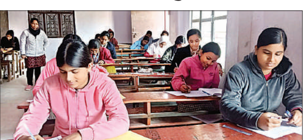
परीक्षा देती छात्राएं।