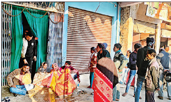
अवैध चिकित्सालय के सामने घरने पर बैठे पीड़ित परिजन।