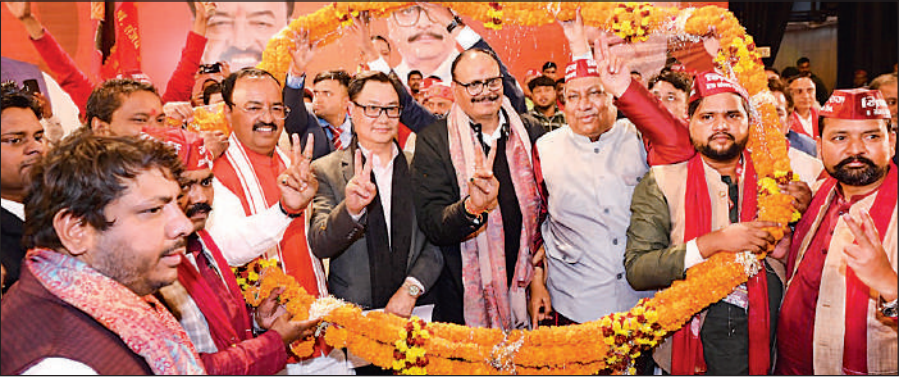
केंद्रीय मंत्री किरण रिंजिजू, उप मुख्यमंत्री द्वय केशव प्रसाद मौर्य, ब्रजेश पाठक और संजय निषाद का स्वागत करते कार्यकर्ता।