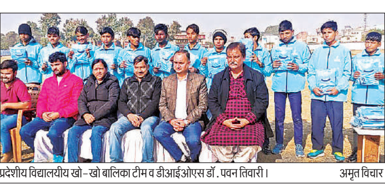
उप्र बालक-बालिका खो-खो टीम रवाना