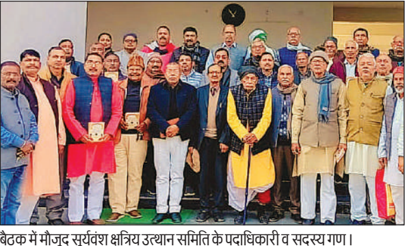
बैठक में मौजूद सूर्यवंश क्षत्रिय उत्थान समिति के पदाधिकारी व सदस्य गण।