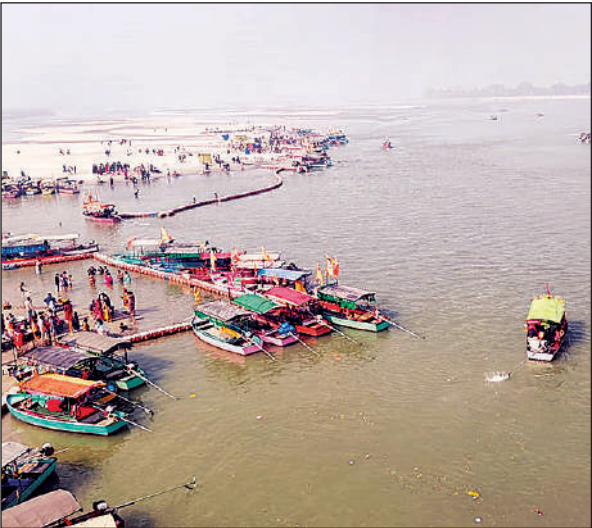
घाट से आधा किलोमीटर दूर हुई सरयू नदी।

किलोमीटर के क्षेत्र में सरयू की धारा काफी दूर है। मुख्य स्नान घाट स्वर्गद्वार और नया घाट क्षेत्र में भी सरयू की जल धारा दूर चले जाने के कारण आने वाले श्रद्धालुओं के लिए मुश्किल खड़ी हो रही है। अब श्रद्धालु राम की पैड़ी पर स्नान कर रहे हैं। बड़ी संख्या में श्रद्धालुओं को स्नान के लिए रेती में जाना होगा। ऐसे में भक्तों को काफी कठिनाइयों