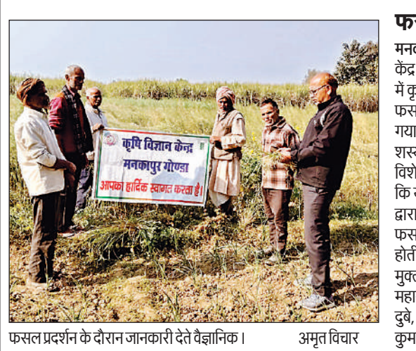
फसल प्रदर्शन के दौरान जानकारी देते वैज्ञानिक।