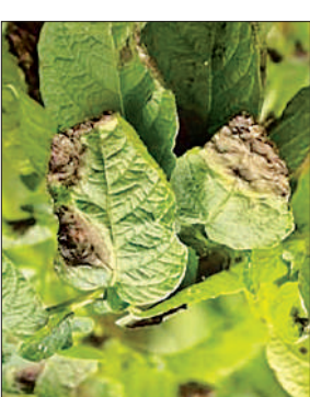
आलू की फसल में लगा झुलसा रोग।

उन्होंने बताया कि रात का तापमान 8 से 12 डिग्री सेल्सियस, दिन का तापमान 20 डिग्री सेल्सियस से कम तथा वातावरण में 85 से 95 प्रतिशत नमी होने पर यह रोग तेजी से फैलता है। पछेती झुलसा के लक्षण पत्तियों पर हल्के हरे पानी जैसे धब्बों से शुरू होकर पहले भूरे रंग में बदल जाते हैं। पत्तियों के नीचे सफेद फफूंद दिखाई