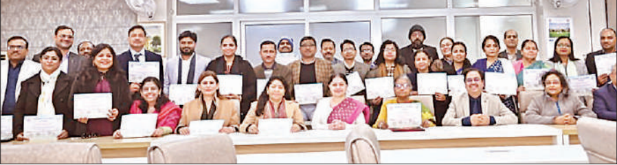
सम्मानित किए गए विभिन्न संकायों के शिक्षक।