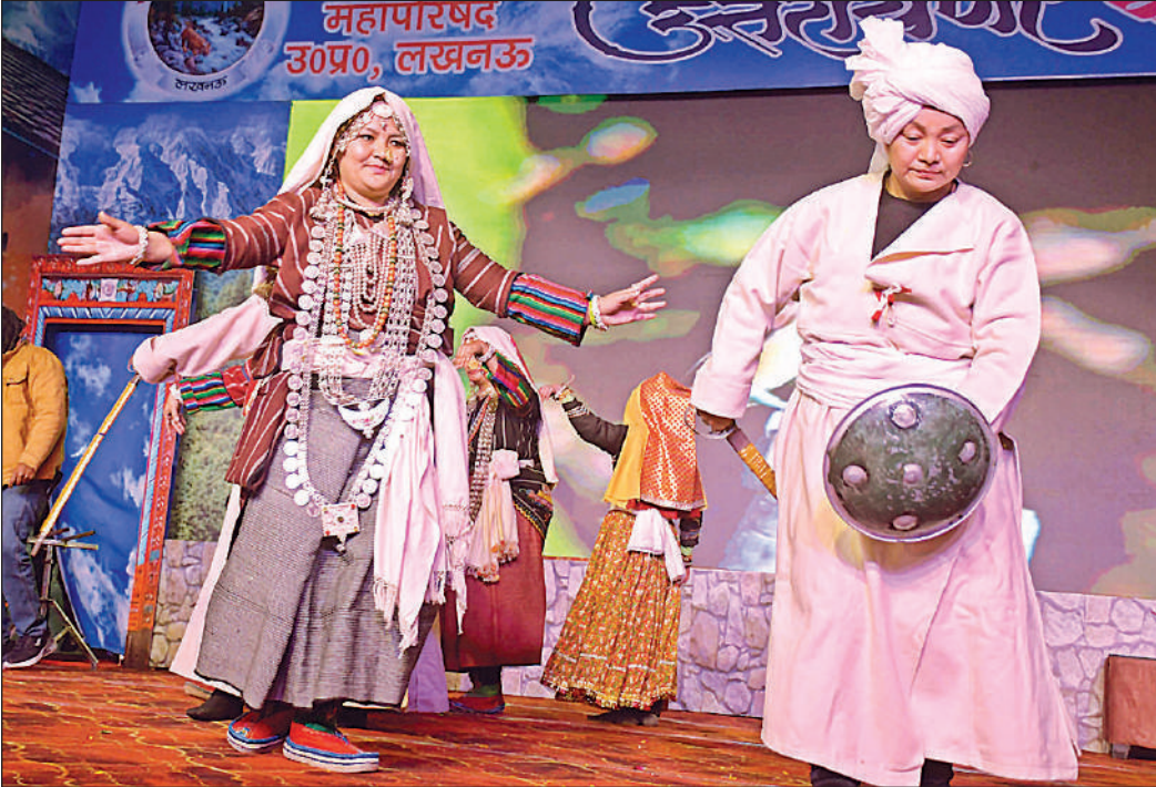
पर्वतीय सांस्कृतिक उपवन में आयोजित उत्तरायणी कौथिग में लोक नृत्य प्रस्तुत करती महिलाएं।