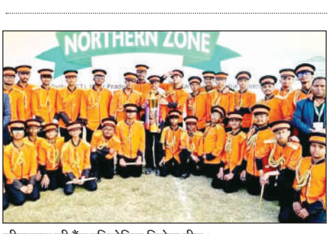
सीएमएस की बैड प्रतियोगिता विजेता टीम।