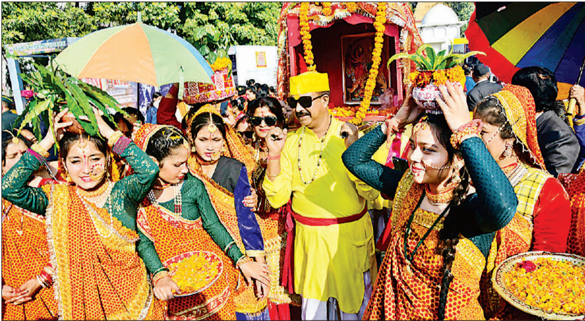
उत्तरायणी कौथिग के तहत बुधवार को महानगर रामलीला मैदान से निकाली गई शोभायात्रा में शामिल भगवान की पालकी के साथ कलश लेकर चलती युवतियां और पारंपरिक परिधानों में यात्रा में शामिल महिलाएं।