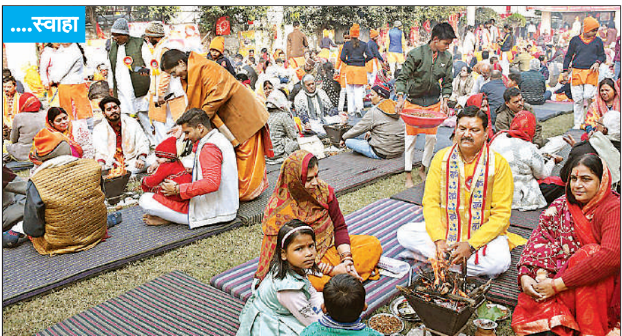
जानकीपुरम के मदर्स प्राइड स्कूल परिसर में मकर संक्रांति पर वैदिक परिवार ने 51 कुडीय यज्ञ का आयोजन किया। इसमें सैकड़ों की संख्या में श्रद्धालु शामिल हुए और यज्ञ में आहुतियां दीं। अमृत विचार

तीमारदार मायूस लौट जाते हैं। कई बार मरीजों के नाम प्रतीक्षा सूची में दर्ज कर तीमारदारों को इंतजार करना पड़ता है। सीसीएम और इमरजेंसी विभाग में बेड बढ़ने से न सिर्फ इलाज समय पर मिल सकेगा, बल्कि कई जिंदगियां भी बचाई जा सकेंगी। इसके साथ ही डॉक्टरों और अन्य स्वास्थ्यकर्मियों के नए पद भी सृजित किए जाएंगे, जिससे पीजीआई में गंभीर मरीजों की देखभाल और अधिक मजबूत हो सकेगी।