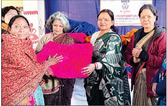
कंबल वितरण करती नवयुग महाविद्यालय की प्राचार्या।