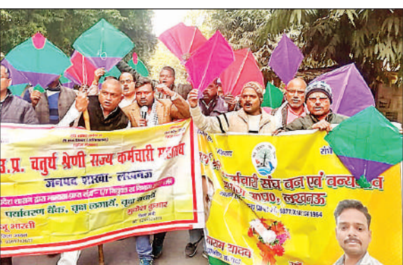
प्रदर्शन करते वन विभाग के कर्मचारी।