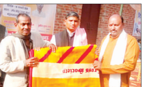
जरूरतमंद को कंबल देते लोग।