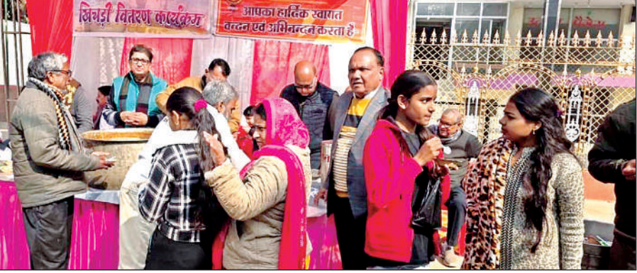
चौपरा मंदिर रोड पर राहगीरों को खिचड़ी बांटते व्यापार मंडल के पदाधिकारी।