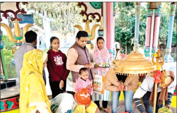
उमंगेश्वर महादेव का जलाभिषेक करते श्रद्धालु।

शुभ कार्य और विवाह आदि शुरू हो जाते हैं। श्रद्धालुओं ने नदी झीलों में स्नान ध्यान के बाद सूर्य भगवान और गुरु गोरखनाथ की पूजा अर्चना की। स्नान के दौरान श्रद्धालु भक्ति भावनाओं से ओतप्रोत नजर आए। सुबह से स्नान के लिए निकली महिलाएं भी गीत गाती जा रहीं थी। मकर संक्रांति पर्व के प्रति महिलाओं