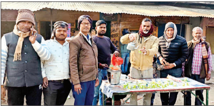
फफूंद में खिचड़ी का प्रसाद ग्रहण करते कस्बावासी।