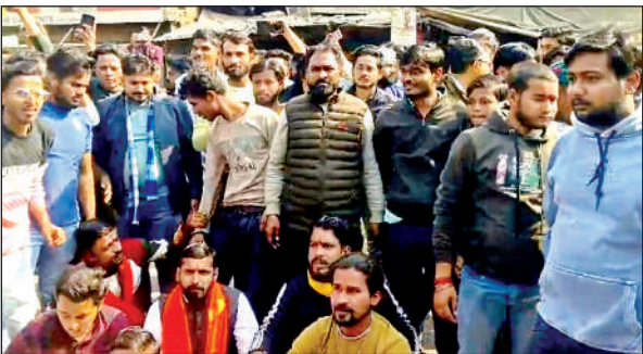
नेशनल हाईवे में जाम लगाकर आक्रोश जताते हिंदू संगठन के लोग।