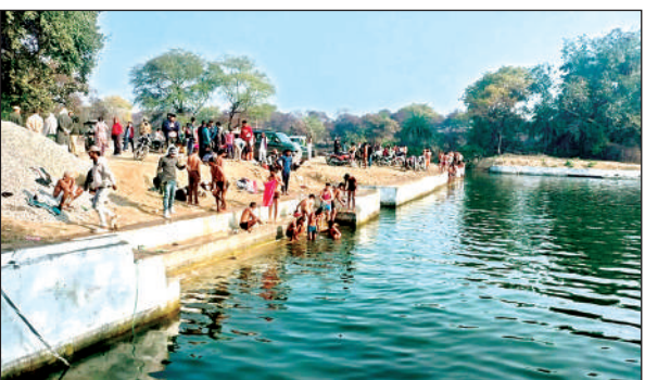
गोपाल सागर में डुबकी लगाते श्रद्धालु।