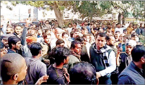
थाना परिसर में एकत्र हिंदू संगठन के लोग।