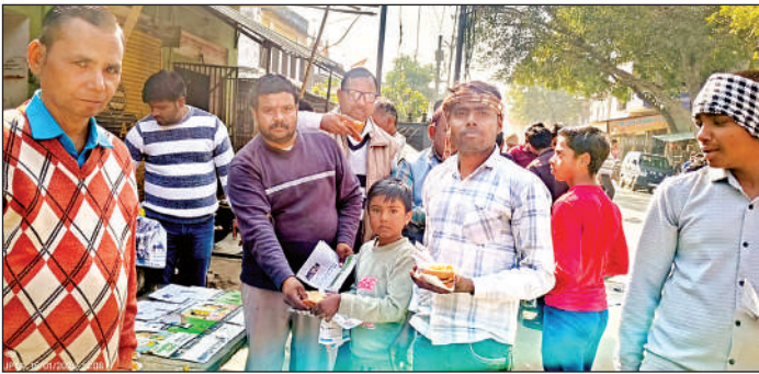
अछल्दा में खिचड़ी वितरित करते लोग।