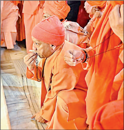
सीटी बजाकर गुरु गोरखनाथ को प्रणाम करते मुख्यमंत्री योगी।

देव विग्रहों का पूजन किया तथा योगिराज बाबा गंभीरनाथ, दादागुरु महंत दिग्विजयनाथ, गुरुदेव महंत