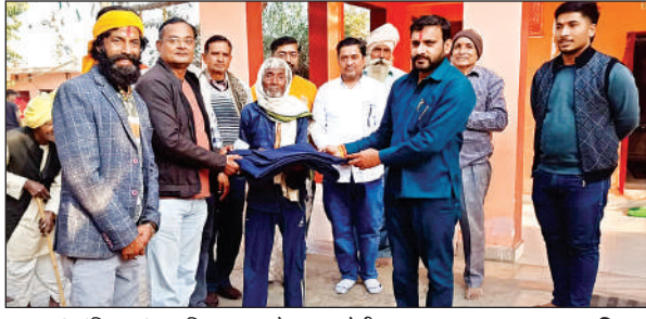
मकर संक्रांति पर कंबल वितरण करते समाजसेवी।