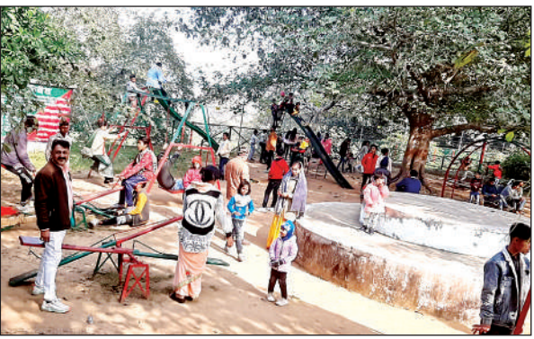
परिजनो के साथ झूले का आनंद लेते बच्चे।

कस्बा जैतपुर के घौसा मंदिर के सरोवर में सुबह से लोगों की भीड़ जुटना शुरू हो गई, जहां पर महिलाएं भी भारी संख्या में एकत्र हुईं। इसके बादपर्व पर गाने वाले लमटेरा गायन से मंदिर परिसर गूंज उठा। डूबकी लगाने के बाद राधा गोपाल के दर्शन किए। मंदिर परिसर श्रद्धालुओं से खचाखच