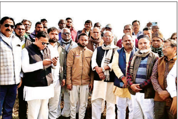
पूर्व सांसद के अंतिम दर्शन के लिए उमड़ा लोगों का हुजूम।