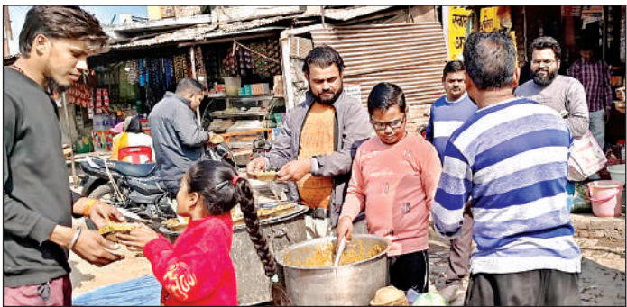
बेला में खिचड़ी वितरित करते लोग।