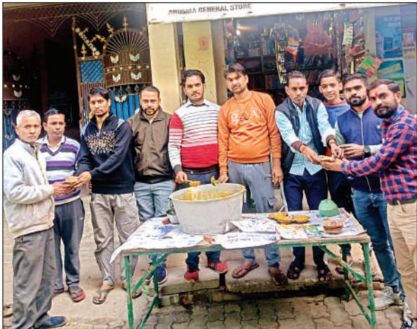
मकर संक्रांति के अवसर पर धनिया के आलू वितरित करते श्रद्धालु।

फफूंद संवाददाता के अनुसार मकर संक्रांति के पावन पर्व पर कस्बा सहित ग्रामीण अंचलों में भारी उत्साह देखने को मिला। दान-पुण्य के इस महापर्व के अवसर पर नगर के अछल्दा चौराहा स्थित प्राचीन शिव मंदिर परिसर में विशाल भंडारे का आयोजन किया गया। यहाँ राहगीरों और श्रद्धालुओं को श्रद्धापूर्वक चाय और खिचड़ी का प्रसाद वितरित किया गया।बुधवार को आयोजित इस कार्यक्रम की शुरुआत भगवान शिव की पूजा-अर्चना और भोग लगाकर की गई।