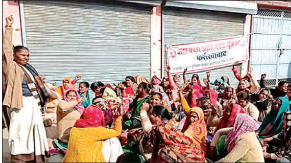
सीएमओ कार्यालय फतेहाढ़ में धरने पर बैठी आशा कार्यक्रियां।