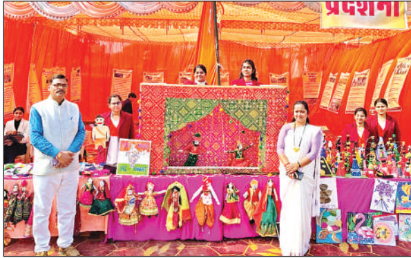
कार्यक्रम के दौरान कठपुतली का प्रदर्शन करते विद्यार्थी।