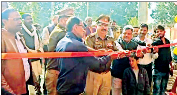
मेले का शुभारंभ करते मुख्य अतिथि।