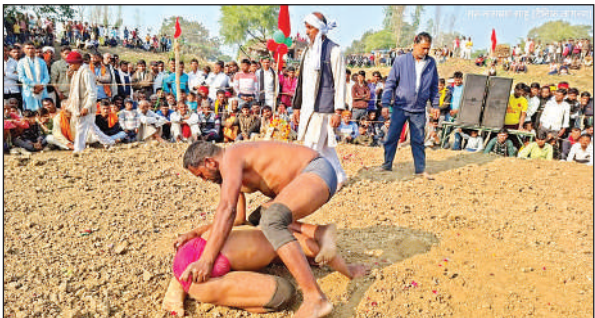
दांवपेच से एक दूसरे को चित करने की कोशिश में पहलवान।

जवानी चलती है, उस ओर जमाना चलता है। कार्यक्रम के दौरान छात्र-छात्राओं ने निबंध प्रतियोगिता, व्याख्यान, विचार विमर्श, स्वास्थ्य परीक्षण, प्रदर्शनी, सेवा कार्य आदि गतिविधियों की। निबंध प्रतियोगिता में शामिल छात्र छात्राओं को सहभागिता प्रमाणपत्र दिए जाएंगे।