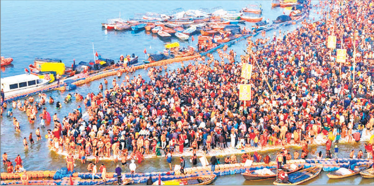
प्रयागराज : मकर संक्रांति पर संगम में आस्था की डुबकी लगाते श्रद्धालु।