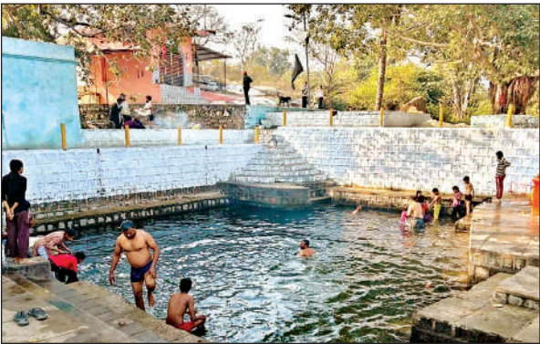
रामकुंड में डुबकी लगाते श्रद्धालु।

मकर संक्रांति त्योहार को लेकर सुबह से ही मुहल्लों में चहल पहल शुरू हो गई, श्रद्धालुओं ने सुबह से तालाबों और झीलों में जाने के लिए सारी व्यवस्थाएं पूरी कर ली, महिलाएं झुंड बनाकर पैदल, ट्रैक्टरों व अन्य वाहनों पर सवार होकर सरोवरों व नदियों में डुबकी लगाने पहुंचीं। कड़ाके की ठंड के बाद भी परिवार के लोगों के साथ बच्चे भी बाइक, चार पहिया वाहनों से झीलों और तालाबों पर बुड़की लगाने पहुंचे, शहर के विजय सागर झील, रामकुंड के अलावा अन्य झीलों में भी डुबकी लगाने के लिए तमाम श्रद्धालुओं की भीड़ जुटी