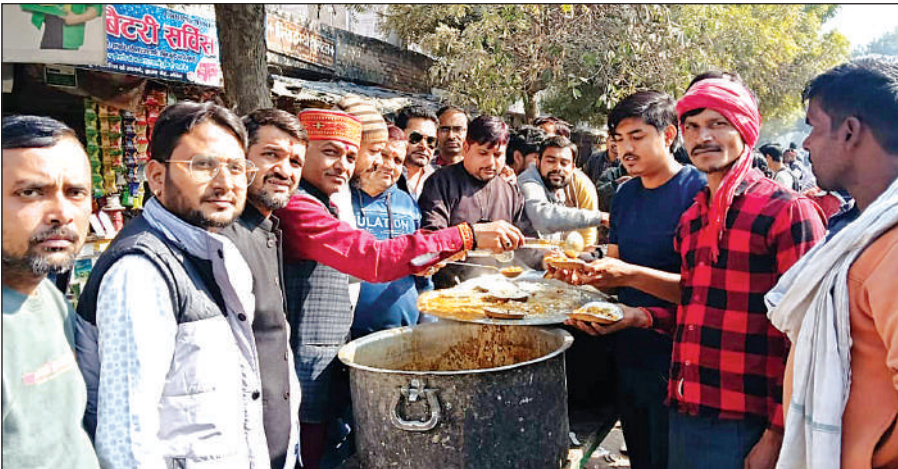
शहर के इटावा रोड मिश्रा मार्केट में छोले चावल वितरित करते समाजसेवी।