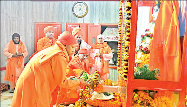
गोरखनाथ मंदिर में गुरु गोरखनाथ की प्रतिमा के समक्ष खिचड़ी का भोग अर्पित करते मुख्यमंत्री योगी।

अमृत विचार: मकर संक्रांति के पावन पर्व पर गोरखपुर स्थित गोरखनाथ मंदिर आस्था, परंपरा और लोकमंगल की विराट चेतना का साक्षी बना। गोरक्षपीठाधीश्वर एवं मुख्यमंत्री योगी आदित्यनाथ ने गुरुवार को ब्रह्म मुहूर्त में गर्भगृह में भूमि पर बैठकर, सीटी बजाकर गुरु गोरखनाथ को प्रणाम किया। विधिविधान से श्रीनाथ जी का पूजन कर गोरक्षपीठ की ओर से खिचड़ी का भोग अर्पित किया। योगी द्वारा भोग अर्पण के बाद मंदिर के कपाट आम श्रद्धालुओं के लिए खोल दिए गए। बाबा का खप्पर भरणे श्रद्धा की अंजुरी में खिचड़ी लेकर लाखों श्रद्धालु उमड़ें। पूरे दिन