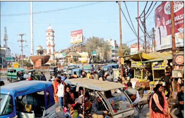
घंटाघर चौराहे पर अक्सर ऐसे ही जाम के हालात रहते हैं।