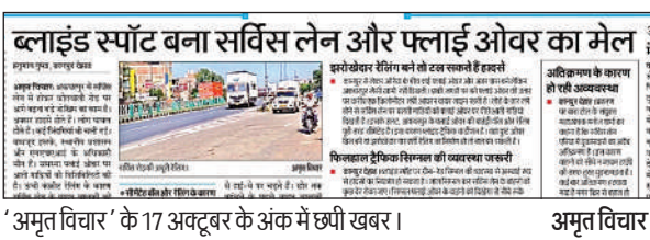
‘अमृत विचार’ के 17 अक्टूबर के अंक में छपी खबर।