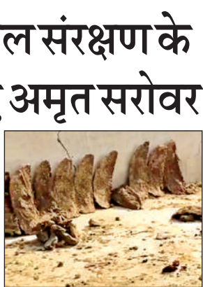
तालाब के चारों ओर सूखने को रखे गए कंडे।

कोतवाली की तरफ फ्लाई ओवर के किनारे करीब सौ फीट लंबी और तीन फीट उंची रेडीमेड सीमेंटेड वॉल लगा दी गई है। उंचाई कम होने से हाईवे के वाहन अब दूर से दिखाई दे रहे। इसके साथ सर्विस लेन पर स्पीड ब्रेकर भी बना दिया गया है। ब्लाईंड स्पॉट की तरफ जाने वाले सर्विस लेन के वाहन अब स्पीड कम कर गुजर रहे। हादसों का जोखिम कम करने के लिए ‘अमृत विचार’ द्वारा की गई पहल की इलाकाई लोगों ने सराहना की।