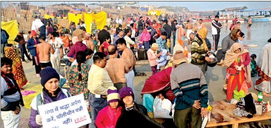
मकर संक्रांति पर सरसैया घाट पर स्नानार्थियों का जमघट लगा।।