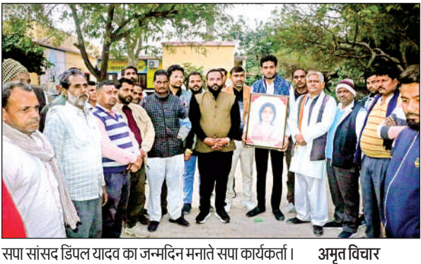
सपा सांसद डिंपल यादव का जन्मदिन मनाते सपा कार्यकर्ता।

समारोह का शुभारंभ क्षेत्र के विधानसभा अध्यक्ष और वरिष्ठ पदाधिकारियों द्वारा केक काटकर किया गया। इस दौरान कार्यकर्ताओं ने एक-दूसरे का मुंह मीठा कराया और डिंपल यादव के समर्थन में जमकर नारेबाजी की। विनय यादव ने कार्यकर्ताओं को संबोधित करते हुए कहा डिंपल यादव समाजवादी विचारधारा की एक सशक्त और