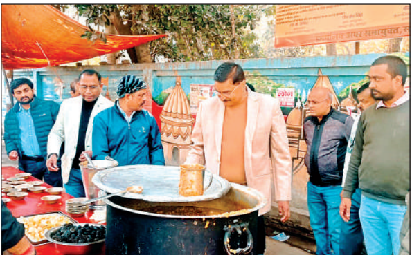
अपर श्रमायुक्त कार्यालय में खिचड़ी बांटी गई।।

स्थानों में खिचड़ी भोज भी हुआ। स्वरूप नगर, तिलक नगर, आर्य नगर, शास्त्री नगर, बिरहाना रोड, शिवाला, मेस्टन रोड सहित अन्य इलाकों में खिचड़ी वितरण भी किया गया।