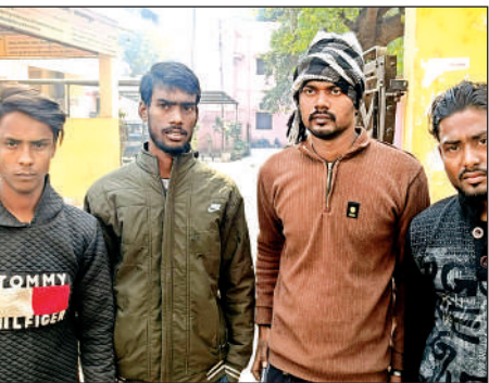
घटना की जानकारी देते परिजन।