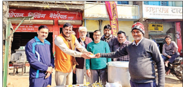
पुराने पोस्ट ऑफिस मार्ग पर खिचड़ी वितरित करते हुए।