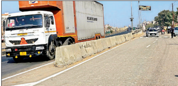
सर्विस लेन पर लगाई गई सीमेंटेड वॉल।