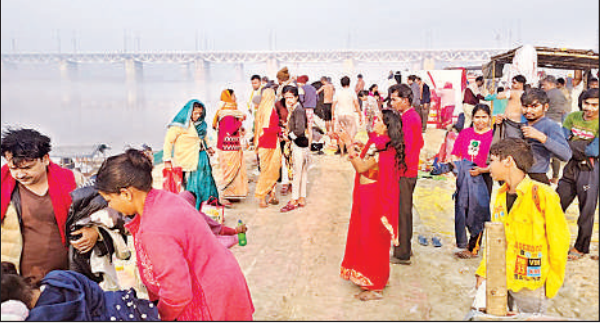
मकर संक्रांति पर गंगा स्नान के लिये तट पर पहुंचे श्रद्धालु।