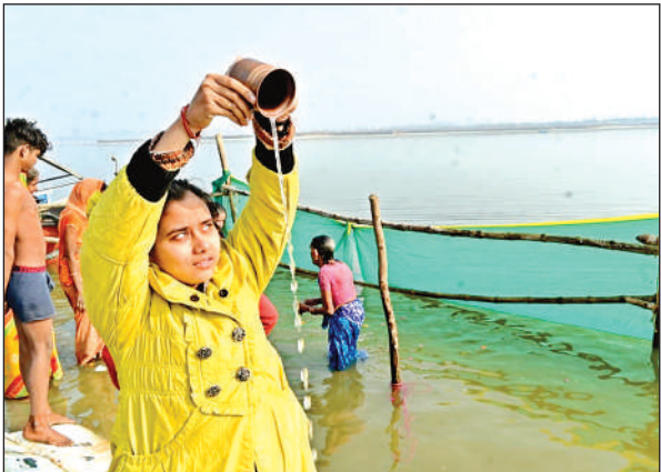
सूर्य के मकर राशि पर प्रवेश करने पर अर्घ्य देती श्रद्धालु ।