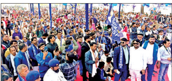
रतनपुर पनकी के रामलीला मैदान में एकत्र हुए बसपा कार्यकर्ता।।