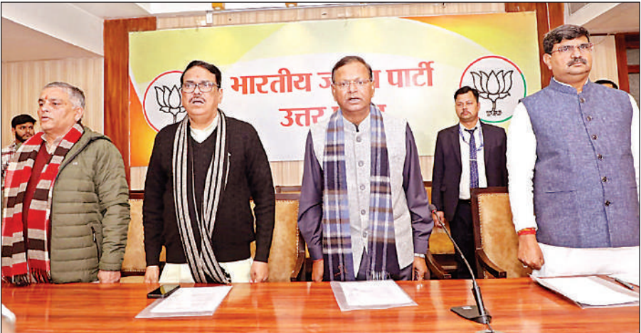
प्रदेश भाजपा मुख्यालय में मोर्चा और प्रकोष्ठों की बैठक के दौरान प्रदेश अध्यक्ष पंकज चौधरी, साथ में अन्य।

उन्होंने प्रधानमंत्री नरेंद्र मोदी के नेतृत्व में केंद्र सरकार की उपलब्धियों का उल्लेख करते हुए कहा कि गरीब, किसान, युवा और महिलाओं के