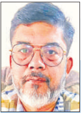
विवेक सर्वसेना अयोध्या

दिसंबर 2025 के अंत में ईरान में आर्थिक संकट के खिलाफ शुरू हुआ व्यापक विरोध-प्रदर्शन न सिर्फ राजनीतिक परिवर्तन की मांग में तब्दील हो गया है, बल्कि इसने इस इस्त्तामिक गणराज्य के समक्ष हाल के वर्षों की सबसे गंभीर आंतरिक चुनौती खड़ी कर दी है। हालात का अंदाजा इसी बात से लगाया जा सकता है कि अमेरिका स्थित ब्लूमन राइट एंक्टिविस्ट न्यूज एजेंसी (एचआरएएनए) के अनुसार हिंसक झड़पों में अब तक 2,572 लोगों की मौत हो जाने और 10 हजार से अधिक लोगों को हिरासत में लेने का दावा किया जा रहा है।