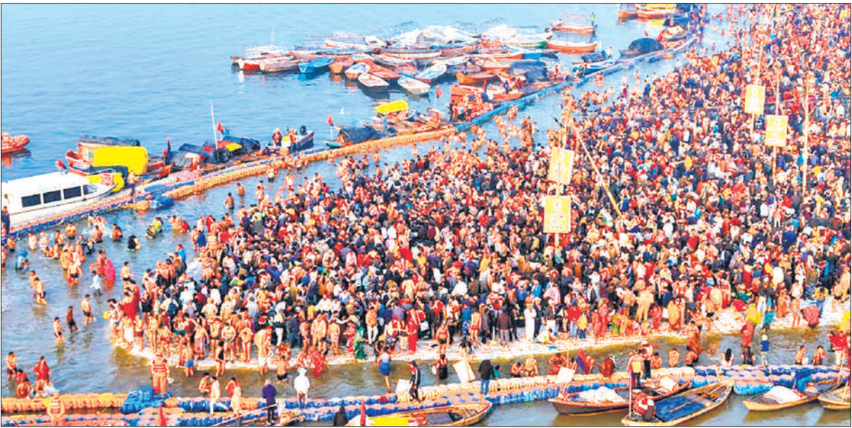
प्रयागराज : मकर संक्रांति पर संगम में आस्था की डुबकी लगाते श्रद्धालु।