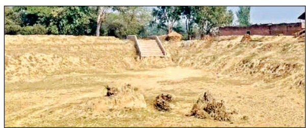
सूखा पड़ा अमृत सरोवर।

यह स्थिति योजना की जमीनी हकीकत पर सवाल उठाती है और जल संरक्षण के उद्देश्य को उपहास का पात्र बना रही है। तालाब के चारों ओर जानवर बांधे जाने, गोबर के ढेर लगे होने से यह एक उपेक्षित मैदान जैसा दिख रहा है। जिससे इसके अमृत सरोवर की मूल पहचान खत्म हो गई है। ग्रामीणों का आरोप है कि सरकारी धन का दुरुपयोग किया गया और कागजों में तालाब को पूर्ण दिखाया गया जब कि हकीकत इससे परे है। इन स्थितियों को लेकर ग्रामीणों में आक्रोश है। ग्रामीणों ने मामले की उच्चस्तरीय जांच और दोधियों एवं जिम्मेदार लोगों पर ठोस कार्रवाई किए जाने की मांग की है।