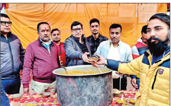
माल रोड में खिचड़ी का वितरण करते लोग ।