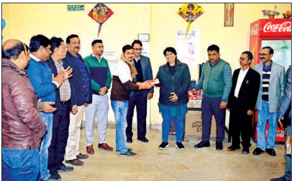
राष्ट्रीय शर्करा संस्थान की कैंटीन में कार्यक्रम हुआ।।

सबसे अधिक भीड़ परमट स्थित आनंदेश्वर मंदिर व जाजमऊ स्थित सिद्धनाथ मंदिर में रही। यहां पर