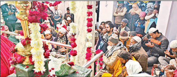
उर्स में दुआ मांगते अकीदतमंद।