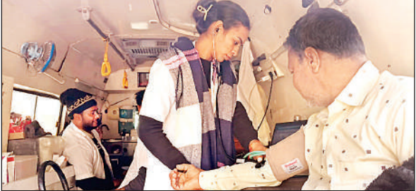
मरीजों की जांच करती स्वास्थ्य कर्मी।