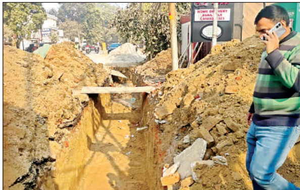
पुराना सेल्स टैक्स रोड पर हो रही खोदाई।

जगहों पर खोदाई कर रहा है वह भी सुरक्षा के मानकों का ध्यान नहीं रख रहा है। योजना के तहत सड़क का चौड़ीकरण होना है और फुटपाथ, हरियाली का प्रबंध किया जाना है। हरियाली इसलिए ताकि प्रदूषण रोक जा सके। फुटपाथ बन जाने से धूल नहीं उड़ेगी तो भी प्रदूषण रुकेगा। सड़क बार- बार न खोदनी पड़े इसके लिए इन सड़कों पर यूटिलिटी डकट (भूमिगत पाइपलाइन, केबल) की सुविधा होगी। थाना स्वरूप नगर से गोपाला चौराहा (2.65 किमी) बनेगी। दुर्भाग्य यह है कि यहां प्रदूषण और हादसे के बचाव का कोई प्रबंध नहीं है।