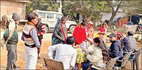
टीम के साथ मौजूद एसपी व सीओ।

जानकारी के अनुसार, दो बच्चियां व एक बच्चा घर में दादी की डांट से बचने के लिए बिना किसी को बताए निकल पड़े। मासूमियत व डर के बीच वे ट्रेन पकड़कर गंगाघाट पहुंच गए। बच्चों के अचानक गायब होने की खबर से परिजनों के पैरों तले जमीन खिसक गई। परिजनों की सूचना से पुलिस महकम में हलचल मच गई। एसपी के निर्देश पर अजगैन पुलिस ने गुमशुदगी दर्ज कर सच अभियान शुरू किया। ऑपरेशन