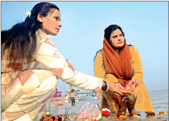
महिलाओं ने स्नान के बाद गंगा के किनारे पूजा- अर्चना की ।