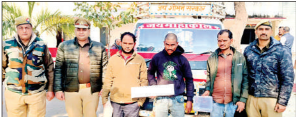
शिवली पुलिस की गिरफ्त में लोडर चोरी के आरोपी।