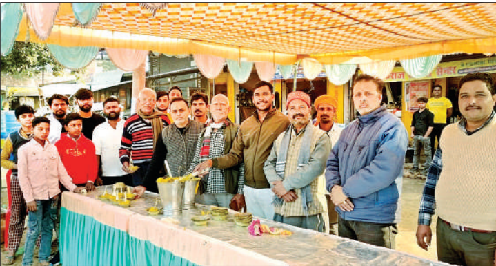
खिचड़ी समरसता भोज में शामिल लोग।