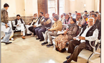
समरसता भोज में मौजूद विधायक व अन्य।