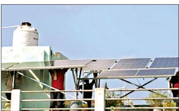
घर की छत पर सोलर पैनल लगाकर सौर ऊर्जा का लाभ ले रहे लोग ।

अमृत विचार। कानपुर नगर में बिजली उत्पादन का स्वरूप तेजी से बदल रहा है। प्रधानमंत्री सूर्य घर योजना के तहत शहर की छतों पर स्थापित सोलर रूफटॉप सिस्टम से करीब 64 मेगावाट क्षमता की सौर बिजली तैयार हो रही है।