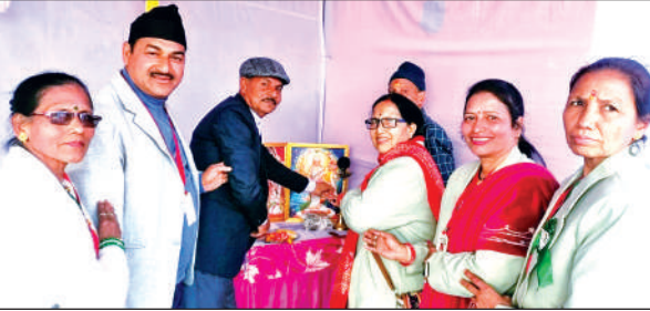
टनकपुर गांधी मैदान में दूसरे दिन मेले का शुभारंभ करते मुख्य अतिथि।