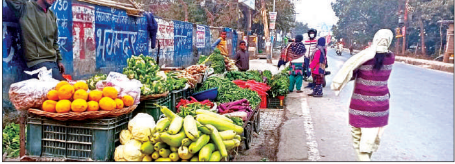
मुख्यानी से पनचक्की तक अतिक्रमण सड़क पर चलने को मजबूर लोग।।● अमृत विचार

अमृत विचार : नगर निगम की कार्रवाई का शोर जितना जोर-शोर से सुनाई देता है, जमीन पर उसका असर उतनी ही जल्दी हवा-हवाई हो जाता है। मुख्यानी चौराहे से पनचक्की तक जाने वाली मुख्य सड़क इसका ताजा सबूत है। यहां अतिक्रमणकारियों के हौसले इतने बुलंद हैं कि उन्होंने न सिर्फ सड़क छीनी है बल्कि आमजन के पैदल चलने का हक भी छीन लिया है। अभी कुछ ही दिन बीते हैं जब इसी सड़क पर एक भीषण हादसे में एक युवती ने अपनी जान गंवाई थी। उस समय जनता के आक्रोश के बाद नगर निगम का अमला सड़कों पर उतरा था। मुनादी हुई और जैसीबी