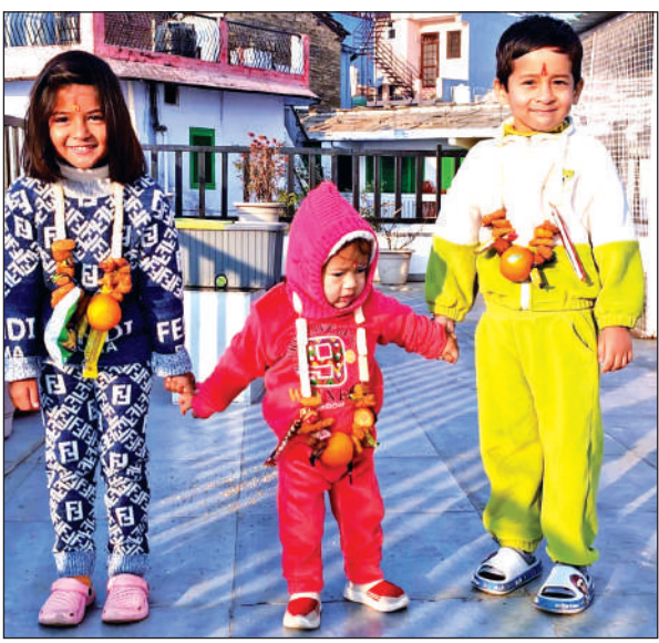
अल्मोड़ा में गुरुवार को घुघुति की माला पहनकर कौओं को आमंत्रित करते बच्चे।