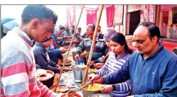
बाजपुर के मुख्यमार्ग पर नगरपालिका गेट के सामने प्रसाद वितरित करते श्रद्धालु।