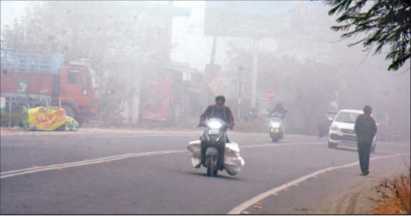
हल्द्वानी में गुरुवार को कोहरा छाने से दिन में लाइट चालू कर जाते वाहन चालक।

मौसम विज्ञान केंद्र के अनुसार हल्द्वानी में गुरुवार को न्यूनतम तापमान 0.5 डिग्री दर्ज किया गया है जो सामान्य से पांच डिग्री कम है। जनवरी माह में दर्ज किया गया अभी तक का सबसे कम तापमान है। सर्दियों के मौसम में इस बार दूसरी बार ऐसा हुआ है कि रात को पारा एक डिग्री से नीचे पहुंचा है। दिन के समय धूप निकलने से