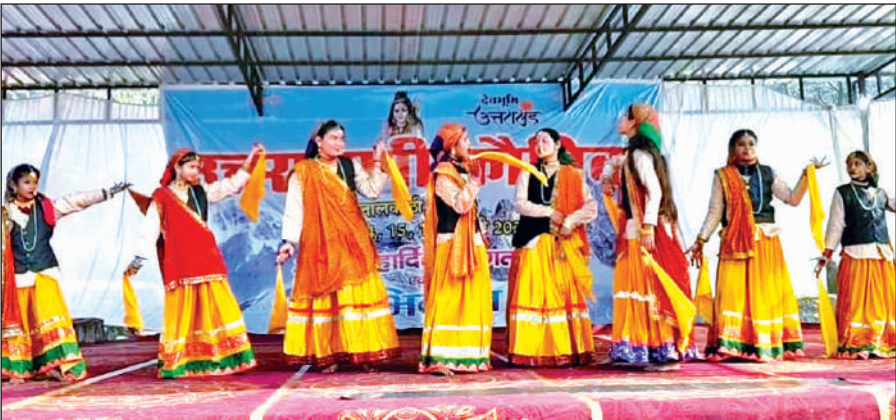
खटीमा के लाल कोटी उतरायणी कौतिक में सांस्कृतिक कार्यक्रम प्रस्तुत करते सरस्वती एकेडमी के बच्चे।