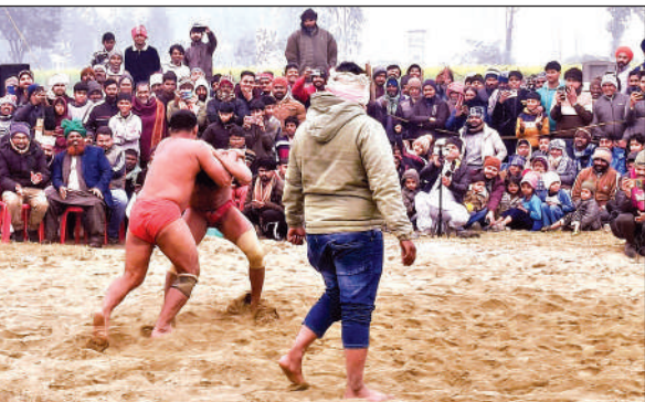
गदरपुर में आयोजित दंगल में भिड़ते पहलवान।