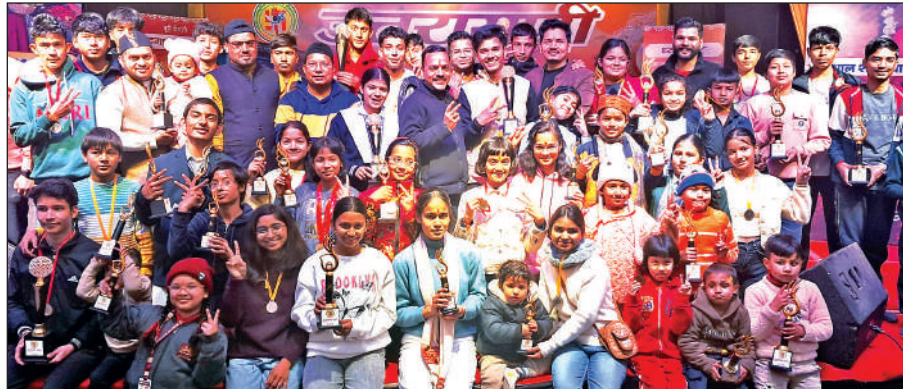
पर्वतीय उत्थान मंच में विभिन्न प्रतियोगिता में प्रतिभाग करने वाले विजेता बच्चों को संस्था द्वारा दिया गया मोमेंटो।।