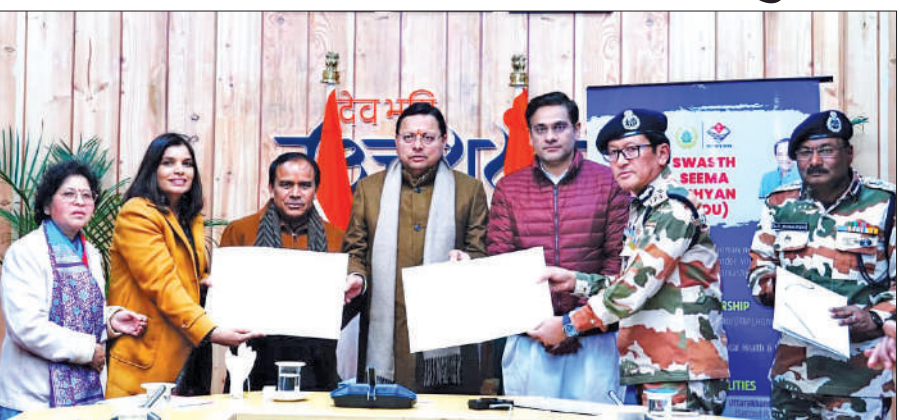
आईटीबीपी और सरकार के बीच हुए समझौते के दौरान मौजूद मुख्यमंत्री पुष्कर सिंह धामी और विभागीय अधिकारी।

राज्य की चीनी मिलों द्वारा पेराई सत्र 2025–26 में क्रय किए जाने वाले गन्ने का राज्य परामर्शित मूल्य एवं गन्ना विकास अशदान (कमीशन) की दर निर्धारित। गन्ने की अग्रेती प्रजाति हेतु 405 रुपये विंटल और सामान्य प्रजाति 395 रुपये प्रति विंटल परामर्शित मूल्य को मिली मंजूरी