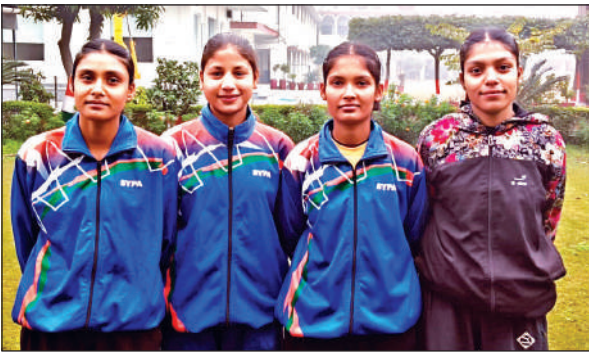
हैंडबॉल प्रतिस्पर्धा के लिए चयनित छात्राएं।