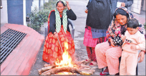
शीतलहर के प्रकोप से बचने के लिए घर के बाहर आग जलाकर हाथ तापते लोग।

मौसम विज्ञान केंद्र के अनुसार शुक्रवार से राज्य के कई पर्वतीय जिलों में पश्चिमी विक्षोभ सक्रिय हो रहा है। पिथौरागढ़, उत्तरकाशी, चमोली, रुद्रप्रयाग, बागेश्वर आदि जिलों में बारिश होने के आसार बन रहे हैं और साथ ही 3200 मीटर से ज्यादा ऊंचाई वाले इलाकों में बर्फबारी भी हो सकती है। 21 जनवरी तक मौसम इसी तरह का बना रहेगा। हिमालय में कम बर्फ का जो माहौल बना हुआ है, ऐसे में अगले पांच दिन बहुत ही उम्मीद भरे हैं। हालांकि अगर पहाड़ी इलाकों में बर्फबारी हुई तो आने वाले दिनों में मैदानी इलाकों में सर्द हवा से पारा और गिरेगा।