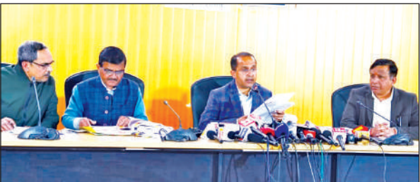
कैबिनेट में लिए गये निर्णयों की जानकारी देते शासन के वरिष्ठ अधिकारी।

अमृत विचार: मुख्यमंत्री पुष्कर सिंह धामी ने गुरुवार को कैबिनेट की बैठक में जनहित से जुड़े 19 प्रस्तावों को मंजूरी दे दी। कैबिनेट ने दी 18 पदों को मंजूरी: कैबिनेट ने दून विवि देहरादून में हिन्दू अध्ययन केंद्र (सेंटर ऑफ हिंदू स्टडीज) की स्थापना एवं संचालन हेतु 4 शैक्षिक (प्रोफेसर व एसोसिएट प्रोफेसर 1-1 पद एवं असिस्टेंट प्रोफेसर 2 पद ) तथा 2 शिक्षणत्तर सहित 6 पदों का सृजन करने का अनुमोदन दिया है जबकि यू-कोस्ट में उप आंचलिक विज्ञान केन्द्र, अल्मोड़ा एवं विज्ञान केन्द्र, चम्पावत के लिए 12 पद सृजित होंगे। खेल महाकुंभ में ट्रॉफी व पुरस्कार राशि को मंजूरी: युवा कल्याण एवं प्रान्तीय रक्षक दल विभाग में संचालित योजना खेल महाकुम्भ के अन्तर्गत होने वाली खेलकूद प्रतियोगिताओं में विधानसभा स्तर पर विधायक