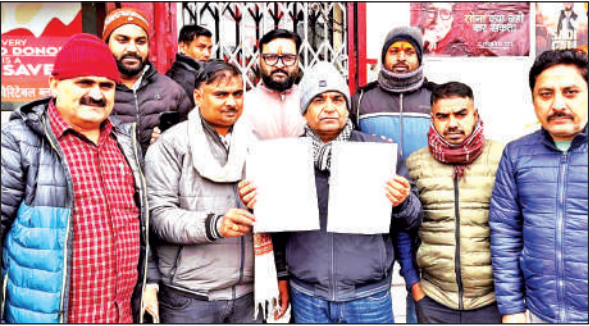
बैंक का चैनल बंद कर विरोध जताते व्यापारी।