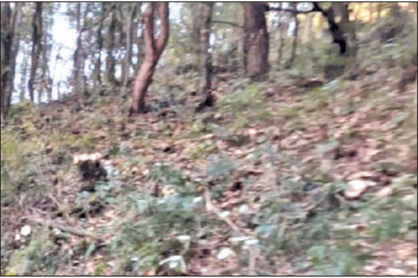
धारी तहसील के तल्ली दीनी क्षेत्र में काटे गए पेड़।