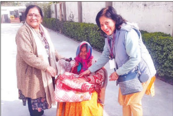
जरुरतमंद महिला को कंबल प्रदान करतीं इनरक्लील क्लब की पदाधिकारी।

हल्द्वानी : दमुवाढ़ंगा क्षेत्र में सीवर लाइन खोदे जाने के कारण लोगों को काफी परेशानियों का सामना करना पड़ रहा है। लाइन खोदे जाने के कारण कई पेयजल लाइनें क्षतिग्रस्त हो चुकीं जिससे लोगों को पेयजल समस्या से जूझना पड़ रहा है। धीमी गति से चल रहे कार्य के कारण वाहन की आवाजाही में भी परेशानी हो रही है।