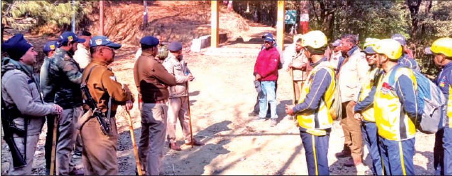
सोमेश्वर में ऐड़ाद्यो धाम के पुजारी की तलाश में सर्व अभियान चलाती पुलिस।