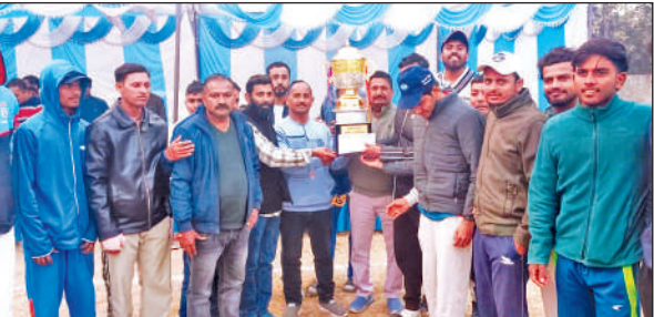
चोरगलिया में विजेता टीम को ट्रॉफी सौंपते अतिथि।