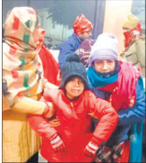
जिला अस्पताल पहुंचे घायल।

सूचना मिलने पर कटघर थाना पुलिस मौके पर पहुंची और स्थानीय