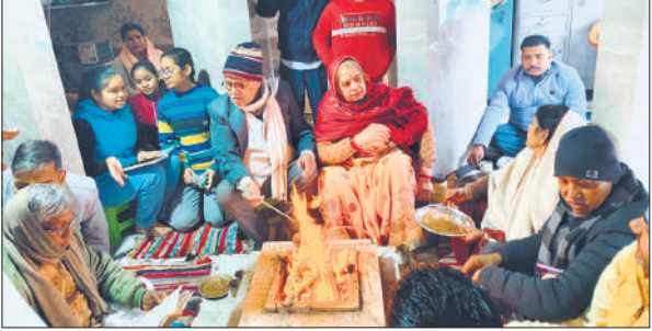
सरायतरीन में यज्ञ में आहुतियां देते आर्य समाज से जुड़े लोग।

नैमिषारण्य तीर्थ स्थित क्षेमनाथ मंदिर, पातालेश्वर महादेव मंदिर, महिला मंडल मंदिर, चामुंडा मंदिर, श्रीराम दरबार मंदिर, श्रीवंश गोपाल तीर्थ मंदिर, चंद्रेश्वर महादेव मंदिर सहित जनपद के तमाम मंदिरों में खिचड़ी भोज का आयोजन किया गया। बड़ी संख्या में श्रद्धालु मंदिरों में दर्शन-पूजन के लिए पहुंचे। मकर संक्रांति पर स्नान, दान और पूजा