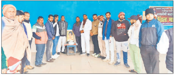
पूर्व मुख्यमंत्री का जन्म दिवस मनाते कार्यकर्ता।

इस मौके पर विधानसभा प्रभारी ने कहा कि बहन मायावती को देशभर में आयरन लेडी के नाम से जाना जाता है। उन्होंने कहा कि बहन मायावती का शासनकाल भ्रष्टाचार से मुक्त रहा