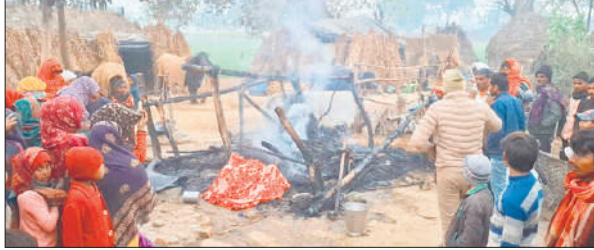
जलकर राख हुई झोपड़ी धेरे ग्रामीण व पुलिसकर्मी।