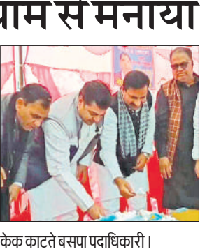
केक काटते बसपा पदाधिकारी।