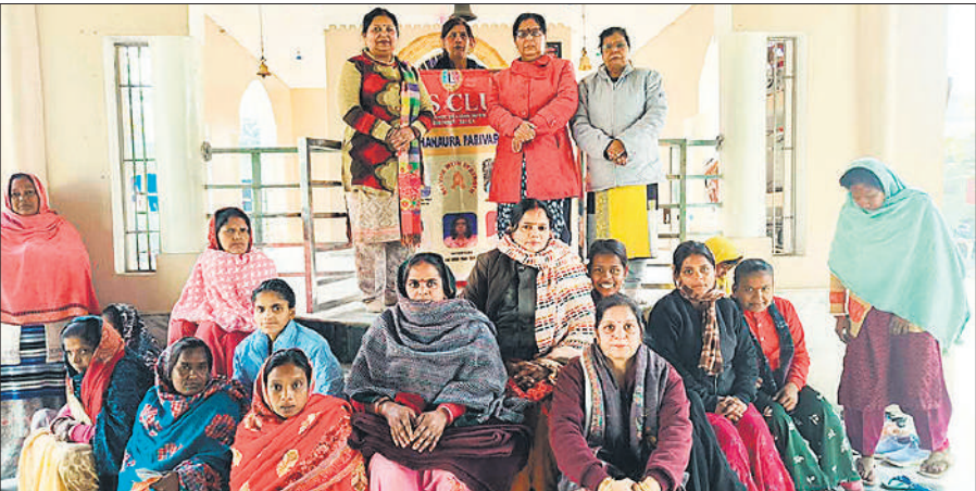
वृद्ध व कुष्ठ आश्रम मैमौजूद क्लब की सदस्य।