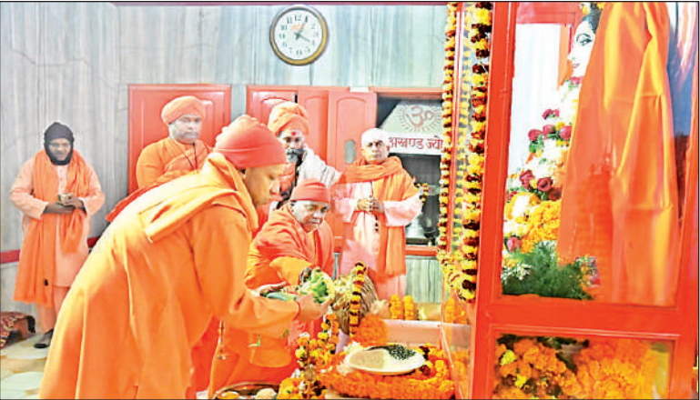
गोरखनाथ मंदिर में गुरु गोरखनाथ की प्रतिमा के समक्ष खिचड़ी का भोग अर्पित करते मुख्यमंत्री योगी।

अमृत विचार: मकर संक्रांति के पावन पर्व पर गोरखपुर स्थित गोरखनाथ मंदिर आस्था, परंपरा और लोकमंगल की विराट चेतना का साक्षी बना। गोरक्षपीठाधीश्वर एवं मुख्यमंत्री योगी आदित्यनाथ ने गुरुवार को ब्रह्म मुहूर्त में गर्भगृह में भूमि पर बैठकर, सीटी बजाकर गुरु गोरखनाथ को प्रणाम किया। विधिविधान से श्रीनाथ जी का पूजन कर गोरक्षपीठ की ओर से खिचड़ी का भोग अर्पित किया। योगी द्वारा भोग अर्पण के बाद मंदिर के कपाट आम श्रद्धालुओं के लिए खोल दिए गए। बाबा का खप्पर भरने श्रद्धा की अंजुरी में खिचड़ी लेकर लाखों श्रद्धालु उमड़ें। पूरे दिन