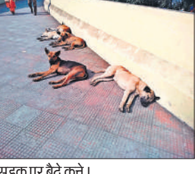
सड़क पर बैठे कुत्ते।