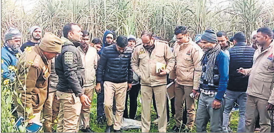
जांच पड़ताल करती पुलिस।