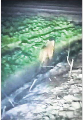
खेतों में चलकदमी करता तेंदुआ।

ग्रामीणों का कहना है कि तेंदुए की लगातार आवाजही के कारण लोग रात के समय घरों से बाहर निकलने से डर रहे हैं। खेतों में काम करने वाले किसान भी अशंकित हैं। ग्रामीणों ने वन विभाग से पिंजरा लगाने की मांग की है। उनका कहना है कि यदि समय रहते ठोस कदम नहीं उठाए गए तो कोई बड़ा