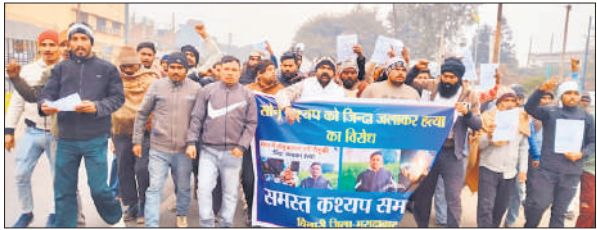
आरोपियों पर कार्रवाई को लेकर विरोध जताते कश्यप समाज के लोग।