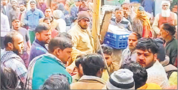
बबराला में आपस में भिड़ते दोनों पक्षों के लोग।