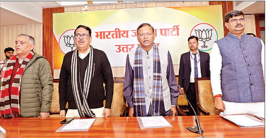
प्रदेश भाजपा मुख्यालय में मोर्चा और प्रकोष्ठों की बैठक के दौरान प्रदेश अध्यक्ष पंकज चौधरी, साथ में अन्य।

उन्होंने प्रधानमंत्री नरेंद्र मोदी के नेतृत्व में केंद्र सरकार की उपलब्धियों का उल्लेख करते हुए कहा कि गरीब, किसान, युवा और महिलाओं के