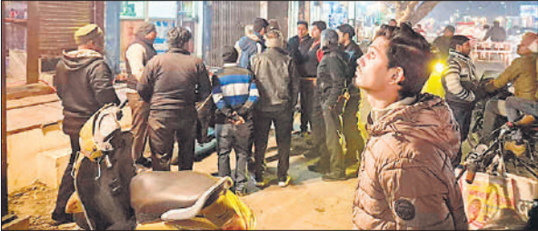
घटना के बाद एकत्रित भीड़।