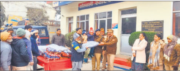
स्वार थाने में कंबल वितरित करते अधिकारी।

रामपुर, अमृत विचार : थाना स्वार उपजिलाधिकारी स्वार, क्षेत्राधिकारी स्वार, प्रभारी निरीक्षक थाना स्वार एवं थाना स्टाफ के संयुक्त तत्वावधान में जरूरतमंद व्यक्तियों को गरम कंबलों का वितरण किया। अधिकारियों एवं पुलिसकर्मियों द्वारा स्वयं आगे बढ़कर टंड से प्रभावित गरीब एवं निराश्रित लोगों की सहायता की गई।