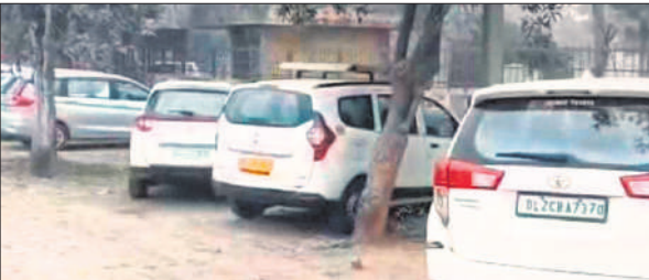
प्लांट में खड़ी इनकम टैक्स टीम की गाड़ियां।