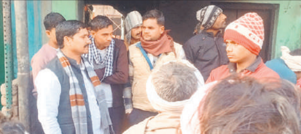
गांव बिसारु में युवक की मौत के बाद मौके पर इकट्ठा लोग।