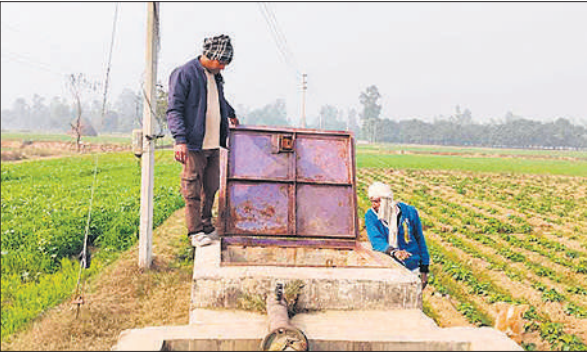
चोरी की जानकारी देते पीड़ित किसान।