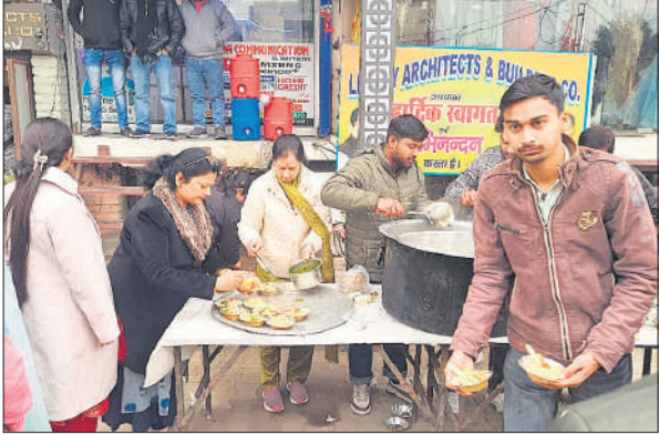
शहर में लगे स्टॉल पर लोगों को खिचड़ी वितरित की गई।