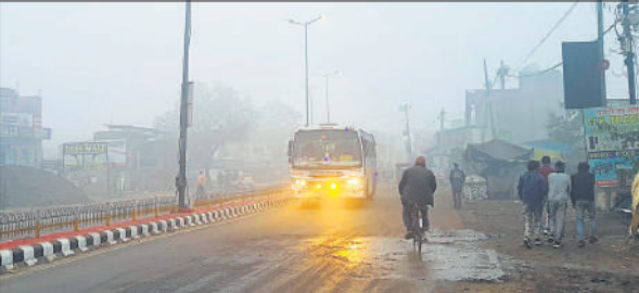
घने कोहरे के बीच फॉग लाइट जलाकर गुजरते वाहन।

सुबह से दोपहर तक कोहरा छाप रहने और शीतलहर चलने से लोग सर्दी से ठिठुर गए। सड़कों पर कोहरा होने के कारण सड़कों पर वाहन लाइटें जलाकर रेंगते रहे। पहाड़ों पर हो रही बर्फबारी ने मैदानी इलाकों में गलन बढ़ा दी है। सुबह को लोग सर्दी से कंपकंपाते रहे, लोगों ने सर्दी बढ़ने पर लकड़ी एकत्र कर अलाव जलाए और हाथ सेंके। कोहरे के बीच किला गेट और शहर की जामा मस्जिद के पास