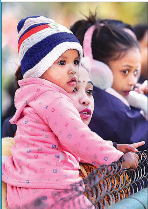
गुरुवार को मकर संक्रांति पर कार्यालयों में अवकाश होने के कारण चिड़ियाघर में बड़ी संख्या में दर्शक पहुंचे। इस दौरान बच्चे को बाड़े में जानवर को दिखाती महिला, अपने-अपने बाड़े में धूप का आनंद लेते बाघ, शेर और शेरनी।