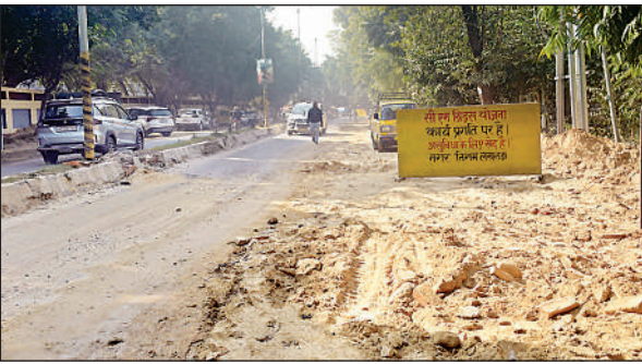
लामार्टिनियर गर्ल्स कॉलेज के पास खुदी पड़ी सड़क।