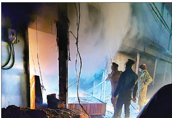
आग बुझाते दमकलकर्मी।