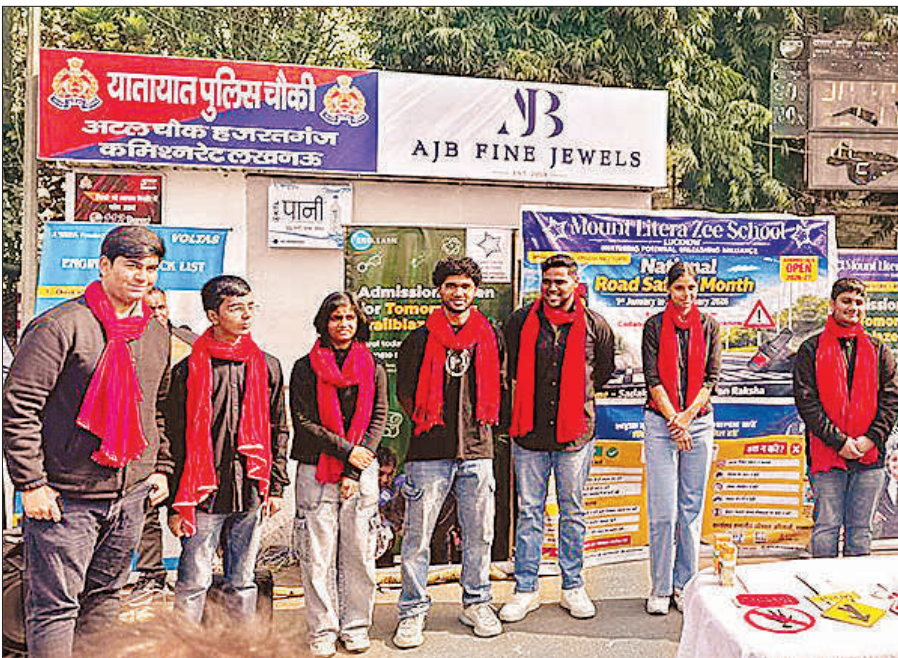
सड़क सुरक्षा को लेकर नुवकड़ नाटक प्रस्तुत करते छात्र-छात्राएं।