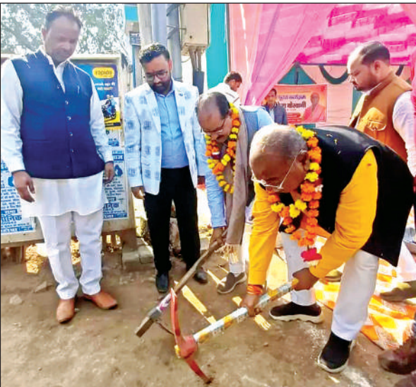
भूमि पूजन के बाद सड़क पर गैती चलाते सदर विधायक।

● बजट में विद्युत और जल निगम से संबंधित कार्य भी शामिल किए गए