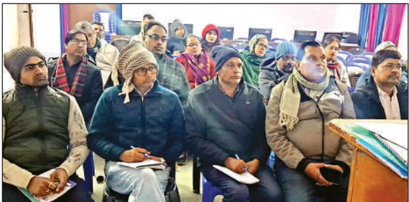
बीआरसी सदर सभागार में प्रशिक्षण लेते जिलास्तरीय संदर्भदाता। अमृत विचार

स्कूल खुलते ही भारी कोहरा, लौटी सर्दी ■ कन्नौज। जिले के कक्षा एक से आठ तक के परिषदीय व मान्यता प्राप्त निजी स्कूल बच्चों के लिए शुक्रवार से खुल गए। 15 जनवरी तक बच्चों के लिए मौसम बेहतर रहा। धूप निकल रही थी और कोहरा गायब था लेकिन 16 दिन के शीतकालीन अवकाश के बाद जब विद्यालयों में कक्षाएं शुरू हुईं तो उसी दिन घना कोहरा रहा। सूर्यदेव के दर्शन देर से हुए। बर्फाली हवाएं चलती रहीं जिससे धूप का असर ज्यादा नहीं हो सका। लोगों का कहना है कि लगता है कि सर्दी फिर से लौट आई है। दूसरी ओर प्राथमिक, जूनियर व कंपोजिट विद्यालयों में शैक्षिक गतिविधियां फिर से शुरू हो गई हैं। निपुण की तैयारी भी चलने लगी है।