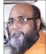
विशुद्ध चेतन्य लेखक

जैसे-जैसे मनुष्य की आयु बढ़ती जाती है, वैसे-वैसे उसका अनुभव और ज्ञान भी परिपक्व होता जाता है। जीवन की घटनाएं, समाज की वास्तविकताएं और सत्ता के व्यवहार धीरे-धीरे उसके भीतर