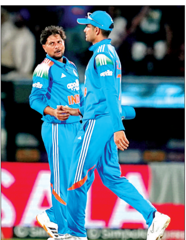
कप्तान शुभमन गिल के साथ कुलदीप यादव।