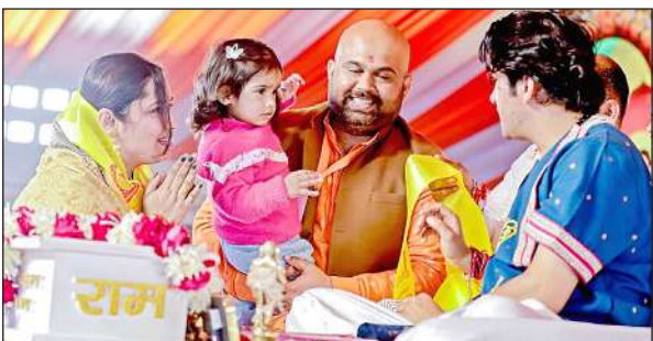
बच्चे को दुलारते बागेश्वर धाम पीठाधीश्वर पं. धीरेंद्र कृष्ण शास्त्री।