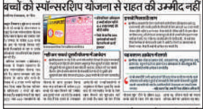
अमृत विचार समाचार पत्र में 16 जनवरी को प्रकाशित खबर।