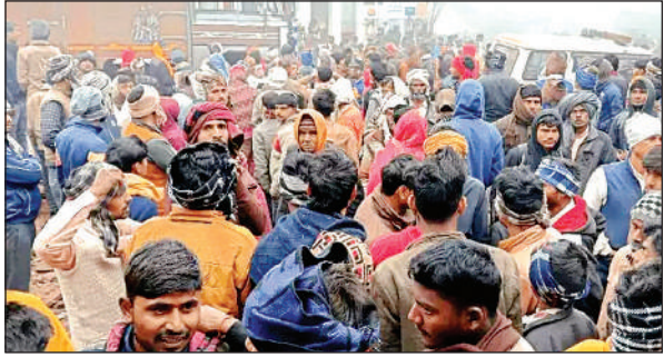
मौके पर लगी भीड़ व खड़ा ट्रक ।