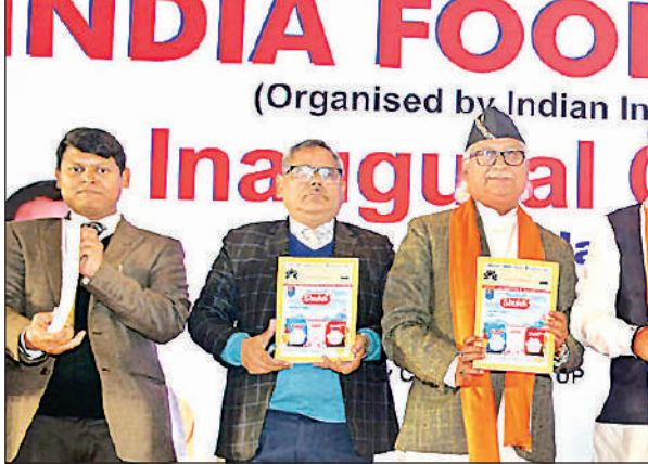
लखनऊ : इंडिया फूड एक्सपो के मंच पर डायरेक्टरी का विमोचन करते उप मुख्यमंत्री केशव प्रसाद मौर्या, विधायक नीरज बोरा, आईआईई अध्यक्ष दिनेश गोयल व अन्य। अमृत विचार

यह केंद्र युवाओं, उद्यमियों और निवेशकों के लिए वन-स्टॉप सपोर्ट सिस्टम के रूप में विकसित होगा। मुख्यमंत्री ने कहा कि इस परियोजना को ओडीओपी, एमएसएमई और कौशल विकास योजनाओं के साथ समन्वय बनाकर लागू किया जाए, ताकि स्थानीय उत्पादों, उद्योगों और युवाओं को