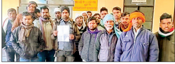
एसडीएम से शिकायत करने पहुंचे ग्रामीण ।