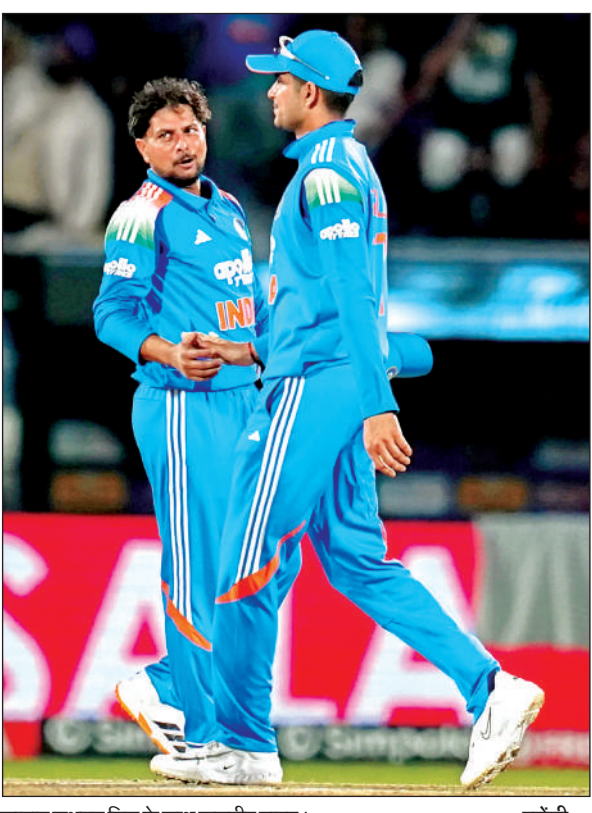
कप्तान शुभमन गिल के साथ कुलदीप यादव।