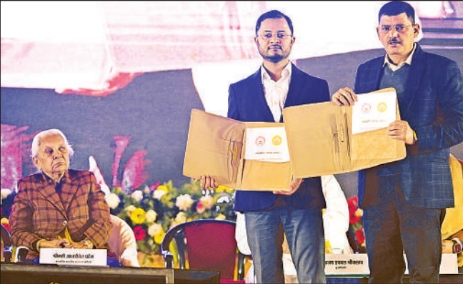
एमओयू का आदान प्रदान करते अवध विश्वविद्यालय व रामायण विश्वविद्यालय के कुलसचिव ।