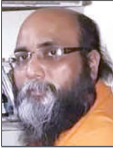
विशुद्ध चेतन्य लेखक

जैसे-जैसे मनुष्य की आयु बढ़ती जाती है, वैसे-वैसे उसका अनुभव और ज्ञान भी परिपक्व होता जाता है। जीवन की घटनाएं, समाज की वास्तविकताएं और सत्ता के व्यवहार धीरे-धीरे उसके भीतर