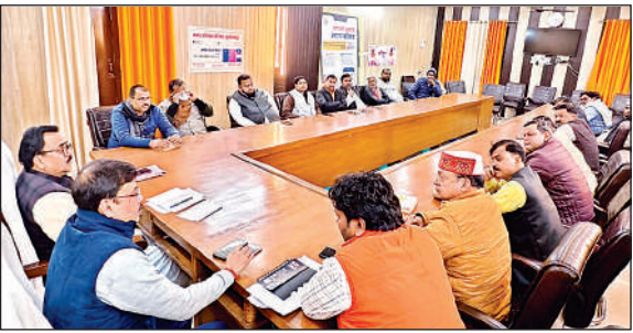
नगर पालिका अध्यक्ष ने सभासदों व अधिकारियों के साथ की बैठक।