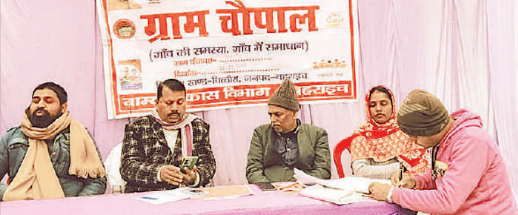
चौपाल में मौजूद बीडीओ व देहात संस्था के लोग।