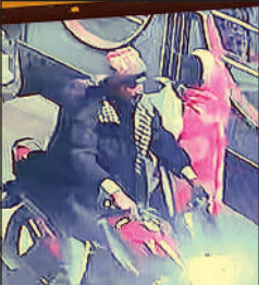
सीसीटीवी फुटेज में दिखे बाइक चोर।