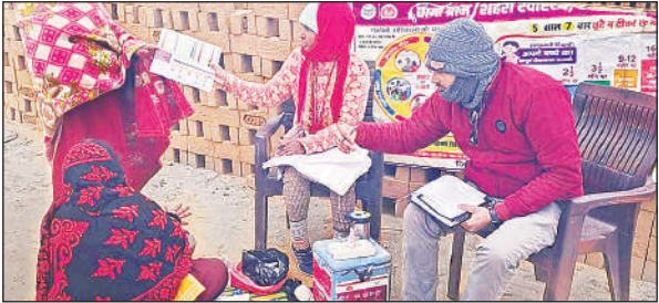
ईंट-भट्टे पर महिला मजदूरों व बच्चों को टीका लगाने स्वास्थ्य कर्मचारी।