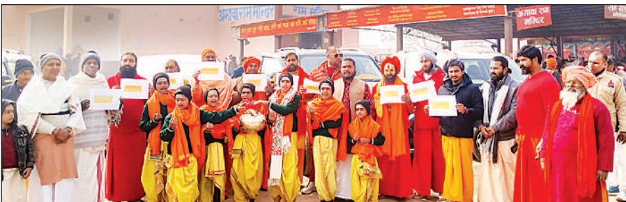
वेद मंत्रोच्चार के बीच कैथोलिया के लिए रवाना होता साधु-संतों का दल ।

• पांच जोन 15 सेक्टर में बांटा मेला क्षेत्र • सिंचाई विभाग के गेट्स हाउस में बना मेला कंट्रोल रूम उन्होंने कहा कि अयोध्या महानगर शिक्षा और चिकित्सा की दृष्टि कोण से विकसित हो रहा है। यही सबसे बड़ी पहचान होती है कि रहने वाले लोगों को चिकित्सा के लिए शिक्षा के लिए बाहर न जाना पड़े। मोदी व योगी सरकार के कुशल नेतृत्व में अयोध्या नए आयाम के साथ उभर कर सामने आएगी। यहां अवसरों संभावनाओं का नगर बनकर खड़ा है।