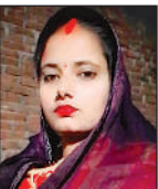
पूजा फाइल फोटो।

अमृत विचार : थाना क्षेत्र के कोल्हमपुर चौकी अंतर्गत रामापुर गांव के टपरा मजरे में शुक्रवार सुबह उस समय हड़कंप मच गया, जब एक गन्ने के खेत में नवविवाहिता का शव पड़ा मिला। सूचना मिलते ही मौके पर ग्रामीणों की भारी भीड़ जुट