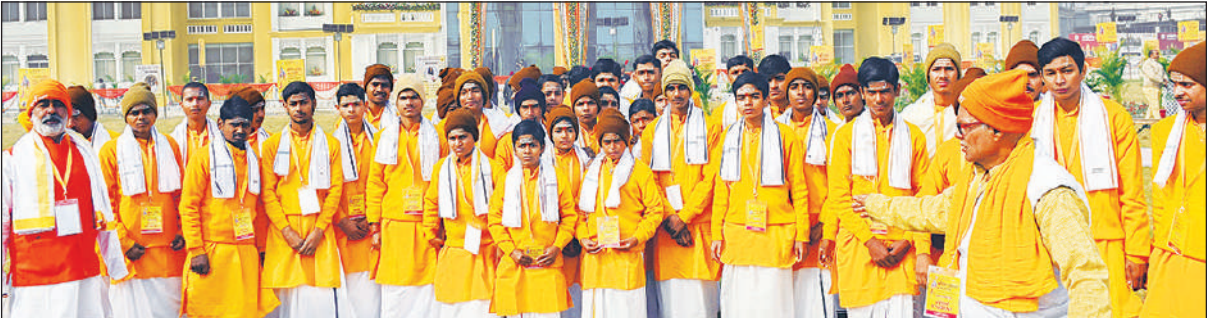
महर्षि महेश योगी रामायण विश्वविद्यालय परिसर में अनावरण के बाद मौजूद बाटुक ।

अमृत विचार : आज का भारत अवसरों की प्रतीक्षा नहीं करता, स्वयं उनका सृजन करता है। बीते 11 वर्षों में देश में अवसरों और आत्मविश्वास का नया युग आया है। ये बातें शुक्रवार को राज्यपाल आनंदीबेन पटेल ने कहीं। वह महर्षि महेश योगी रामायण विश्वविद्यालय परिसर में प्रशासनिक भवन के मुख्य प्रवेश द्वार पर स्थापित 35 फीट ऊंची भगवान श्रीराम की भव्य प्रतिमा का बतौर मुख्य अतिथि अनावरण करने के बाद भारतीय ज्ञान परंपरा पर आधारित आधुनिक शिक्षा विषय पर आयोजित कार्यक्रम को संबोधित कर रही थीं। उन्होंने कहा कि महर्षि जी की दूरदर्शिता का परिणाम है 500 करोड़ रुपये से अधिक की लागत से तैयार हो रहा यह विश्वविद्यालय। जो केवल उपाधियां प्रदान करने के लिए आधुनिक शिक्षा के साथ यह विश्व विद्यालय राष्ट्रीय शिक्षा नीति 2020 के तहत कार्य कर रहा है। यह केवल नगरी नहीं बल्कि रामराज्य के अंदा का प्रतीक है। राज्यपाल ने कहा कि अयोध्या क्षेत्र में भगवान श्रीराम की इतनी ऊंची प्रतिमा कहीं और नहीं है। जो विश्वविद्यालय की पहचान का प्रतीक बन गई है। जो परंपरा और आधुनिकता दोनों