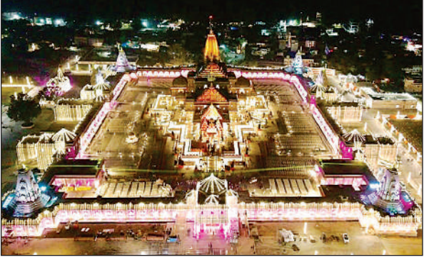
भव्य राम मंदिर परिसर की तस्वीर ।

अमृत विचार: राम जन्मभूमि के संपूर्ण परिसर के विकास का कार्य पूर्ण हो चुका है। ट्रस्ट माह फरवरी से संपूर्ण दर्शन के लिए हर दिन 5000 भक्तों को पास जारी करेगा। जो सुरक्षा कोड युक्त होंगे। जिसके बाद ही परिसर के अलग-अलग स्थान पर जाने की अनुमति होगी। इसके पूर्व मंदिर परिसर के निर्माण संस्था एलएंडटी व टाटा कंसलटेंसी के अधिकारी सभी निर्माण को श्री राम जन्मभूमि तीर्थ क्षेत्र ट्रस्ट को हंडोवर करेंगे। श्रीराम मंदिर में आने वाले श्रद्धालुओं को भूतल में विराजमान