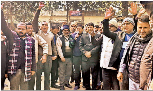
साथी अधिवक्ता के समर्थन में प्रदर्शन करते वकील।

शुक्रवार को वकीलों ने इसी घटना के विरोध में एसपी ऑफिस का घेराव कर दिया। काफी देर तक हुए हंगामा के बाद आरोपियों के चालान के बाद धरना समाप्त हो गया।