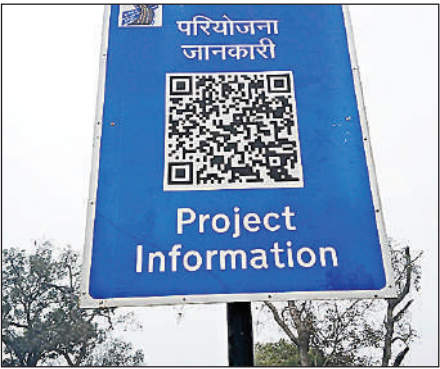
टांडा-बांदा हाईवे पर सेमरी मोड़ पर लगा स्कैन एंड गो स्कैनर।

● हाईवे पर सफर होगा और आसान, रुक कर नहीं लेनी होगी जानकारी