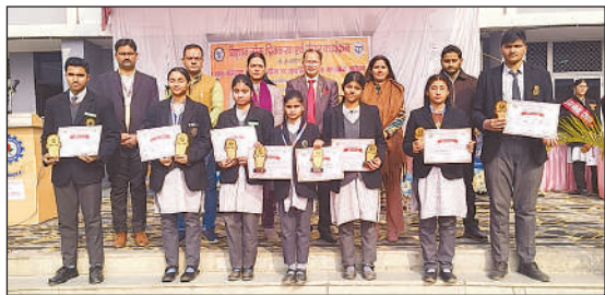
जिला विज्ञान क्लब की ओर से आयोजित किया गया जागरूकता कार्यक्रम।