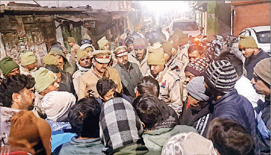
गुरुवार की देर रात नगर के बड़े पुल चौराहे पर धरना देते अधिवक्ताओं को समझाती पुलिस।

पीछित अधिवक्ता परिवार के साथ खिचड़ी भोज में जा रहे थे। चौराहे पर रास्ता रोके खड़े युवकों से हटने को कहना विवाद का