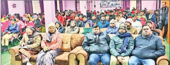
सेमिनार में मौजूद विद्यार्थी, प्रवक्ता व अन्य।