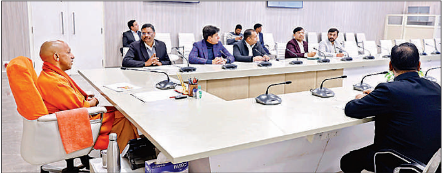
अपने सरकारी आवास पर शीर्ष अधिकारियों के साथ बैठक के दौरान उपस्थित मुख्यमंत्री योगी आदित्यनाथ।

मुख्यमंत्री ने कहा कि यह मॉडल जमीनी स्तर पर युवाओं को अवसर देने, स्थानीय प्रतिभाओं को उद्योग से जोड़ने और जिला स्तर पर आत्मनिर्भर आर्थिक ढांचा विकसित करने का सशक्त माध्यम बनेगा। उन्होंने सभी जिलों में इस परियोजना के लिए आवश्यक भूमि चिन्हित करने के निर्देश दिए। बैठक में बताया गया कि रोजगार एवं कौशल विकास केंद्र में ओडीओपी उत्पादों के लिए डिस्सेल जोन बनेगा। प्रशिक्षण और सेमिनार हॉल, मीटिंग व कॉन्फ्रेंस सुविधाएं, जिला उद्योग केंद्र, उत्तर प्रदेश कौशल विकास मिशन, जिला रोजगार कार्यालय, कॉमन सर्विस सेंटर और बैंकिंग सुविधाएं उपलब्ध कराई जाएंगी।