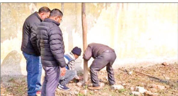
बीएसए कार्यालय परिसर में जमीन की पैमाइश करती टीम।

बीएसए कार्यालय परिसर में काफी जमीन खाली पड़ी है। सरकारी जमीन पर अवैध कब्जे की कोशिश की गई। बताते हैं कि चौदह जनवरी को पेट्रोल पंप