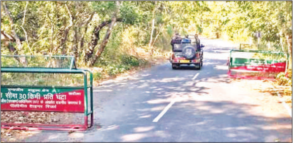
माधोटांडा–खटीमा जंगल मार्ग पर लगा बैरियर ।

बरेली, अमृत विचार : सुबह और शाम की हाइ कंपाने वाली ठंड से जहां लोग बेहाल हैं, वहीं, परिवहन इससे मालामाल हो रहा है। कड़ाके की ठंड में लोग रोडवेज की जनरथ और वॉल्को बसों को ज्यादा तरजीह दे रहे हैं। खासकर रात के समय में यात्री इन्हें सुरक्षित मान रहे हैं। इससे एसी ( वातानुकूलित) बसों की आमदनी भी बढ़ गई है। परिवहन निगम के अधिकारी भी इस बात को स्वीकार कर रहे हैं कि साधारण बसों की तुलना में इन दिनों एसी बसों में लोग सफर करना ज्यादा पसंद कर रहे हैं। लिहाजा अपने निर्धारित समय से पहले ही यह बसें भर जा रही हैं। वर्तमान में बरेली और रुहेलखंड डिपो के बेड़े में छोटी-बड़ी करीब 80 एसी बसें शामिल हैं। पुराना बस अड्डे से आगरा, मथुरा, अलीगढ़, हल्द्वानी, मेरठ के लिए एसी बसें चल रही हैं।