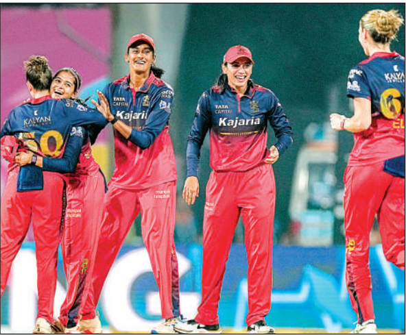
जीत का जश्न मनाती रॉयल चैलेंजर्स बेंगलुरु की खिलाड़ी।