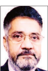
राजेश श्रीनेत वरिष्ठ प्रकार

भारत में विज्ञान और वैज्ञानिक सोच को दिशा देने वाली प्रमुख संस्था इंडियन नेशनल साइंस एकेडमी (आईएनएसए) ने इसी महीने 7 तारीख को अपना 91 वां स्थापना दिवस मनाया। दिल्ली में आयोजित यह कार्यक्रम केवल एक संस्थान के स्थापना दिवस तक सीमित नहीं था। यह भारत की वैज्ञानिक यात्रा, उपलब्धियों और भविष्य की चुनौतियों पर विचार करने का एक महत्वपूर्ण मंच भी बना। नौ दशकों से अधिक समय से आईएनएसए देश में विज्ञान, अनुसंधान और तार्किक सोच को बढ़ावा देने में अहम भूमिका निभा रही है। नस संस्था ने न केवल भारतीय वैज्ञानिकों को एक सशक्त मंच दिया है, बल्कि सरकार और समाज के बीच विज्ञान को जोड़ने का काम भी किया है।