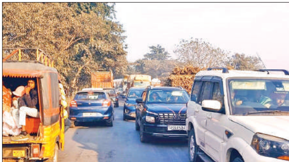
पीलीभीत-जहानाबाद मार्ग पर जाम में फंसे वाहन।

अब पीलीभीत-जहानाबाद मार्ग पर अप्सरा पुल पर ट्रक के खराब होने से लगा जाम