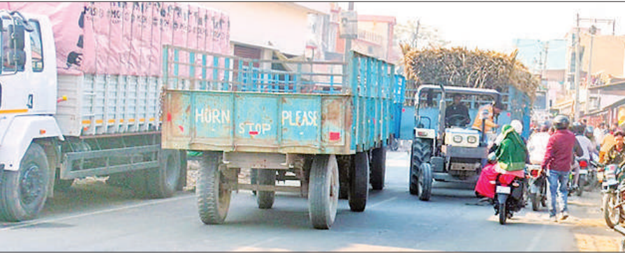
सड़क पर आपस में भिड़ी ट्रॉलियों से लगा जाम।

अमृत विचार: मझगई कस्बे में सड़क किनारे फैला अतिक्रमण अब हादसों की वजह बनता जा रहा है। संकरे होते मार्गों के कारण आए दिन दुर्घटनाएं हो रही हैं, लेकिन जिम्मेदार विभाग इस गंभीर समस्या पर आंख मूंदे बैठे हैं। शुक्रवार को गन्ने से भरी दो ट्रैक्टर-ट्रॉलियों में टक्कर हो गई। इससे सड़क पर गन्ना गिर गया। हादसे से लगे जाम में लोग घंटों परेशान रहे। स्थानीय लोगों में प्रशासन की उदासीनता को लेकर भारी नाराजगी है। शुक्रवार को पलिया की ओर से आ रहे एक ट्रैक्टर में गन्ने से भरी दो ट्रॉलियां जुड़ी थीं, जबकि निघासन की दिशा से आ रहे ट्रैक्टर में दो खाली ट्रॉलियां लगी थीं। कस्बे के अत्यंत संकरे मार्ग पर आमने-सामने से क्रॉसिंग के दौरान दोनों ट्रॉलियों की साइड आपस में भिड़ गई। टक्कर इतनी जोरदार थी कि गन्ने से भरी ट्रॉली से बड़ी मात्रा में गन्ना सड़क पर बिखर गया। इससे मौके