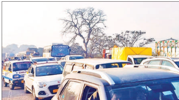
जाम के बीच अन्य वाहनों के साथ फंसी एंबुलेंस।

रहा। जिससे राहगीर खूब परेशान हुए। मार्ग से गुजर रही पुलिस ने बमर्शिकल बाद में जाम खुलवाया। पीलीभीत से जहानाबाद रोड पर अप्सरा नदी पुल है। बरेली-हरिद्वार नेशनल हाईवे का हिस्सा होने के चलते इस मार्ग पर उत्तराखंड के लिए भी बड़े वाहनों की आवाजाही रहती है। कई बार इस पुल पर जाम लगता रहता है। इसका समाधान नहीं हो सका है। बताते हैं कि पुल के पास मार्ग पर एक ट्रक खराब हो गया। उसके बाद शुक्रवार दोपहर करीब ढाई बजे वाहनों का लोड बढ़ा तो पुल पर दो वाहन आमने सामने आ गए। बताते हैं कि दोनों से अधिक समय तक जाम लगा