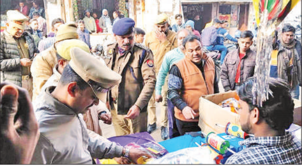
गोला में मिल रोड पर पतंग की दुकान पर निरीक्षण करते सीओ और नायब तहसीलदार।