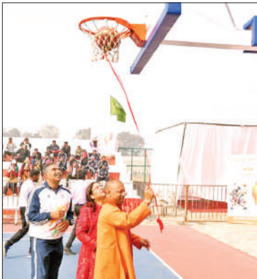
प्रतियोगिता का उद्घाटन करते मुख्यमंत्री योगी।

कहा- प्रत्येक विश्वविद्यालय किसी एक खेल को लें गोद, ताकि नशे से दूर और अनुशासित रहे युवा वर्ग