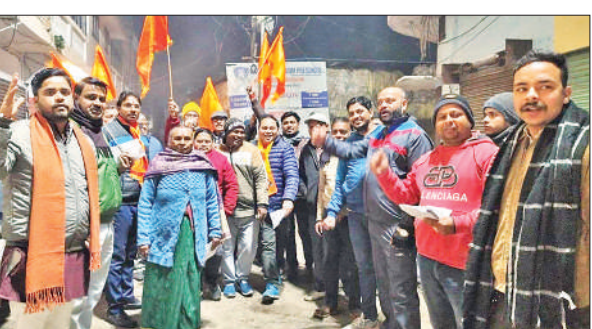
संध्या फेरी में शामिल कार्यकर्ता।