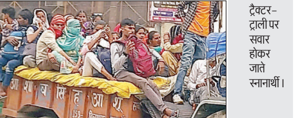
ट्रैक्टर-ट्राली पर सवार होकर जाते स्नानार्थी।

कुल 50 बसें आवंटित की गई हैं, ताकि यात्रियों को सुरक्षित और सुगम यात्रा की सुविधा मिल सके। इन बसों के माध्यम से श्रद्धालुओं को सीधे माघ मेला क्षेत्र तक पहुंचाया जा रहा है। [जानकारी के अनुसार, आवंटित की गई बसों में से 40 बसों को शनिवार की शाम तक प्रयागराज के लिए रवाना कर दिया गया था। शेष बची 10 बसों को भी रात के समय भेजे जाने की तैयारी की गई है। इससे देर रात और तड़के यात्रा करने वाले श्रद्धालुओं को भी किसी प्रकार की असुविधा न हो।