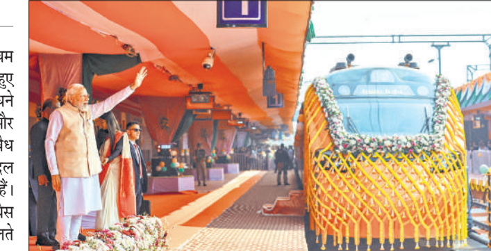
पश्चिम बंगाल के मालदा में हावड़ा और गुवाहाटी (कामाख्या) के बीच चलने वाली देश की पहली वंदे भारत स्लीपर ट्रेन को हरी झंडी दिखाते प्रधानमंत्री नरेंद्र मोदी।

मोदी ने मुस्लिम बहुल जिले मालदा में रैली को संबोधित करते हुए कहा कि घुसपैठ पश्चिम बंगाल के सामने एक बहुत बड़ी चुनौती है। उन्होंने कहा कि भाजपा सत्ता में आने पर पश्चिम बंगाल में घुसपैठियों पर नकेल कसने और अवैध प्रवासन को रोकने के लिए ठोस कदम उठाएगी। उन्होंने कहा, दुनिया में ऐसे विकसित और समृद्ध देश हैं जिनके पास धन की कोई कमी नहीं है, फिर भी वे घुसपैठियों को बाहर निकाल रहे हैं। पश्चिम बंगाल से घुसपैठियों को निकालना