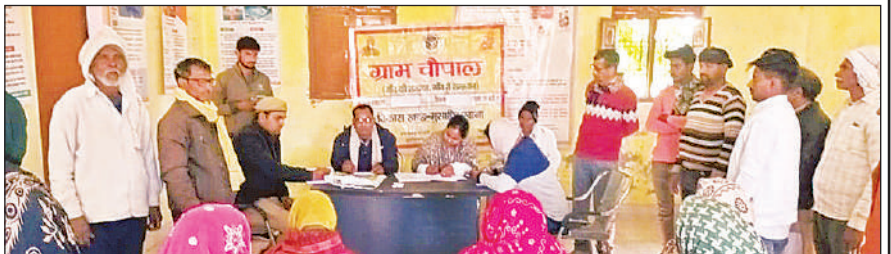
ग्रीन चौपाल में उपस्थित एडीओ व ग्रामीण।