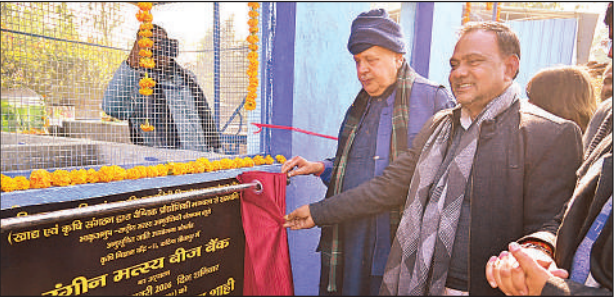
‘ऑर्नामेंटल फिश बैंक’ का शुभारंभ करते कृषि मंत्री सूर्य प्रताप शाही।

अमृत विचार: प्रदेश के कृषि एवं कृषि शिक्षा मंत्री सूर्य प्रताप शाही ने जनपद के विभिन्न क्षेत्रों का भ्रमण कर कई महत्वपूर्ण परियोजनाओं का लोकार्पण और निरीक्षण किया। इस दौरान उन्होंने किसानों की आय दोगुनी करने और महिलाओं को स्वावलंबी बनाने के संकल्प को दोहराया। कृषि मंत्री ने केवीके कटिया में मिशन नवशक्ति के तहत ‘ऑर्नामेंटल फिश बैंक’ का शुभारंभ किया। बताया कि परियोजना के जरिए 570 महिलाओं को सूक्ष्म-उद्यमी के रूप में तैयार किया गया है, जिसे वैश्विक स्तर पर एफएओ द्वारा भी सराहा गया है। वहीं, सरैया सानी में ओजोन फॉर्म