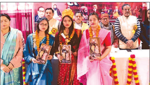
हिंदू सम्मेलन के मंच पर मौजूद लोग।