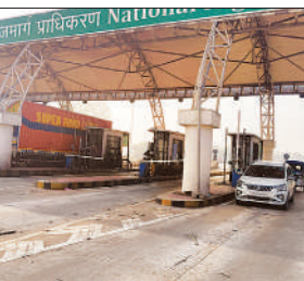
टोल प्लाजा से गुजरते वाहन।