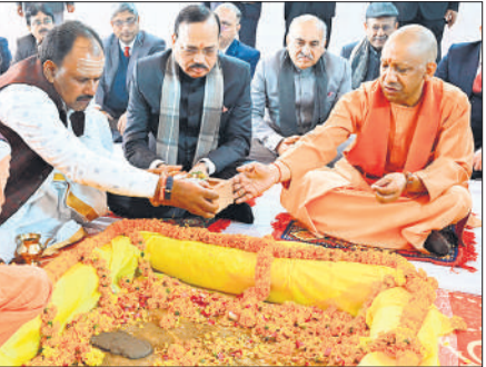
चंदौली में एकीकृत न्यायालय परिसर के शिलान्यास अवसर पर भूमि पूजन करते सीजेआई सूर्यकांत और मुख्यमंत्री योगी।

सीजेआई ने कहा कि यूपी का एकीकृत कोर्ट मॉडल आम आदमी के संवैधानिक सपनों को