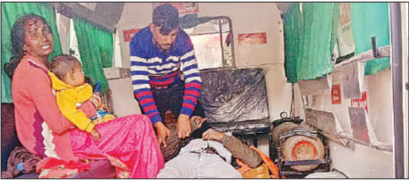
सड़क हादसे में घायल लोगों को ले जाती एंबुलेंस।