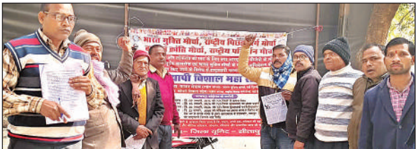
धरना स्थल प्रदर्शन करते आंदोलनकारी।

से 30 दिसंबर 2025 तक होने वाले इस अधिवेशन की सभी कानूनी प्रक्रियाएं दो महीने पहले ही पूरी कर ली गई थीं। इसके बावजूद, राजनीतिक दबाव में आकर ऐन वक्त पर अनुमति निरस्त की गई। प्रमुख मांगें प्रदर्शनकारियों ने मांग की है कि रद्द किए गए अधिवेशन की अनुमति तत्काल बहाल की जाए, संगठनों को हुए आर्थिक नुकसान का मुआवजा दिया जाए और ओडिशा सरकार को बर्खास्त किया जाए। संगठनों ने वेतावनी दी है कि यदि मांगें नहीं मानी गईं, तो आंदोलन को और अधिक व्यापक बनाया जाएगा।