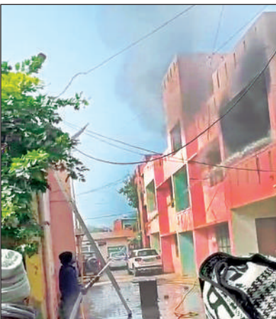
सीएचसी में आग बुझाते दमकल कर्मी।

स्नान के लिए शुक्रवार से ही पहुंचने लगे श्रद्धालु हरदोई, अमृत विचार। मौनी अमावस्या का स्नान करने के लिए श्रद्धालु शुक्रवार से ही राजघाट, बेरियाघाट, मेहेंदीघाट के लिए पहुंचने लगे। गांवों से ट्रैक्टर ट्रालियों पर सवार होकर श्रद्धालु विभिन्न पवित्र घाटों के लिए निकले। मौनी अमावस्या पर श्रद्धालुओं को असुविधा न हो, इसके लिए जिला प्रशासन व पुलिस ने सारी तैयारियां कर लीं। अधिकारियों ने घाटों का निरीक्षण किया तथा श्रद्धालुओं के लिए सभी व्यवस्थाएं रखने के निर्देश दिए। हालांकि इस बार सर्द मौसम के चलते श्रद्धालुओं की संख्या कुछ कम है, लेकिन फिर भी पवित्र त्योहार पर स्नान के लिए घाटों पर बसे कल्पवास में श्रद्धालुओं का जाना शुक्रवार से ही जाना शुरू हो गया।