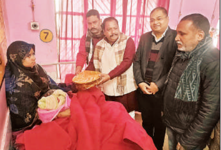
अस्पताल में मरीजों को फल वितरित करते समर्थक।

पिहानी संवाददाता के अनुसार शनिवार को गोपामऊ विधानसभा के विधायक के जन्मदिवस के अवसर पर सामुदायिक स्वास्थ्य केन्द्र पिहानी में सेवा एवं मानवता से जुड़ा कार्यक्रम आयोजित किया गया। इस अवसर