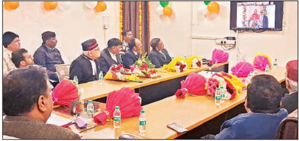
शिलान्यास कार्यक्रम का लाइव प्रसारण देखते जिले के अधिकारी।

शिलान्यास कार्यक्रम को संबोधित करते हुए मुख्यमंत्री योगी आदित्यनाथ ने कहा कि लोकतंत्र की मजबूती के लिए सशक्त न्यायपालिका और बेहतर इंफ्रास्ट्रक्चर अनिवार्य है। उन्होंने बताया कि अमेठी सहित प्रदेश के