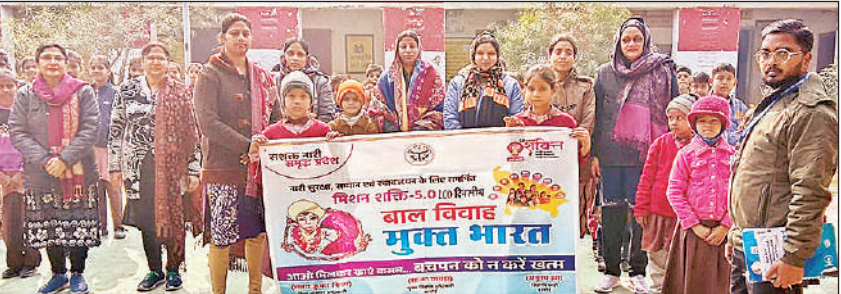
जागरूकता अभियान में प्रतिभाग करती महिलाएं।