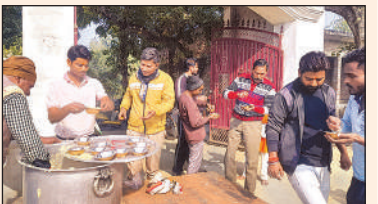
भंडारे में प्रसाद ग्रहण करते लोग।