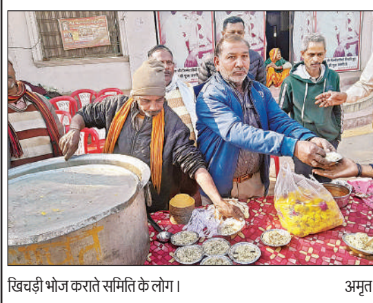
खिचड़ी भोज कराते समिति के लोग।