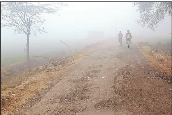
महराजगंज क्षेत्र में कोहरे की धुंध के बीच साइकिल से स्कूल जाते बच्चे।