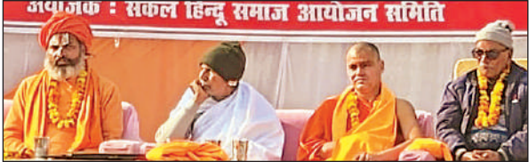
हिंदू सम्मेलन में उपस्थित अतिथि।

सीतापुर। जनपद में शनिवार को भी ठंड और कोहरे का दोहरा असर देखने को मिला। बर्फौली हवाओं के साथ आसमान से गिरती ओस की बूंदों ने जनजीवन की रफ्तार रोक दी। शनिवार सुबह न्यूनतम तापमान छह डिग्री सेल्सियस दर्ज किया गया, जबकि दृश्यता घटकर महज 15 मीटर रह गई। मौसम विभाग के वैज्ञानिक एके सिंह के अनुसार, आने वाले कुछ दिनों तक शीतलहर का प्रकोप जारी रहेगा और तापमान में और गिरावट हो सकती है। वहीं, घने कोहरे के कारण हाईवे पर वाहन हेडलाइट जलाकर रेंगते नजर आए। भीषण शीतलहर के बावजूद दूसरे दिन भी स्कूली बच्चों को सुबह घरों से निकलना पड़ा, ऐसे में अभिभावक चिंतित दिखे। लोग जगह-जगह अलाव जलाकर ठंड से बचने का प्रयास करते रहे। उधर, बढ़ते कोहरे ने प्रदूषण के स्तर को भी बढ़ा दिया है। जिले का एक्यूआई 318 पहुंच गई।