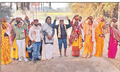
कलश यात्रा में मौजूद यजमान व अन्य लोग।