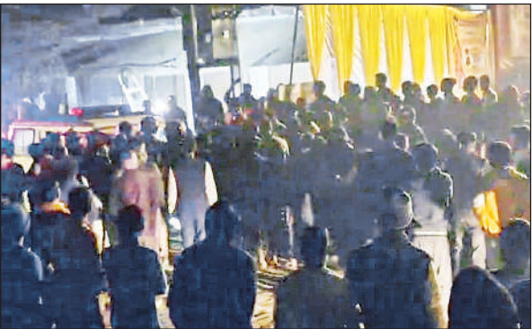
कादूनाला-थैरी मार्ग पर आक्रोशित ग्रामीणों को समझाते अधिकारी।