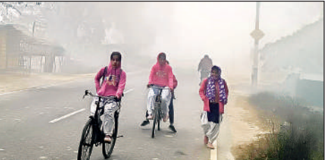
सीतापुर-बहराइच मार्ग पर घने कोहरे के बीच विद्यालय जाती छात्राएं।

की व्यवस्था कराई जाए, ताकि हादसों से बचा सके। इलाके में हो रहे खनन के मुद्दे पर दो अधिकारियों को डीएम की खरी – खरी का सामना करना पड़ा। बड़ी संख्या में शिकायत अवैध कब्जे की थी रहीं। कुल 400 से अधिक शिकायती पत्र लेकर फरियादी पहुंचे, दिव्यांग तत्पूब ने आरोग्य मंदिर बनाए जाने की मांग की। इस दौरान प्रशासनिक और पुलिस अधिकारी मौजूद रहे।