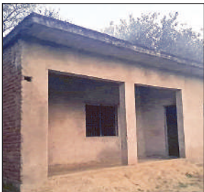
बदहाल पड़ा आंगनवाड़ी केंद्र।

क्षेत्र में चार आंगनवाड़ी केंद्रों के भवन निर्माण को वित्तीय वर्ष 2016-17 मंजूरी मिली थी। लगभग नौ वर्ष बाद भी निर्माण अब तक पूरा नहीं हो सका। महत्वपूर्ण बात यह है कि जिलाधिकारी द्वारा तीन बार