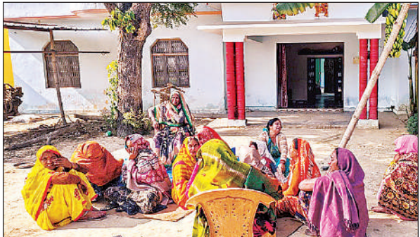
युवक की मौत के बाद रोते-बिलखते परिजन।

नोटिस जारी किए जाने के बावजूद निर्माण अधूरे पड़े हुए ग्राम पंचायत कूड़ा, कुंवरमऊ बड़ौना और आंगनवाड़ी भवन का निर्माण शुरू हुआ था लेकिन किन्हीं कारणों वश कुछ दिन बाद काम बंद हो गया। तकरीबन एक वर्ष पूर्व जिलाधिकारी