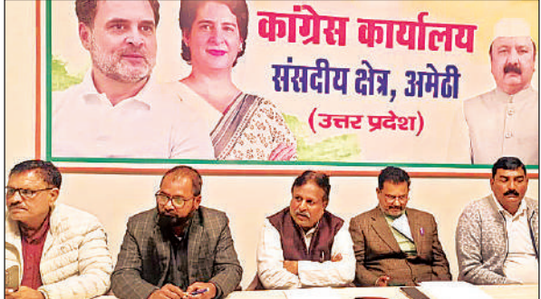
कांग्रेस कार्यालय में प्रेस कॉन्फ्रेंस करते पदाधिकारी।