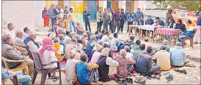
चौपाल में मौजूद अधिकारी व ग्रामीण।