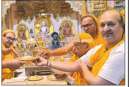
मंदिर में पूजन करते जैन धर्मावलंबी।