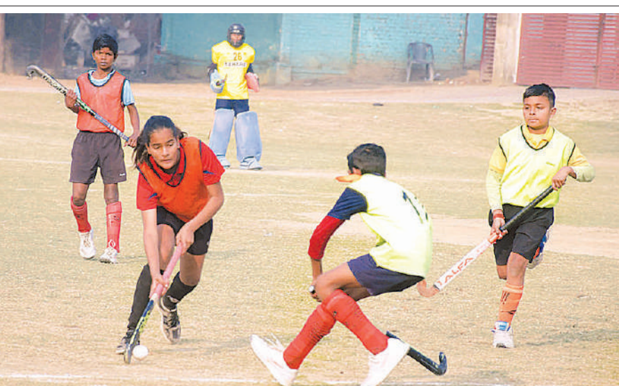
बॉल पर कब्जे के प्रयास में दोनों टीमों के खिलाड़ी।

टूर्नामेंट में खिलाड़ियों के उम्दा प्रदर्शन से दर्शकों में उत्साह का माहौल रहा और मैच रोमांचक साबित हुआ।