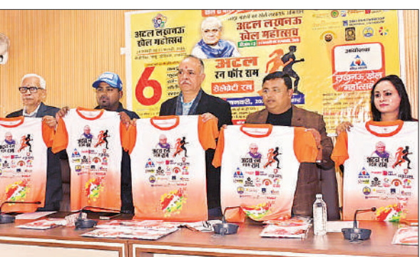
अटल रन की टीशर्ट का आभार पत्रप्राधिकारी।