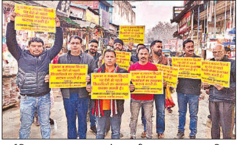
मार्च निकालकर जागरूक करते व्यापारी।