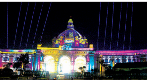
रागबिरी रोशनी से नहाया विधानभवन।

लोकसभा अध्यक्ष, राज्यसभा के उपसभापति, प्रदेश विधानसभा और विधान परिषद के शीर्ष पदाधिकारी, नेता प्रतिपक्ष सहित कई अतिथियों के शामिल होने की संभावना है। प्रतिभागियों का आगमन 18 जनवरी से शुरू होगा, मुख्य कार्यक्रम 21 को संपन्न होगा। 22 जनवरी को धार्मिक स्थलों का भ्रमण और 23 को प्रस्थान प्रस्तावित है।सम्मेलन क्षेत्र में 24 घंटे सीसीटीवी निगरानी की जा रही है। सोशल मीडिया पर भी सतत निगरानी रहेगी। विशेष ट्रैफिक प्लान और डायवर्जन भी किया गया है। पुलिस ने आम