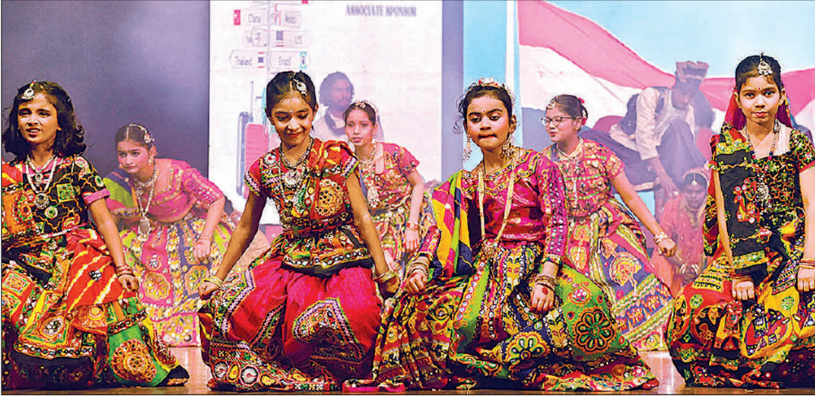
संगीत नाटक अकादमी में सांस्कृतिक कार्यक्रम प्रस्तुत करते लिरिक्स अकादमी ऑफ म्यूजिक के बच्चे।