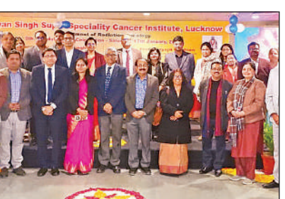
कार्यक्रम में मौजूद चिकित्सक।