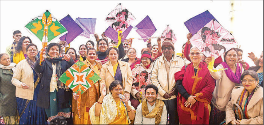
अहिमर्दन पातालपुरी मंदिर परिसर में लोक चौपाल में बसंत गीत पर पतंगों के साथ झूमते लोग।