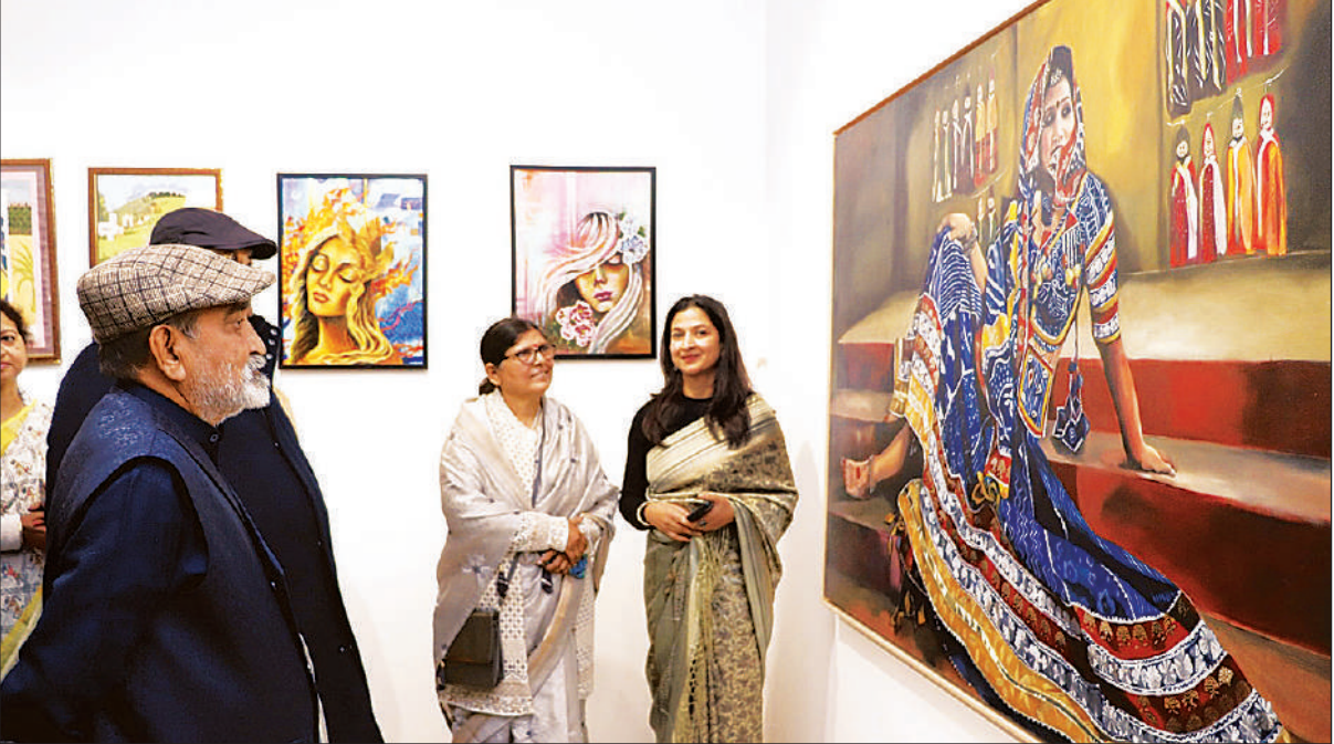
अलीगंज स्थित कला स्रोत आर्ट गैलरी में रंग-वर्णिका कला प्रदर्शनी में कलाकृति देखते लोग।

आए कलाकारों के रंगों, भावों और विचारों का साझा मंच है।