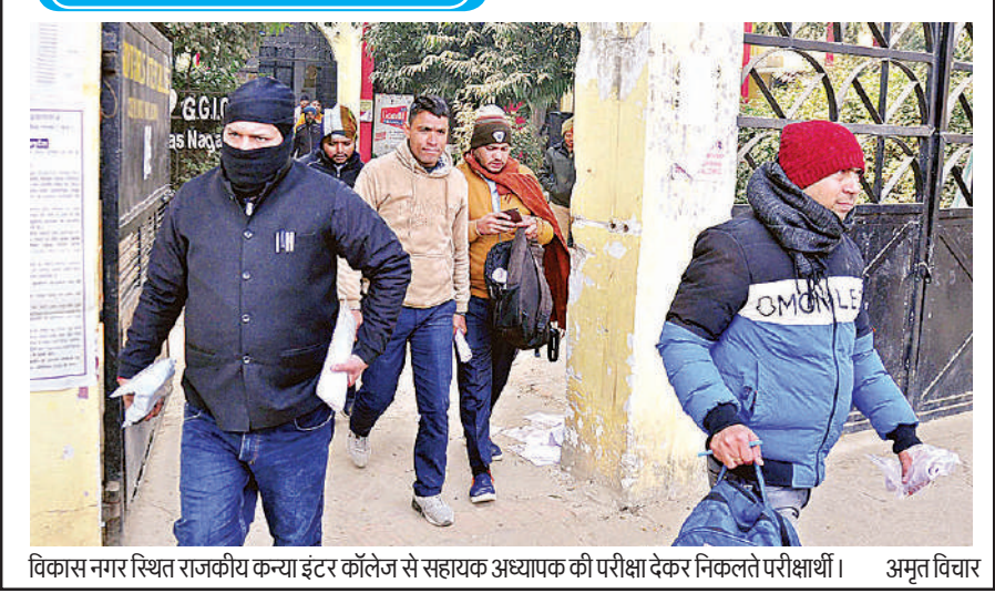
विकास नगर स्थित राजकीय कन्या इंटर कॉलेज से सहायक अध्यापक की परीक्षा देकर निकलते परीक्षार्थी। अमृत विचार

से ली। साथ ही विशाखा कमेटी की जांच रिपोर्ट भी अपने कब्जे में ले ली। साक्ष्यों से जुड़ी एक रिपोर्ट