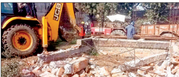
न्यायालय के आदेश पर अवैध कब्जे पर बलाई गई जेसीबी ।