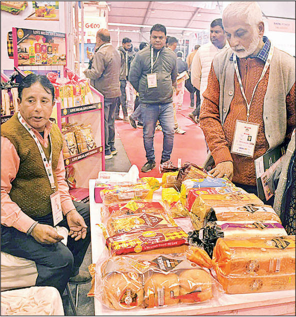
फूड एक्सपो में लगे स्टाल पर उत्पाद देखते लोग।