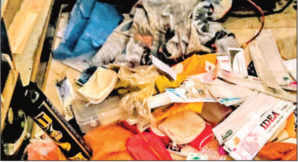
चोरी के बाद बिखरा पड़ा सामान।