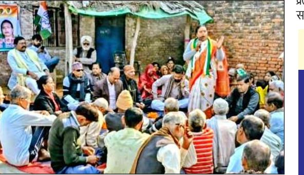
चौपाल में कार्यकर्ताओं को संबोधित करती कांग्रेस नेत्री।