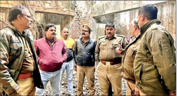
घटनास्थल पर जांच-पड़ताल करते पुलिस अधिकारी।