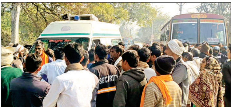
स्टेट हाईवे पर जाम के दौरान फंसी एंबुलेंस और रोडवेज बस ।