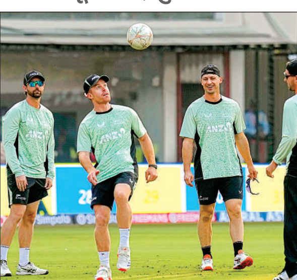
इंदौर में होल्कर स्टेडियम में अभ्यास सत्र के दौरान न्यूजीलैंड के खिलाड़ी।

अब तक घरेलू धरती पर वनडे में शानदार रिकार्ड रखने वाले भारत को न्यूजीलैंड के खिलाफ श्रृंखला जीतने के लिए रविवार को यहां होने वाले तीसरे और अंतिम एकदिवसीय अंतर्राष्ट्रीय क्रिकेट मैच में तीनों विभाग में अच्छा प्रदर्शन करना होगा। न्यूजीलैंड की टीम की निगाह भी श्रृंखला जीतकर इतिहास रचने पर होगी। तीन मैचों की श्रृंखला अभी 1-1 से बराबर है। मार्च 2019 के बाद से भारत ने अपने घरेलू मैदान पर कोई द्विपक्षीय वनडे श्रृंखला नहीं हारी है। तब ऑस्ट्रेलिया ने 0-2 से पिछड़ने के बाद वापसी करते हुए श्रृंखला 3-2 से जीती थी लेकिन अब यह रिकॉर्ड दांव पर लगा है। न्यूजीलैंड के लिए भी यह मैच काफी महत्वपूर्ण है। उसकी टीम