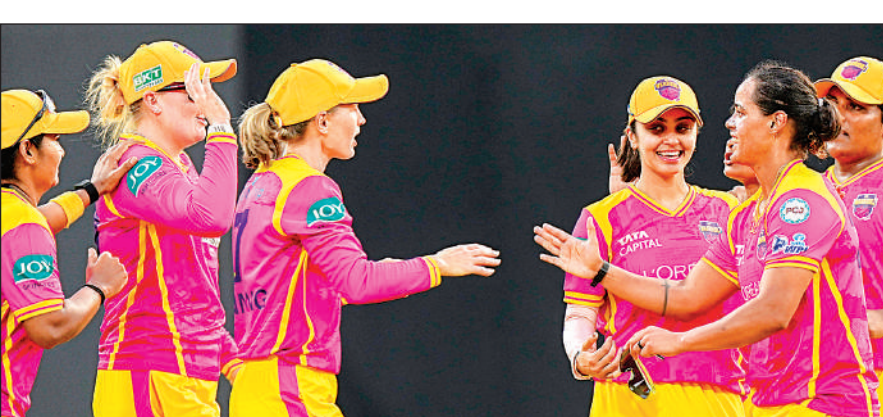
जीत का जश्न मनाती यूपी वॉरियर्स की खिलाड़ी।